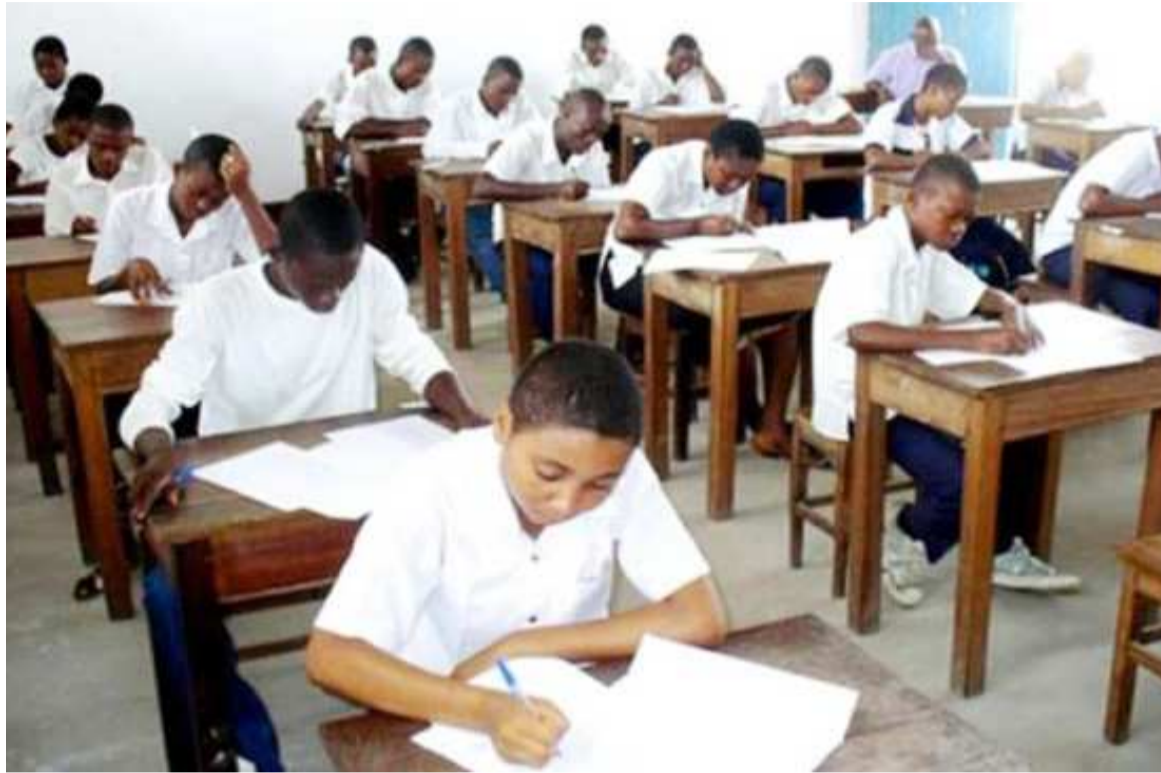
Des élèves en pleine session des examens

Pour la sixième période, la période des cours va du lundi 17 au samedi 29 août inclus. Soit treize jours des cours. L'évaluation du niveau de l'éveil des enfants est prévue du lundi 30 août au mardi 1er septembre inclus, soit deux jours des cours. La transmission des points dans les bulletins