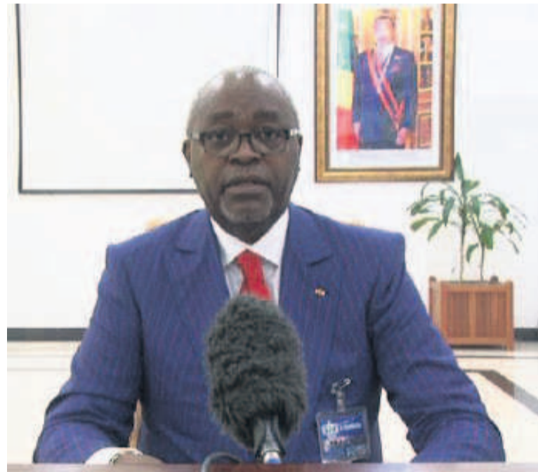
Le ministre Hugues Ngouélondélé prononçant son message

C'est dans un contexte particulier que sera célébrée le 26 juillet la journée nationale du sport. Dans son message, le ministre des Sports et de l'Education physique a donné la priorité à la santé.