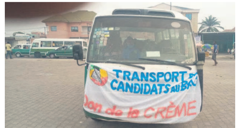
Une vue d'un bus transportant des candidats au BAC

La Crème des anciens étudiants de l'Université Marien-Ngouabi a mobilisé des bus de transport en commun pour permettre aux candidats au baccalauréat de Djiri, neuvième arrondissement, de se rendre aux différents centres d'examen.