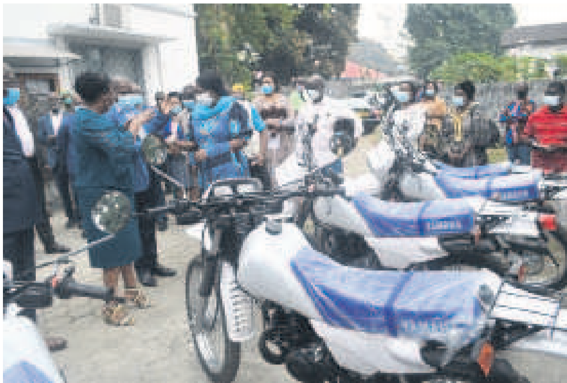
Un échantillon des motos

« Il est aussi du ressort de la Dgpop d'améliorer les indicateurs de couverture vaccinale. Pour la direction de la santé et de l'enfant, il faut mettre un accent particulier sur les activités