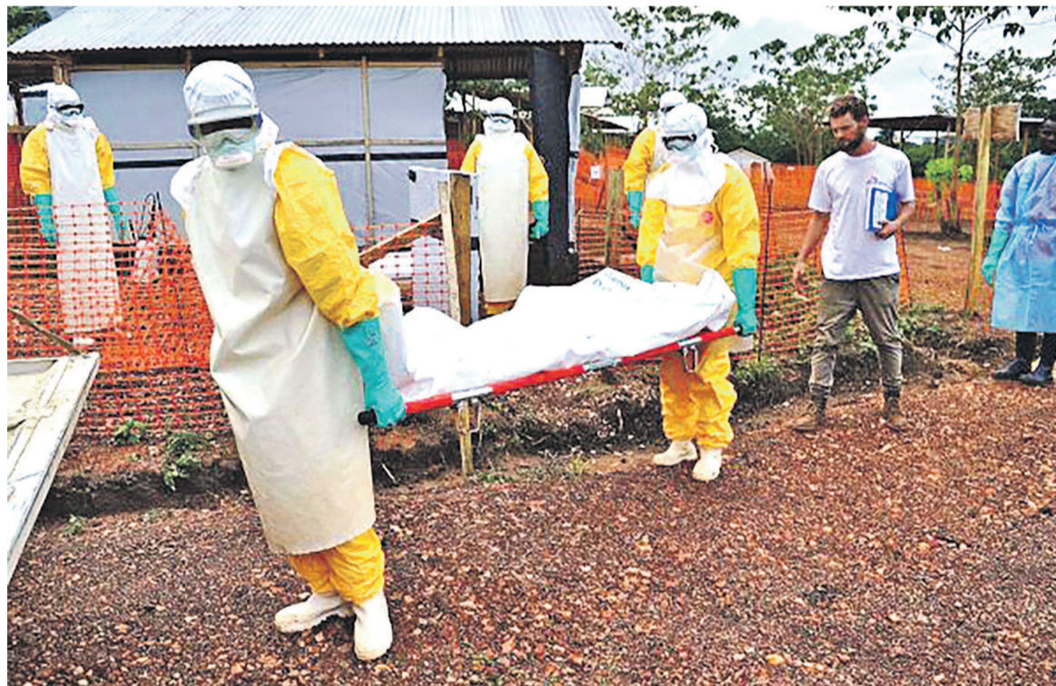
Une équipe sanitaire en formation sur Ebola à Kinshasa

Peu avant l'ouverture de cette formation, l'ambassadeur du Japon Shigeru Ushio a salué les efforts déployés par la RDC dans la lutte contre l'épidémie Ebola.