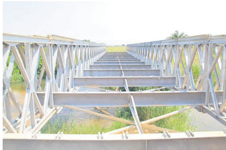
La construction des ouvrages de franchissement parmi les actions phares en 2016.

Outre les priorités fixées à ces deux premières directions, notamment celle des Travaux publics et de l'équipement, le Bureau de contrôle des bâtiments et des travaux publics va, pour sa part, poursuivre un certain nombre d'actions pour redyna-