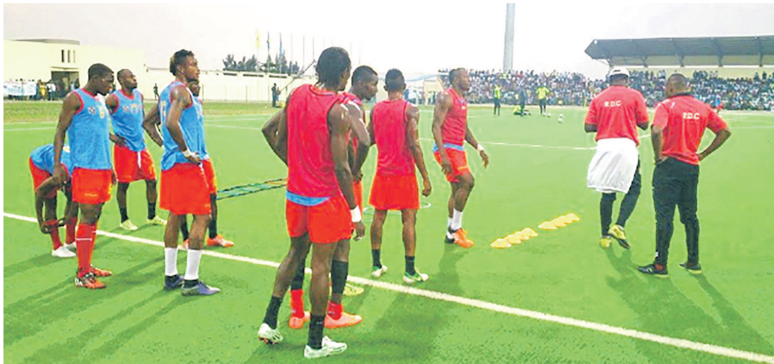
Les Léopards à Gisenyi