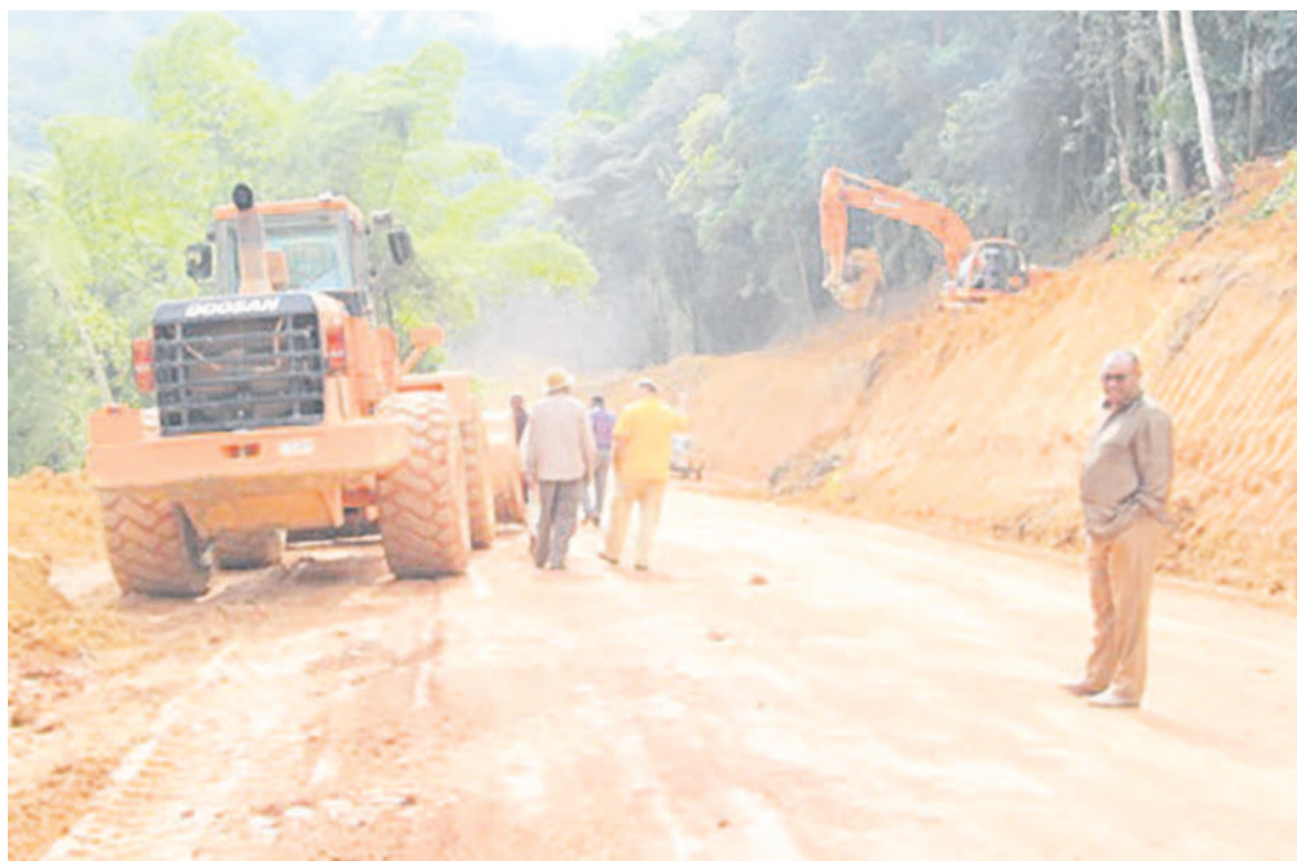
Aménagement d'une route inter-départementale dans le Niari