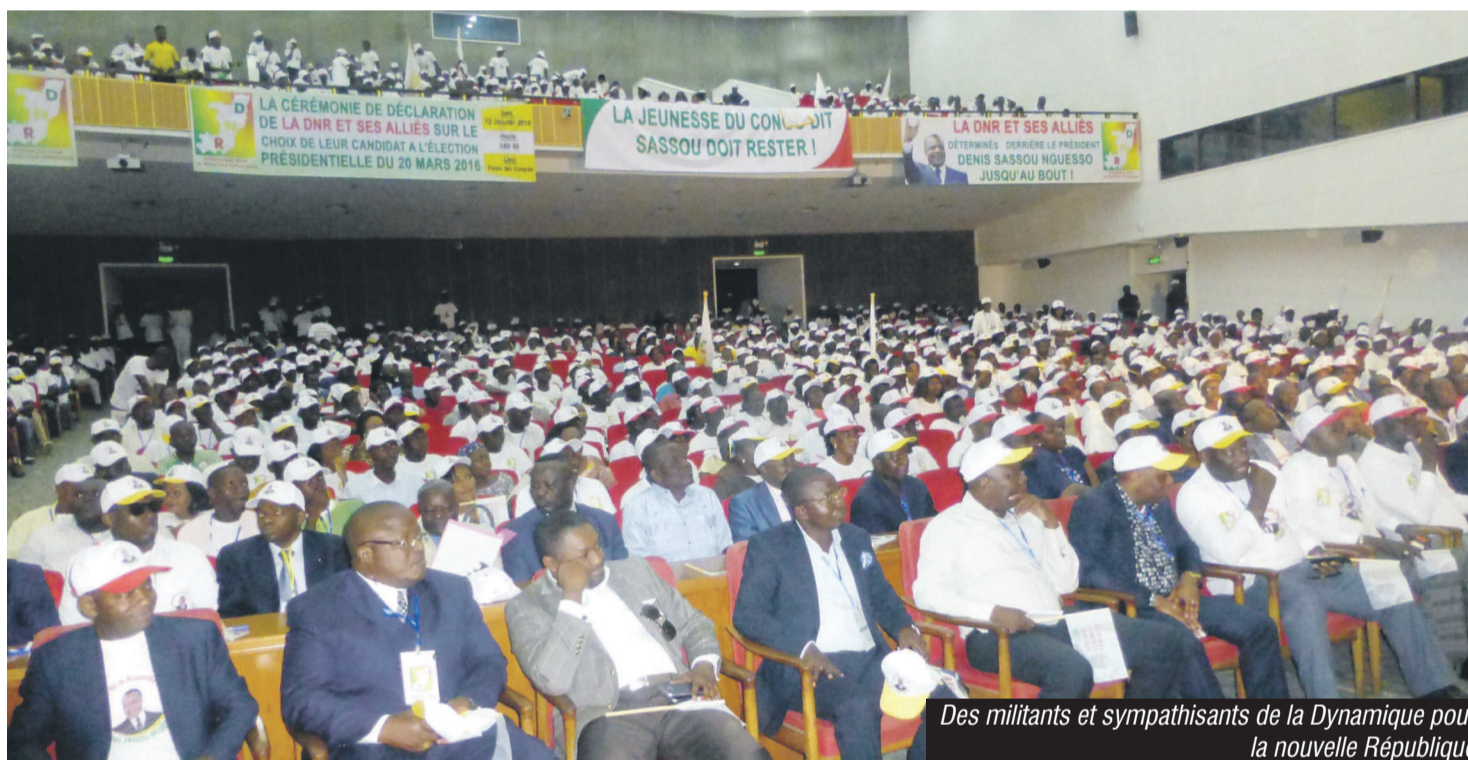
Des militants et sympathisants de la Dynamique pour la nouvelle République

Les habitants des districts d'Ongogni et d'Ollombo ont ajouté leurs voix aux nombreux Congolais qui ont, solennellement, invité le président de la République sortant à faire acte de candidature, dans la perspective de l'élection présidentielle du 20 mars prochain.