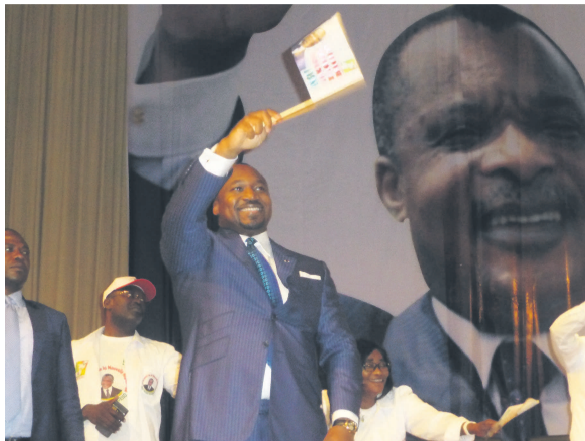
Denis Christel Sassou N'Guesso

L'orateur a salué, à cet effet, le fait que dans l'appel à candidature formulé par la DNR, il a été relevé les efforts multiformes que le président de la République Denis Sassou