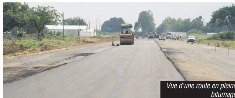
Vue d'une route en pleine bitumage

En dépit de la difficile situation économique et financière du pays, le ministère de l'Équipement et des travaux publics entend poursuivre, cette année, l'exécution de certains projets phares. À l'occasion de la séance d'échange des vœux hier, le ministre de tutelle, Emile Ouosso, a instruit ses administrés et les sociétés partenaires sur les différentes actions à mener au cours de cette année. « Notre action en 2016 portera essentiellement sur l'aménagement et le maintien de notre réseau routier. En d'autres termes, il s'agira de poursuivre l'exécution des projets en cours et assurer l'entretien des acquis routiers engrangés », a-t-il précisé en citant le démarrage du bitumage des routes d'intérêt sous-régional. Page 5