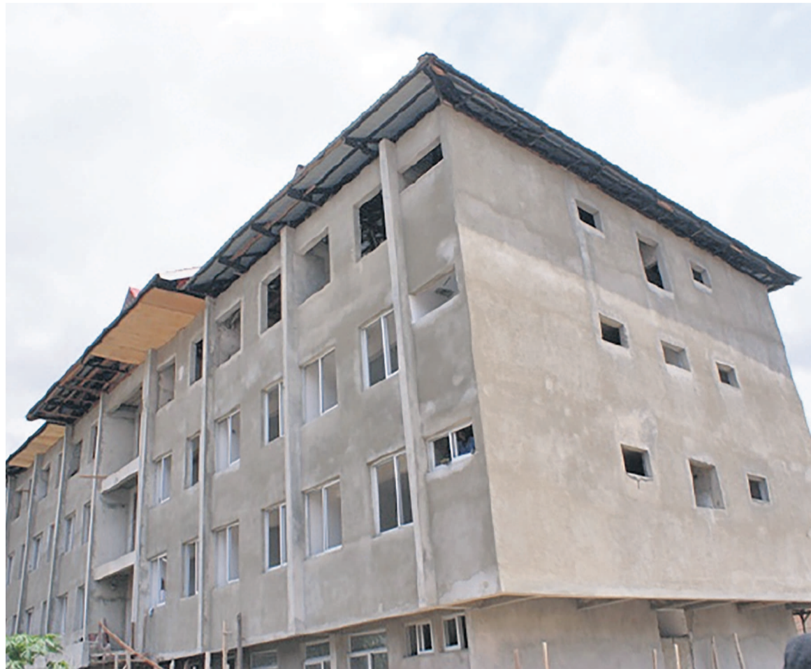
Un immeuble en construction à Kinshasa