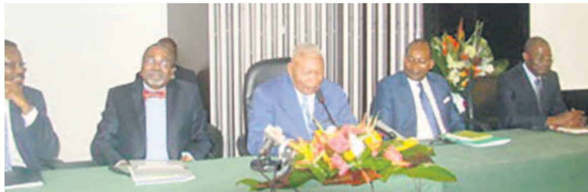
Le ministre Isidore Mvouba présidant l'atelier accompagné de ses collègues ministres

programmes établis grâce au soutien technique et matériel des partenaires tels que la Banque mondiale, la Banque africaine de développement,