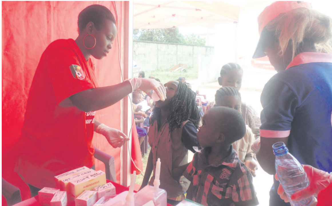
Les élèves prenant la dose du déparasitage

Une initiative encouragée par les responsables de cet établissement public qui ont souhaité sa pérennisation. « Nous remercions vivement la société Airtel, le premier réseau de téléphonie mobile du Congo. Etant donné que la santé est assez coûteuse au Congo, nous souhaitons que ce genre d'activités puisse se pérenniser car la performance scolaire d'un élève est relative à son état de santé », a indiqué la directrice