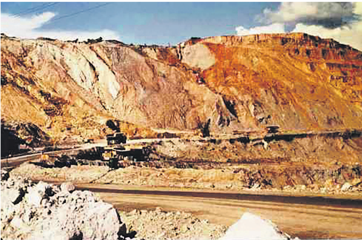
Un site minier de la société Mining Company

La nouvelle crise financière en vue vient éveiller une crainte bien légitime. L'économie congolaise résistera-t-elle à une nouvelle crise venant cette fois d'un partenaire de taille : la Chine ? (Ndlr : la première crise était provoquée par les subprimes américains. La crise a été minimisée en raison de la faible interconnexion entre les banques américaines et congolaises mais elle s'est muée en crise économique avec la baisse de la demande internationale en matières premières). Réagissant sur cette question, la BCC a fait une mise