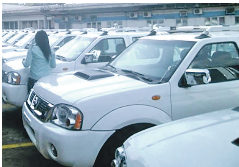
Les véhicules alignés à la concession Tractaftric