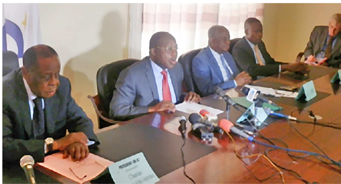
Les membres du G7 et le représentant de la Monusco

Le président en exercice du G7 a noté qu'aux termes de la Constitution, cette année est essentiellement électorale. Elle sera marquée, a-t-il souligné, du sceau historique de la première alternance démocratique à la présidence de la République car un nouveau chef de l'État devra être élu en novembre prochain, en remplacement de l'actuel qui ne peut plus briguer un troisième mandat présidentiel. Au cours