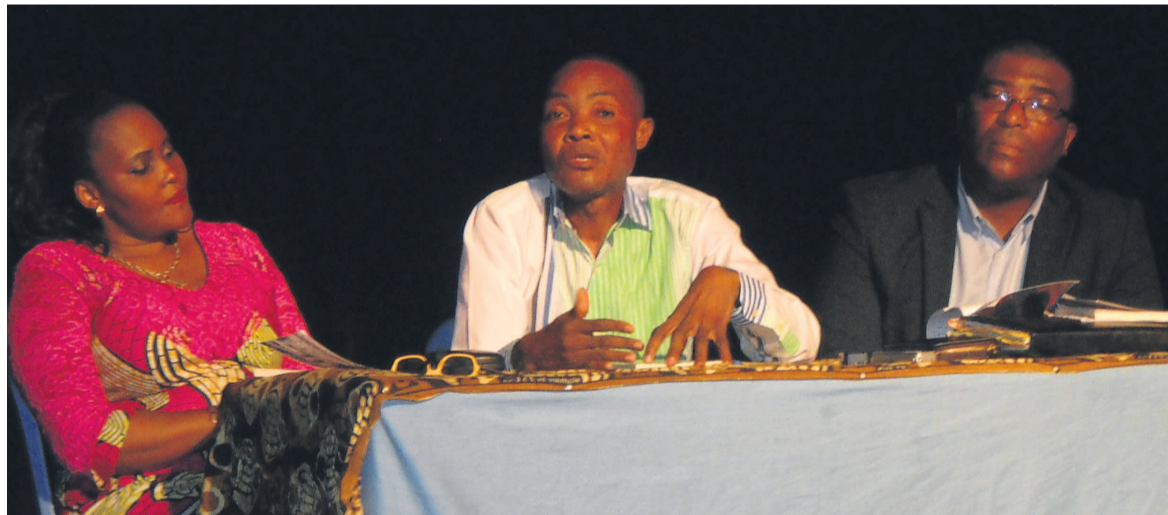
L'auteur explique son œuvre

mise de côté, surgit. L'auteur laisse le public dans une soif inédite. Ces investigations arrive-