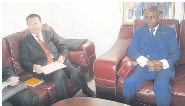
Xia Huang et Pierre Ngolo

« Comme vous le savez, il n'y a pas longtemps, le PCT a envoyé une mission d'études et de découvertes en Chine pour connaître et voir comment contribuer davantage au développement des relations d'amitié et de coopération entre les deux pays », a dit le diplomate chinois, avant d'ajouter, « la rencontre de tout à l'heure, a été également l'occasion pour recueillir les avis et les remarques du Parti congolais du travail, pour faire le point sur la manière dont le séjour a été organisé ». Xia Huang a