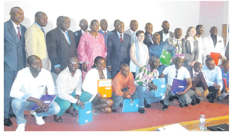
Photo de famille des responsables