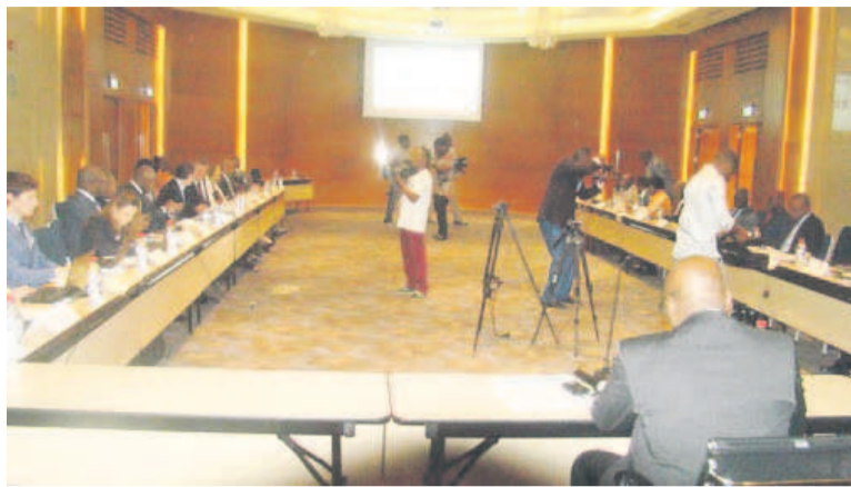
Les participants à l'issue des travaux de la 4 e réunion trimestrielle 2015

La moyenne des prix des hydrocarbures au Congo pour le premier trimestre 2016, est fixée à 39,2 dollars américains par baril pour un différentiel de -3,4 dollars par baril. Telle est la projection arrêtée par les dirigeants des sociétés pétrolières du Congo, à l'issue de la 4 e réunion trimestrielle 2015 des prix des hydrocarbures tenue à Brazzaville, du 14 au 15 janvier dernier.