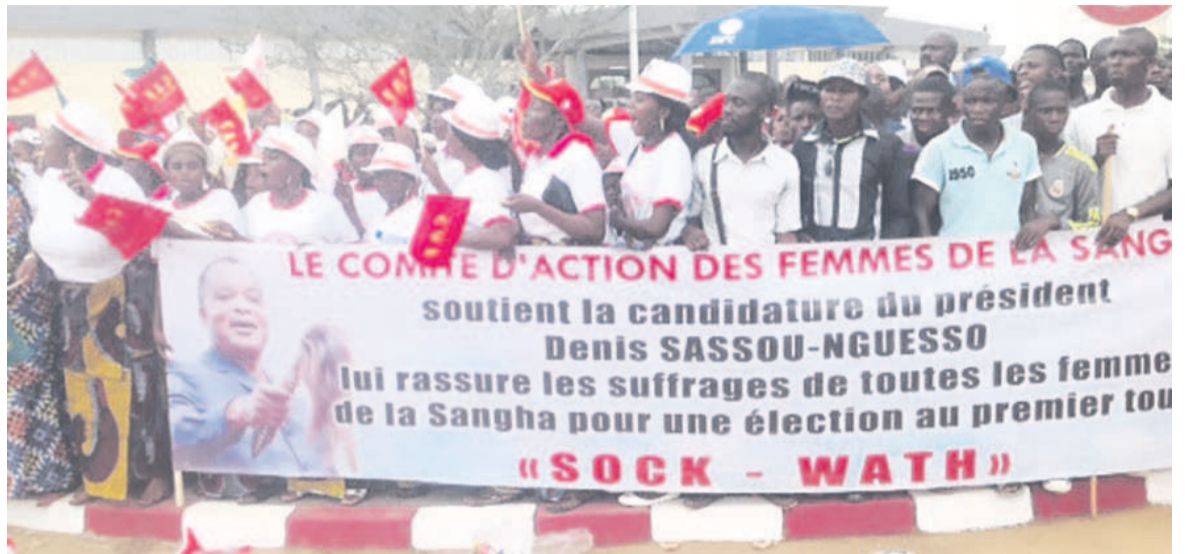
L'accueil du couple présidentiel à Ouesso, le 10 février.