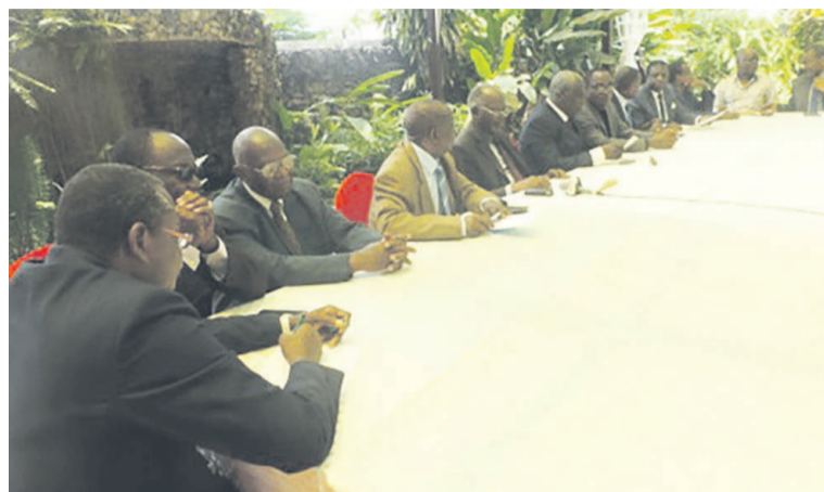
Une vue des membres du bureau de l'A.A.M.R

publique (A.A.M.R), que dirige Hebert Kakoula Kadi, a exhorté tous les acteurs politiques à favoriser un climat