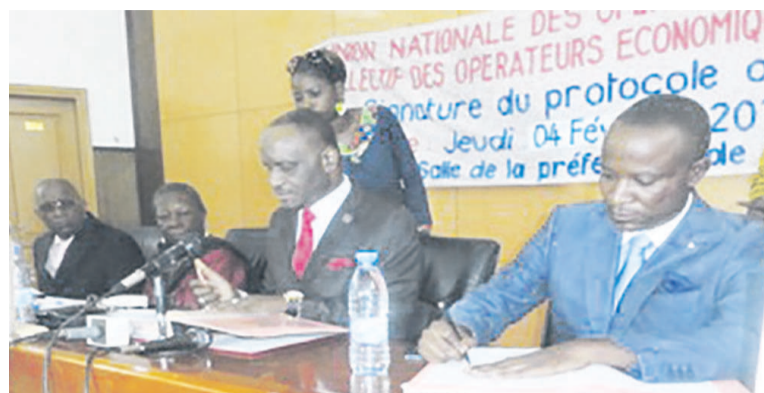
Les deux présidents signant le protocole d'accord

Au cours de cette assemblée générale, les opérateurs économiques ont réclamé à l'Etat le paiement de leur dette intérieure. Ils se sont indignés du fait du non traitement par le ministère des Finances de leurs dossiers. Près de 3621 marchés non signés moisissent dans les