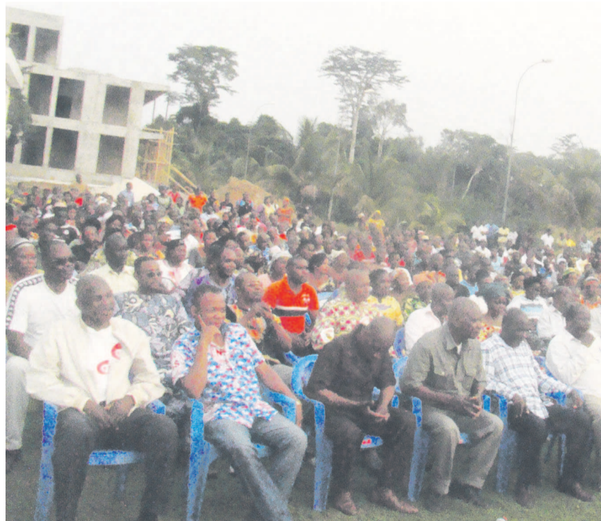
Les participants

tique du Parti congolais du travail (PCT), Gilbert Ondongo, des milliers de personnes se sont réunies à son domicile d'Owando pour des conseils éventuels au sujet de l'élection présidentielle à venir.