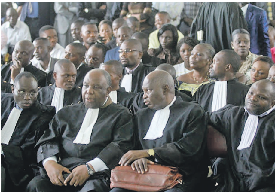
L'assistance à la prestation de serment des avocats stagiaires de barreau de la Gombe, en 2011, au Palais de justice