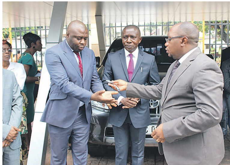
Le directeur du PNLs recevant les clés de la Jeep de mains du ministre de la Santé

Le ministre de la Santé publique a appelé les deux directeurs à faire bon usage de ces Jeeps parce que, fait-il savoir, le chef de l'État s'est engagé pour une génération sans sida et cela est un défi d'autant plus que la RDC a souscrit aux objectifs mondiaux de 2030, c'est-à-dire d'ici cette échéance, 90 % de personnes vivant avec le sida doivent connaître leur statut sérologique d'ici 2020 et 90 % de ces personnes qui connaissent leur statut doivent être mises sous traitement et 90% de ces personnes doivent avoir une charge virale indétectable dans le