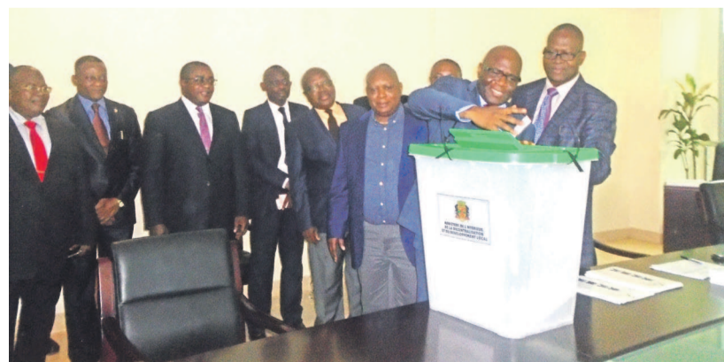
Le ministre Aimé Bininga supervisant le vote