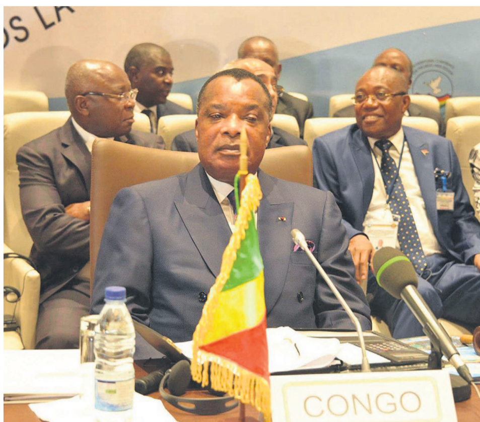
Le chef de l'état congolais lors des travaux de la COP 23