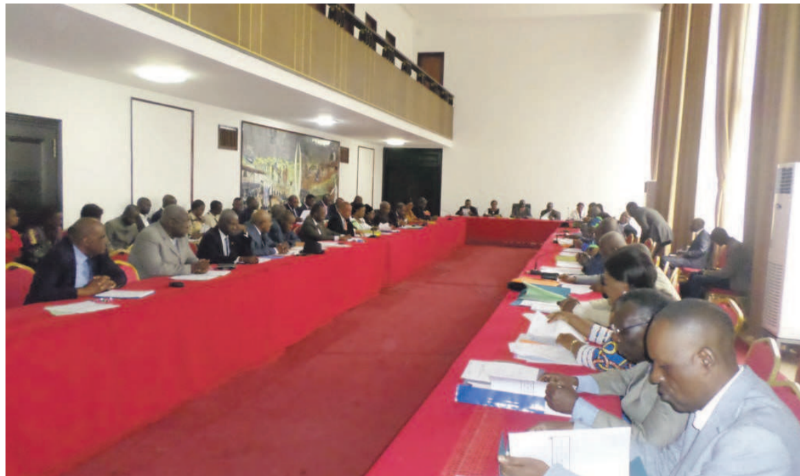
Les sénateurs du PCT et alliés

Les sénateurs membres du groupe sont en assemblée générale, les 16 et 17 novembre à Brazzaville, afin de donner à leur organisation un nouveau souffle pour la troisième législature.