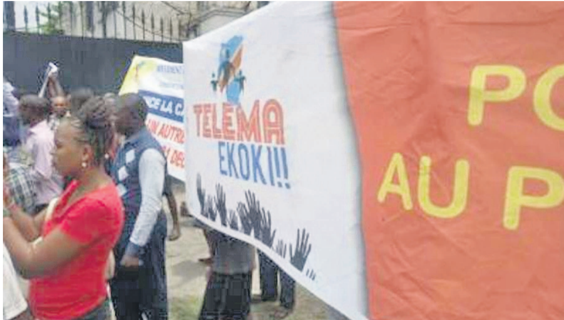
Des jeunes du Mouvement Telega Ekoki, devant l'ambassade des USA en RDC

« Plutôt que de travailler à interdire et perturber ces réunions, le gouvernement congolais pourrait travailler avec la société civile et les représentants de l'opposition pour s'assurer que ces événements se déroulent