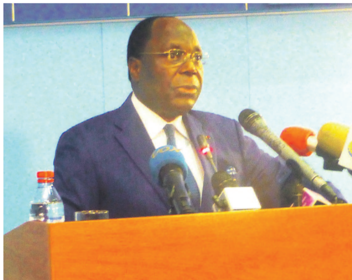
Le premier ministre Clément Mouamba

« Nous avons déjà décaissé deux enveloppes globales de 6 millions de dollars américains, soit trois millions de dollars comme aide alimentaire d'urgence et trois autres millions destinés à l'aide humanitaire », a indiqué en substance le diplomate chinois, précisant que la contribution de son pays sera officiellement dévoilée ce vendredi au cours d'une conférence de presse qu'il co-animera avec la ministre des Affaires sociales et de l'action humanitaire ainsi que des représentants résidents du PAM et du HCR au Congo.