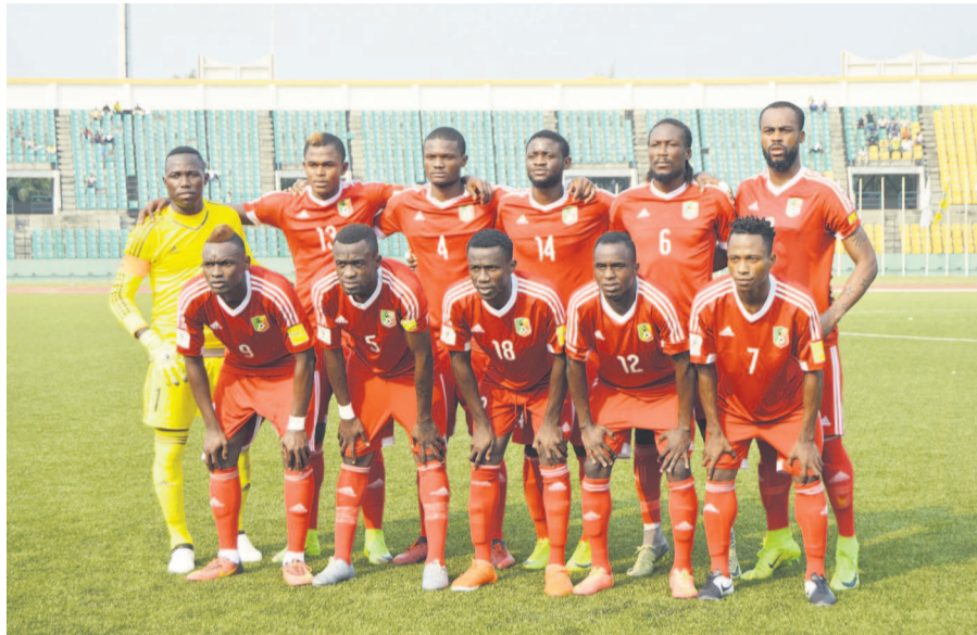
Les Diables rouges locaux disputeront leur deuxième phase finale du Chan après 2014

La procédure du tirage au sort est simple. Il se fait chapeau par chapeau. Les quatre chapeaux, rappelons-le, ont été constitués sur la base d'un classement établi en prenant compte des performances lors des dernières éditions du tournoi final de cette compétition réservée exclusivement aux sélections nationales, composées de joueurs évoluant dans les championnats nationaux de leurs pays respectifs. Le chapeau 1 ouvrira le tirage. Mais le Maroc, pays organisateur, est déjà assuré d'être tête