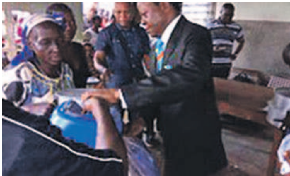
Distribution des articles ménagers

Les conditions de vie des déplacés du Kasai sont déplorables. Ils manquent de tout et sont à la merci des intempéries et autres épidémies.