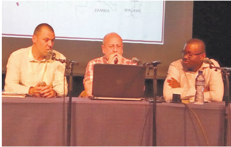
Les trois conférenciers exposant au Centre Wallonie-Bruxelles

B.C. : Oui, tout à fait ! Au début, en théorie, après avoir consulté toutes les archives, tous les documents scientifiques publiés sur le Royaume Kongo, nous avons fait une synthèse en 2011, il y avait beaucoup de choses à faire. En 2012, nous sommes partis sur le terrain dans l'optique de travailler sur les Mbanza, les agglomérations du Royaume Kongo et un cas où c'était une implantation économique qui n'était pas du tout une capitale provinciale, Ngongo Mbata. L'objectif c'était de faire des fouilles dans la capitale Mbanza Kongo, le chef-lieu provincial de la province de Soyo, en Angola, à Mbanza-Soyo et en RDC, travailler sur Mbanza-Nsundi, la capitale de la province Nsundi du Royaume Kongo et Ngongo Mbata, ce centre économique très important du XVI e au XVIII e siècle. Finalement, en 2012, nous n'avons pas pu débloquent des autorisations de recherche en Angola. C'est à ce moment-là que le projet s'est regroupé à cent pour cent sur la RDC et sur le sud de la République du Congo, dans la région cuprifère de Boko-Songo. Et là, par contre, nous avons pu suivre le programme préétabli, limité à la RDC. C'est ce qui nous a permis de faire de très grandes fouilles qui n'ont pas du tout d'équivalent pour toute l'Afrique centrale. Mbanza-Nsundi d'un