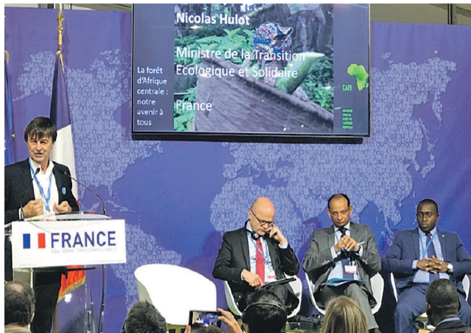
Le ministre français de l'Environnement, Nicolas Hulot, hôte de l'événement

Cette déclaration a été démentie par le ministre congolais de l'Environnement. En effet, Amy Ambatobe a déclaré, lors de cette rencontre, qu'il n'y aura pas de levée du moratoire sur les concessions forestières jusqu'à ce que toutes les conditions du