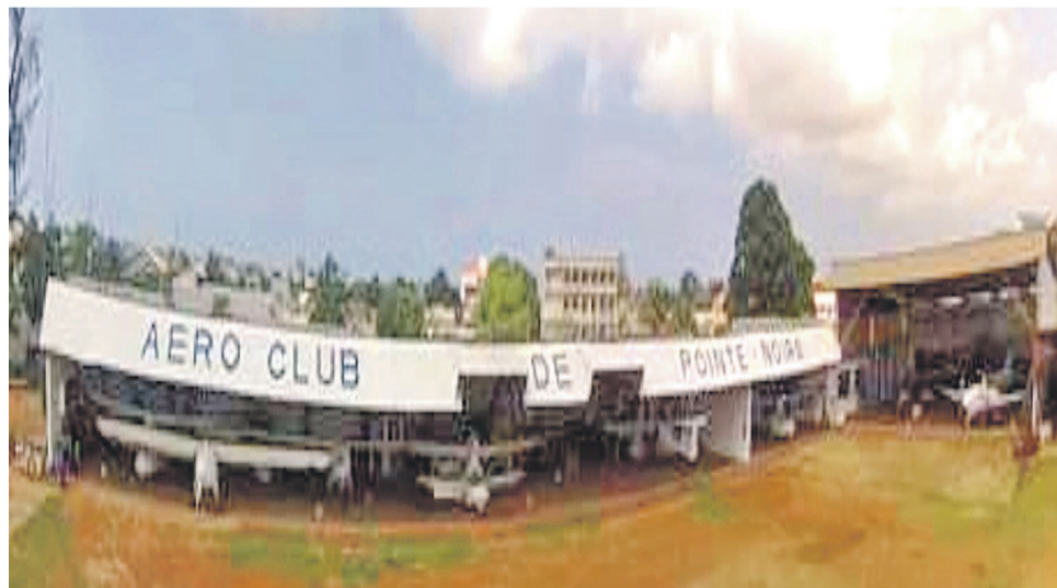
Une vue de l'Aéro-club de Pointe-Noire

Pour mieux faire connaître ses activités le club aéronautique de la ville capitale organise des journées portes ouvertes les 18 et 19 novembre. L'événement, qui se tient chaque année, donne la possibilité aux Ponténégrins qui le désirent de recevoir leur baptême de l'air en survolant la ville et le département du Kouilou jusqu'aux