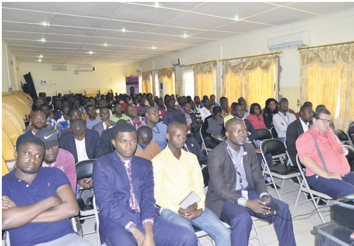
Une vue de jeunes entrepreneurs et représentants de l'administration publique