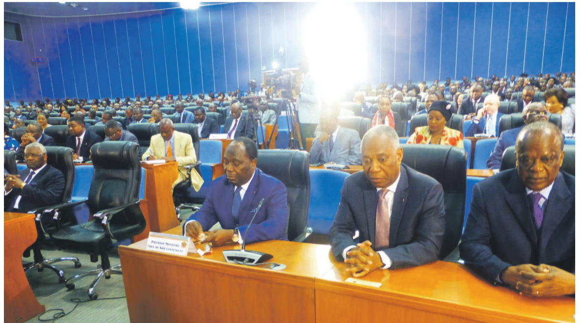
Des membres du gouvernement

Le champ social, a-t-il rappelé, comporte de nombreuses actions initiées par le gouvernement et qui continueront d'être mis en œuvre dans les domaines de la protection de la femme, y compris la veuve, de l'enfant, de