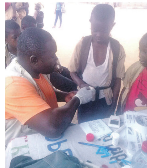
Un enfant se faisant dépister lors de la journée mondiale du diabète

À l'occasion de la journée mondiale du diabète, l'ONG R. Panabec et la clinique Human Association ont initié l'opération de lutte contre le diabète en milieu communautaire, le 14 novembre, à proximité du lycée de Mpaka situé dans le 6e arrondissement Ngoyo à Pointe-Noire, avec pour population cible les enfants âgés de 0 à 13 ans.