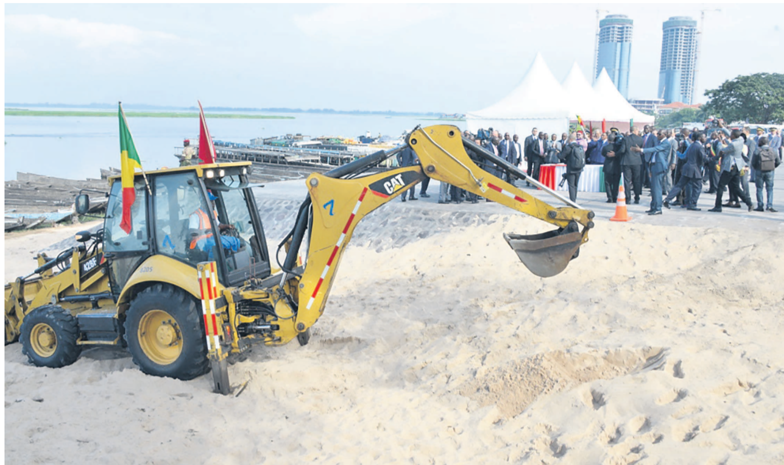
Lancement du chantier

Projet à caractère socio-économique, il devra participer, à