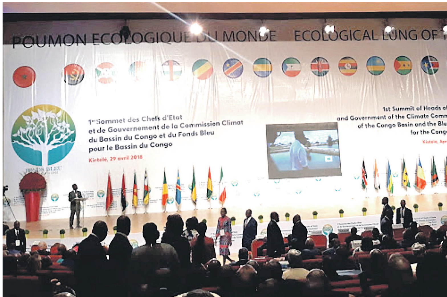
Le décor du sommet de Brazzaville

La RDC devrait piloter cette affaire Pour José Makila, quand on parle Bassin du Congo, c'est d'abord la RDC qui renfermerait les 90 % des forêts et 90 % des eaux.