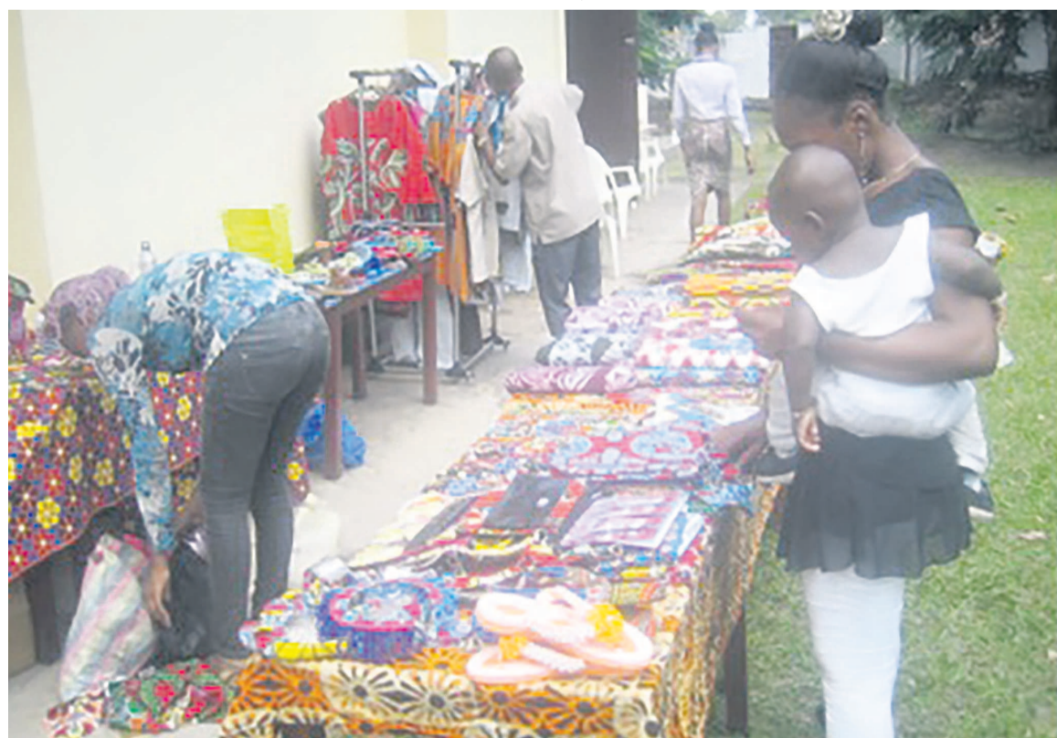
Quelques articles exposés