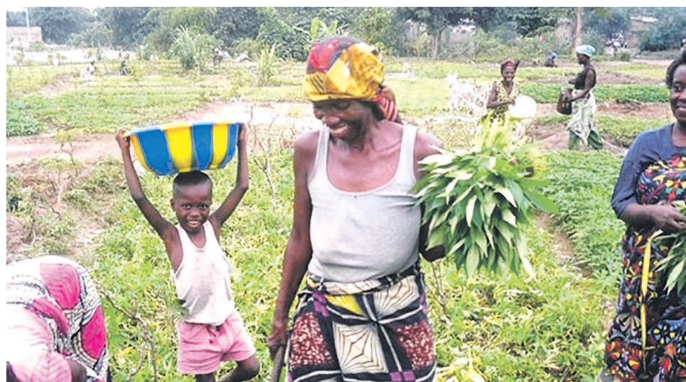
Les maraîchères militent pour leur autonomisation

A en croire le PAM, dans les zones post-conflits, les personnes qui y retournent font face à des difficultés énormes pour leur réintégration. « Une pénurie de res-