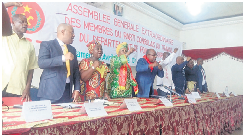
La tribune officielle bannissant les antivaleurs