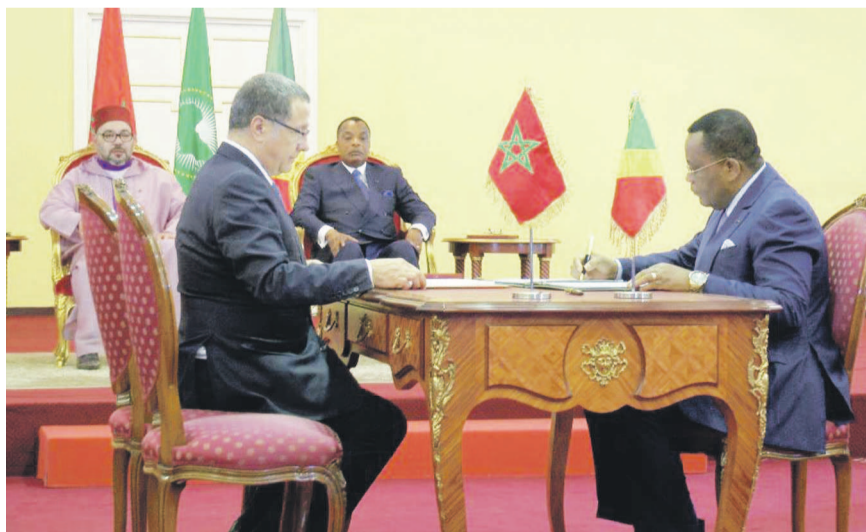
Le Congo et le Maroc signent quatorze accords de coopération

Ces accords portent, entre autres, sur le partenariat entre l'hôpital Cheikh-Zaïd, hôpital universitaire international, et le Centre hospitalier et universitaire de Brazzaville ; une convention-cadre de coopération entre l'Office de la formation professionnelle et de la promotion du travail et l'Agence marocaine de la coopération internationale et le ministère de