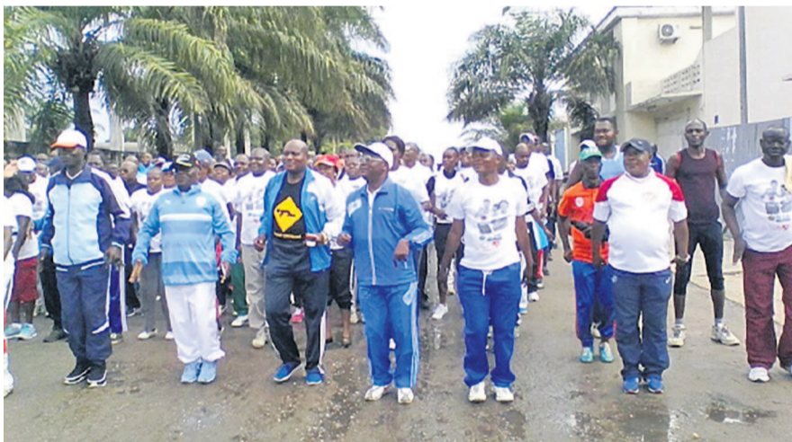
Les travailleurs pendant la marche «Adiac»

La Ligue départementale de sport du travail de Pointe-Noire a mobilisé, le 29 avril, les hommes et les femmes pour la deuxième édition de l'activité initiée par l'Organisation du sport de travail en Afrique (Osta).