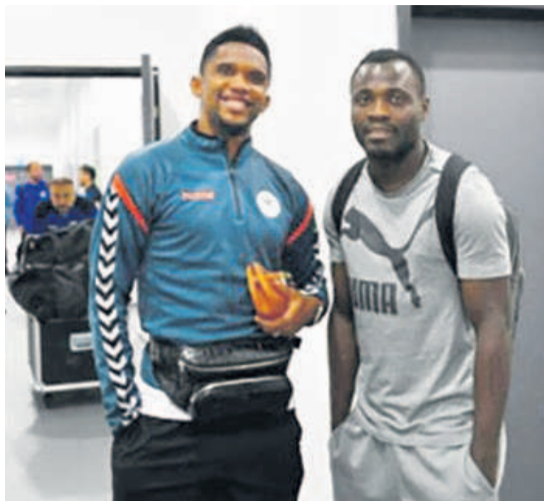
Dzon Delarge et Samuel Eto'o à l'issue du succès de Bursaspor face à Konyaspor