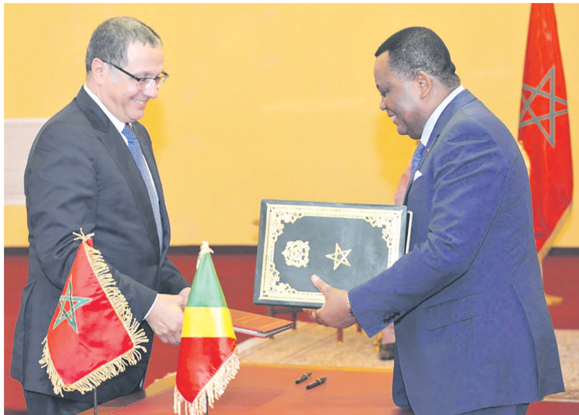
L'échange des parapheurs entre les deux parties

Les deux pays ont signé, le 30 avril à Brazzaville, en marge de la visite de sa majesté le roi Mohammed VI, une série d'accords qui redynamisent davantage leurs relations d'amitié et de solidarité.