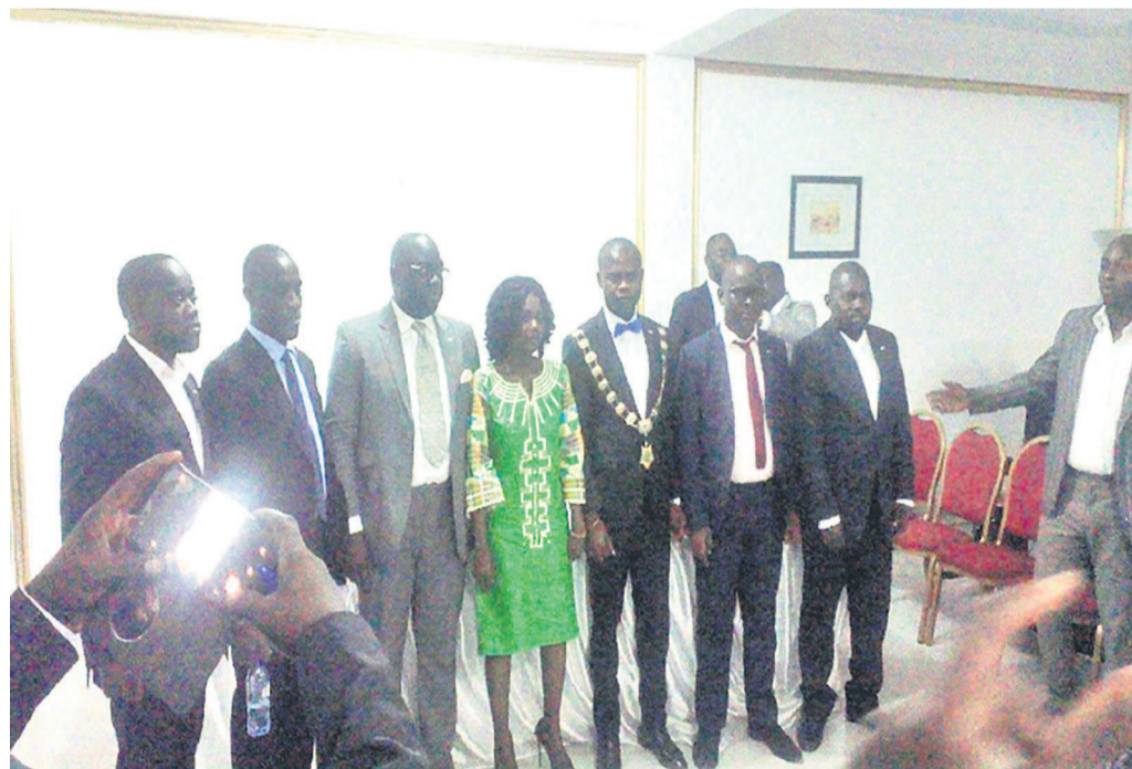
Les membres de la JCI

Le deuxième conseil national de la Jeune chambre internationale (JCI) a eu lieu à Pointe-Noire grâce à l'assemblée générale qui a réuni, le 28 avril, les membres de cette organisation internationale.