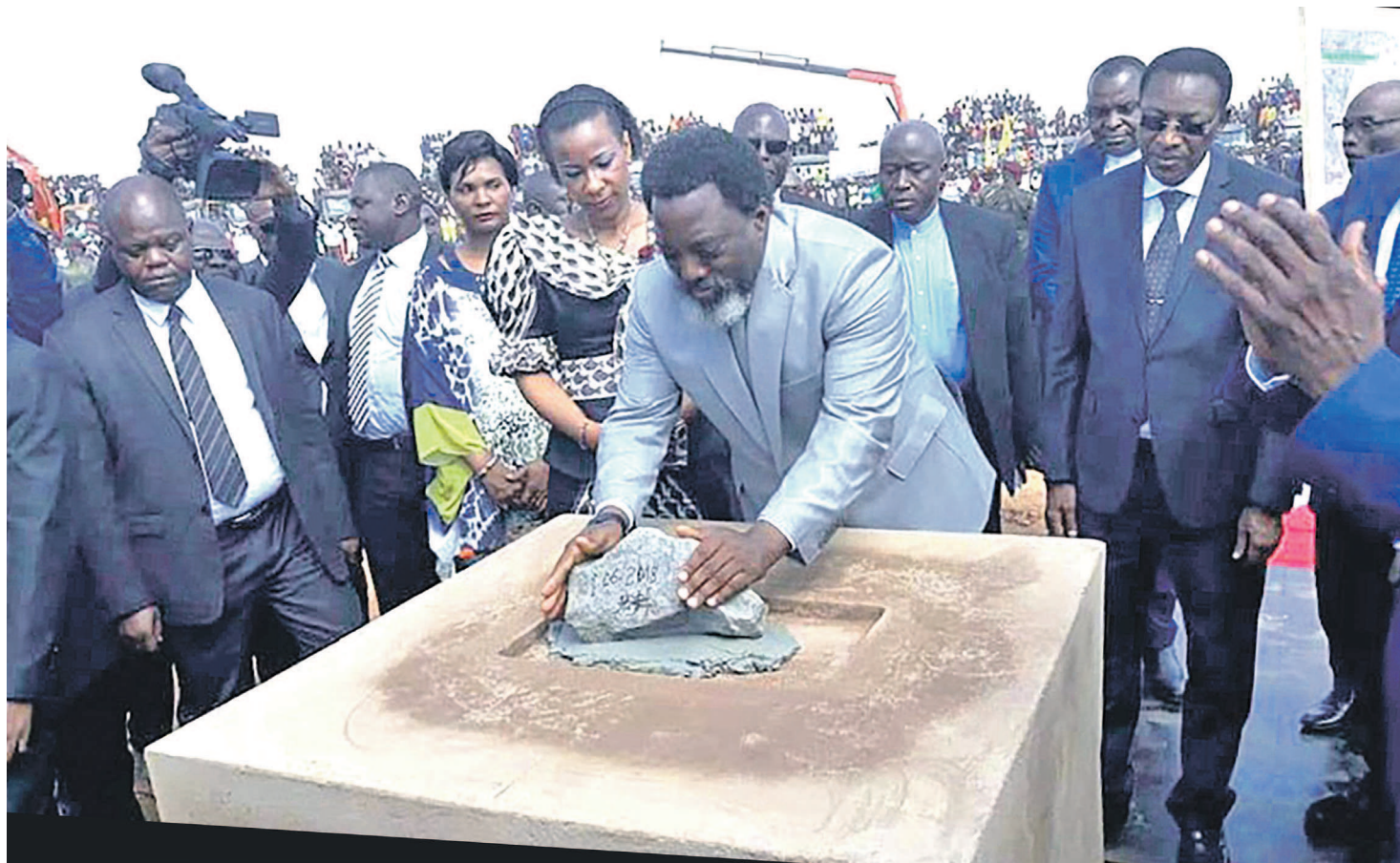
Joseph Kabila posant la première pierre