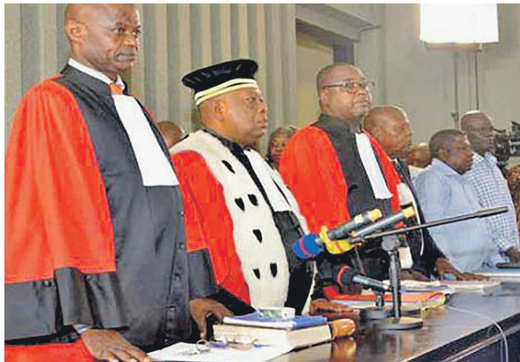
Des membres de la cour criminelle

Principal accusé dans une affaire d'atteinte à la sûreté intérieure de l'Etat, détention illégale d'armes et munitions de guerre, l'ancien ministre de la Justice et jusqu'ici président de la Commission nationale des droits humains, Jean-Martin Mbemba, et deux de ses proches, ont été condamnés par contumace à dix ans de détention cri-