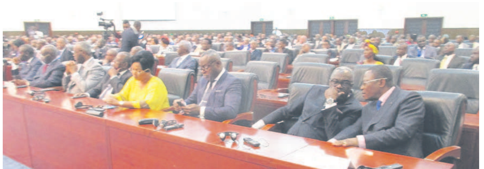
Des participants

Les dossiers sur la paix et la sécurité en République démocratique du Congo et en Centrafrique ainsi que la situation sécuritaire dans le département du Pool, en République du Congo, ont nourri les discussions de cette rencontre. La persistance des violences liées aux processus électoraux, la lutte contre les violences armées et le terrorisme en Afrique centrale, y compris la situation humanitaire causée par le groupe terroriste Boko Haram dans le bassin du lac Tchad ont fait l'objet