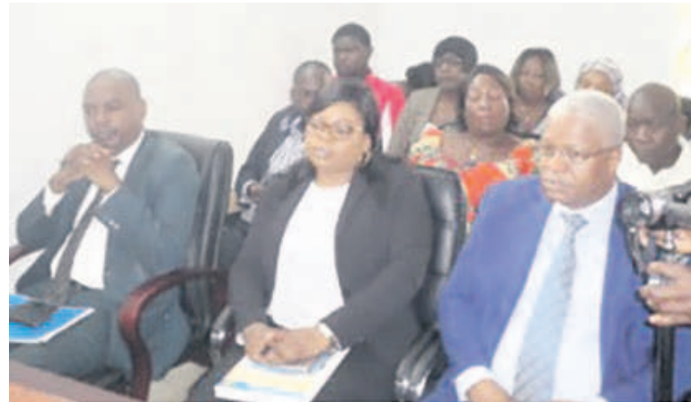
Une vue des cadres et agents du FNCAdiac

En effet, le FNC se doit, selon ses prérogatives, de financer les travaux de l'Agence foncière pour l'aménagement des terrains