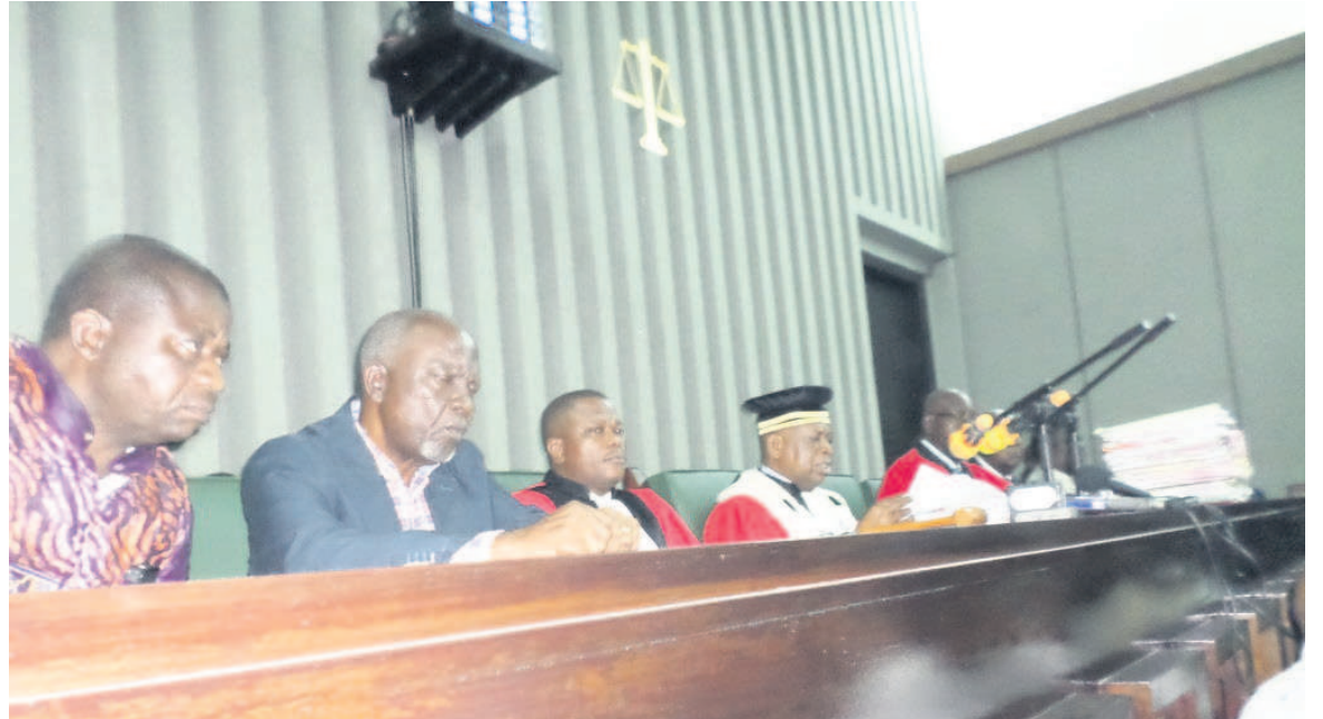
La Cour lors de son délibéré