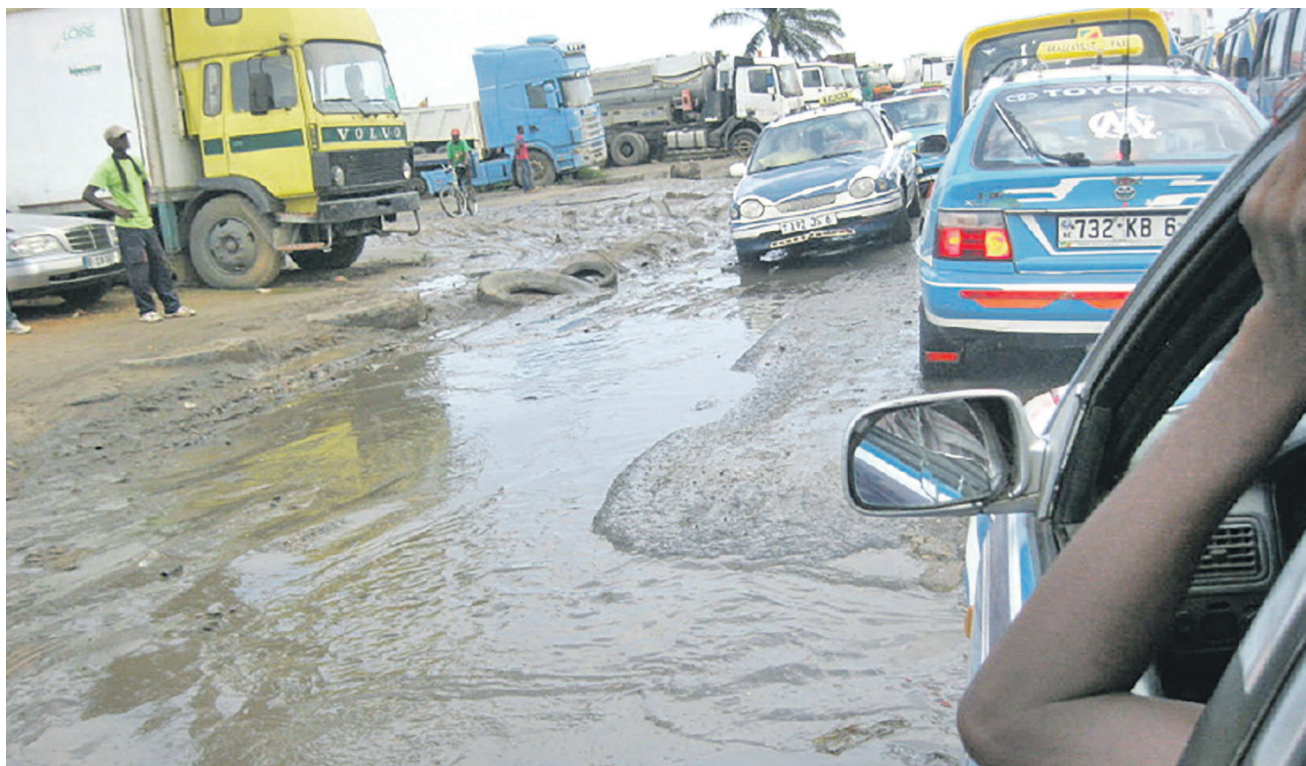
L'avenue Marien-Ngouabi transformée en bourbier entre l'arrêt de bus 501 et la station service X Oil

Chaussées non entretenues, nids-de-poule, absence de marquage au sol, etc..., le réseau routier de la ville de Pointe-Noire s'est progressivement dégradé, mettant mal à l'aise la population qui ne cesse de se plaindre.