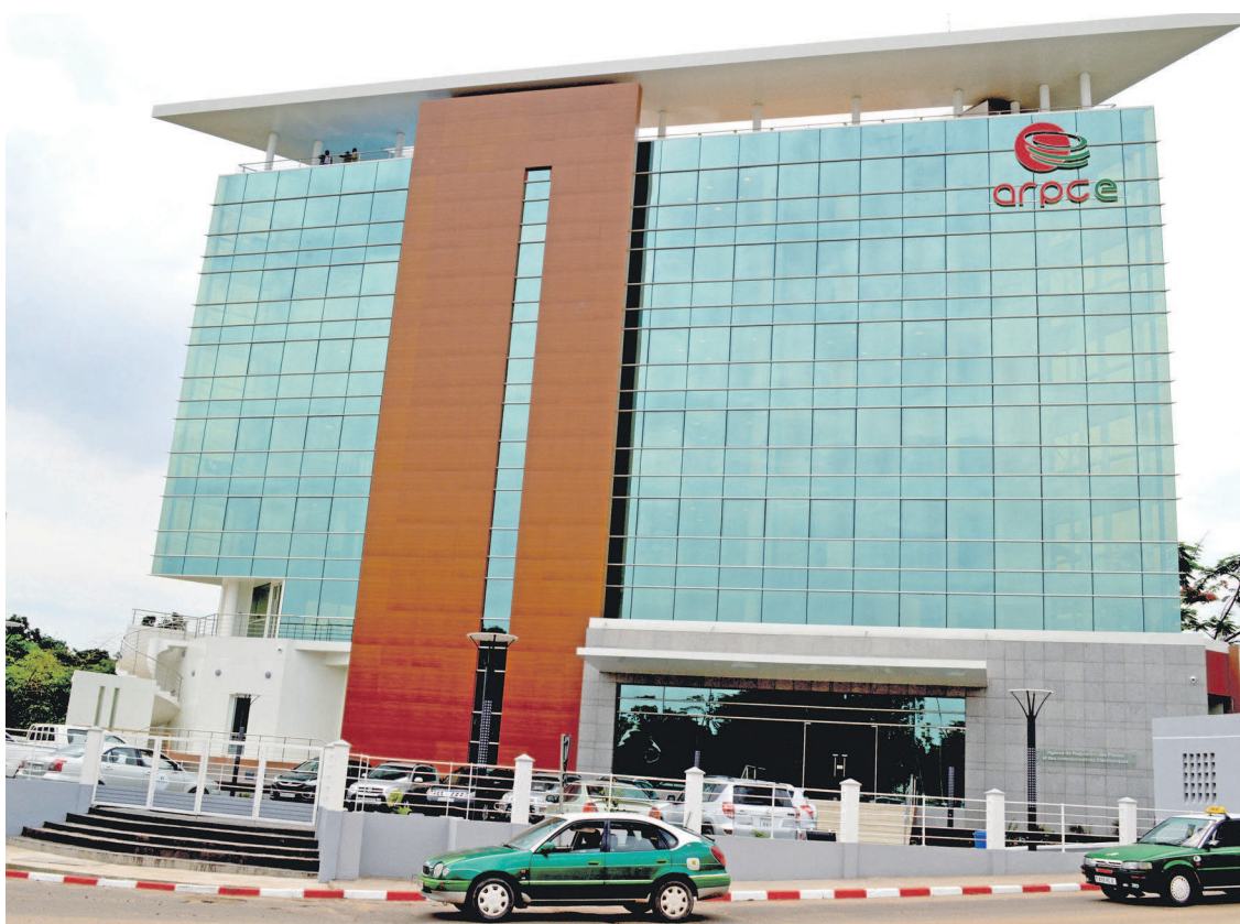
Le siège de l'ARPCE à Brazzaville