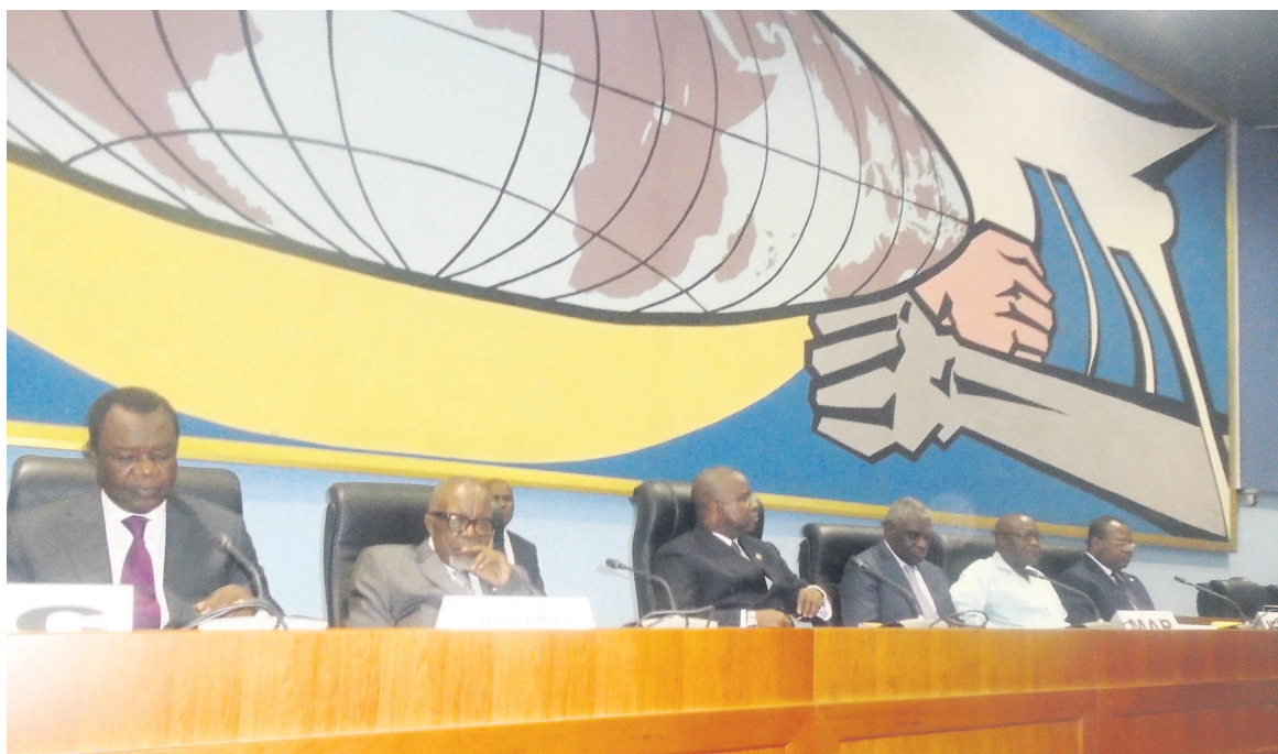
Des responsables du Pôle de consensus de Sibiti lors de la réunion

ment politique appelle de tous ses vœux le gouvernement, au plus haut niveau, à imposer son autorité, en traquant sans complaisance les auteurs afin qu'ils soient punis à juste titre. « Le Pôle de consensus de Sibiti s'associe au président de la République pour lutter énergiquement contre la corruption, la concussion, le vol, le pillage des ressources nationales et demande des sanctions exemplaires à l'encontre des auteurs », relève le communiqué final publié à l'issue de cette réunion.