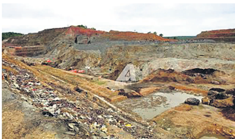
Un site minier

La stratégie globale de la banque est ainsi de consolider ses liens avec les différents acteurs du monde minier tant en RDC que dans le reste de la région et du monde. Au fil des années, DRC Mining week s'est hissé justement au rang d'événement minier de l'année dans le pays. Cette rencontre draine de plus en plus de dirigeants et décideurs du continent africain, attirés par les opportunités de networking professionnel dans le secteur minier et l'ensemble de l'écosystème dans lequel opère une banque. Avec la reprise des activités minières d'envergure nationale et régionale sur l'étendue du territoire national, le secteur bancaire commence à mieux cerner les enjeux et défis qui se posent dans le secteur. Il bénéficie directement de l'expertise minière des grands groupes qui y opèrent. « Nous venons avec différentes offres de financements qui permettent à nos clients de la région de déve-