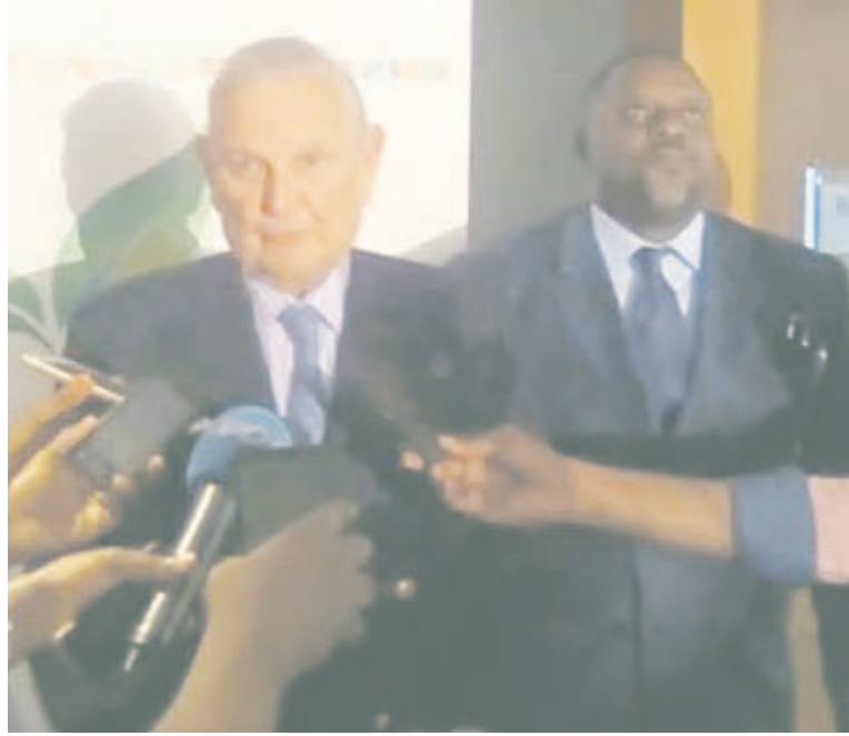
Le ministre d'Etat belge s'exprimant à la presse

vegarde de l'environnement ; la sauvegarde des forêts, de la biodiversité dans les forêts du Bassin du Congo. C'est non seulement l'intérêt de la région, c'est