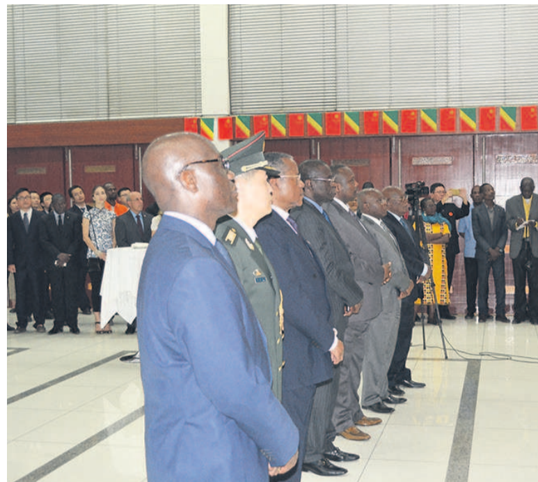
Une vue des autorités congolaises

A Brazzaville, l'ambassadeur Ma Fulin a organisé, le 26 juillet, une cérémonie commémorative au cours de laquelle il a salué les grandes réussites de l'Armée populaire de libération depuis sa naissance, le 1 er août 1927, jusqu'à ce jour.