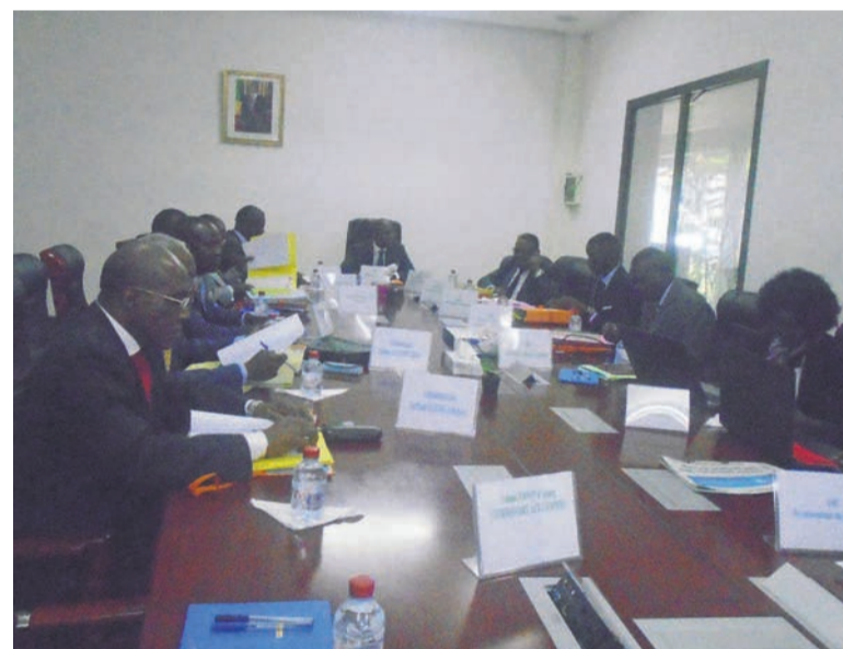
Les membres du conseil d'administration

En dépit de l'environnement économique morose, la société des Assurances et réassurances du Congo (ARC) a réalisé, courant 2017, un chiffre d'affaires de 1,4 milliard FCFA.