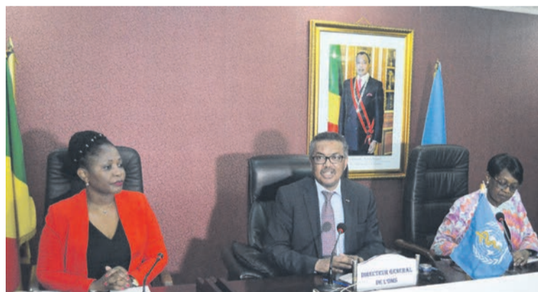
Le directeur général de l'OMS (au centre) lors de sa conférence de presse

Le Dr Tedros Adhanom Ghebreyesus a indiqué, au cours d'une conférence de presse, le 27 juillet à Brazzaville, que l'agence onusienne qu'il dirige aidera le pays à renforcer son système sanitaire allant des soins de santé primaires à la couverture médicale universelle.