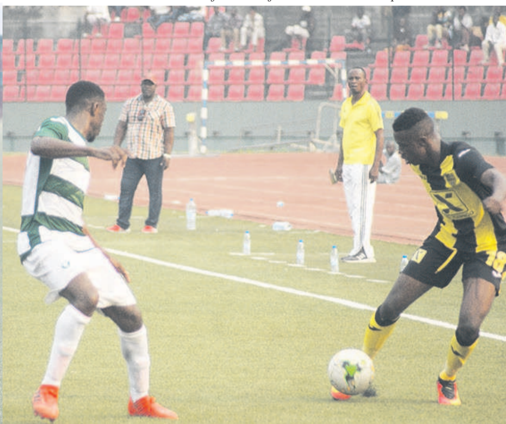
Les Diabes noirs décidés à se qualifier pour la phase finale

Les deux formations partent avec un avantage avant de se déplacer sur le terrain de leurs adversaires respectifs, le 5 août. Les Diabes noirs qui restaient sur une brillante victoire de 6-0 sur les Fauves du Niari ont eu droit à un match compliqué. Ils ont été même dominés dans le jeu et heureusement pour eux, les attaquants de l'AC Léopards ont brillé par le manque de réalisme. Ce genre de rencontre ne se joue que sur un