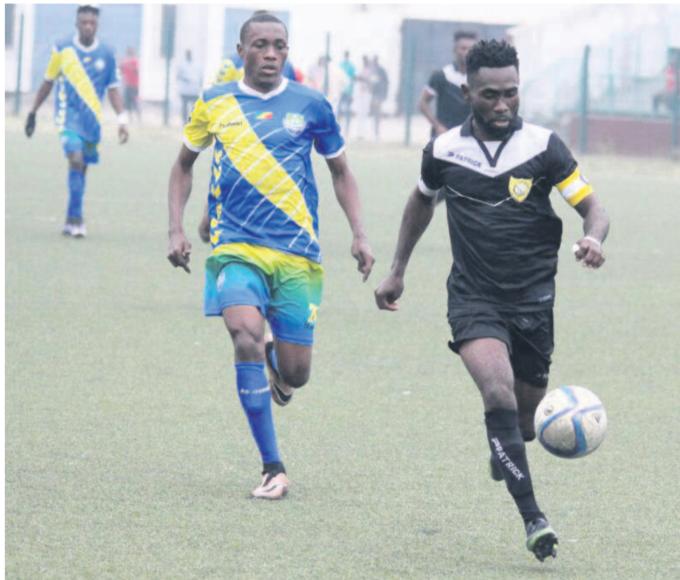
La Mancha a deux buts d'avance à gérophoto Kwamy

vainqueur de la Coupe du Congo », a-t-il laissé entendre. Au Complexe sportif de Pointe-Noire, La Mancha a pris le meilleur sur l'AS