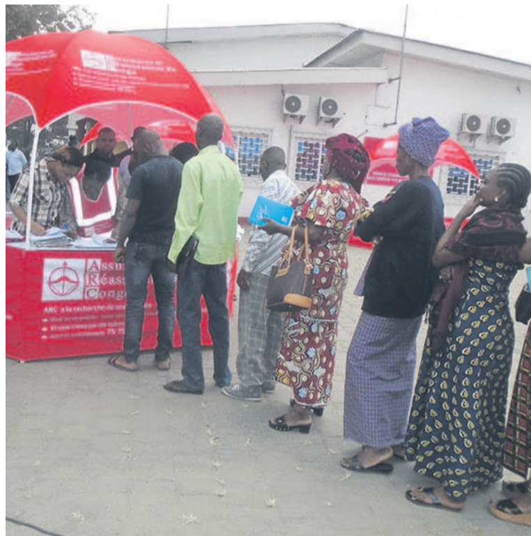
Une colonne de sinistrés, assurés de l'ARC, en attente de recevoir leurs chèques

Après avoir amorcé l'opération par le deuxième arrondissement de Brazzaville, Baongo, la société des Assurances et réassurance du Congo (ARC) s'est déployée, depuis le 26 juillet, dans le cinquième arrondissement, où soixante et une personnes victimes d'accidents de circulation ont commencé à percevoir leurs indemnités.