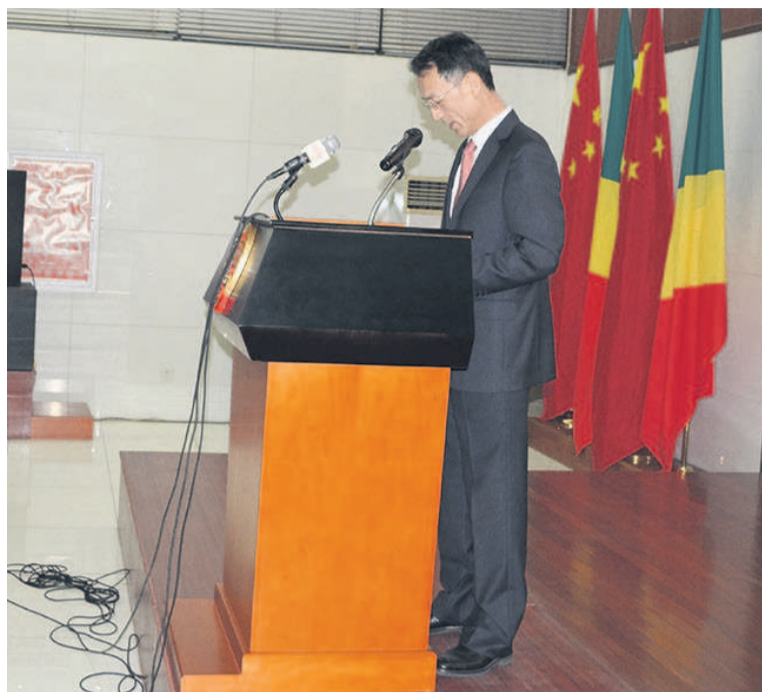
Ma Fulin délivrant son message

taires pour le maintien de la paix parmi les cinq pays membres permanents du Conseil de sécurité et le deuxième pays contributeur au budget de l'ONU sur le maintien de