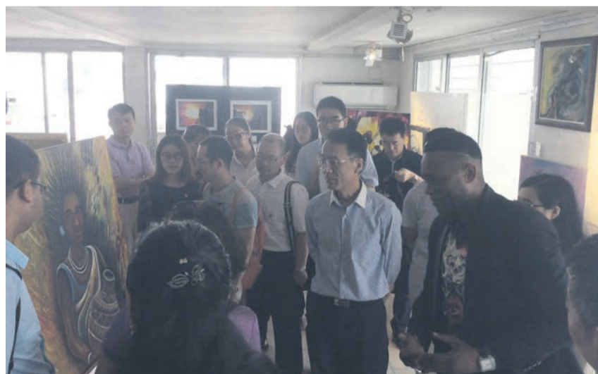
L'ambassadeur de Chine admirant les oeuvres d'art

En compagnie d'une forte délégation composée, entre autres, de l'équipe médicale de son pays en République du Congo, l'ambassadeur de Chine, Ma Fulin, a visité samedi le Musée galerie du Bassin du Congo qu'il a qualifié « de haut lieu d'une brillante civilisation qui reflète la vie et l'histoire de toutes les ethnies de cette sous-région ». Page 9