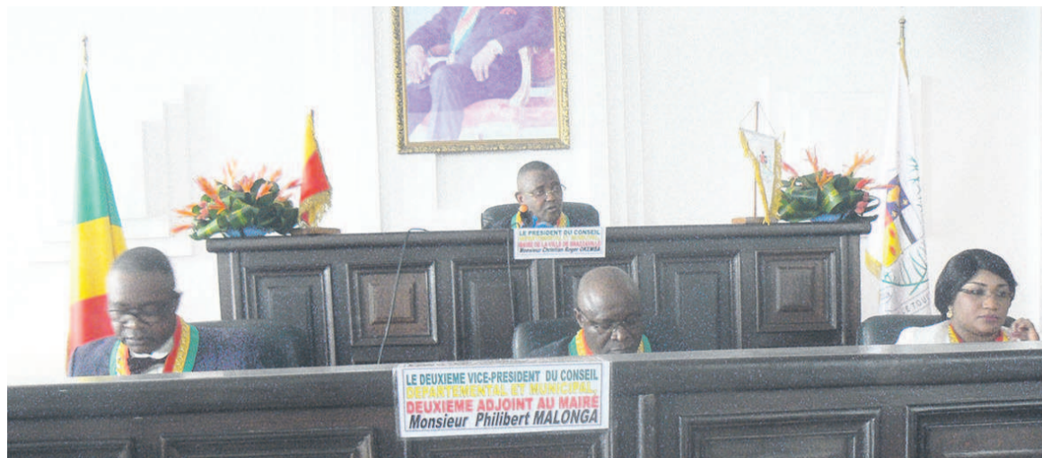
Le bureau du conseil municipal de Brazzaville

L'Assemblée locale a, en outre, affirmé avoir bouché des trous sur les grandes artères de la ville de Brazzaville, sur une distance d'un kilomètre. Le conseil a aussi œuvré pour la lutte antiérosive dans la commune de Djiri et aménagé «le ravin de la mission» afin d'éradiquer les