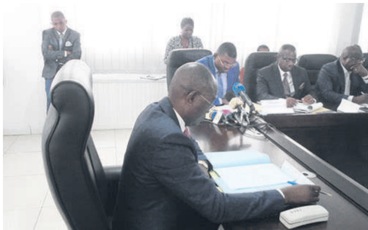
Les participants à la séance de travail rité sociale », a-t-il déclaré.