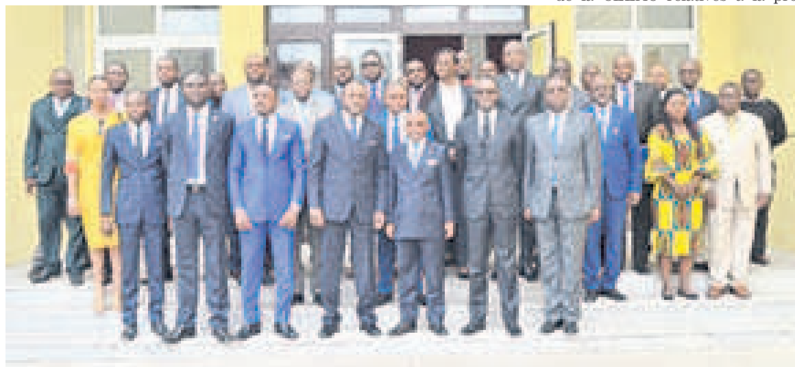
Les membres du gouvernement, l'ensemble des délégués et experts de l'atelier (Adiac)

« Le Congo ne saurait rester en marge du processus d'harmonisation de son cadre réglementaire et législatif en matière de la cyber sécurité, sachant que les pays frères et amis, à l'instar du Gabon, du Cameroun, de la République centrafricaine, du Tchad et du Burundi ont déjà incorporé dans leur corpus de législations nationales ces mêmes textes de la CEEAC et d'autres sont sur le point de terminer le processus »