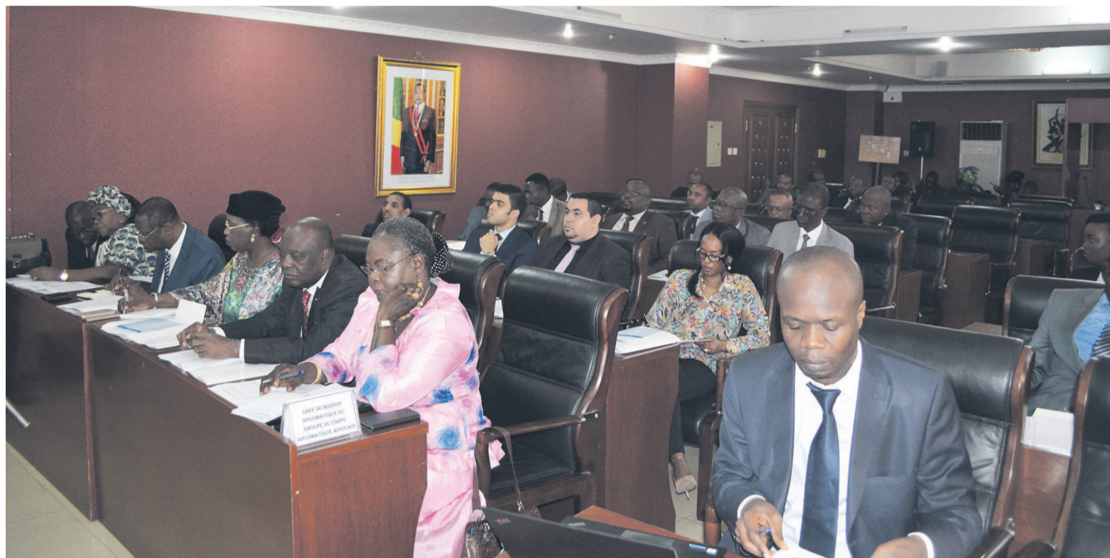
Une vue des diplomates lors de la rencontre

« Vu que l'Afrique est le deuxième continent au monde où l'on enregistre le plus grand nombre de réfugiés et de déplacés internes, nous comptons sur vous, pour faire le plaidoyer dans la prévention des crises qui constituent les principales causes de déplacements forcés sur notre continent », a-t-il précisé. « Depuis le 19 septembre 2016, suite à la crise migratoire sans précédent, il a été décidé à New York, de traiter désormais la question des réfugiés de façon inclusive. La déclaration de New York préconise que pour la gestion de la donne réfugiée, il faut faire intervenir les institutions financières, les pays donateurs, le secteur privé, la société civile, les académiciens, les sportifs, les artistes, les universitaires, les diplomates et toutes les bonnes volontés », a signifié le représentant du HCR dans son discours. Pour lui, les diplomates sont également bien placés afin d'apporter leur voix dans la prévention des différentes crises. « On s'est rendu compte que tous les réfugiés