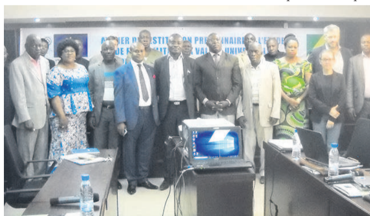
La photo de famille des participants (Adiac)

La présente rencontre vise à renforcer les capacités des par-