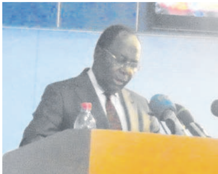
Clément Mouamba devant les députés

Les axes principaux et prioritaires de la nouvelle politique de développement qui va s'étaler sur les quatre prochaines années ont été présentés par le Premier ministre, Clément Mouamba, le 7 août, à l'Assemblée nationale.