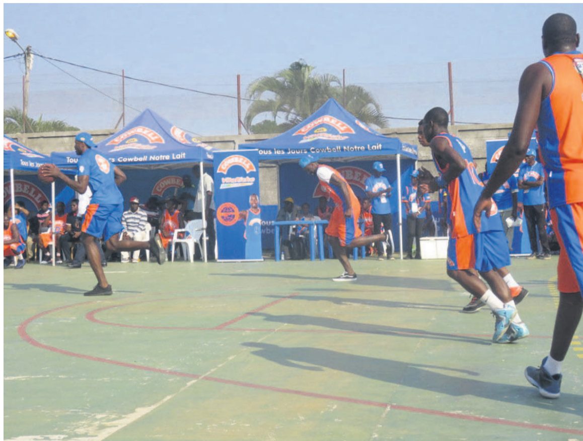
Serge Ibaka balle en main pendant le match

Plusieurs jeux concours ont été organisés pour égayer les enfants en situation de rue et des orphelins de Pointe-Noire. Les vainqueurs et tous les participants ont reçu des cadeaux de diverses natures, à savoir les ballons de basketball, les sacs scolaires, les parasoleils, les boîtes de lait. Malgré la longue attente, les jeunes visiblement joyeux n'étaient pourtant pas harassés de voir l'international de NBA, le toucher et échanger avec lui pour la première fois à Pointe-Noire. Le 7 août a été une journée mémorable pour ces enfants défavorisés qui ont eu le privilège d'immortaliser par les images cette rencontre avec le basketteur qui s'est engagé depuis quelques années dans les actions caritatives à l'égard des enfants congolais en détresse. Après quelques minutes passées avec les enfants, Serge Ibaka a promis de les revoir l'année prochaine, à la même période, pour une grande activité. Par ailleurs, un concours de dunk