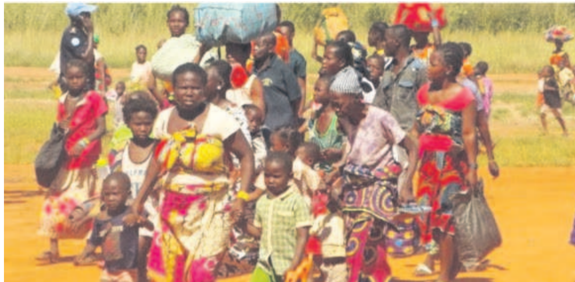
Des déplacés regagnant leur village

Presque tous les déplacés ont regagné leurs villages respectifs au bénéfice de la sécurité dans la région. C'est le constat fait par le RJDH en mission samedi dernier dans cette région du nord du pays.