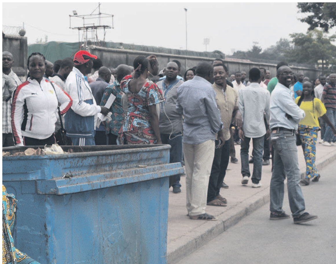
Une vue des enseignants en colère/Adiacnement primaire et secondaire resterait sourd à leurs revendications. Affaire suivie.

Plus grave encore, ces enseignants reprochent le ministère de tutelle d'avoir « ramassé » des étudiants pour poursuivre la correction déjà amorcée. Pour eux,