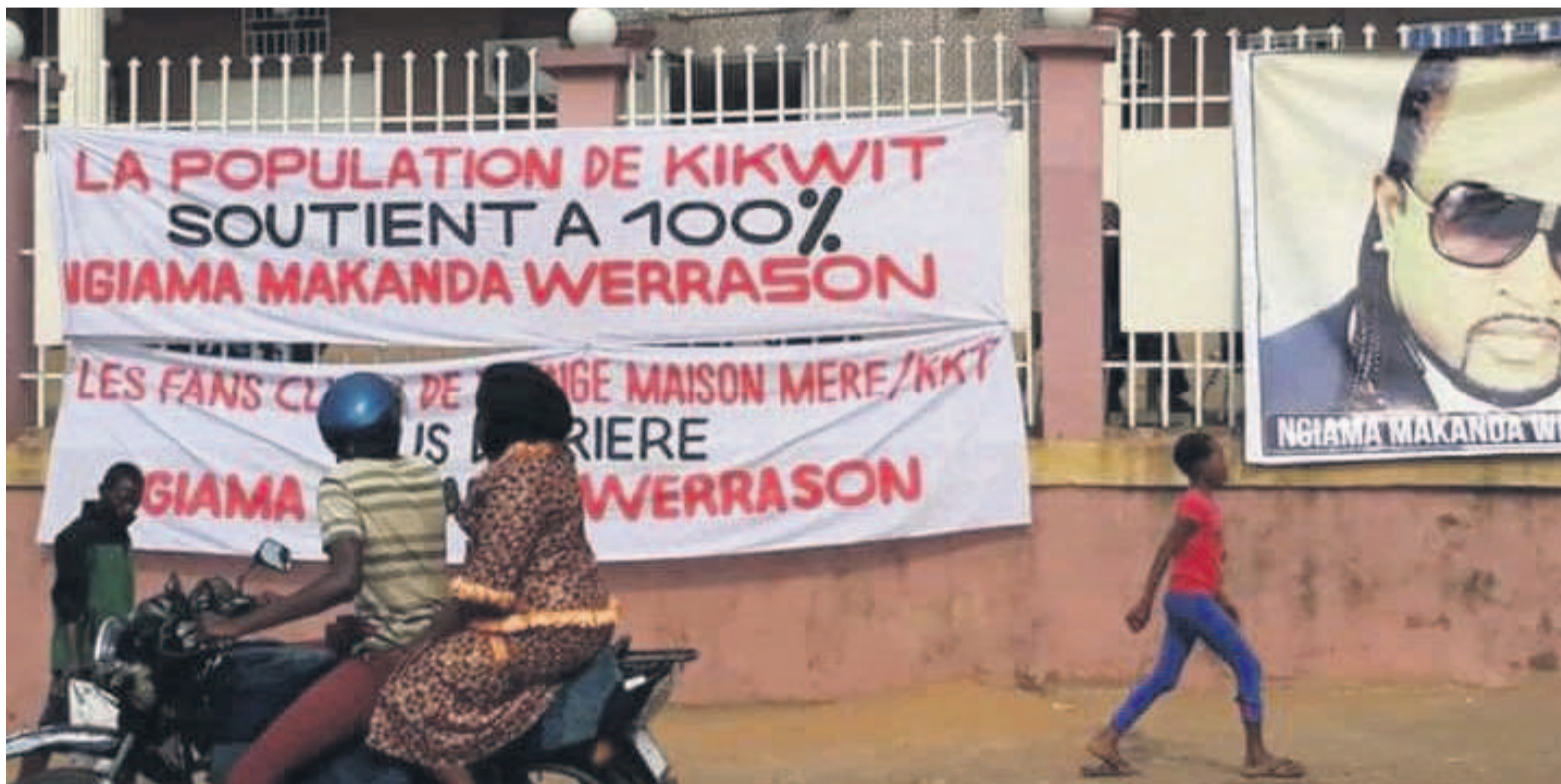
Les habitants de Kikwit prêts à voter pour Werrason

C'est à Kikwit que la star congolaise de la chanson est allée déposer sa candidature. Le choix porté sur la principale ville de la province du Kwilu, dorénavant sa circonscription électorale, se justifie par la popularité dont jouit l'artiste dans ce coin du pays d'où il est originaire. A chaque fois que Werrason et son Wenge Musica MM se produisent dans cette ville, c'est une marrée humaine qui déferle à chacune de leur prestation, preuve que la star est bien adulée par les siens. Cette popularité, Werrason entend la capitaliser aux fins d'accéder, par le biais