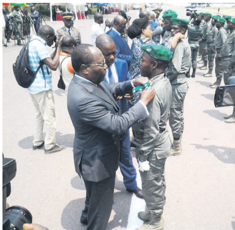
Le chef du gouvernement et ses membres faisant porter des insignes aux nouveaux promus

Elevés à l'issue d'une formation de quarante-cinq jours à Kouala-Kouala, les gardes forestiers dont onze femmes ont été nommés respectivement aux grades de major, sous-lieutenant, principal et aide forestier.