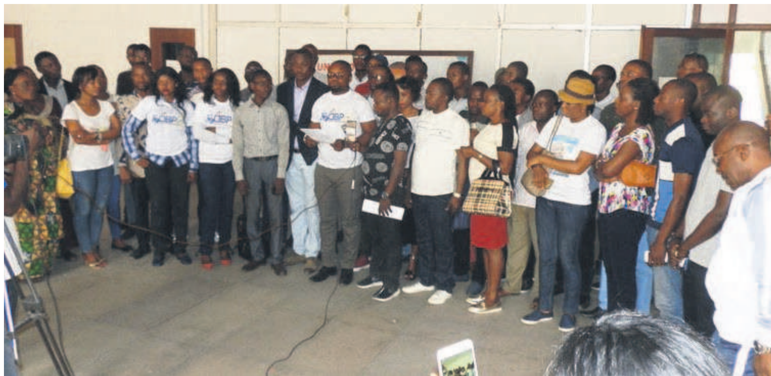
La lecture de la déclaration des structures spécialisées et associations affiliées au MLC/Adiac

Ces organisations notent que cette attitude anti-démocratique « devenue chronique pour cette famille politique »