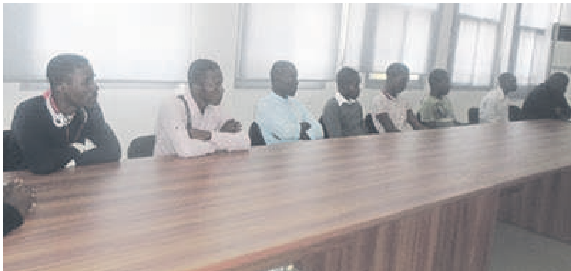
Les étudiants suivant la communication du directeur de la coopération, le 17 août

« Le concours va se tenir le 27 août ici à Brazzaville et dans les autres pays d'Afrique francophone. Les étudiants plancheront sur la culture générale, la culture scientifique et l'anglais. Les épreuves se passeront comme des questions à choix multiple. Le candidat va cocher ou entourer de bonnes réponses »