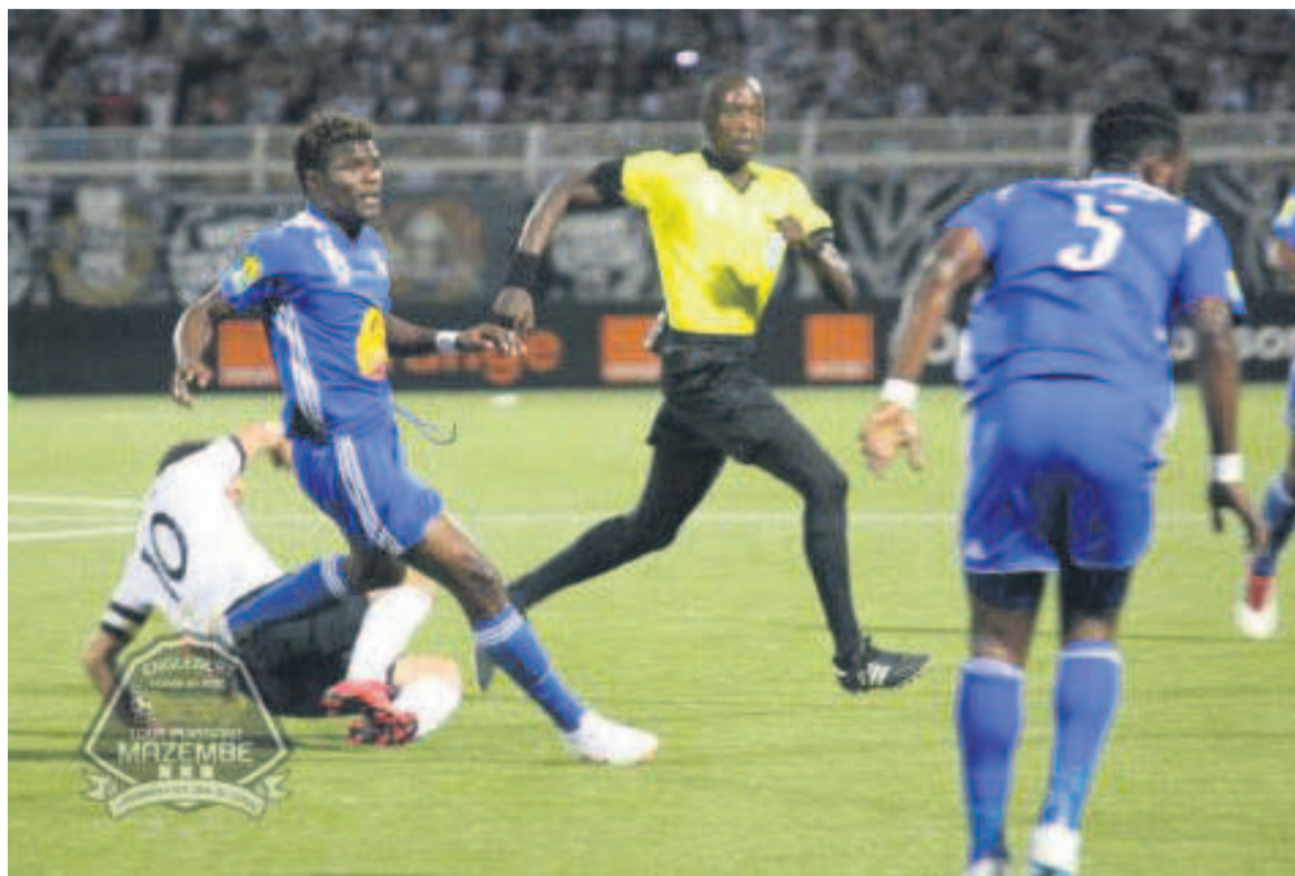
Une action du match entre Entente Sétif et TP Mazembe, le 17 août 2018