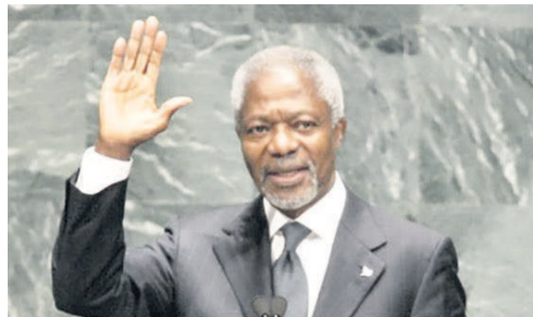
Kofi Annan

Le monde gardera de lui d'avoir été le premier secrétaire général des Nations unies issu de l'Afrique subsaha-