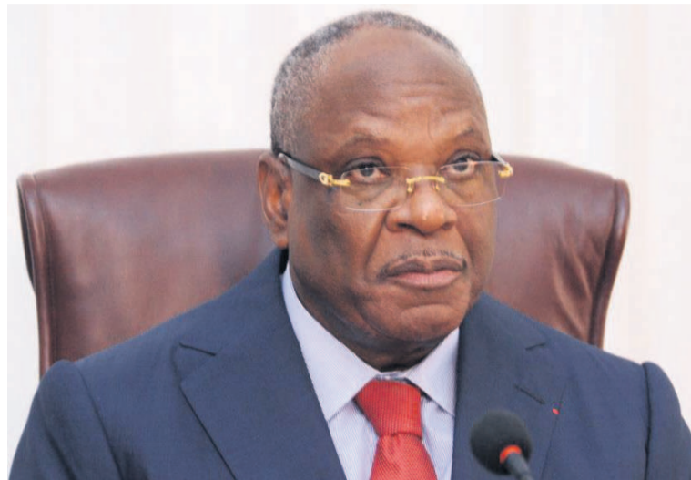
Ibrahim Boubakar Keita

Réélu le 16 août pour un second mandat, le président malien doit déjà faire face à de nombreux enjeux parmi lesquels la lutte contre la corruption, l'amélioration des conditions de vie de ses concitoyens et la gestion des ressources naturelles.