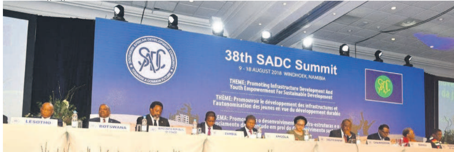
La tribune du 38e sommet de la SADC

années d'exercice du pouvoir. Les dividendes engrangés en termes