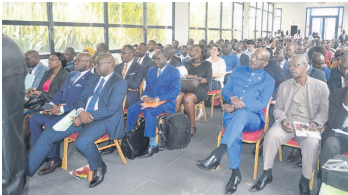
Une vue des participants à la conférence-débat

qué sur diverses thématiques pour bien éclairer la lanterne des porteurs de projets. La place des jeunes entrepreneurs dans le secteur agricole: libérer le potentiel dans le domaine de l'agriculture et stimuler la création d'emplois en vue de diversifier l'économie congolaise; les défis du développement du secteur et l'amélioration de la production agricole : quels rôles peuvent jouer les jeunes entrepreneurs ? L'innovation technologique au service du développement de l'entrepreneuriat agricole, les coopératives agricoles au profit des jeunes, les investissements privés dans le secteur agricole sont des thèmes sur lesquels les communications