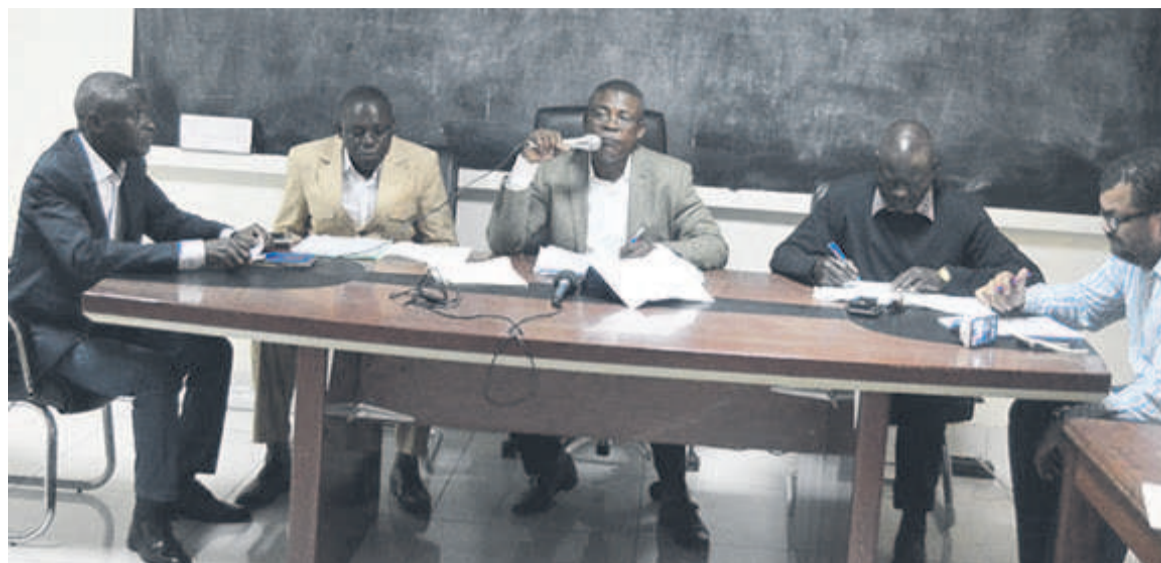
Le conseil fédéral de la FCA en réunion

Par ailleurs, l'ossature de l'équipe nationale, cette saison, sera constituée des athlètes ayant réalisé des bonnes performances lors des championnats nationaux de la saison dernière. Un plan de développement des qualités athlétiques est prévu. Il consistera, en autres, à alterner