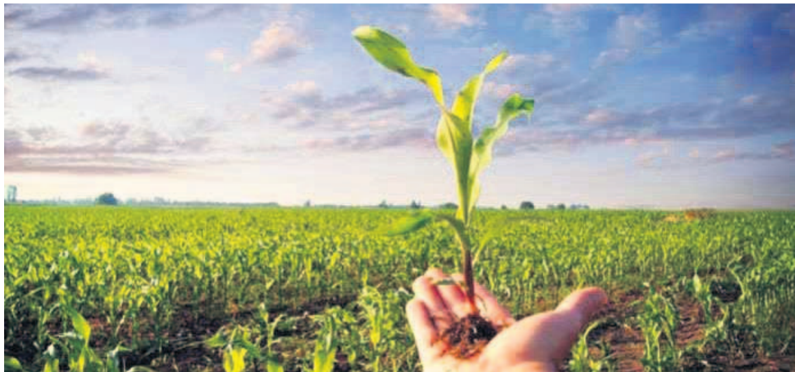
Ce secteur offre de grandes possibilités pour les jeunes en Afrique (DR)

Ainsi, pour le directeur général de la FAO, des stratégies doivent être bâties autour de l'agriculture qui est un secteur prometteur d'emplois. « Nous devrions faire de notre mieux pour rendre l'agriculture plus attractive aux yeux des jeunes. Car ils doivent percevoir l'agriculture comme un secteur rémunérateur et rentable sans oublier les technologies de l'information et