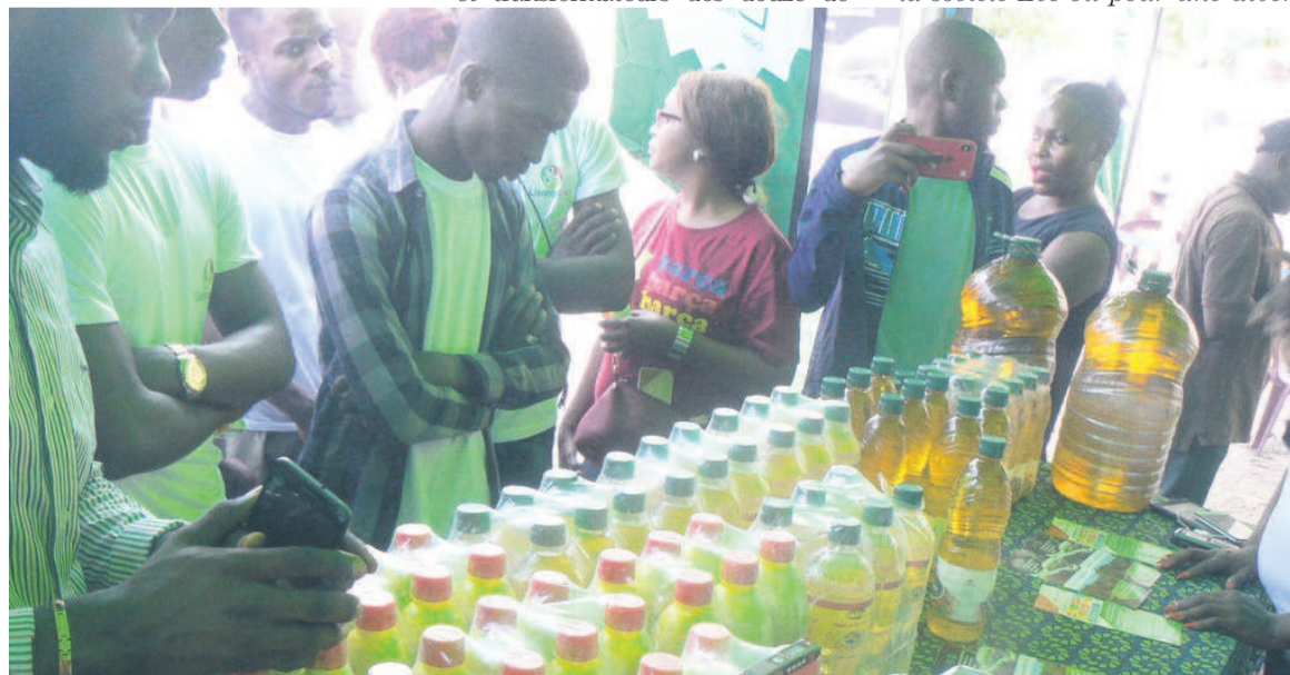
Les élèves attirés par les produits de la société Eco-Oil/Adiac