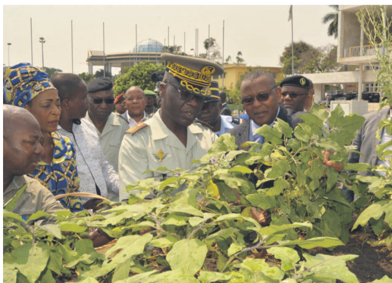
Le général Guy-Blanchard Okoï visitant un modèle d'agriculture urbaine

Fort de son potentiel en ressources humaines jadis impliqué dans les travaux lourds d'agriculture et d'entretien routier, le gouvernement entend faire participer le génie civil militaire dans le Plan national de développement