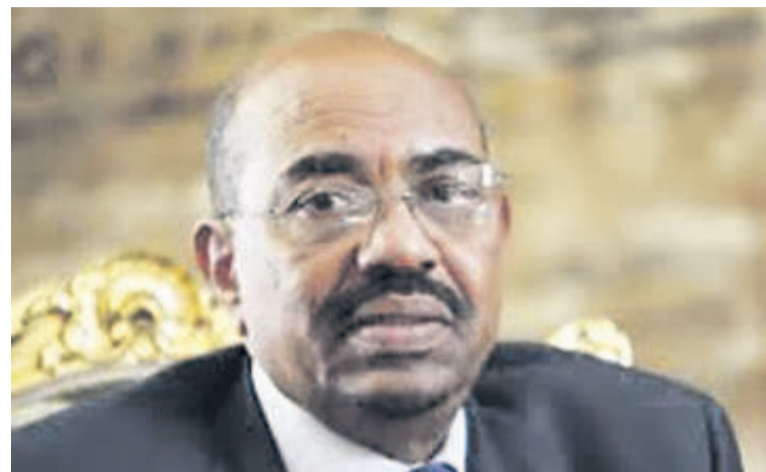
Le président Omar el-Béchir

Le chef de l'Etat est proposé par son parti pour briguer un nouveau mandat lors de l'élection prévue en 2020.