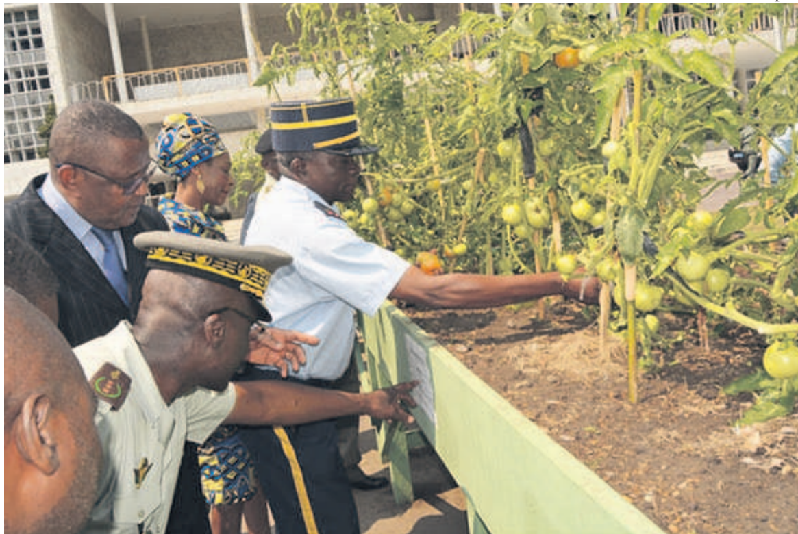
Le haut commandement militaire lors de la visite des jardins urbains