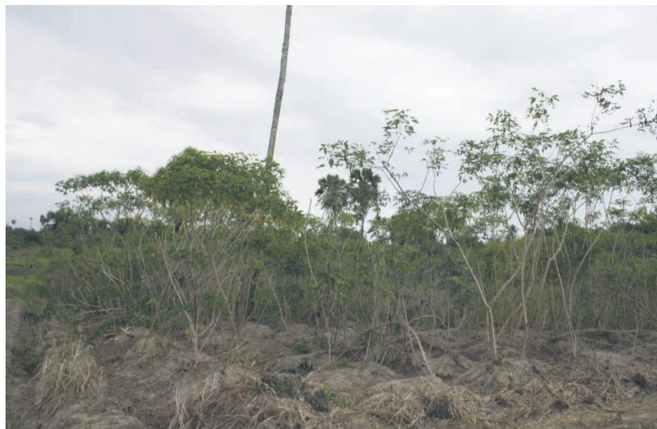
Un champ de manioc