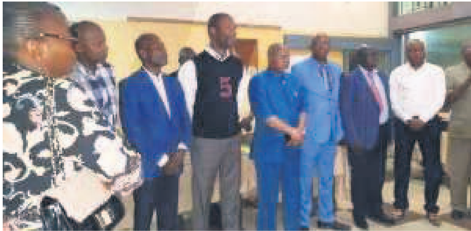
Le comité dirigeant de la Société des architectes du Congo

« Cependant, en qualité des professionnels formés et reconnus par la République, nous estimons que ce drame aurait pu être évité si toutes les questions d'aménagement du territoire et d'urbanisme étaient prises en compte », ont déclaré les architectes, avant de poursuivre: « En