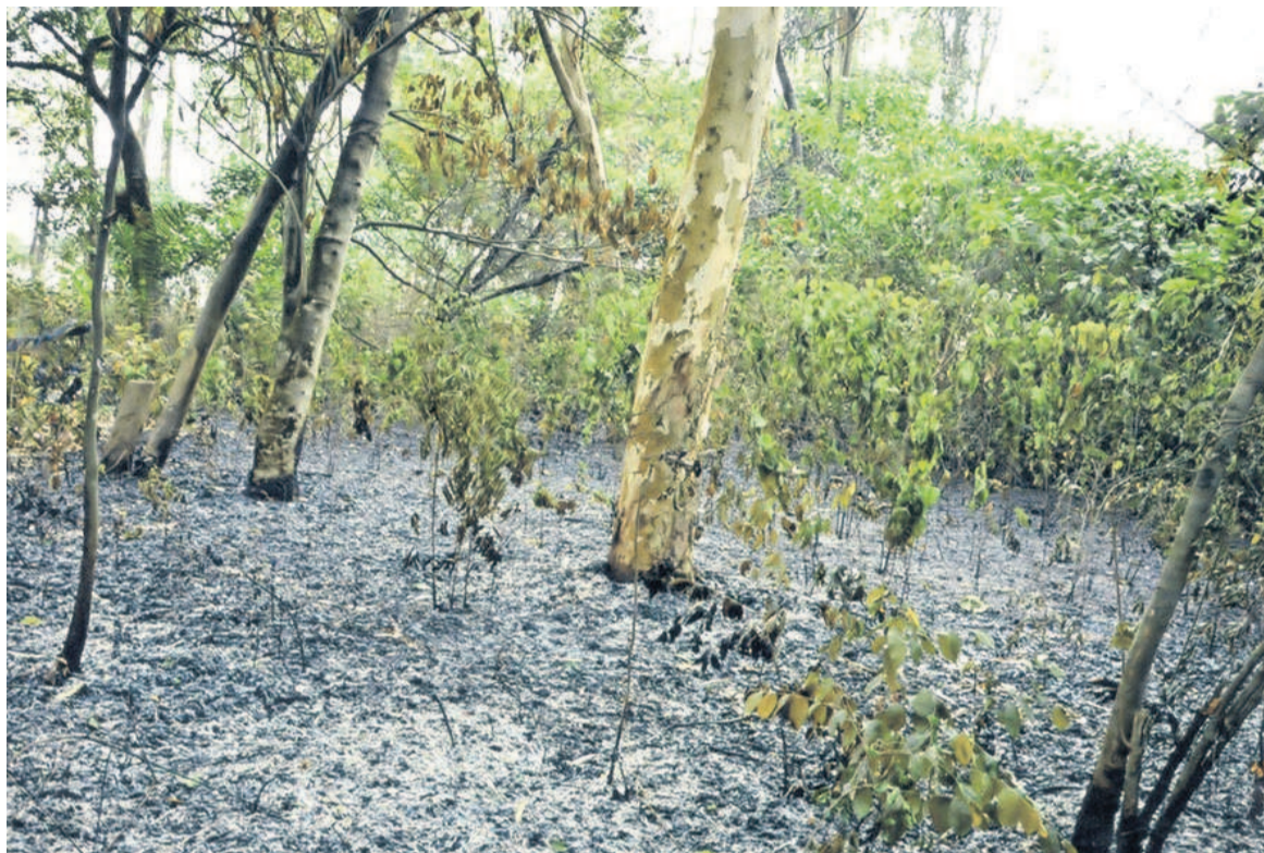
Une partie de la forêt dévastée par l'incendie