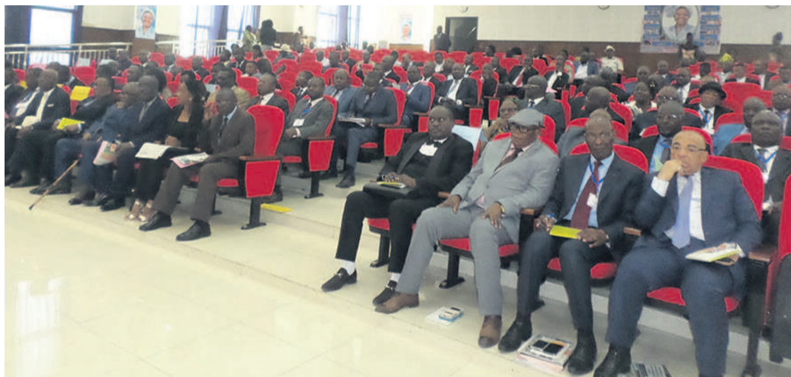
Une vue de la salle

Créé par décret depuis 2001, le Comité de suivi de la convention pour la paix et la reconstruction du Congo commémore depuis 2010, le 10 juin dans un département donné. « Je voudrais souli-