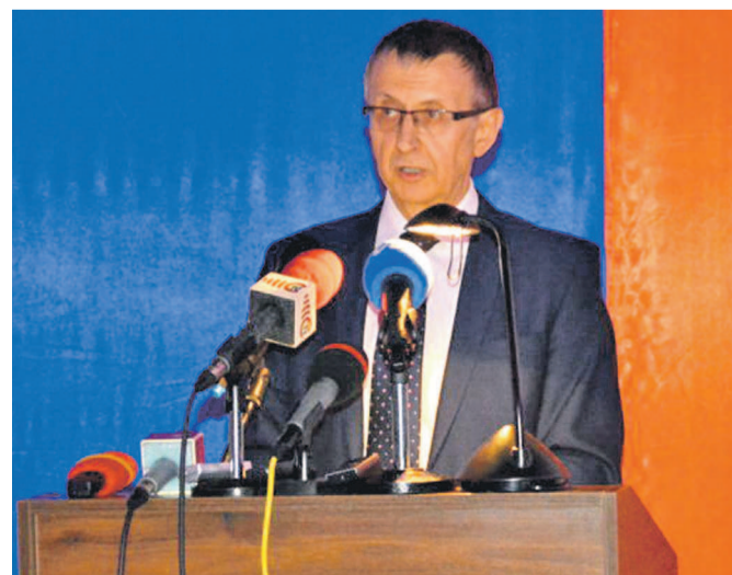
L'ambassadeur de la Russie délivrant son message