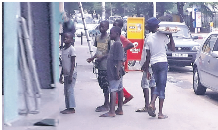
Des enfants en rupture familiale

Dans le cadre de la célébration de la Journée de l'enfant africain, il a été rendu public, le 13 juin à Brazzaville, un rapport faisant l'analyse de la situation des enfants et adolescents dans le pays. Selon cette enquête, un million trois cent mille enfants souffrent simultanément d'au moins trois formes de privations. Cette analyse de la pauvreté multidimensionnelle des enfants permet de déterminer la nature et l'ampleur des privations subies par les enfants dans différentes dimensions du bien-être dont la santé, la nutrition, le développement du jeune enfant, l'éducation, la protection, l'eau, l'assainissement, l'habitat et l'accès à l'information.