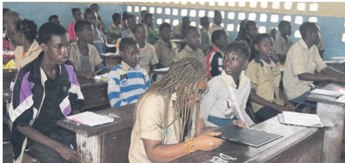
Les candidats au CEPE à l'école de Mafouta scolaire est effective. Le Congo a donc bien fait de rendre les

Selon le ministre, le nombre de candidats qui est de 120 291 est