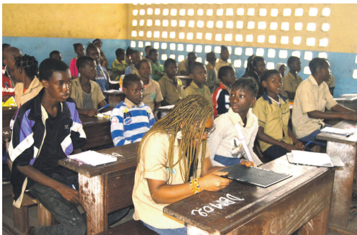
Les candidats au CEPE à l'école de Mafouta