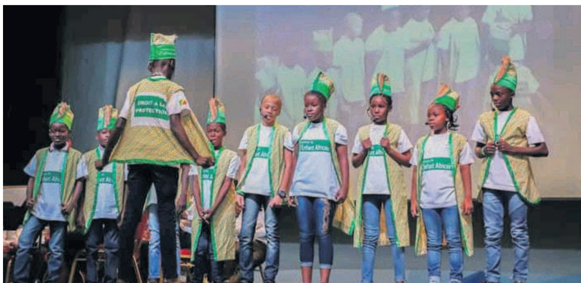
La troupe théâtrale du CEG Angola-Libre faisant un plaidoyer pour les droits des enfants

« Cette analyse contribue à apporter des réponses utiles pour appuyer le gouvernement dans la mise en œuvre des politiques publiques visant la réalisation des Objectifs de développement durable, conformément à la promesse de ne laisser aucun enfant de côté et d'aider en