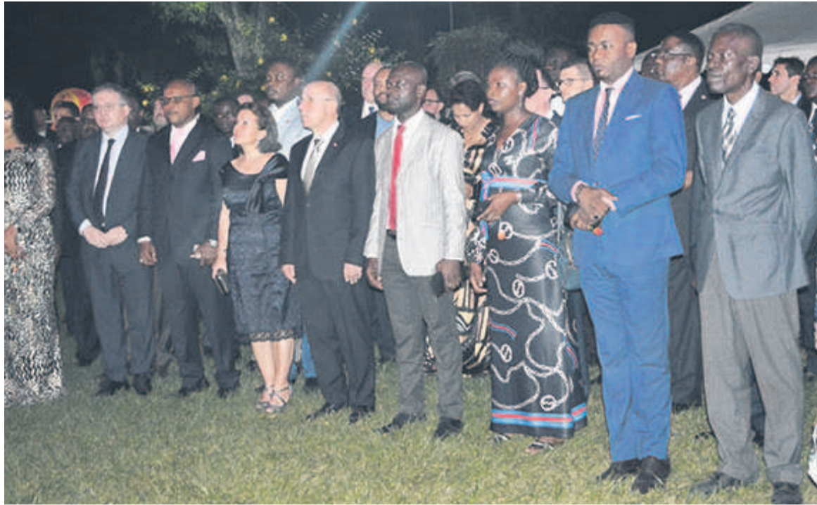
Une vue des invités

Dans ce contexte, a-t-il ajouté, la Russie et le Congo envisagent d'organiser la cinquième session de la grande commission mixte intergouvernementale, « d'autant plus que le ministre adjoint de l'Énergie, Pavel Sorokine, vient de