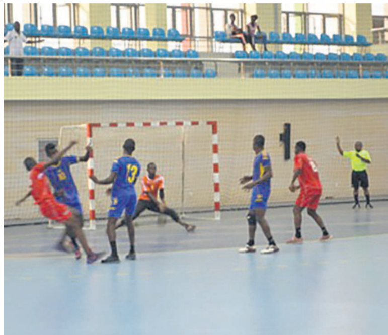
Une séquence du match

Le club a pris le dessus sur son adversaire en séniors messieurs 40-29, le 12 juin, au gymnase Nicole-Oba, lors de sa quatrième sortie.