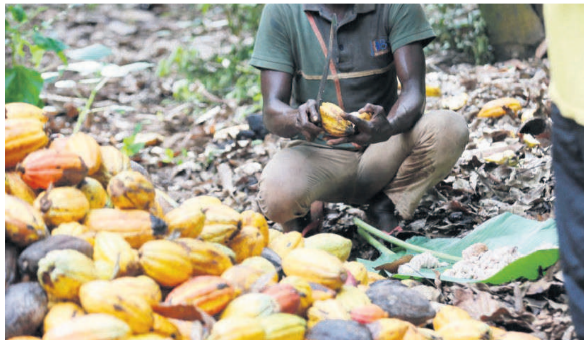
Dans une ferme de Toumodi, en Côte d'Ivoire, en octobre 2018.

« L'or brun » représente 10 % du produit intérieur brut de la Côte d'Ivoire, à peine moins pour le Ghana. Depuis des années, ce sont les acheteurs qui ont déterminé les prix. Pour essayer d'inverser