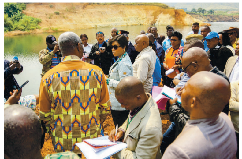
L'un des sites creusés par la Soremi SA

La ministre a dit ne pas comprendre pourquoi cette société n'a jamais fait d'étude d'impact environnemental et social qui est l'une des premières obligations des entreprises qui s'installent au Congo, alors qu'elle a investi près de deux milliards cent millions francs FCFA pour aller vers un combustible qui n'est pratiquement plus utilisé dans toutes les sociétés qui concilient industrie cimentière et gestion durable. Ce montant, a-t-elle signifié, pouvait permettre d'avoir des installations qui concilieraient la