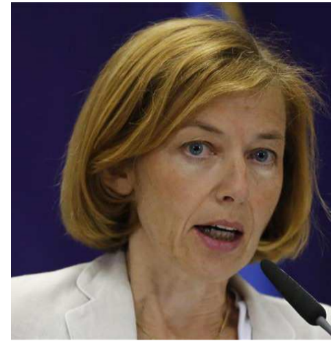
Florence Parly

questions de coopération bilatérale entre les deux pays et sur l'élan que va donner la France à l'EUTM, en charge de la formation des Faca. Il pourrait être question de l'élargissement de sa mission d'appui aux forces de sécurité intérieure.