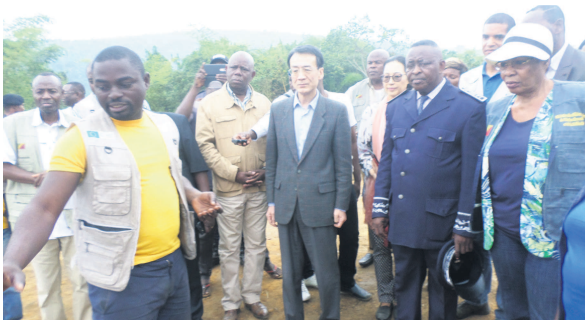
La délégation conjointe gouvernement, ambassade de Chine et PAM à Mayama