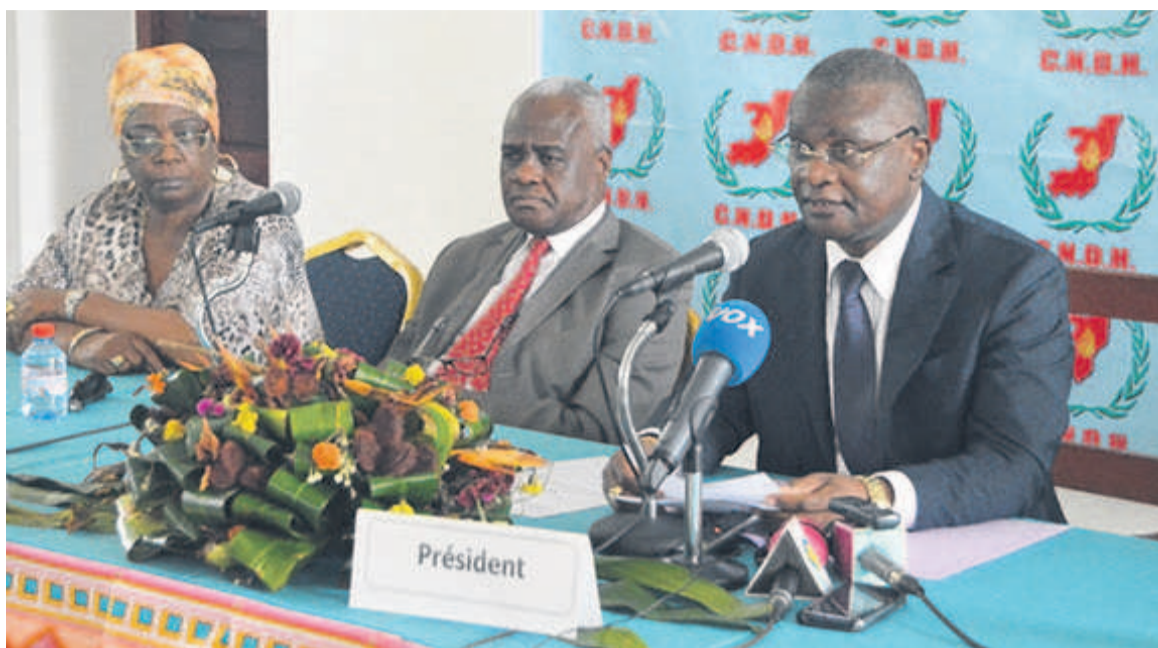
Le président de la CNDH, à côtés des autres membres, clôturant les travaux de l'assemblée plénière

Le programme d'activités 2020, adopté à cette occasion, prévoit, en effet, d'intensifier les visites des lieux de détention et de correction pour s'assurer que les droits des détenus sont respectés. Il n'est plus à démontrer que les conditions de détention dans les établissements pénitentiaires, de manière générale, sont jugées mauvaises dans tous les pays du monde avec bien sûr des différences notables d'un pays à l'autre. La CNDH, au plan national, promet donc d'ouvrir grands les yeux pour y veiller et contribuer activement à la réparation des violences de ces droits une fois constatées. Lors de cette session, les