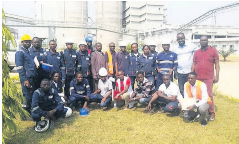
Les employés de Dangote cement et les chargés de la sensibilisation

Les affections dermatologiques, les atteintes auditives, les affections péri-articulaires, les affections oculaires dues aux rayonnements thermiques, les affections chroniques du rachis lombaire, celles provoquées par des vibrations des machines industrielles et des chocs, par des huiles et des graisses d'origine minérale, figurent parmi les maladies professionnelles