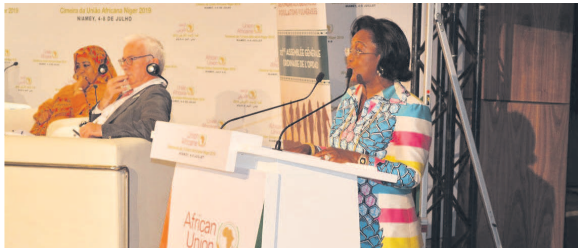
La première dame du Congo, Antoinette Sassou N'Guesso, prononçant son discours d'adieu

Pour l'épouse du chef de l'Etat congolais, les succès et les échecs que l'organisation a enregistrés les années précédentes lui a permis de « tracer une nouvelle perspective afin d'être au diapason de multiples attentes des