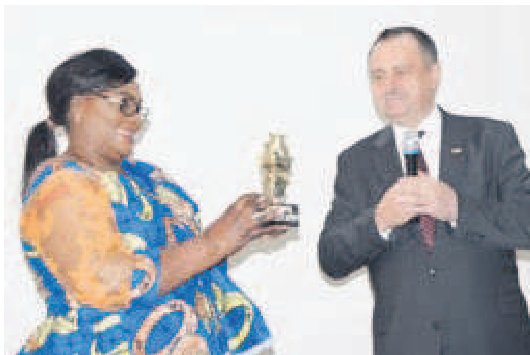
Le directeur du Centre culturel russe remettant le trophée au Groupe Congo Unie