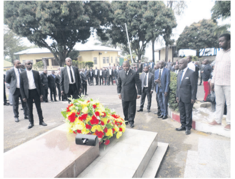
Le président du Sénat, Pierre Ngolo, s'inclinant devant la sépulture du disparu

La chambre haute du parlement, conduite par son président, Pierre Ngolo, a honoré, le 5 juillet à Brazzaville, la mémoire de son premier questeur décédé à la même date, en 2018, des suites d'une maladie.