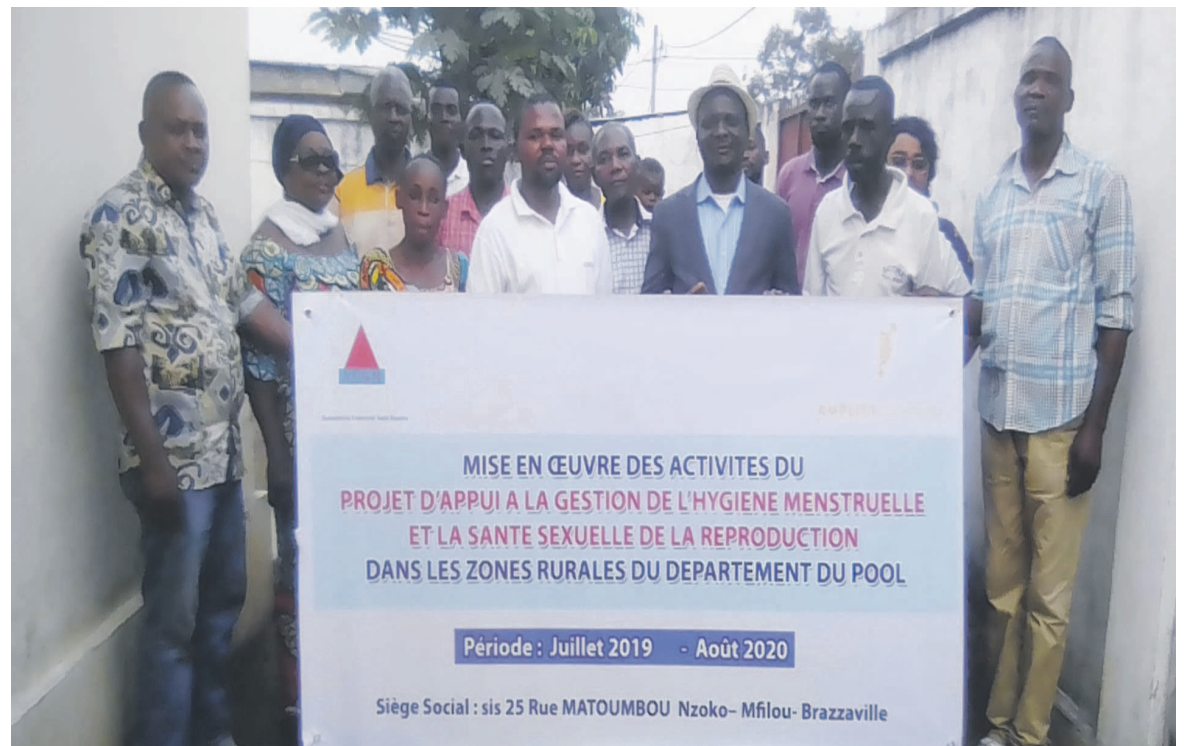
Une vue des membres de l'association fraternité Saint Rosaire/Adiac

Pour encourager les membres de l'association à s'impliquer volontaire-