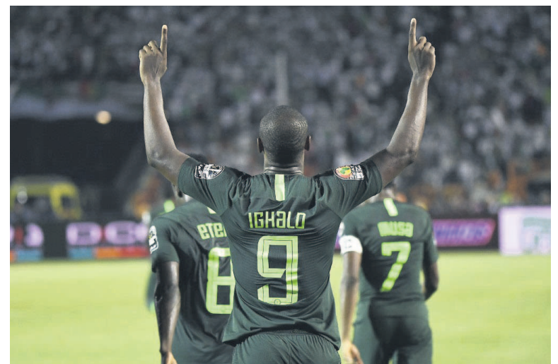
Odion Ighalo, roi des buteurs de la CAN 2019 avec 5 buts

L'attaquant nigérian Odion Ighalo a terminé meilleur buteur de la Coupe d'Afrique des nations qui s'est terminée, vendredi, au Caire par le sacre de l'Algérie (1-0 devant le Sénégal).