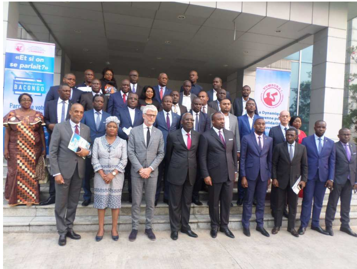
La photo de famille des officiels Adiac

Selon l'invité d'honneur de ces assises, la France et le Congo ont tous une tradition décentralisatrice. De ce fait, les deux Etats ont fait des efforts pour décentraliser et donner plus la parole aux citoyens. En effet, l'ancien maire du 2e arrondissement de Lyon a rappelé que la France a commencé avec la décentralisation depuis 1983 avant d'intégrer le développement de la participation citoyenne en 2002. « Nous voyons bien qu'il faut pouvoir échanger nos expériences parce que la participation des citoyens ne doit pas s'organiser seulement dans la loi, c'est par la pratique. C'est à travers l'échange d'expériences que