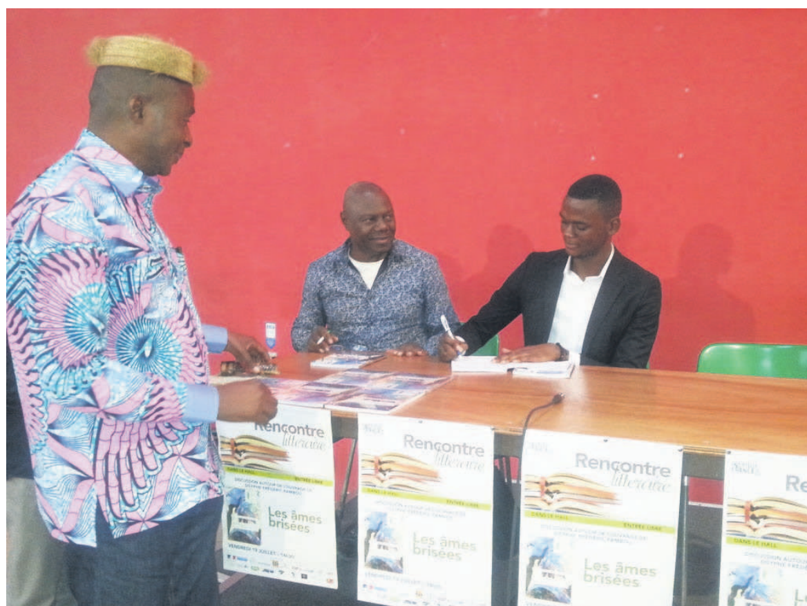
L'auteur dédicant son ouvrage