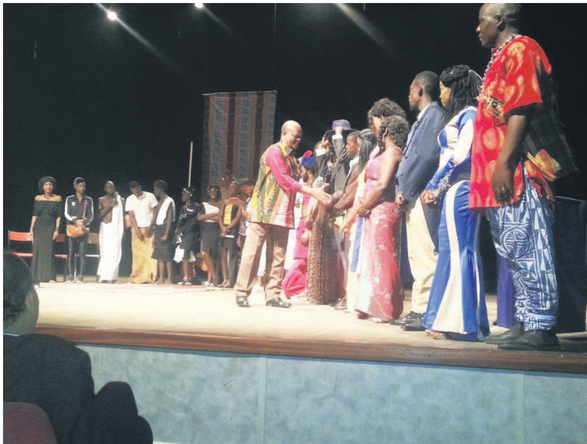
Henri Djombo félicitant les artistes au terme du spectacle

L'annonce n'est pas encore officielle. Mais sa divulgation, de bouche-à-oreille, suscite déjà des soulèvements partout dans le royaume. Par