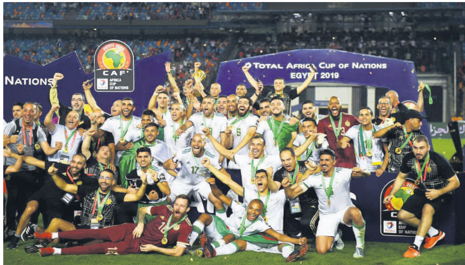
Egypte 2019/Algérie championne d'Afrique, encore raté pour le Sénégal

Ces derniers, avec une possession de balle de 59%, se