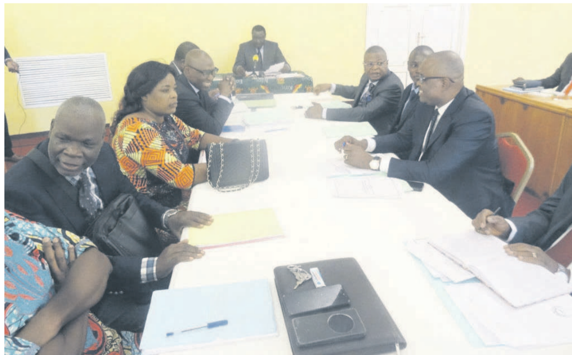
Les participants au comité de direction de l'INS

Les résultats d'une opération représentent un document important de la politique de développement d'un État comme le Congo. Le RGPH est normalement organisé chaque décennie en vue d'actualiser le fichier démographique sur le nombre d'adultes, de personnes âgées, d'hommes et de femmes, de jeunes, élèves et étudiants, de