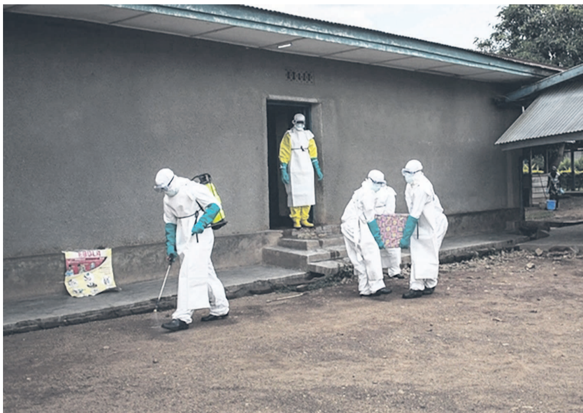
Le renforcement de la riposte contre Ebola s'impose