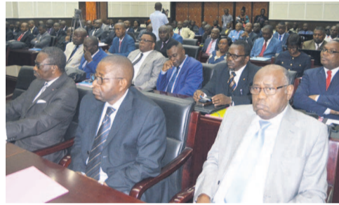
Les participants à la revue des plans de travail des structures de santé