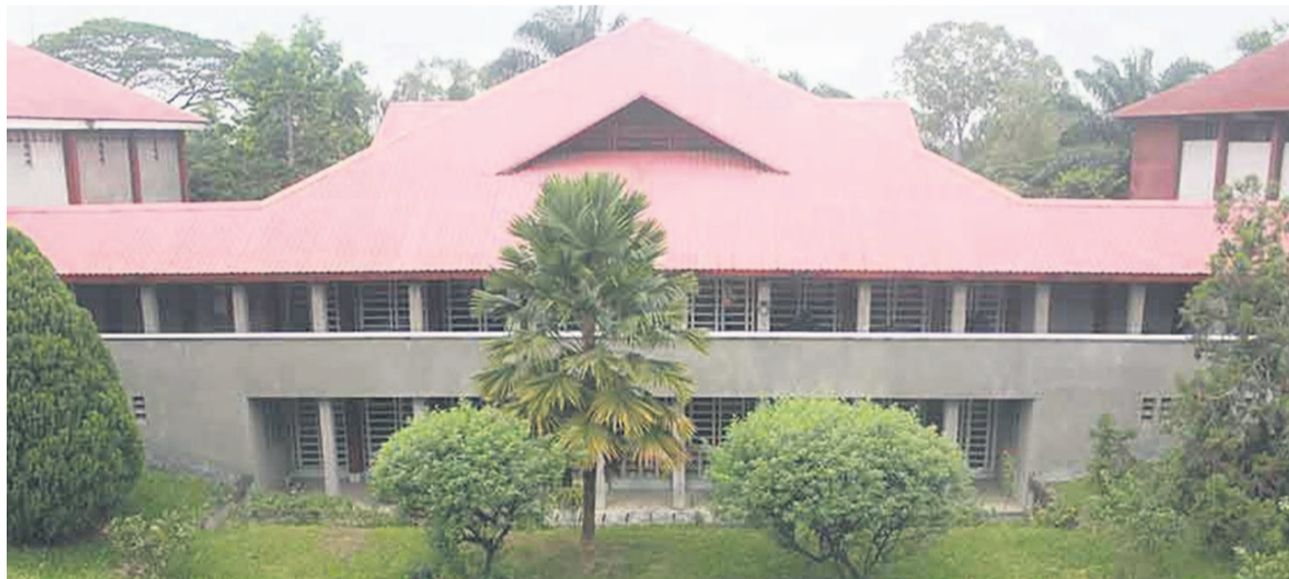
Une vue de l'université Loyola du Congo

L'Icam, école d'ingénieur généraliste, créée à Lille en France, en 1898, et l'université Loyola du Congo avaient officialisé, en novembre dernier, la création d'une entité qui aura pour nom « Faculté d'Engineering ULC-Icam » et qui formera sur le campus de Kimwenza des techniciens et ingénieurs. La formation des ingénieurs durera 6 ans dont 4 ans de tronc commun et 2 ans de Master, avec une option entrepreneuriat pour la moitié de la promotion. Cette formation, expliquent ses initiateurs, s'inscrit totalement dans la ligne des formations Icam, et tout spécialement celle du nouveau « Parcours Ouvert », axé sur des pédagogies innovantes, soutenues par le digital et les expérimentations, en Fab Lab notamment. « L'objectif étant, à moyen terme et si les conditions locales le per-