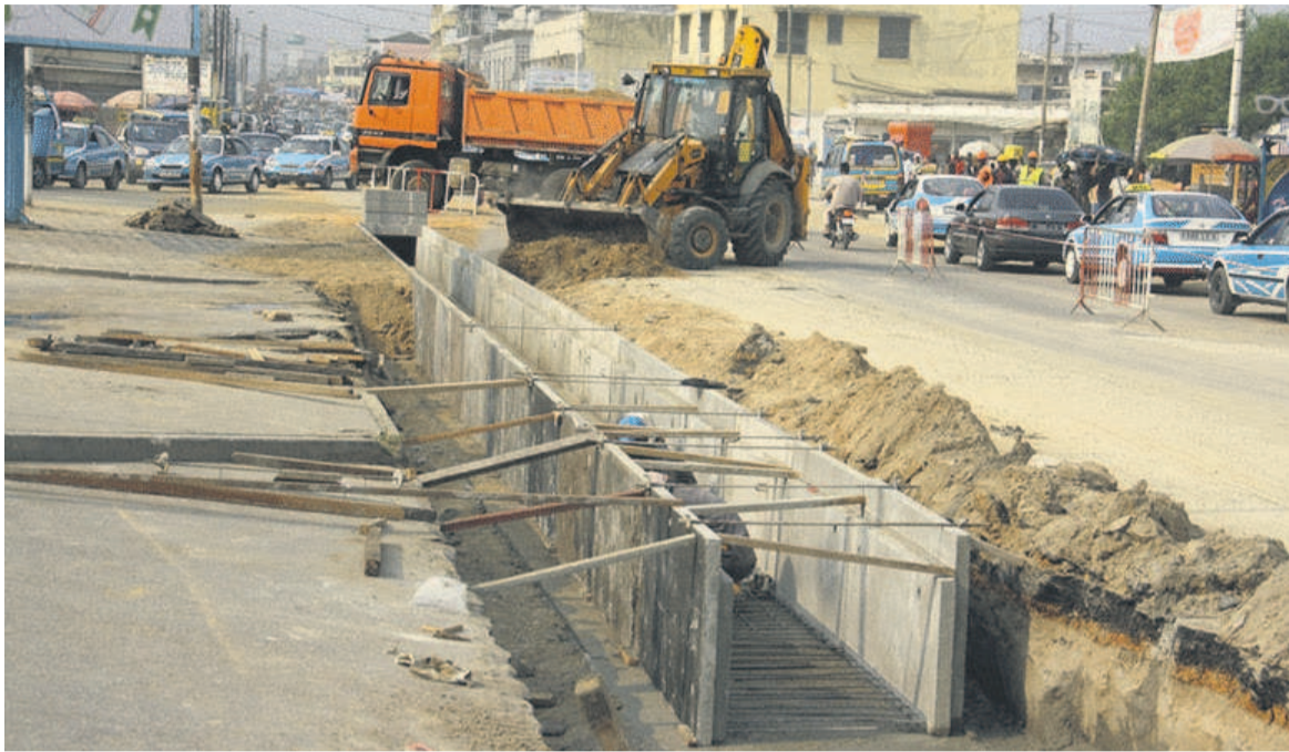
Construction de caniveaux sur le boulevard Moe-Katt-Matou

Depuis un certain temps, la municipalité de Pointe-Noire a lancé des travaux d'aménagement et de modernisation des anciens édifices dans des endroits différents de la ville.