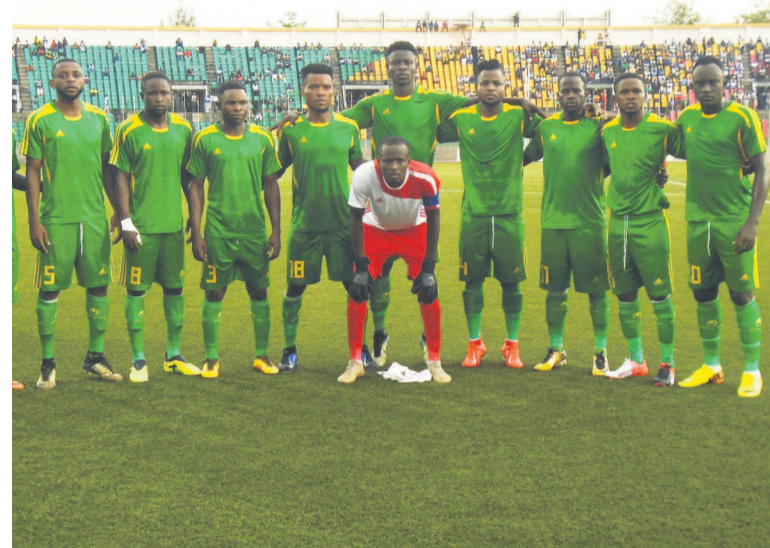
L'Etoile du Congo

dération, ne connaît pas encore son adversaire au tour préliminaire. Ce qui est sûr, elle sera reçue à la même période par le représentant égyptien qui sera connu au terme du championnat qui a été interrompu à cause de