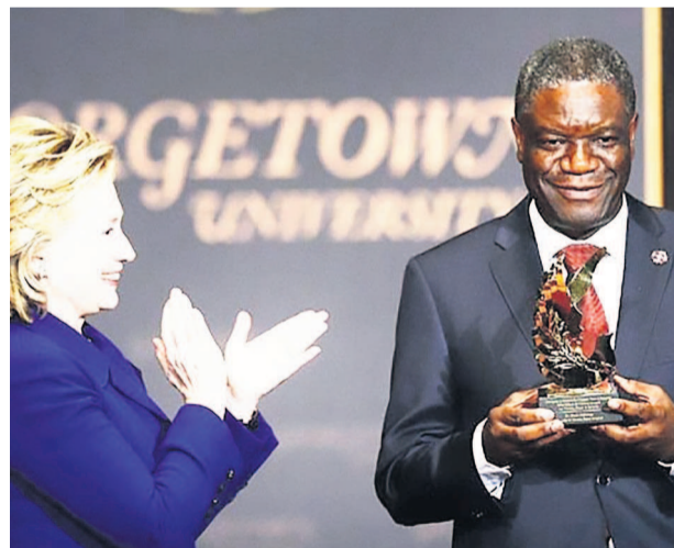
Dr Denis Mukwege, symbole de la lutte contre les violences sexuelles

Dans un récent message adressé aux habitants de deux villes du Nord-Kivu, le médecin directeur de l'hôpital général de référence de Panzi et Prix Nobel de la paix 2018 rappelle que la maladie d'Ebola existe et que l'on doit cesser de croire qu'il s'agit d'une fausse épidémie. Dr Mukwege les exhorte à s'approprier la lutte contre Ebola, à ne pas s'isoler et à ne pas s'attaquer aux centres de traitement.