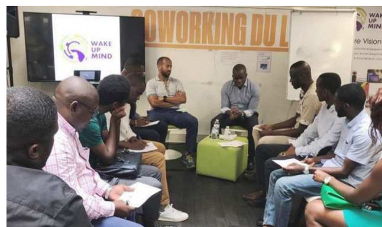
Wake-Up mind, conférence consensus du 20 juillet à Paris.