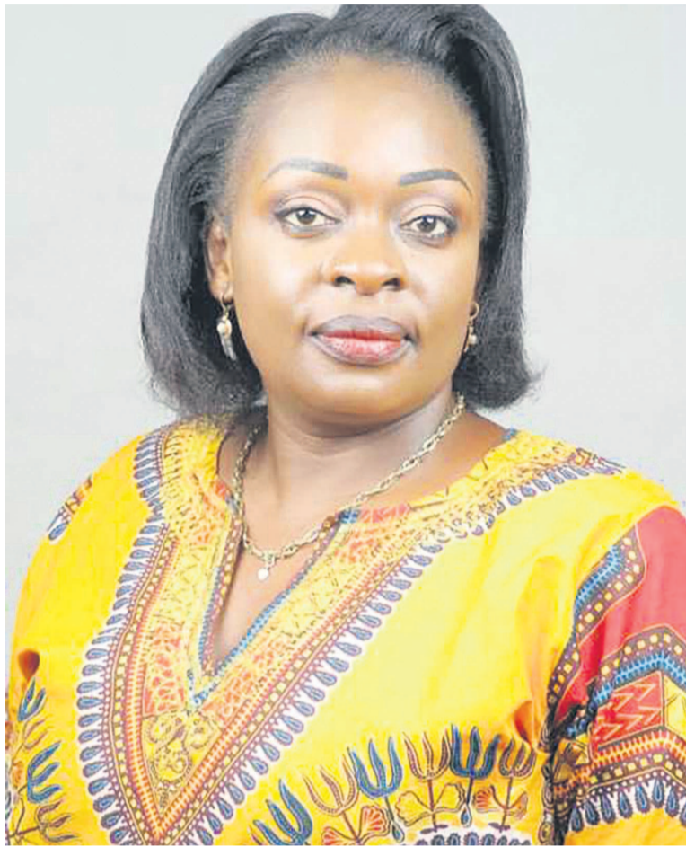
La députée Solange Masumbuko

Dans sa réaction du 22 juillet, la députée a noté que de nombreux militants de l'Alliance des forces démocratiques du Congo et Alliés (AFDC-A) s'étaient rassemblés, le même jour, devant le Palais du peuple, pour accompagner l'autorité morale de ce regroupement politique, le sénateur Modeste Bahati Lukwebo, à déposer sa candidature à la présidence du Sénat. L'honorable Solange Masumbuko s'est dite, par ailleurs, surprise de voir les éléments de la police « se livrer inutilement à des méthodes ré-