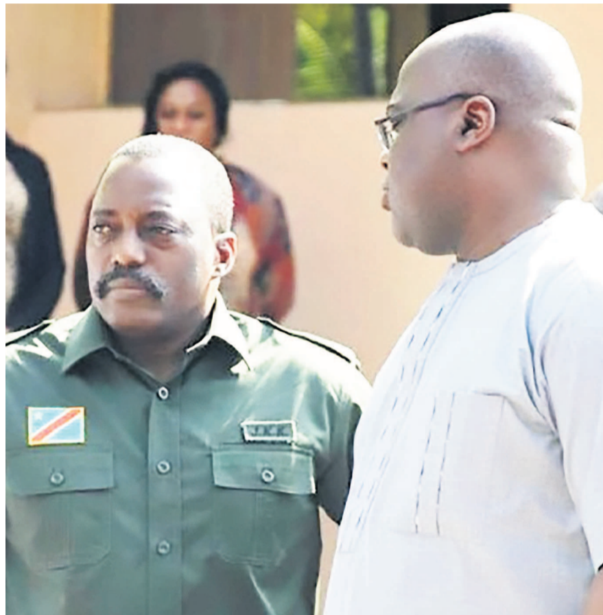
Joseph Kabila et Félix Tshisekedi lors de leur dernière rencontre à la cité de l'Union africaine

Les négociations porteraient actuellement sur l'attribution des responsabilités, un travail accompli à plus ou moins 95%, dit-on. Quant à la répartition des postes ministériels, le FCC et le Cach auront respectivement quarante-deux et vingt-trois portefeuilles dans un gouvernement qui comptera soixante-cinq membres. Page 2