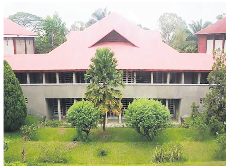
Une vue de l'université Loyola du Congo

L'Institut catholique d'arts et métiers (Icam), école d'ingénieur généraliste, créée à Lille en France, en 1898, et l'université Loyola du Congo avaient officialisé, en novembre dernier, la création d'une entité qui aura pour nom « Faculté d'Engineering ULC-Icam » et qui formera, sur le campus de Kimwenza, des techniciens et ingénieurs. Cette formation, explique-t-on, s'inscrit dans la ligne des formations Icam, et tout spécialement celle du nouveau « Parcours Ouvert », axé sur des pédagogies innovantes, soutenues par le digital et les expérimentations, en Fab Lab notamment. Page 4