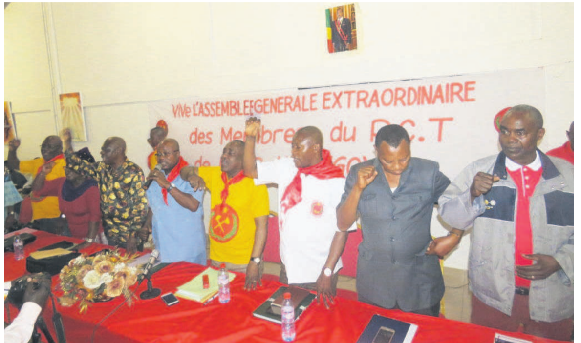
Tribune officielle des travaux

L'orateur a en outre rappelé le contexte particulier de la tenue de ces sessions caractérisé par les événements en perspectives à savoir la célébration du 50e anniversaire de la création du PCT, la tenue courant 2019 du 5 e congrès ordinaire de ce parti. Il a invité l'ensemble des membres de son parti afin que ces derniers