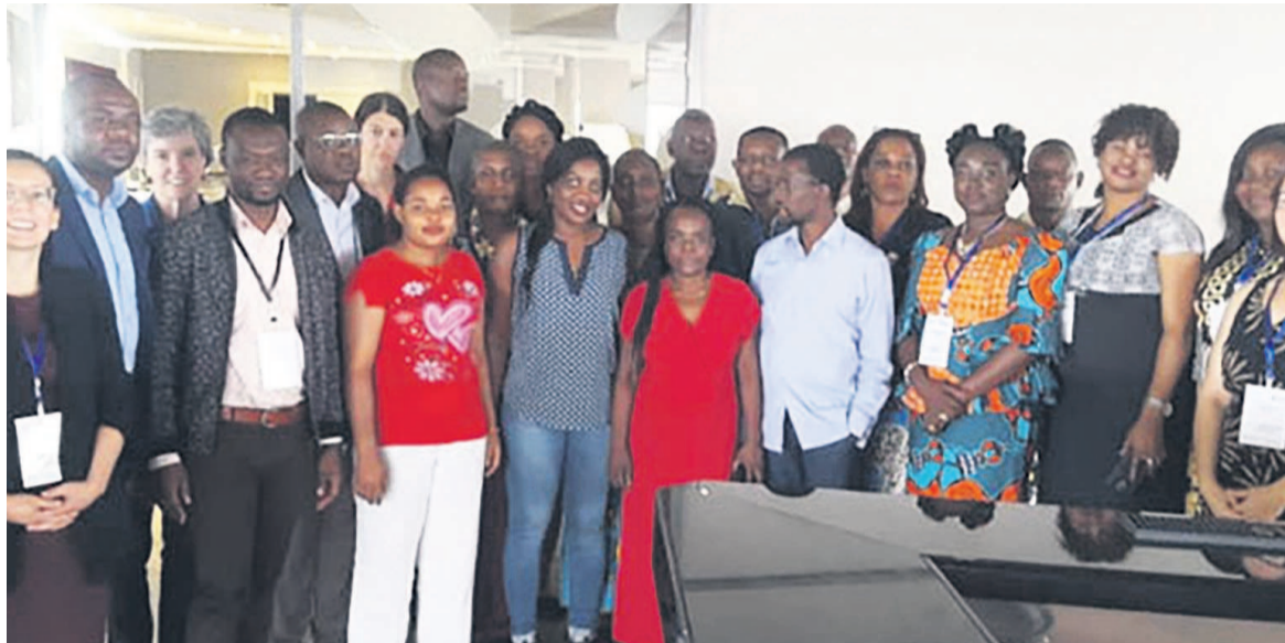
Des participants à l'atelier

Au cours de l'atelier auquel ont pris part les journalistes, les acteurs de la société civile et quelques directions du ministère de la Santé sans oublier les partenaires, les participants ont été éduqués sur l'approche SMART de l'AFP et ses accomplissements en RDC. Ils ont également affiné leurs compétences en communication pour le plaidoyer et l'engagement des médias. Comprenant neuf étapes, l'approche SMART de plaidoyer a pour finalité d'aider les journalistes à définir l'objectif SMART qui signifie spécifique, mesurable, atteignable, réaliste et temporellement défini ; examiner le contexte, opportunités et défis ; connaître le décideur et définir la bonne requête ainsi que le porteur du