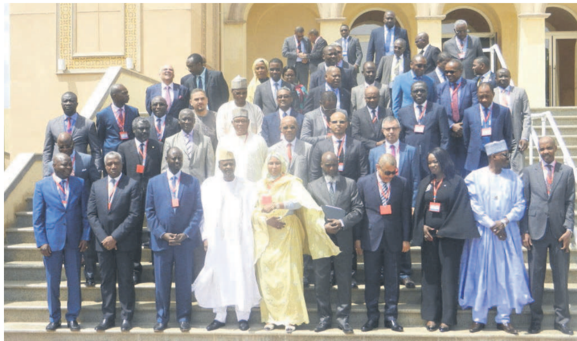
La photo de famille des participants au séminaire

Il définit les attributions des organes de contrôle, notamment la BEAC et la Cobac.