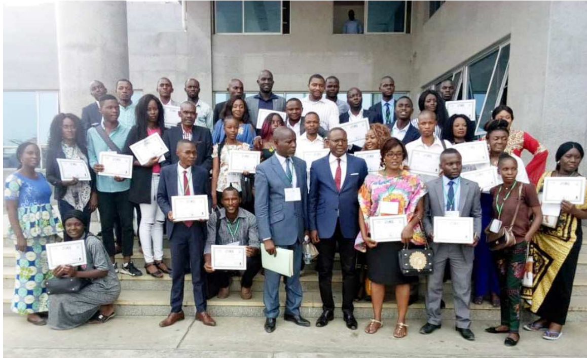
Un échantillon des journalistes stagiaires et étudiants en journalisme

En pratique, trois reportages ont été réalisés à 100% par des stagiaires. Au cours de ce stage, ils ont appris à rédiger des brèves, faire des commentaires tant passables qu'acceptables. Il y a eu aussi les visites guidées dans les organes de presse au-