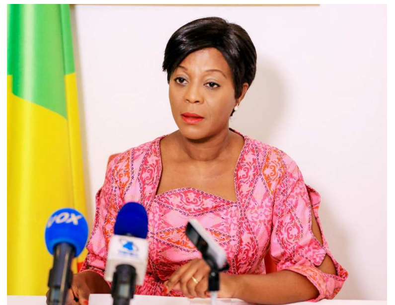
La ministre du Tourisme et de l'environnement

En sa qualité de coordonnatrice de la Commission climat du bassin du Congo, la ministre Arlette Soudan-Nonault a prononcé, le 23 août, une déclaration au nom du gouvernement congolais.