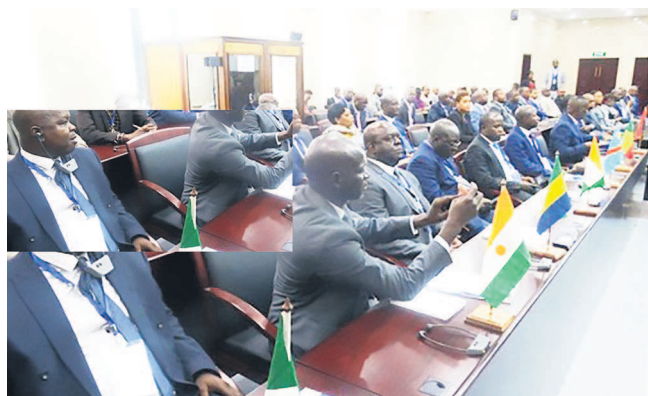
Les délégués présents à l'ouverture