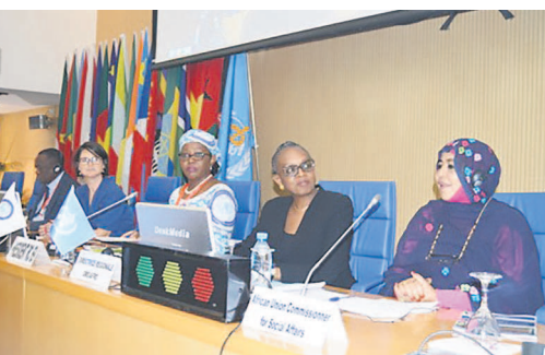
Le présidium des travaux du Comité régional de l'OMS-Afrique

À l'issue des travaux de la 69e session du Comité régional de l'Organisation mondiale de la santé pour l'Afrique, tenue du 19 au 23 à Brazzaville, plusieurs recommandations ont été faites aux Etats membres et à la structure onusienne pour mettre les populations du continent à l'abri des maladies. Il s'agit, entre autres, d'élaborer des programmes nationaux de recherche fondamentale et appliquée en entomologie, d'améliorer la coordination des activités de surveillance des maladies à transmission vectorielle, de créer des groupes de travail interministériels et multisectoriels. Page 5