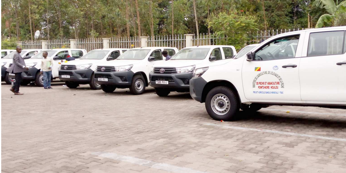
Une vue des véhicules

Le projet d'appui au développement de l'agriculture commerciale (PDAC), en collaboration avec la Banque mondiale (BM), a fait un don de 15 véhicules (4x4) au ministère de l'Agriculture, de l'Élevage et de la Pêche. Il y en aura 35, mais les 20 autres seront offerts avant fin septembre.