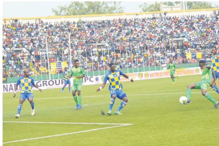
Une séquence du match opposant l'Etoile du Congo à l'AS OthohôAdiac