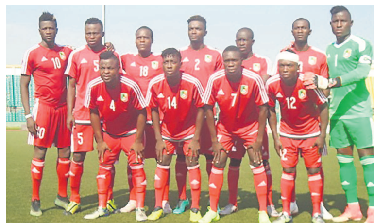
Les U-23 congolais