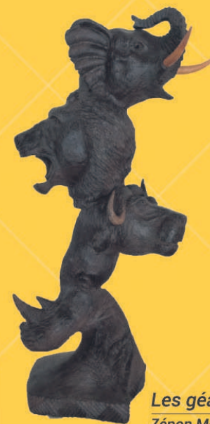
Les géants de la forêt Zénon Mosséli