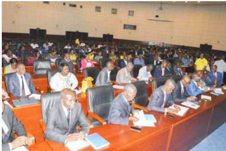
Les participants à l'activité

Pour l'initiateur, ce genre d'initiative aide à concilier