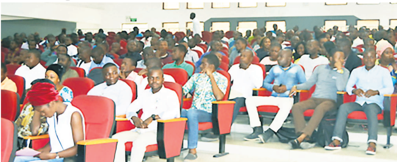
Les enseignants finalistes bénéficiaires de la formation continue

À travers la formation pédagogique qui se tiendra du 26 août au 14 septembre dans la Sangha, les Plateaux et la Bouenza, les enseignants finalistes affectés dans les douze départements du pays vont pouvoir renforcer leurs capacités pour améliorer en conséquence la qualité des prestations. « Il s'agira pour chacun d'entre vous de s'approprier des compétences nouvelles liées à la didactique des disciplines, la pédagogie fondée sur les méthodes participatives, l'administration scolaire assortie des principes de fonctionnement du système éducatif... », a expliqué le ministre de l'Enseignement primaire, secondaire et de l'alphabétisation, Anatole Collinet Makosso. Page 6