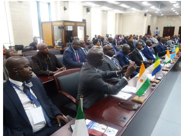
Les délégués présents à l'ouverture

Elle considère inefficace l'usage des camions citernes pour le transport du carburant et songe à employer des moyens mo-