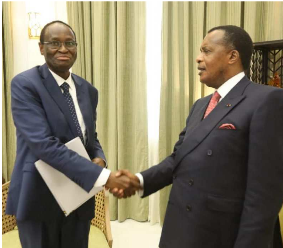
Denis Sassou N'Guesso et Tiebile Dramé.

Le chef de l'Etat congolais, Denis Sassou N'Guesso, a échangé, le 22 août à Oyo, dans le département de la Cuvette, avec le ministre des Affaires étrangères du Mali, Tiebile Dramé.