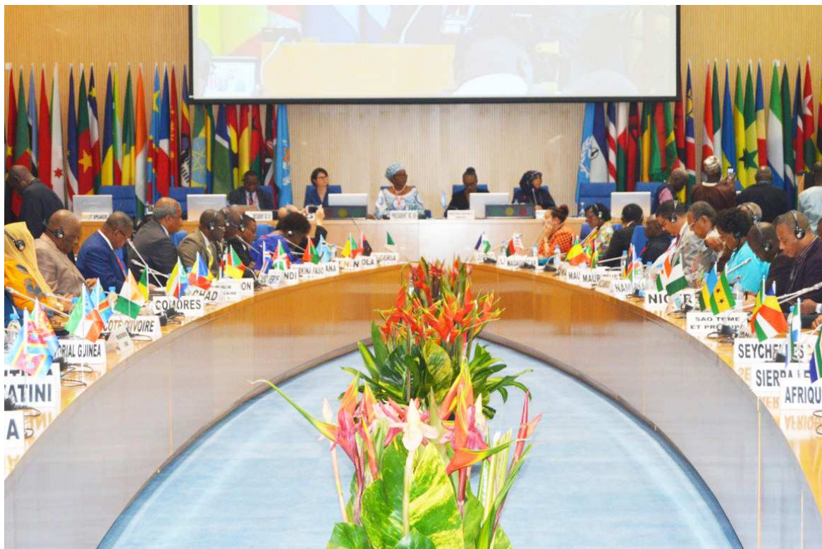
Les délégations lors de la clôture du Comité régional de l'OMS-Afrique

Pour réduire le double fardeau de la malnutrition, un plan stratégique 2019-2020 a été adopté. En appuyant les Etats membres dans ce combat, l'OMS-Afrique et les partenaires vont assurer