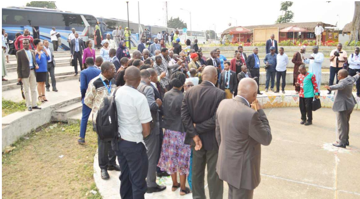
Les participants à la 69e session de l'OMS visitant le centre du monde

Dirigée par l'office national du tourisme, l'excursion a débuté à la cité de l'OMS dans le huitième arrondissement de Brazzaville, Madibou. Puis elle est passée par le pont du Djoué, la corniche sud, le Centre du monde (situé à la case De gaulle), le ministère de la Défense, le Mémorial Pierre-Savorgnan- de Brazza, la galerie Bassin du Congo des Dépêches de Brazzaville, le rond-point Poto-Poto, l'École de peinture de Poto-Poto, le rond-point Moun-gali, le boulevard Alfred-Raoul avant de prendre le boulevard Denis- Sassou- N'Guesso jusqu'au rond point du ministère de la Défense où elle a repris la corniche pour retourner à la cité de l'OMS. Dans chaque lieu où le cortège a fait escale, notamment au Centre du monde, au Mémorial Pierre-Savorgnan-de Brazza et à la ga-