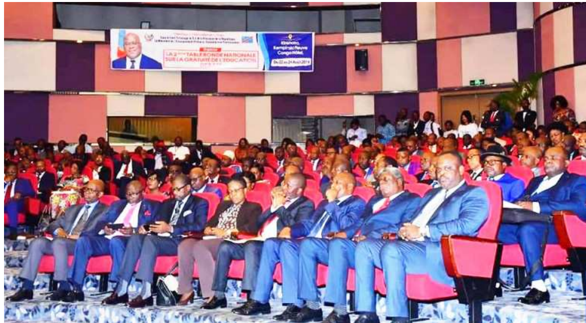
Des participants à table ronde sur la gratuité de l'enseignement en RDC

tudes que n'arrêtent d'exprimer certains analystes qui estiment qu'on va un peu vite en besogne. Déjà, avec un État qui a difficile à se doter d'un budget conséquent à la hauteur de ses ambitions, la gratuité de l'enseignement avec tout ce qu'elle implique en termes de financement, paraît très fastidieuse et même trop prétentieux, estiment certains esprits. D'où la mise en garde d'un expert du secteur pour qui « la gratuité prônée par le chef de l'État n'est pas certes utopique, mais paraît difficile dans son application immédiate ». Il estime qu'il y a des conditions à remplir. « Il faut notamment un barème spécifique pour l'enseignant afin qu'il travaille dans des conditions normales et universelle-