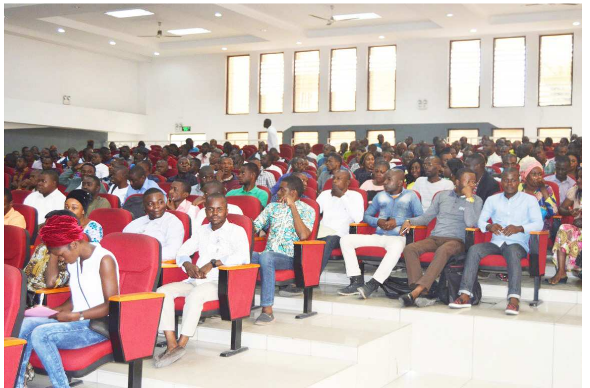
Les enseignants finalistes bénéficiaires de la formation continue

La formation continue des personnels constitue un levier destiné à développer les compétences et les performances des