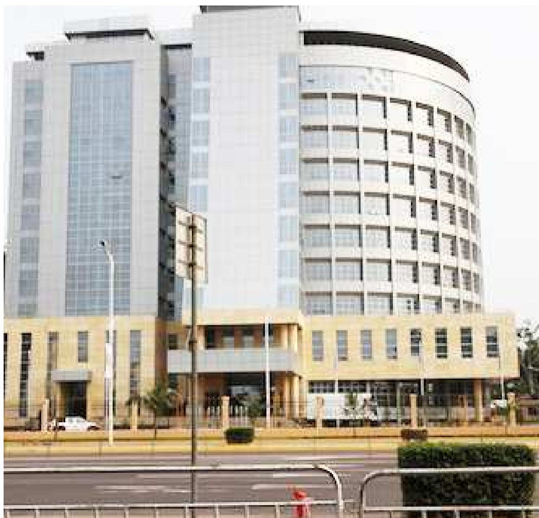
L'immeuble abritant l'hôtel du gouvernement à Kinshasa