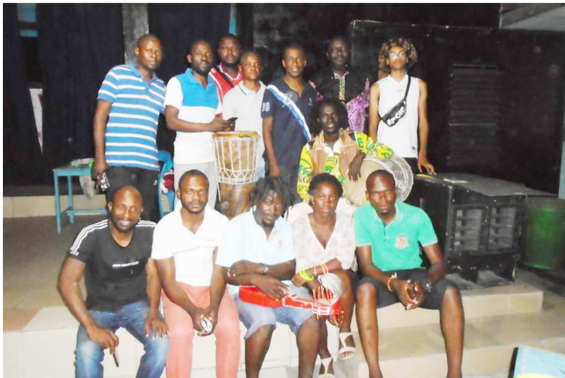
La photo de famille des participants à la formation en danse contemporaine.

zaville pour la redynamisation de son antenne locale, en vue de mettre en place des passerelles de travail pour que ce projet et aussi d'autres à venir soient couronnés de succès dans les deux villes.