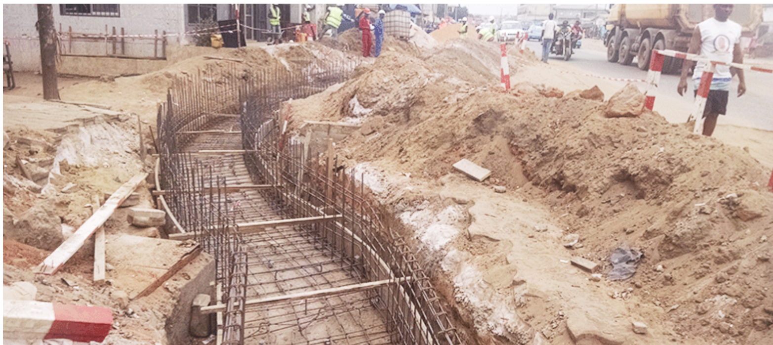
Les travaux de canalisation à Siafoumou

Actuellement, elle est en train d'implanter les espaces verts et recouvre les nouveaux pavés. Notons que cette ronde a ter-