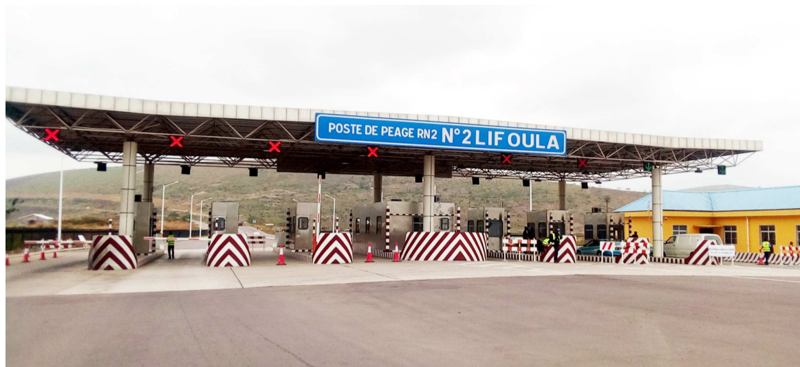
Le passage au poste de péage de Lifoula, sortie nord de Brazzaville

Les prix ont été annoncés, le 9 septembre, avec l'adhésion de l'intersyndicale des transporteurs qui entend sensibiliser ses membres à la nouvelle grille tarifaire.