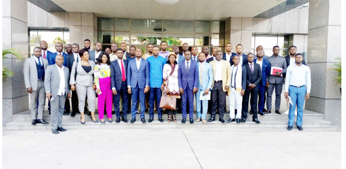
La photo de famille après la réunion

en place une coordination qui va veiller à l'exécution de la vision de la plate-forme au niveau national et, au niveau international, seront installés des secrétariats exécutifs, partout où il y a des jeunes leaders congolais. « C'est-à-dire, si vous êtes aujourd'hui en France, vous devez vous comporter d'abord en patriote ; l'expérience que vous avez acquise là-bas, vous devez la mettre à profit pour le développe-