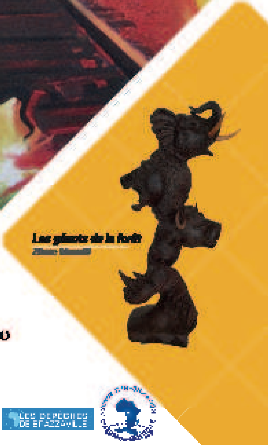
Les géants de la forêt Zinoir Mwanza