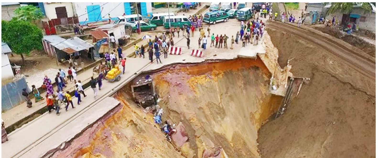
L'érosion de Ngamakosso/Adiac

Les pluies à Brazzaville occasionnent le plus souvent de nombreux dégâts humains et matériels : mort d'homme, routes impraticables, circulation entravée sur certaines artères, effondrement ou ensablement d'habitations, dégradation des conditions d'hygiène, etc. Dans les zones sinistrées par les érosions, les opérations de secours sont parfois inexistantes. Les maisons sont englouties par les eaux ou par le sable, et plusieurs familles émigrent parfois vers d'autres quartiers. A l'arrêt de bus Forage, derrière Télé-Congo, plusieurs maisons se sont écroulées suite à une érosion qui, jusque-là, n'est pas encore traitée. Au quartier Casis, sur la Nationale n°2, une entreprise chinoise a entamé les travaux de traitement. Elle plante des végétations et confectionne des caniveaux pour le drainage des eaux pluviales, mais le chantier n'est pas encore achevé. Au quartier Emeraude, le traitement de l'érosion a été délaissé par une entreprise pour des raisons inconnues de la po-