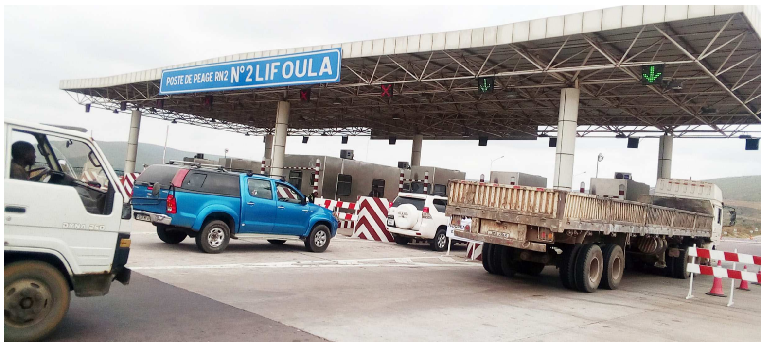
Le passage au poste de péage de Lifoula, sortie nord de Brazzaville