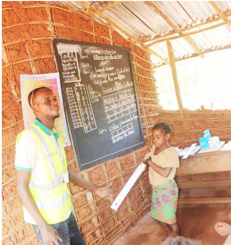
Un cours d'alphabétisation des peuples autochtones dans les écoles ORA

Dans la lutte contre l'analphabétisme et l'illettrisme, le pays a multiplié les initiatives. La politique nationale de la scolarisation de la jeune