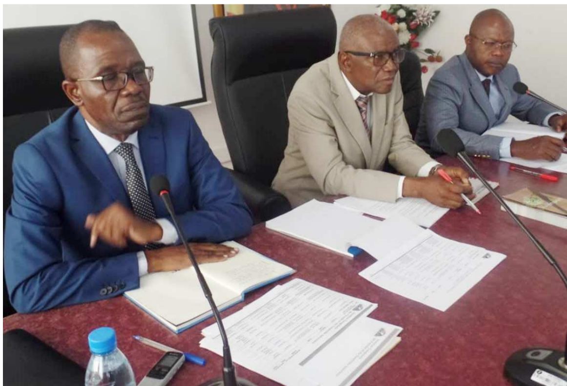
Les responsables de l'Icaci lors de l'assemblée générale

« C'est en tenant compte de ce qui précède, et à la demande de l'UFAI qu'Icaci a entamé le processus d'affiliation à l'IIA Global, dont l'une des exigences est la réforme des statuts. C'est ce à quoi nous nous employons. Selon nos statuts, c'est le genre d'affaire qui se traite en as-