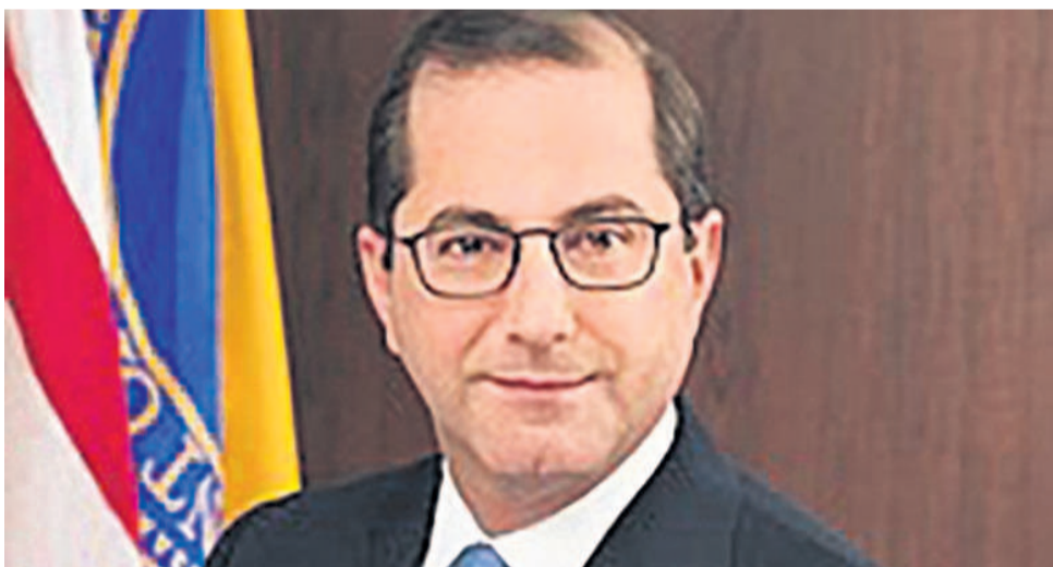
Alex M. Azar