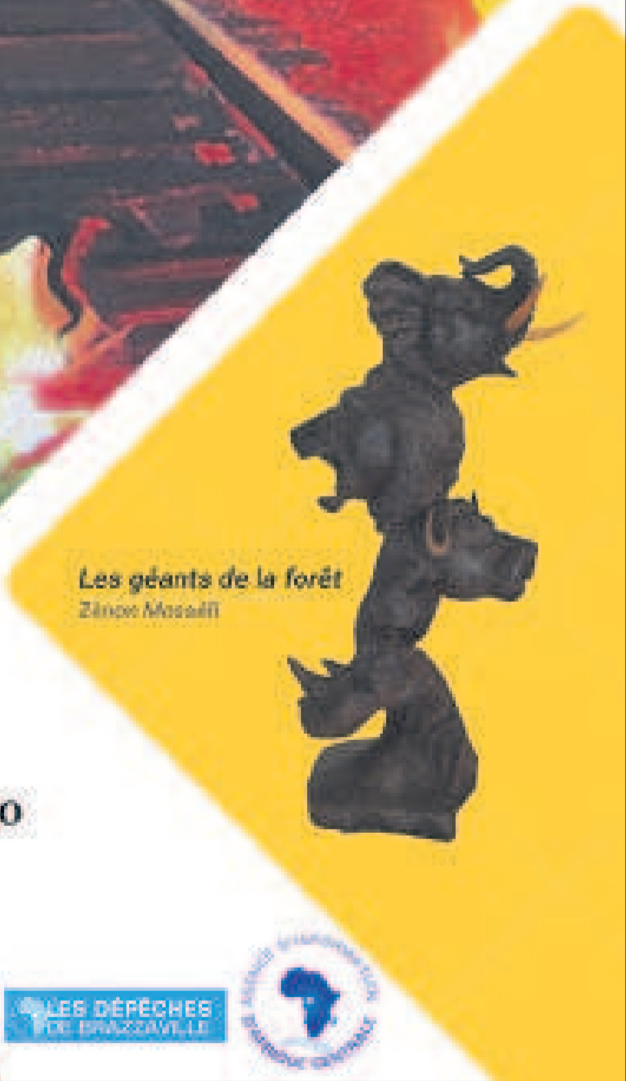
Les géants de la forêt Zénon Maselli