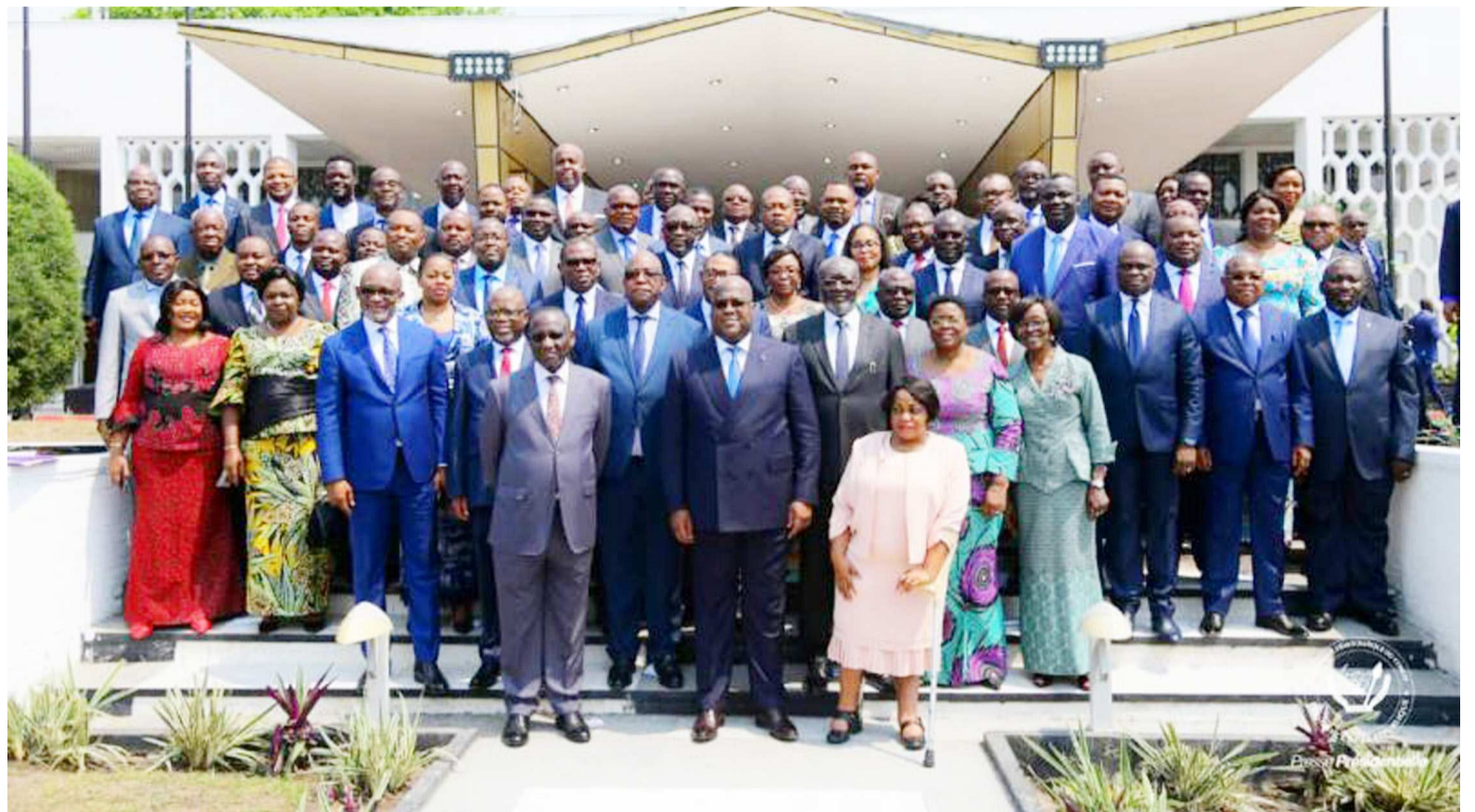
Félix Tshisekedi posant avec les membres du gouvernement

Les membres du gouvernement ont donc été appelés à se mettre