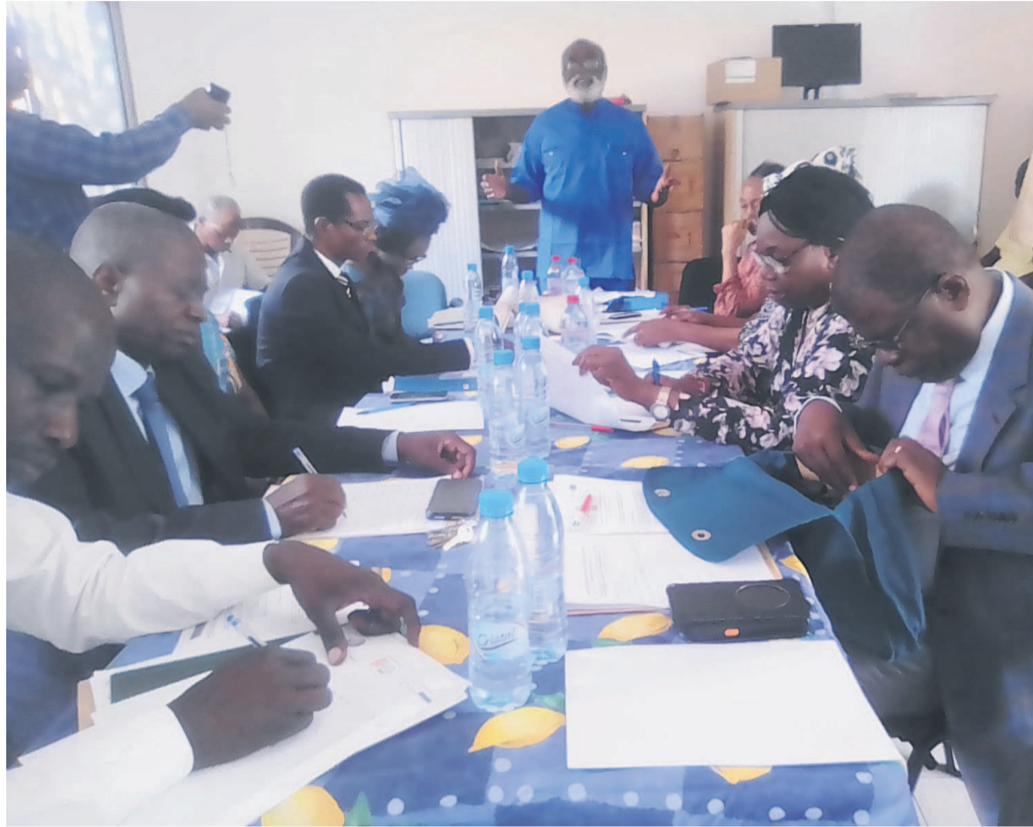
Une séance de travail des membres de l'ONDV&OC/Adiac

De telles exigences, a souligné l'ONDV&OC, ne sont plus à encourager dans les temps modernes. « Il y a des