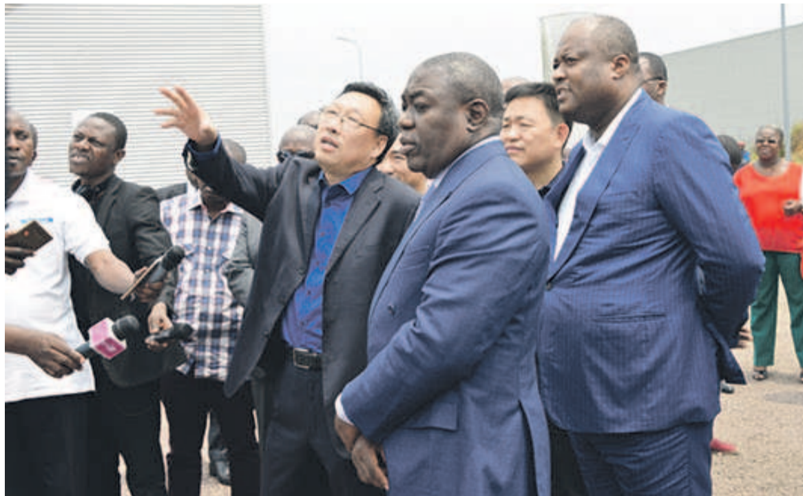
Le ministre en charge de l'Industrie, Gilbert Ondongo, sur le site de la société Camaco

« Nous avons six entrepôts où seront montés les tracteurs. Il s'agit de faire les assemblages et on va aller vite. Les tracteurs seront destinés au marché national, régional et continental. Il est question de booster l'agriculture au niveau national à travers cette nouvelle société. On va offrir des facilités à la population pour accéder à ces engins