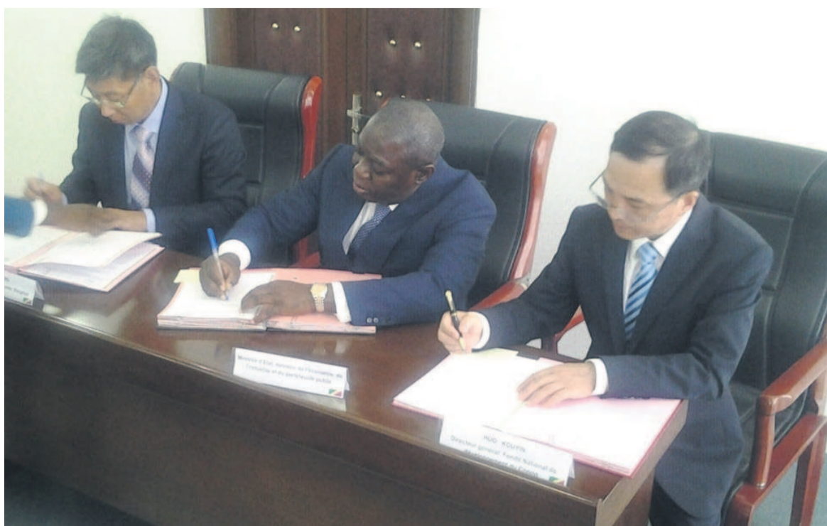
Les représentants du Congo et de la Chine signant le protocole d'accord

« Le fonds veut promouvoir l'économie du Congo ce, le plus vite que possible. Les ingénieurs chinois sont déjà prêts pour mettre en exécution le projet. Si les secteurs de l'industrie et des transports sont développés, le problème de l'économie congolaise sera réglé », a indiqué le directeur général du FNDC, dont la mission est de promouvoir l'investissement public et privé chinois en République du Congo.