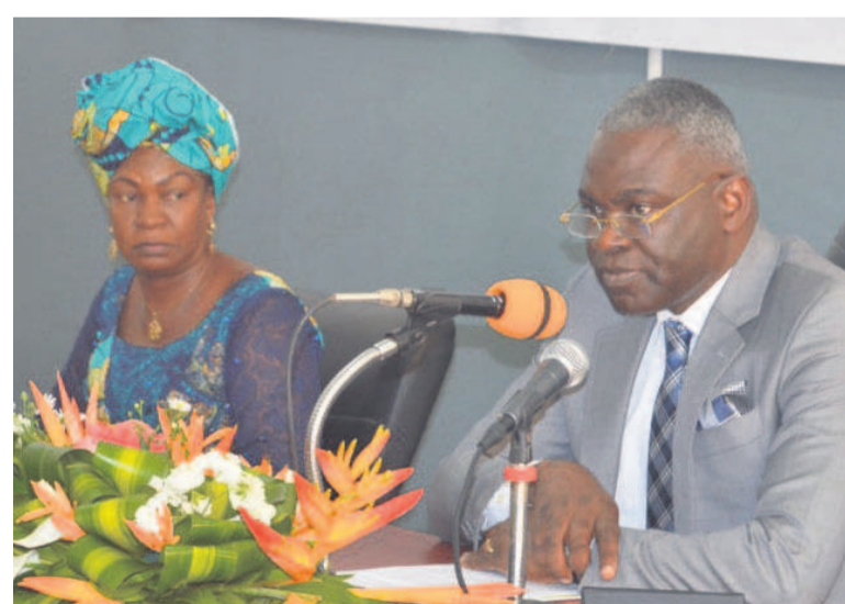
Le ministre Anatole Collinet Makosso ouvrant les travaux de la Commission administrative paritaire

« Il y aura amélioration de leur situation administrative »