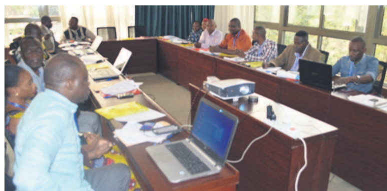
Les participants au séminaire

Dans le cadre de l'application du projet FERN, les membres des plates-formes et ONG congolaises en la matière ont participé, du 13 au 14 septembre à Brazzaville, à un séminaire portant sur leur implication dans l'exécution des politiques forestières.