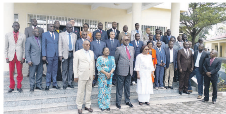
Au premier rang, la ministre de la jeunesse entourée des ministres du Sport et de l'éducation physique, de l'Enseignement technique et professionnel, de la formation qualifiante et de l'emploi