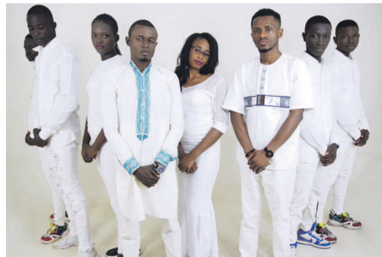
Le groupe Angels Amen

Quelques chansons du maxi single, notamment «Arrières de moi» et «Rabbi contrôle» sont déjà disponibles sur les plates-formes de téléchargement. L'opus en cours de finalisation compte six titres.