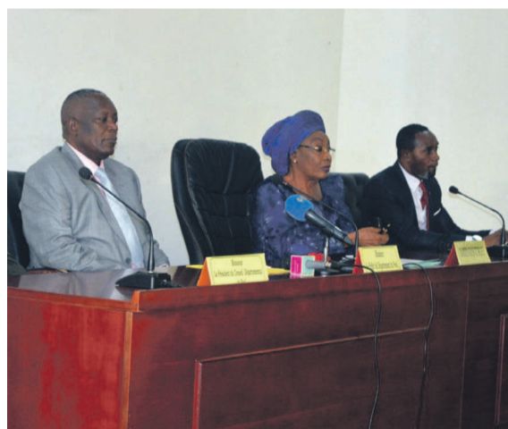
Le présidium des travaux

En rapport avec le mécanisme humanitaire dont s'est doté le Congo, la ministre des Affaires sociales et de l'action humanitaire, Antoinette Dinga-Dzondo, a lancé hier à Kinkala, chef-lieu du département du Pool, les ateliers départementaux visant à donner aux spécialistes des outils techniques pour une meilleure gestion des situations humanitaires d'urgence. La formation a pour objectifs, entre autres, de préparer les réponses adéquates et d'en amoindrir les risques. « L'action sociale, la prévention, la réduction des risques et la gestion des catastrophes sont de la compétence des collectivités locales », a-t-elle déclaré avant de solliciter leur implication effective. Page 4