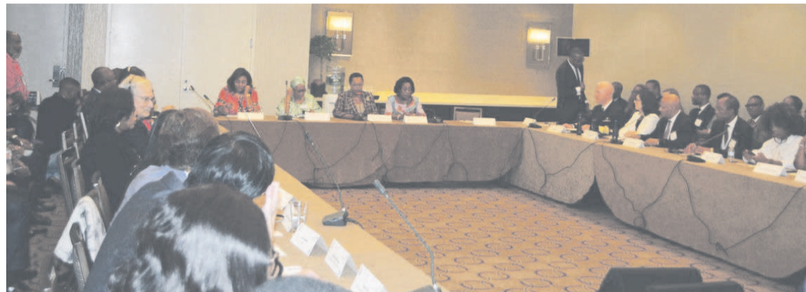
Les premières dames d'Afrique et les partenaires lors de la table ronde

a souligné la nécessité de faire que cette maladie soit prise en charge. Une vision qui ne pourra être concrétisée qu'à travers la formation et l'information. Pour lui, beaucoup reste encore à faire. S'agissant des progrès réalisés ces dernières années au Congo, il pense que des avancées significatives ont été enregistrées surtout chez les adultes.