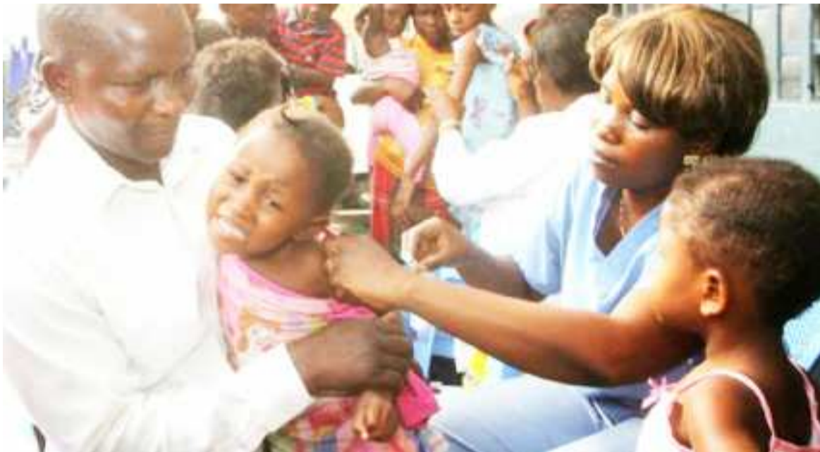
La rougeole affecte plus les enfants de moins 5 ans

Vingt-quatre zones de santé réparties dans les provinces de l'Équateur, Mongala, Kwilu, Kwango, Mai-Ndombe et Kasai oriental sont concernées par l'opération qui cible huit cent vingt-cinq mille enfants âgés de 5 à 6 ans et va durer neuf jours, soit du 24 septembre au 1er octobre.