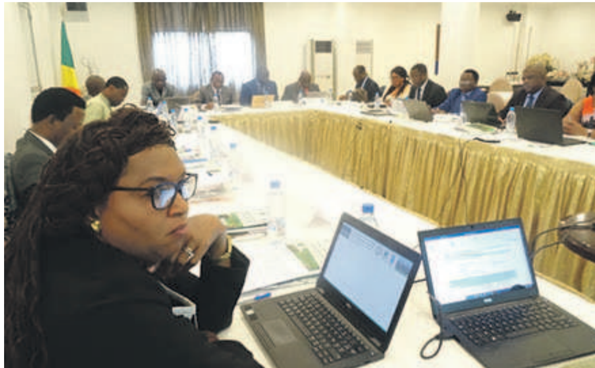
Les participants lors des travaux

Des délégués de six pays riverains se sont réunis à Brazzaville, le 26 septembre, pour tenter de peaufiner une stratégie dans le cadre de leur Projet de partenariat pour la conservation de la biodiversité.