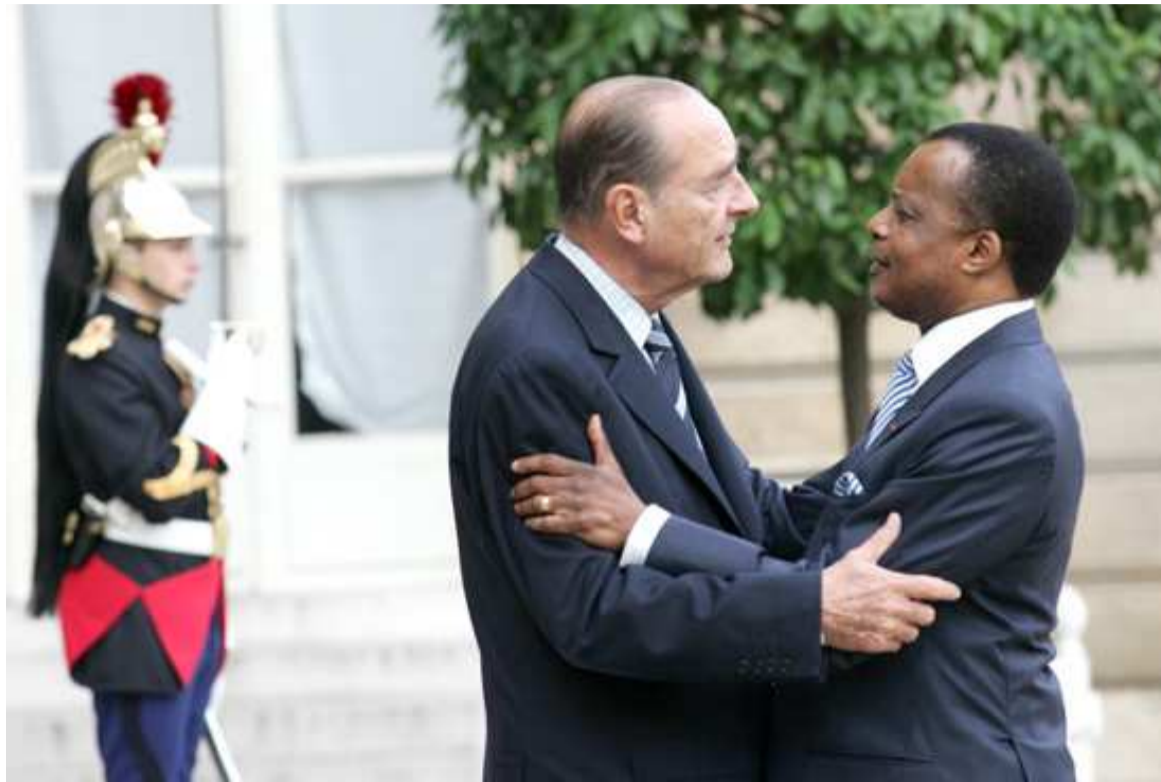
Jacques Chirac lors de la réception du Président Denis Sassou N'Guesso à l'Élysée en 2006

Proche d'Omar Bongo, d'Eyadéma Gnassingbé ou encore de Denis Sassou N'Guesso, Jacques Chirac a rendu plus vivantes les relations entre la France et l'Afrique, échappant aux accusations de financement frauduleux de ses campagnes politiques ou d'implication dans des ventes