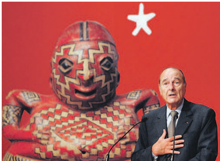
Jacques Chirac lors de l'inauguration du Musée du Quai Branly, le 20 juin 2006 à Paris

Chirac s'est finalement imposé avec les années comme un amoureux éclairé des arts d'Asie, d'Océanie et d'Afrique, signalant même cer-