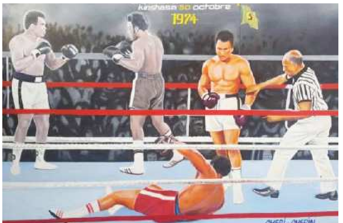
Le combat Mohammad Ali et George Foreman

L'exposition va se dérouler tout le mois de novembre au boxing beats avant d'être déployée dans d'autres lieux, centres d'entraînement, espaces culturels, entreprises, selon l'engagement que les commanditaires souhaitent développer pour capitaliser l'événement, adhérer à ces valeurs, fédérer les équipes, la population, ancrer une démarche sociétale, artistique et politique ». « Une