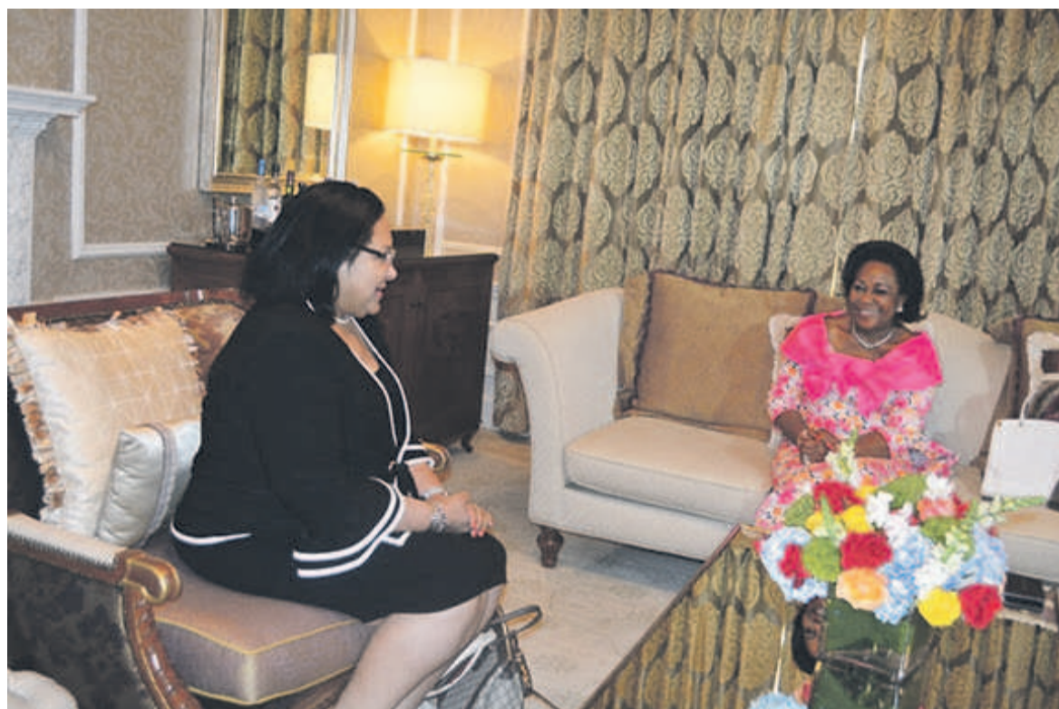
Antoinette Sassou N'Guesso échangeant avec la représentante de l'Onusida

L'Onusida a été créée en 1996 pour coordonner les actions de huit agences des Nations unies spécialisées dans la lutte contre le VIH/Sida, à savoir : le Pnud, l'Unicef, le Fnuap, l'OMS, l'Unesco et la Banque Mondiale, le Pnucid (depuis 1999) et l'Oit (depuis 2001).