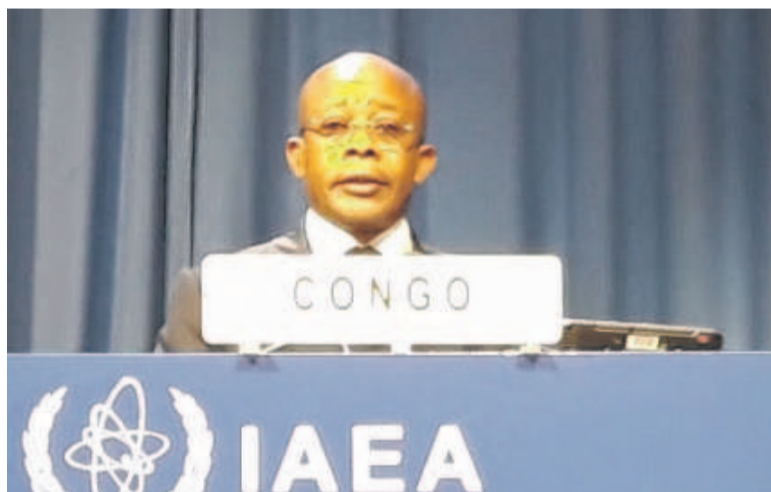
Le ministre de la Recherche scientifique délivrant son discours à la 63 e conférence de l'AIEA

Lors de la 63 e conférence générale de l'Agence internationale de l'énergie atomique (AIEA), le Congo s'est fait une place parmi les pays membres inscrits au second cycle 2020-2021 de ladite structure, avec trois nouveaux projets de coopération technique sur la surveillance de la pollution, les maladies tropicales négligées et le traitement des cancers.