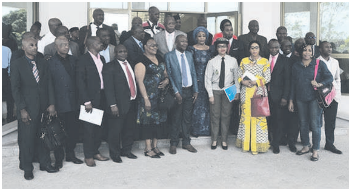
La photo de famille entre les autorités et les participants à la formation

Ces ateliers qui débutent dans le Pool pour s'étendre dans d'autres localités du pays donneront aux participants les outils leur permettant de maîtriser la hiérarchie des niveaux de