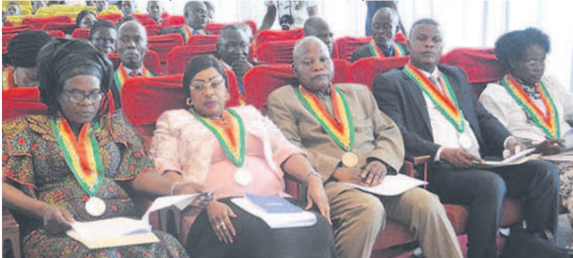
Les élus locaux attentifs au compte rendu des sénateurs

Le collectif des sénateurs de la ville capitale a effectué, le 23 octobre, une descente parlementaire, au cours de laquelle il a recueilli les préoccupations des conseillers départementaux et municipaux, notamment sur les problèmes que rencontrent les Brazzavillois au quotidien.