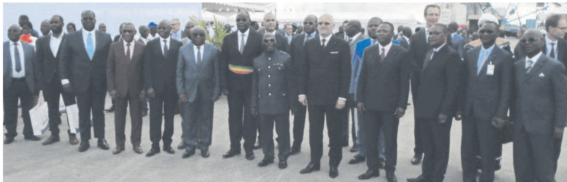
La photo de famille lors des 20 ans d'Ilogs

La célébration du 20 e anniversaire de la société ILOGS (Integrated Logistic Services), filiale du Groupe SNPC (Société Nationale des Pétroles du Congo) a eu lieu le 18 octobre dans ses installations situés dans l'enceinte portuaire en présence de deux membres du gouvernement à savoir Jean-Marc Thystère Tchicaya, ministre des Hydrocarbures et Fidèle Dimou, ministre des Transports, de l'aviation civile et de la Marine marchande. Les autorités départementales, les responsables des sociétés pétrolières et la communauté portuaire ont également pris part à l'évènement.