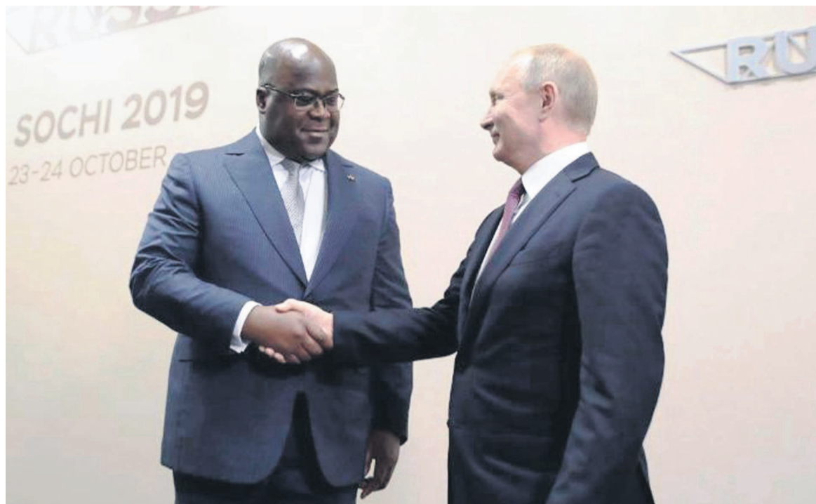
Poignée de main entre Félix Tshisekedi et Vladimir Poutine

De son côté, Vladimir Poutine, se disant heureux de rencontrer pour la toute première fois le chef d'Etat congolais, lui a exprimé, de prime abord, sa compassion à la suite de la catastrophe routière survenue le 20 octobre, dans la ville de Mbanza Ngungu (Kongo-central),