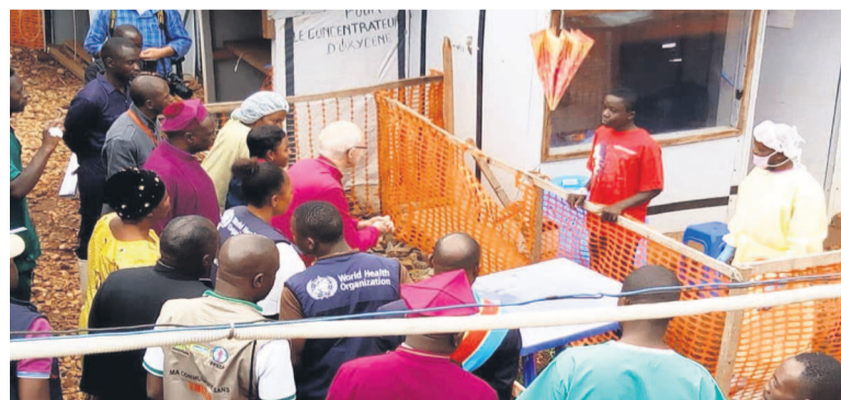
Le chef de l'Eglise anglicane au centre de traitement de Butembo

En séjour en RDC, l'archevêque de Cantorbéry, chef de l'Eglise anglicane, le révérend Justin Welby, a visité, accompagné de sa délégation, le 23 octobre, le Centre de traitement Ebola de Butembo, dans la province du Nord-Kivu. Sur place, il s'est entretenu avec un malade confirmé d'Ebola. Par la suite, l'archevêque et sa délégation se sont rendus à Beni