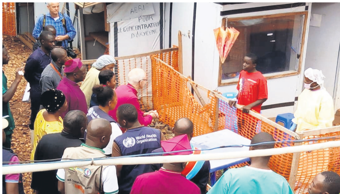
Le chef de l'Eglise anglicane au centre de traitement de Butembo

En séjour en République démocratique du Congo (RDC), l'archevêque de Cantorbéry, le révérend Justin Welby, accompagné de sa délégation, était le 23 octobre au chevet des malades admis dans le centre, échangeant à l'occasion avec l'un d'eux.