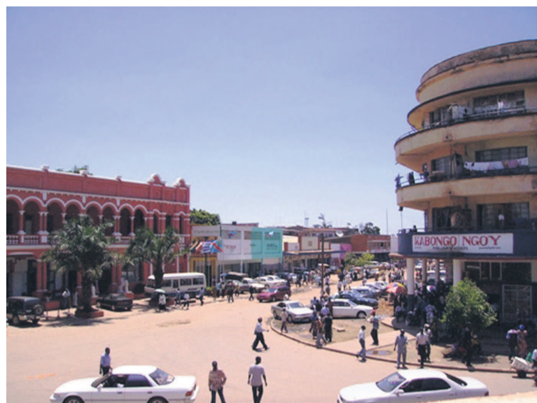
La ville de Lubumbashi

que cette attaque est la troisième du genre, pendant l'année en cours. Pour cette ONG, ces actes d'atteinte à la paix et à la sécurité