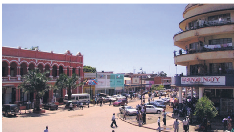
La ville de Lubumbashi

Selon l'IRDH, trois explications seraient données aux faits liés à cette énième incursion des miliciens armés dans le Haut-Katanga. La première, celle du groupe de Gédéon Kyungu, qui prétend ne rien avoir avec l'incursion du 11 octobre, la deuxième, qui accuse ce chef de milice d'être de connivence avec des politiciens véreux et des autorités militaires afin d'entreprendre des actes attentatoires à la paix et la sécurité dont ils tireraient, ensemble, des dividendes politiques, enfin, la troisième qui prétend que Gédéon Kyungu agirait de son propre chef, avec son mouvement