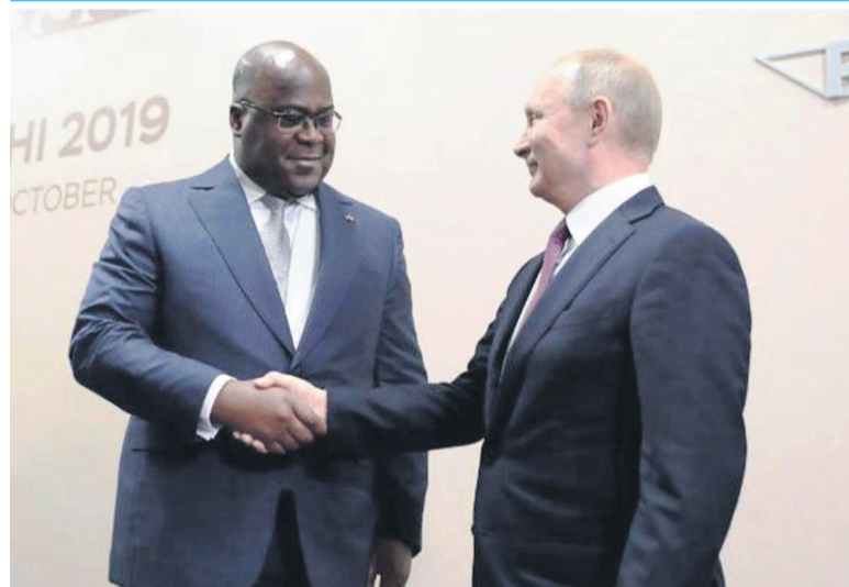
Poignée de main entre Félix Tshisekedi et Vladimir Poutine