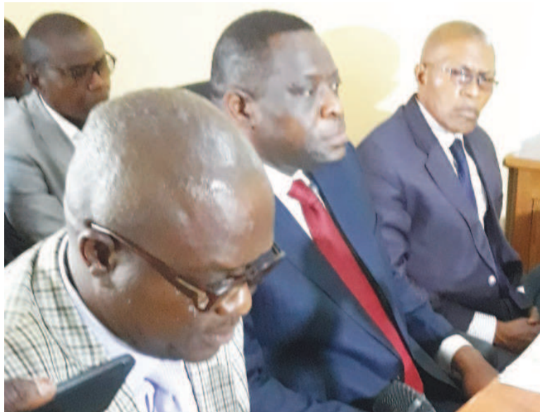
Les membres du bureau de l'ADU/Adiac

C'est ainsi que pour sa contribution au dialogue, l'ADU a suggéré le soutien par le gouvernement