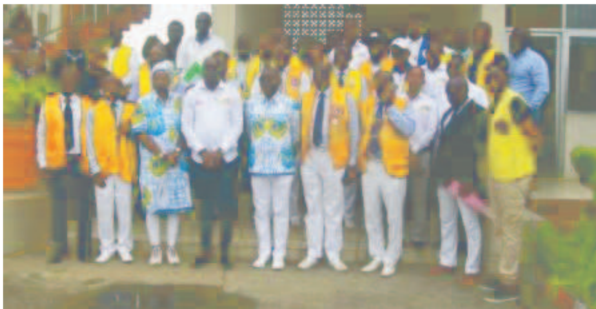
La photo de famille

Cette maladie chronique concerne plusieurs personnes, enfants, jeunes et plus âgées avec un chiffre en constante progression. « Si le diabète n'est pas bien contrôlé et suivi, l'état de santé du malade s'aggrave à long terme, le diabète peut être à l'origine de complications cardiovasculaires ou d'insuffisance rénale. C'est la première cause de cécité, l'une des principales causes de dialyse et d'amputations non traumatiques », a-t-il dit. Le nouveau gouverneur du district 403 B1 a énuméré l'importance de ce projet et donné