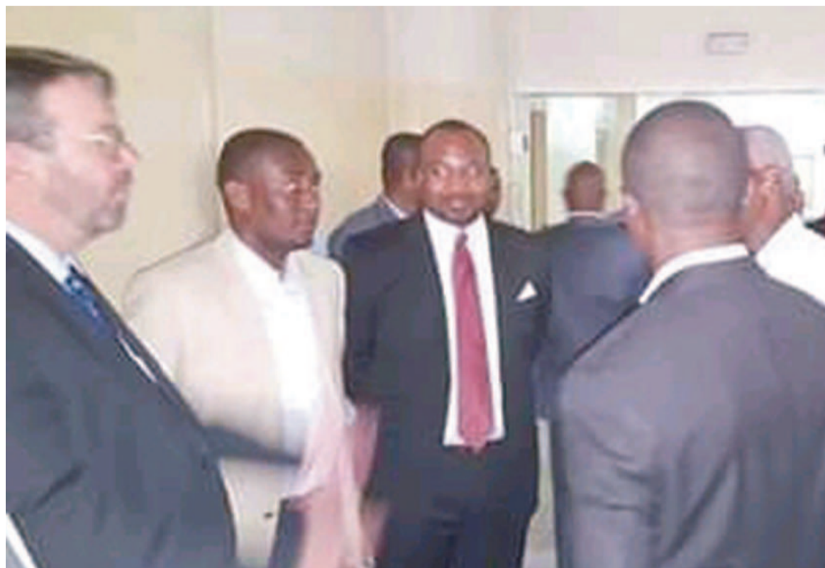
La délégation de la commission Économie, finances et du contrôle budgétaire de l'Assemblée nationale reçue au CHU/DR

La commission Economie, finances et du contrôle budgétaire de l'Assemblée nationale a effectué une visite de travail au Centre hospitalier universitaire (CHU) de Brazzaville, pour se rendre compte de son fonctionnement.