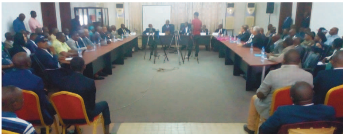
Une vue des opérateurs économiques à la réunion

montant global de cette dette intérieure, El Hadj Djibril Abdoulaye Bopaka a répliqué, bien que disposant des données, qu'il donne la latitude à l'Etat de mettre à leur disposition les résultats de l'audit réalisé.