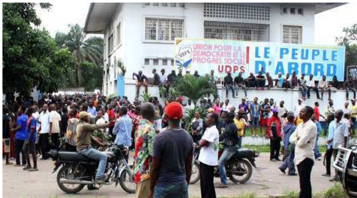
Des militants de l'UDPS devant le siège du parti à Kinshasa

L'IRDH alerte sur des éventuelles graves violations des droits de l'homme, prévenant par la même occasion le bureau du procureur de la Cour pénale internationale (CPI) sur la situation fragile de la République démocratique du Congo (RDC). Il indique que le PPRD et l'UDPS se livrent une guerre ouverte qui fissure la coalition