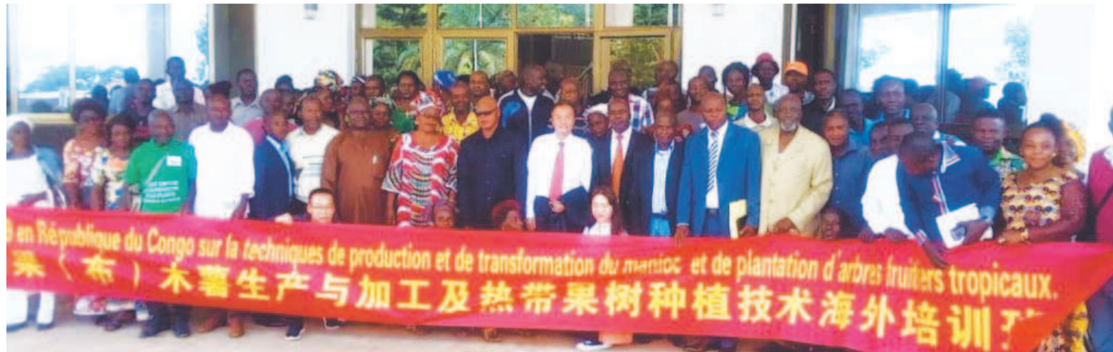
Photo de famille des participants à la formation agriculteur.