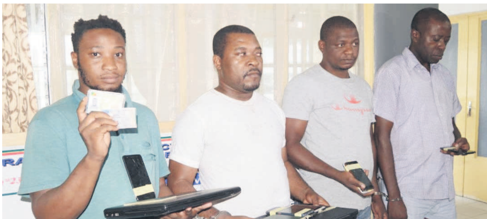
Les quatre arnaqueurs interpellés par la police à Brazzaville

Les actes de vol, d'escroquerie et d'arnaque se perpétuent sur la toile au point où il incombe aux utilisateurs des réseaux sociaux d'être vigilants afin d'éviter de tomber dans le piège.