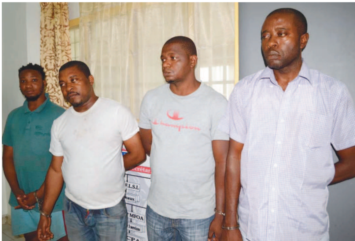
Les quatre arnaqueurs interpellés par la police à Brazzaville

Interpellés par les services de police du département de Brazzaville, les quatre malfrats ont reconnu les faits qui leur sont reprochés. Le directeur départemental de la police de Brazzaville, le colonel de police Jean Pierre Okiba, qui les a présentés le 11 novembre à la presse, appelle les Congolais à plus de vigilance et de prudence dans l'utilisation des réseaux sociaux. Selon lui, la cybercriminalité a atteint un niveau inquiétant. « (...) Les délinquants nouent des liens avec des victimes potentielles en leur miroitant des mariages et obtiennent de ces dernières des images érotiques. Une fois ces images obtenues, ils brandissent la menace de les publier sur la toile si jamais la victime ne leur