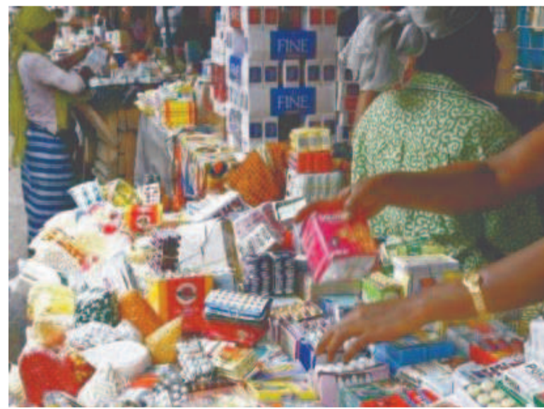
Vente des médicaments dans la rue

Selon le syndicat des pharmaciens, à ce jour, le secteur pharmaceutique n'arrive pas à répondre aux attentes du pays. Au contraire, il appauvrit de plus en plus la population dont il met la vie en danger.