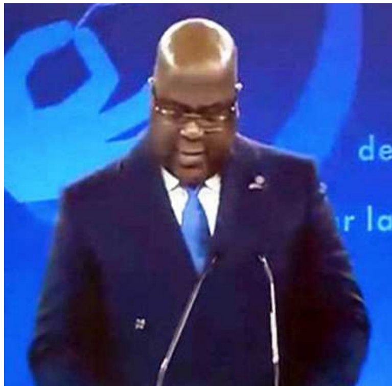
Félix-Tshisekedi au Forum de Paris

Félix Tshisekedi a proposé une recette, celle de la mise en œuvre d'une « coalition mondiale » censée prendre à bras le corps la problématique de paix à l'échelle internationale. Le chef de l'Etat congolais est convaincu que cette approche contribuera au rétablissement de la paix partout où elle est menacée à