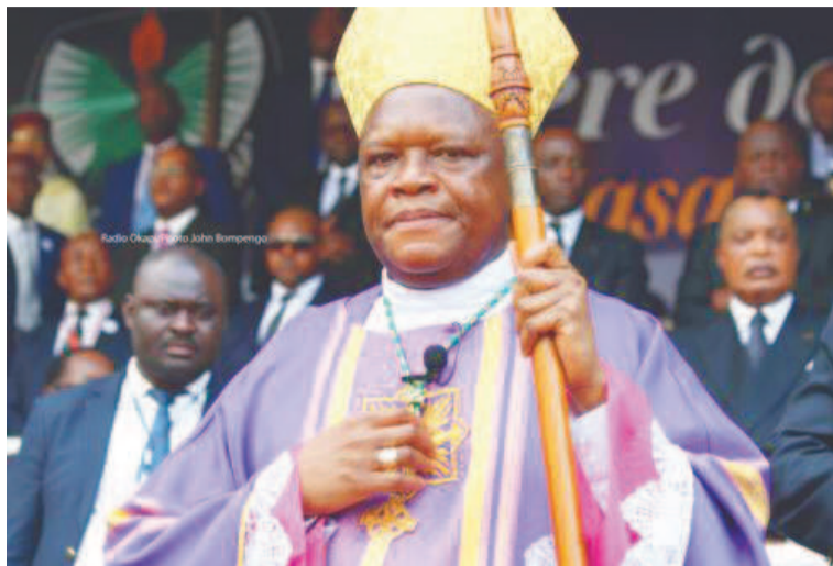
Le cardinal Fridolin Ambongo

Fridolin Ambongo veut donc être le cardinal de tous les Congolais, sans discrimination. « J'annoncerai l'évangile de Jésus-Christ dans sa radicalité », a-t-il indiqué. Evoquant les tribulations politiques en cours avec, à la clé, la tension