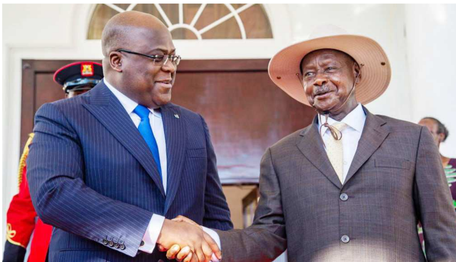
Félix Tshisekedi et Yoweri Museveni à Kampala