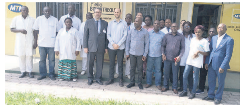
Les participants à la formation

Vingt-cinq cadres du Centre hospitalier universitaire (CHU) ont entamé, le 14 novembre à Brazzaville, un atelier de formation prévention et contrôle des infections pour la préparation aux épidémies.