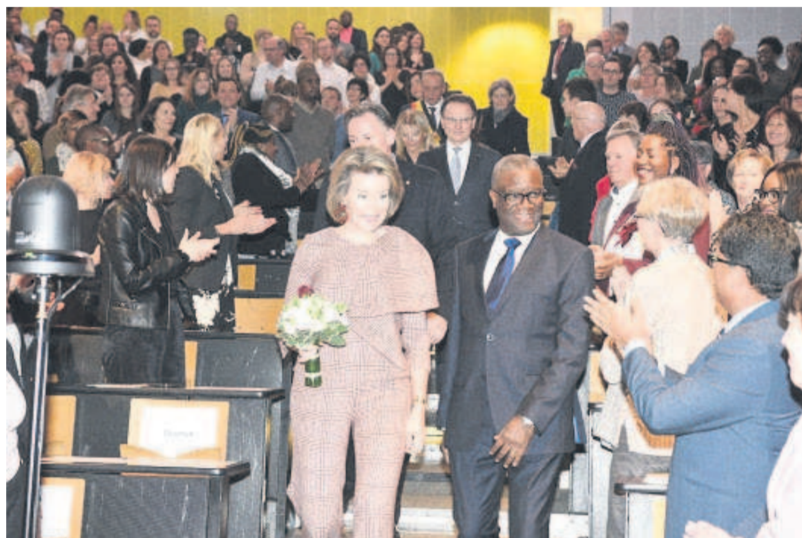
Le Dr Mukwege et la reine Mathilde pendant la cérémonie d'ouverture

Durant deux jours, les différentes conférences qui s'y déroulent vont revisiter les quatre piliers de la prise en charge holistique développée à Panzi par le Dr Denis Mukwege et son équipe : pilier médical, psychologique, juridique et socio-économique. « Au-delà de la force de notre colère et de la conviction en la justesse de notre engagement, notre sollicitude envers nos victimes nous invite aussi à asseoir nos démarches thérapeutiques sur des bases scientifiques. Ces pratiques, fondées sur des évidences scientifiques, renforceront notre autorité de parler de ces questions. Cette légitimité scientifique nous permettra de renforcer notre plaidoyer et permettre à tous ceux qui ont une parcelle de pouvoir à s'impliquer pour induire un changement systémique et positif. Sans base scien-