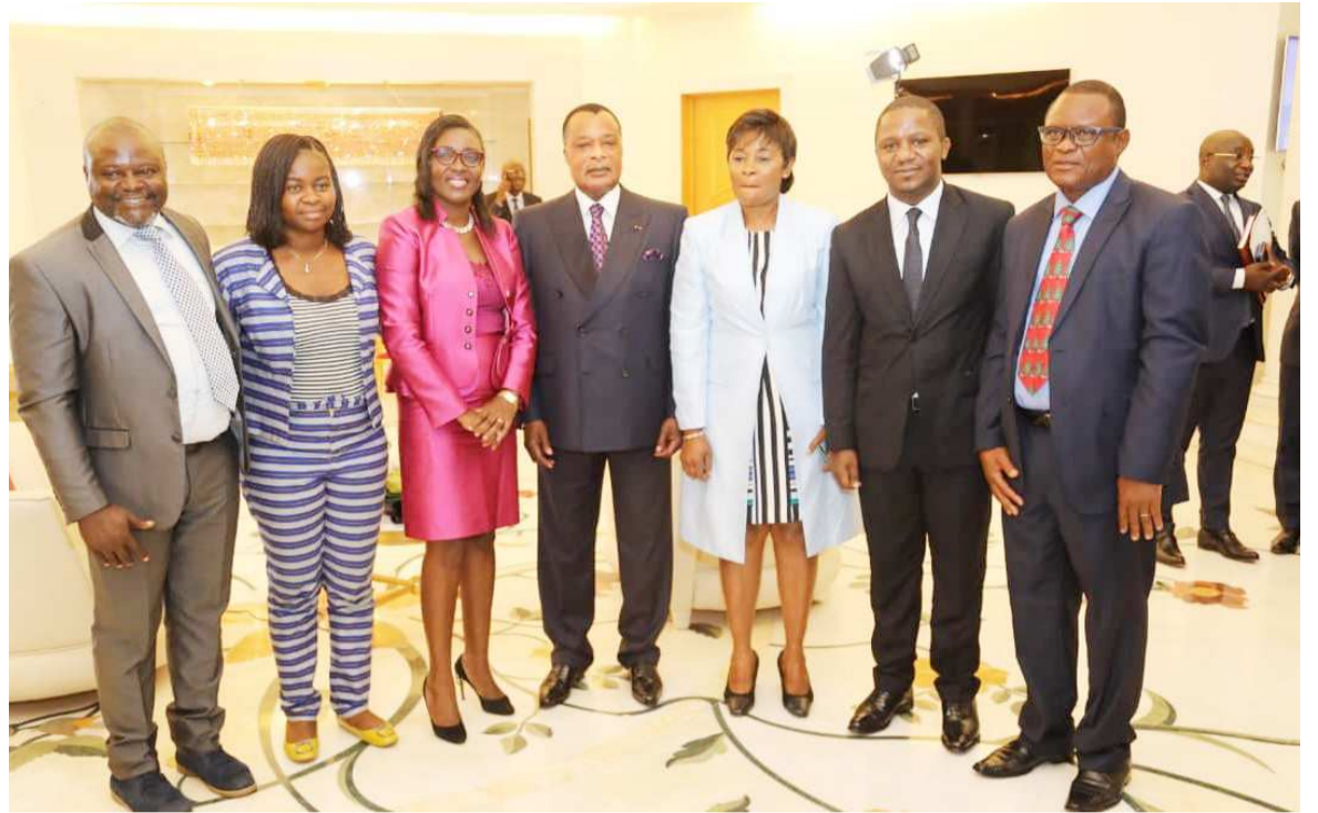
Le président Denis Sassou N'Guesso et la délégation des journalistes camerounais

Sur cette lancée, le président de la République a relevé des « signes encourageants » que représentent les tronçons routiers d'intégration construits ou en cours de l'être. En particulier la route reliant le Congo au Gabon