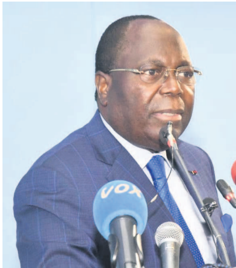
Le Premier ministre devant la représentation nationale

parce que beaucoup ont voulu en faire un fétichisme. Il a, par ailleurs, souligné l'intérêt de mettre en œuvre ces différentes