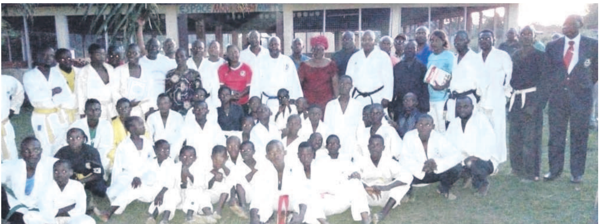
Les karatékas après l'assemblée générale