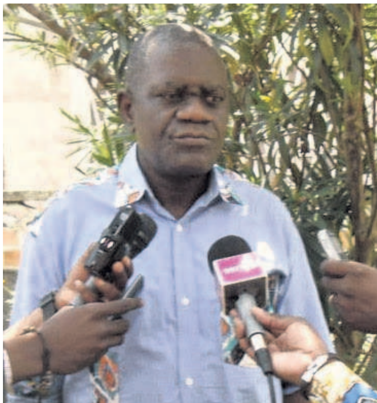
Le président de la CEJP face à la presse

Au ministère de l'Enseignement primaire et secondaire, chargé de l'Alphabétisation (MEPSA), sur onze projets présentés, un seul a été connu et les dix autres sont restés indéfinis. Pareillement, au ministère de l'Enseignement technique, professionnel, de la Formation qualifiante et de l'Emploi où, sur treize projets initiés, cinq sont visibles. Par contre, au ministère de l'En-