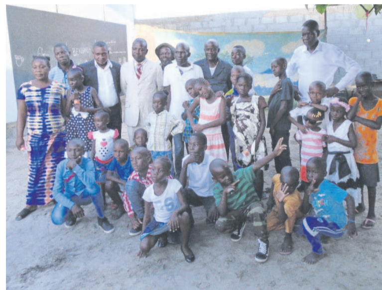
Les responsables, parents et enfants du quartier CCE posant ensemble

Fidèle à sa tradition, le Cercle culturel pour enfants (CCE) a organisé le quart de Noël, le 25 décembre, à Louessi dans le 6e arrondissement Ngoyo en offrant aux enfants un repas convivial et des présents.