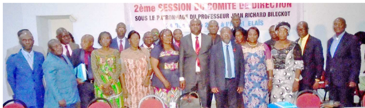
Les participants à la 2e session du comité de direction

La 2e session du comité de direction de cette structure sanitaire, tenue le 24 décembre, a pris fin par l'adoption de nombreuses recommandations visant l'amélioration de la qualité des soins.