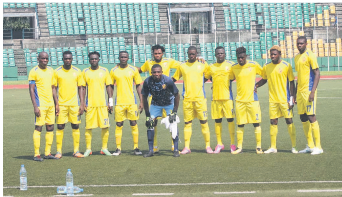
La JST sera face à AS Cheminots à l'ouverture de la treizième journée