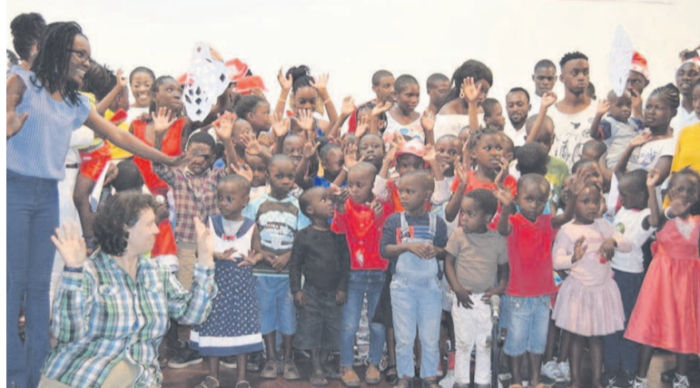
Les enfants manifestant leur joie à l'issue de la cérémonie

L'événement organisé en partenariat avec le Centre culturel russe (CCR) a eu lieu au sein dudit centre sur le thème « Un sourire pour les enfants. »