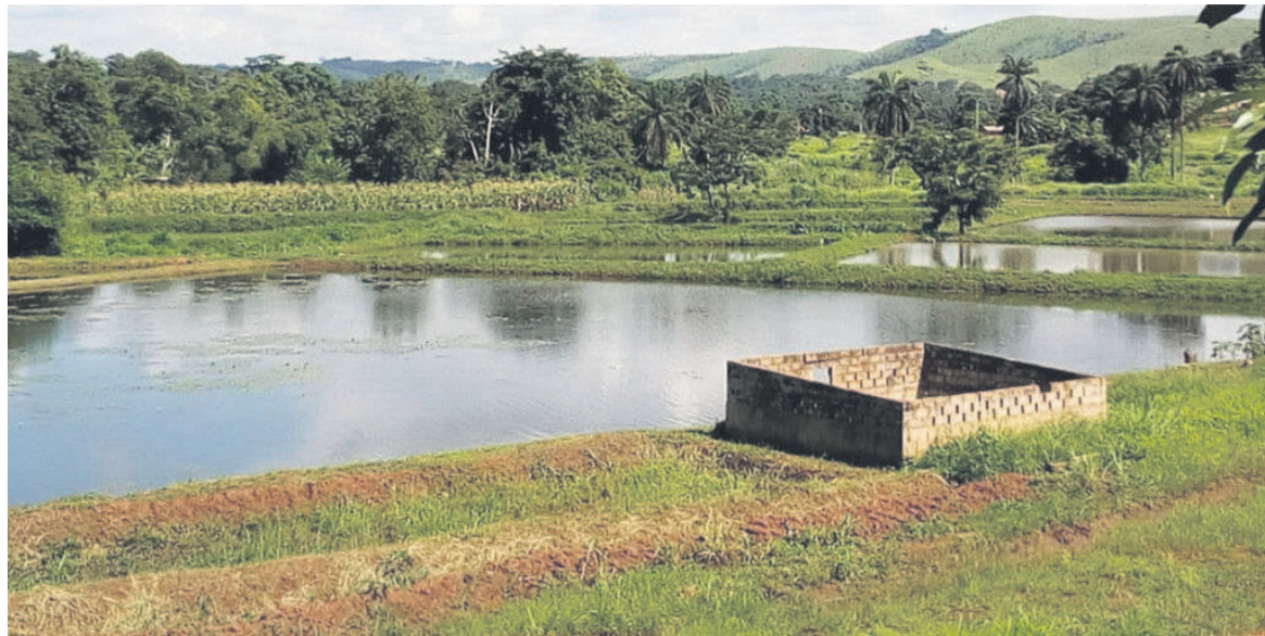
Les étangs réhabilités

Les travaux de réhabilitation de la station piscicole domaniale ont été réalisés grâce au soutien du Programme alimentaire mondial et de l'Organisation des Nations unies pour l'alimentation et l'agriculture (FAO). D'après le chef de la station, Emmanuel Banimba, l'État congo-