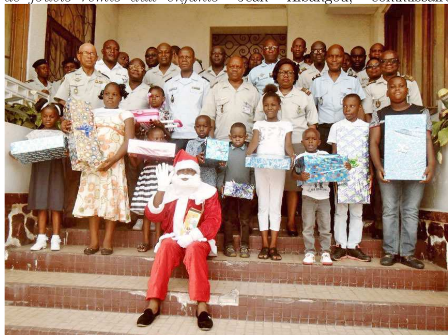
Les officiers et les enfants bénéficiaires de jouets