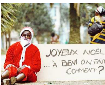
Le père Noël au visage sanguinolent

Le personnage mythique, la mine défaite assis à même le sol, le visage marqué par une entaille dont le sang coagulé tâchait sa barbe blanche présen-