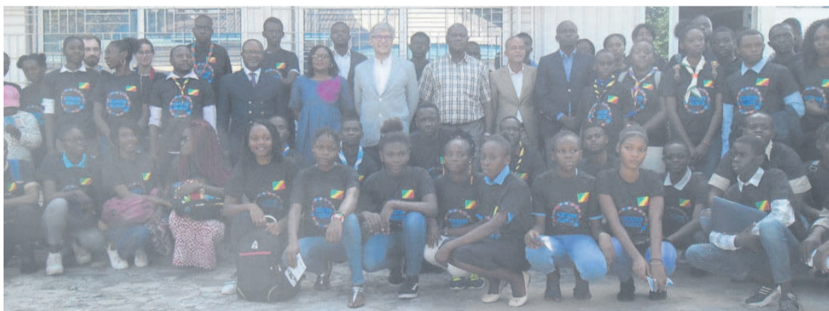
Les jeunes éduqués sur le projet

Le directeur de cabinet du ministre de la Jeunesse et de l'Éducation civique a lancé récemment à Brazzaville le concours « Youth challenge ». Une compétition sur les idées et projets innovants des jeunes de 14 à 24 ans organisée par le Pnud et l'Unicef.