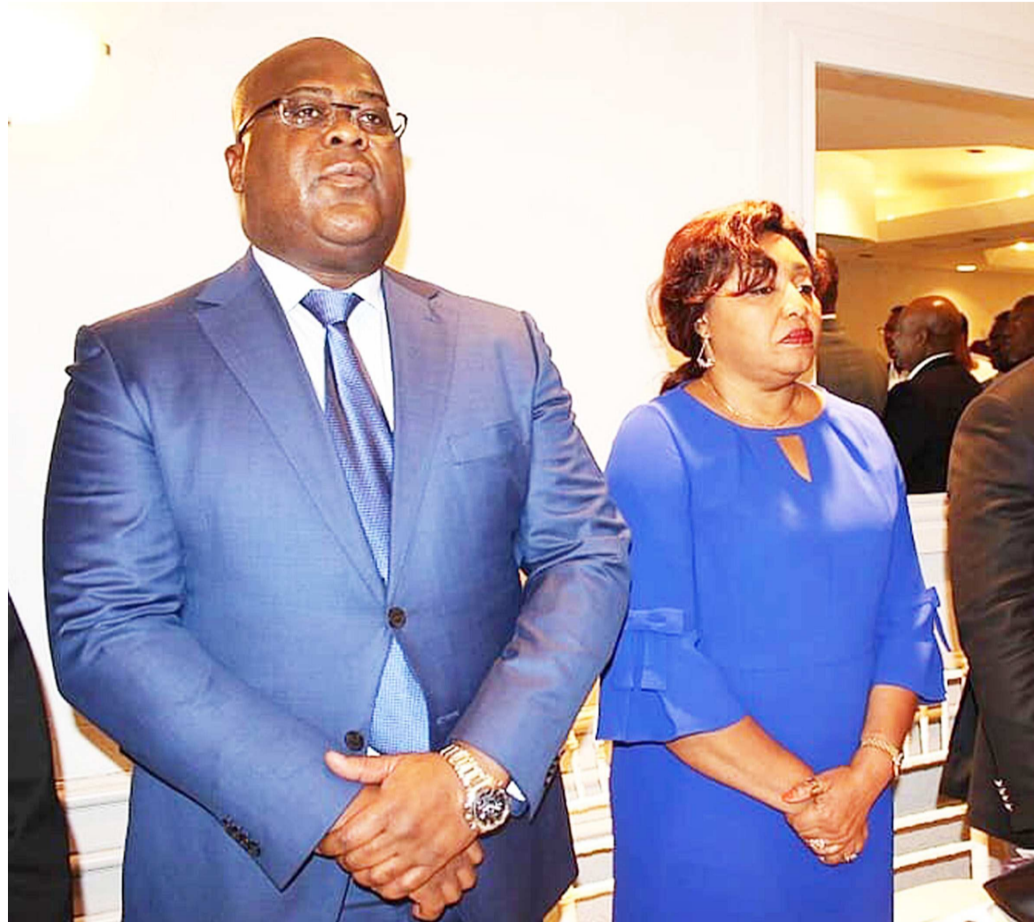
Le couple présidentiel

Dans une vidéo laconique diffusée sur la chaîne nationale en cette journée de la célébration de la Nativité, dans laquelle il s'affiche avec la première dame, Denise Nyakeru, le chef de l'Etat s'est, de nouveau, adressé à ses compatriotes dans un style plutôt édulcoré qui tend à faire école au plan communicationnel. L'émotion et l'humilité y étaient présentes, la proximité et la complicité aussi, le tout agencé dans un décor sobre où seul le fond du message importait. Tout un style qui tranche nettement avec la solennité et le côté majestueux qui caractérisaient autrefois les adresses présidentielles de fin d'année.