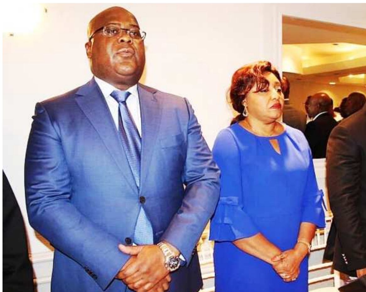
Le couple présidentiel

Dans une vidéo diffusée sur la chaîne nationale, le mercredi 25 décembre, dans laquelle il s'affiche avec la première dame, Denise Nyakeru, le chef de l'Etat s'est, de nouveau, adressé à ses compatriotes dans un style édulcoré