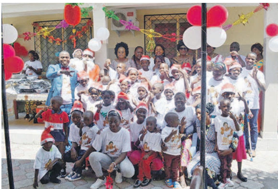
Photo de famille à l'orphelinat Saint Antoine de Padoue

Au Complexe Crèche, Pouponnière et Garderie de Makélékélé, la ministre des Affaires sociales et de l'Action humanitaire a remercié la Première dame du Congo pour « le symbolique geste en faveur de l'enfant vulnérable ». « Nous disons une fois de plus merci à cette grande dame de cœur pour nous avoir soulagés