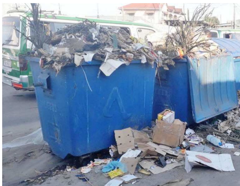
Les bacs à ordures débordées

Depuis quelque temps, les bacs à ordures d'Averda sont de plus en plus submergés de déchets.