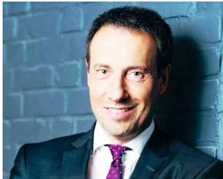
Philippe Goffin, le nouveau patron de la diplomatie belge

litiques à Kinshasa avant de se rendre au chef-lieu du Haut-Katanga pour procéder à la réouverture du consulat général de Lubumbashi. Ce seul poste diplomatique belge dans la partie orientale de l'immense RDC avait été fermé en jan-