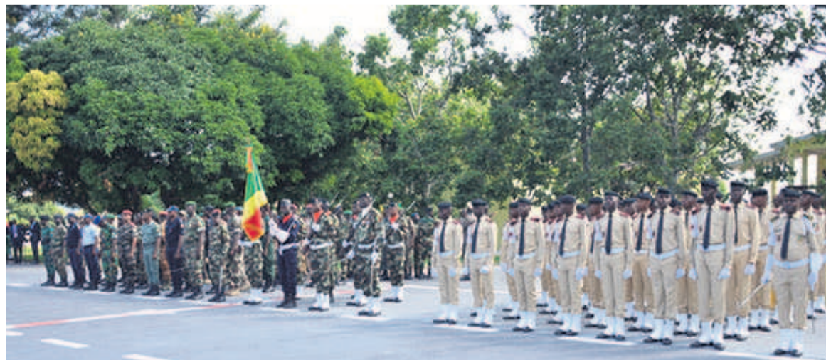
Une vue des troupes avant la parade militaire

« C'est l'occasion d'affirmer que l'ouverture à l'international de l'académie militaire est une réalité en harmonie avec les très hautes orientations du président de la République sur la coopération internationale, régionale et sud-sud, visant la paix, la sécurité et la stabilité en Afrique »