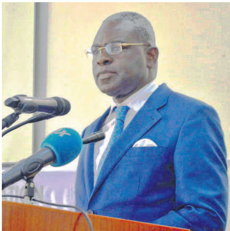
Le ministre Anatole Collinet Makosso s'adressant aux proviseurs et chefs d'établissements publics et privés

Pour les taux de déclaration et de délivrance des titres d'admission, c'est 2000 FCFA pour le Congolais et le double pour un sujet étranger. L'authentification et la légalisation des attestations et relevés de notes sont fixés à 1000FCFA pour le Congolais et 2000FCFA pour l'étranger. Il faut souligner que les taux et les opérations ne sont pas détaillés ici de façon exhaustive.