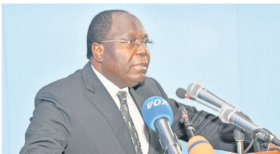
Le Premier ministre Clément Mouamba

À la faveur de la question d'actualité organisée le 6 février à l'Assemblée nationale sur des mesures prises par l'Etat pour protéger les cent cinq étudiants congolais basés à Wuhan, en Chine, foyer de l'épidémie du coronavirus, le gouvernement s'est engagé à débloquer deux cents millions de FCFA.