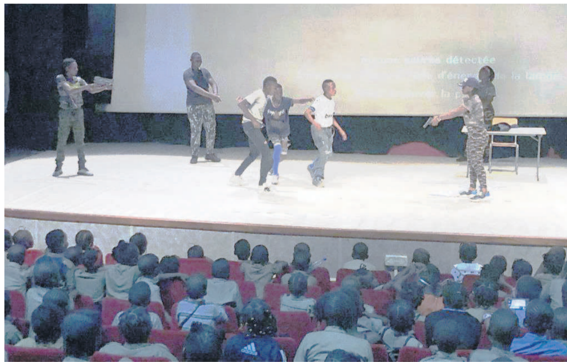
Les élèves sur scène

C'est avec enthousiasme que les élèves des écoles Immaculée Conception, Dom Helder Camara, Antonio Agostinho Neto B, Lamartine, E. Patrice Lumumba sont montés sur scène pour présenter leurs créations. Comme l'indique le thème de cette édition, les enfants de préscolaire de l'école Lamartine n'étaient pas restés