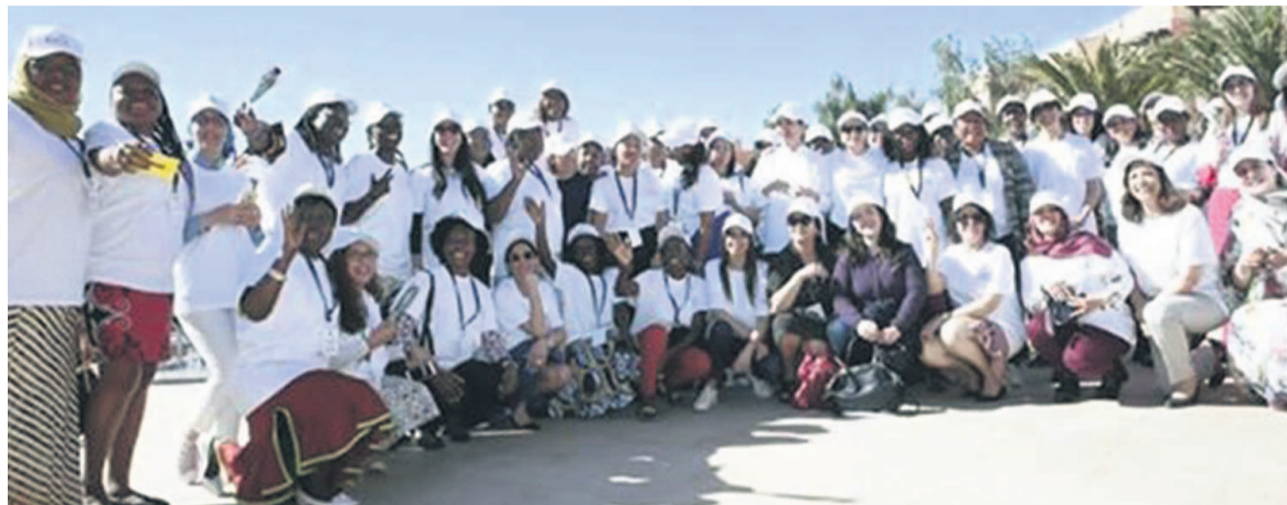
Photo de famille des panafricaines à la première édition au Maroc

La troisième édition du forum des Panafricaines se tiendra du 6 au 7 mars à Casablanca au Maroc avec pour thème : « les changements climatiques et leur impact sur le continent africain ».