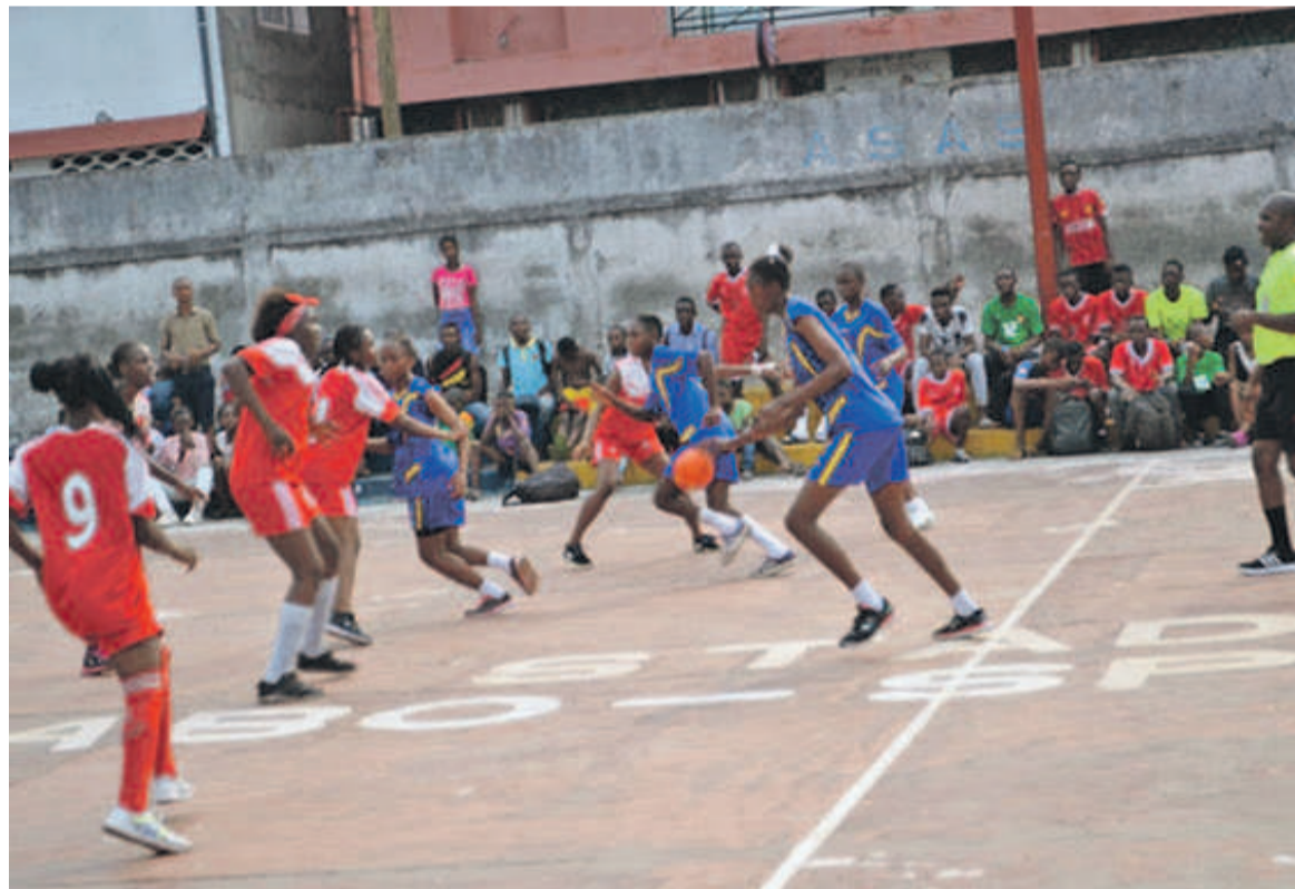
Séquence du match DGSP-AS Neto lors de la première journée

Onze rencontres sont prévues au stade Abo sport, à Ouenzé, dans le cadre de la troisième journée de la compétition qui réunit plusieurs clubs évoluant à Brazzaville afin de leur permettre de préparer le championnat départemental.