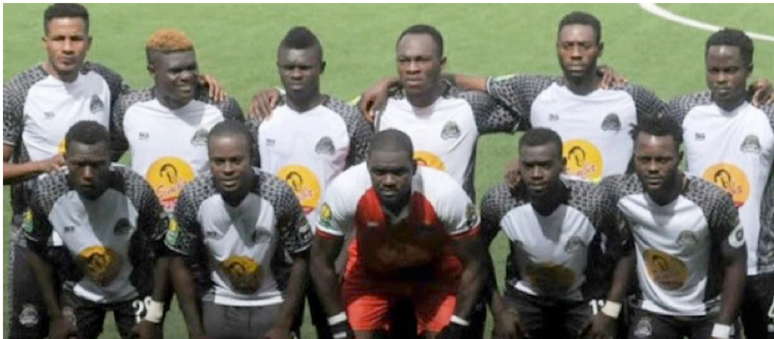
Tout-Puissant Mazembe de Lubumbashi

La CAF a procédé, le mercredi 5 février, au Caire en Egypte au tirage au sort des quarts de finale de la Ligue des champions d'Afrique ainsi que la Coupe de la Confédération. La République démocratique du Congo (RDC) est représentée à ce niveau de la compétition par un seul club, le Tout-Puissant Mazembe de Lubumbashi, qualifié pour les quarts de finale de la C1 africaine. V.Club, dernier de son groupe, n'a pas pu accéder en quarts de finale. Et en Coupe de la Confédération, le Daring Club Motema Pembe (DCMP) a loupé, de peu, la qualification à cette étape de la C2 africaine. L'adversaire de Mazembe en quarts de finale de la Ligue des champions, c'est le Raja de Casablanca qui a été premier, deuxième du groupe de V.Club, derrière l'Espérance sportive de Tunis. Le club marocain aura