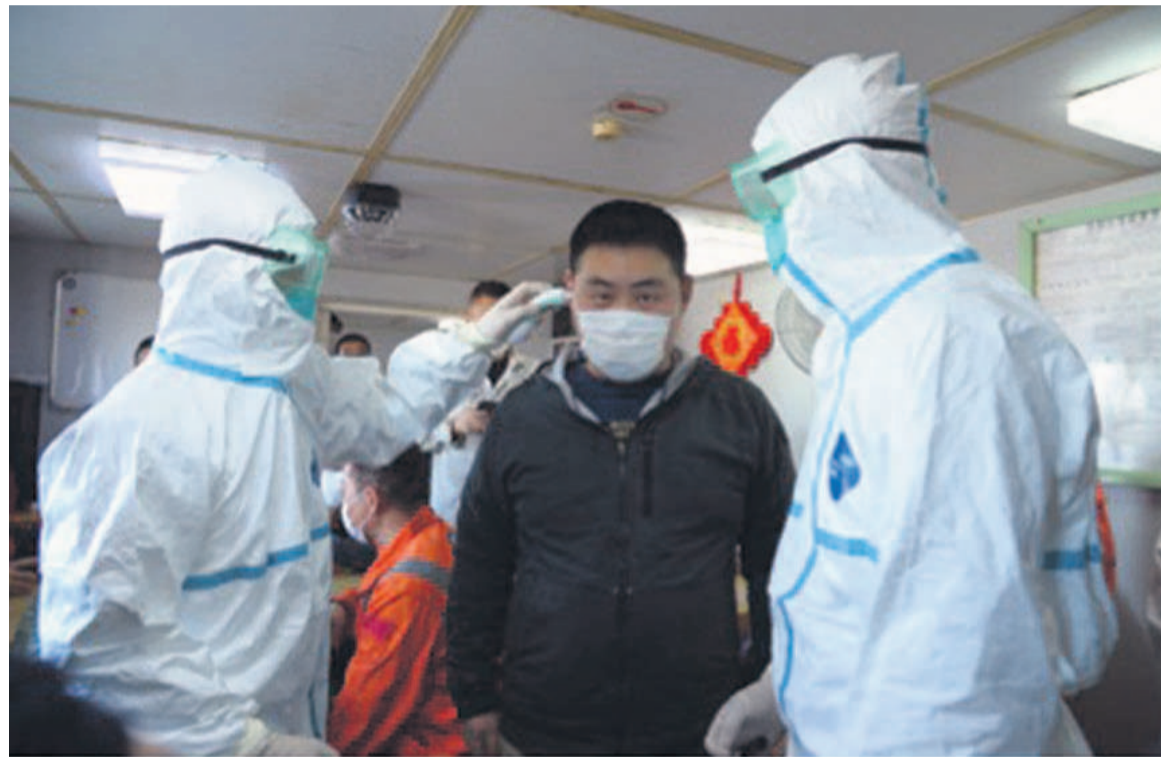
Le 1er février 2020, les agents de douane de la ville de Taicang de Nanjing dans le Jiangsu prennent la température des membres d'équipage d'un navire international stationné au port de containers de Taicang et effectuent des mesures d'inspection et de quarantaine sur les légumes et la viande stockés dans le navire.

Par Jiang Xiaodan, Journaliste au Quotidien du Peuple