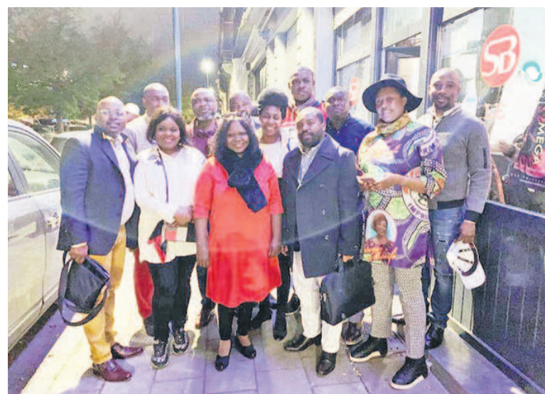
Photo de groupe de la Caravane des Voix de la Diaspora lors de l'escale de la Belgique en 2019

Les organisateurs de la Caravane des voix de la diaspora se rendront à Berlin sur invitation de l'association des ressortissants du Congo en Allemagne.