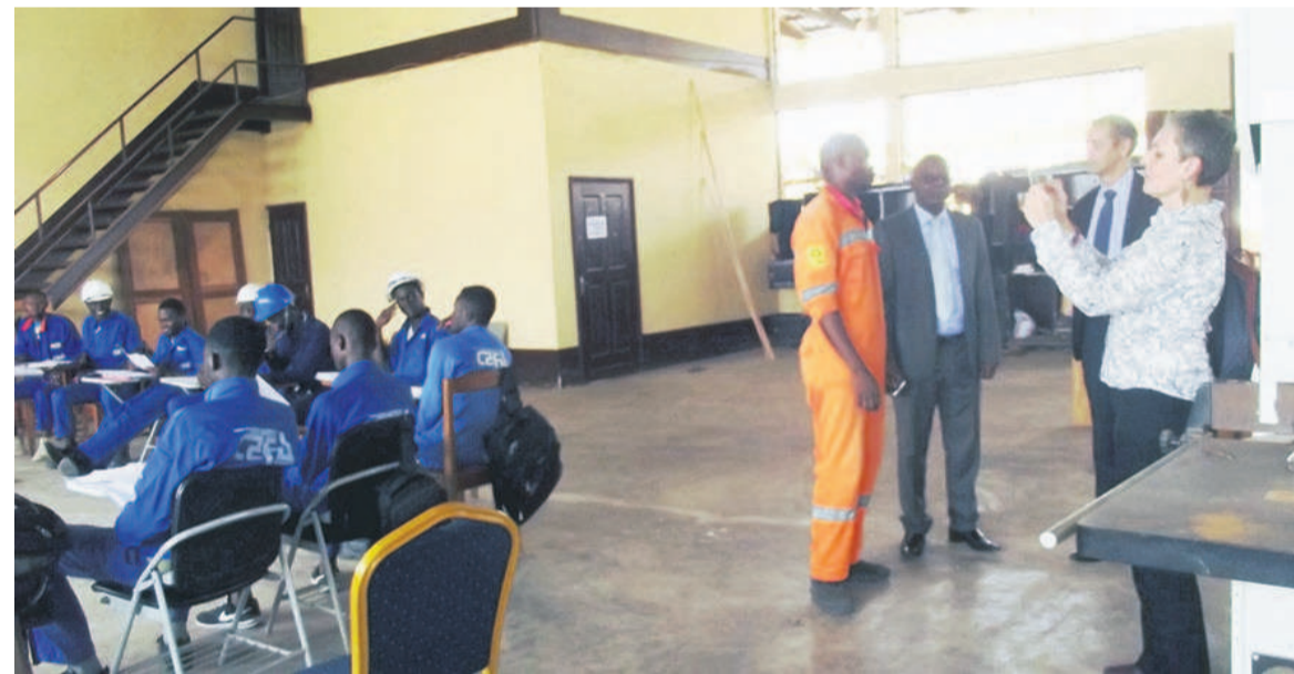
La délégation à l'atelier de menuiserie, charpente-bois-couverture