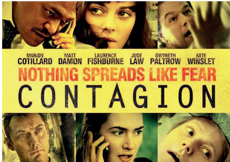
Affiche du film

Ce qui rend « Contagion » profondément pertinent aujourd'hui, c'est d'y voir l'impact du virus dans ce monde globalisé et dans un contexte médiatique de défiance et de rumeurs. Le réalisateur a su trouver le langage cinématographique pour interroger de manière complexe l'éthique humaine face à ce genre de crise. Du long-métrage, il en ressort un conte philosophique dont la morale était d'ailleurs inscrite sur l'affiche « rien ne se propage mieux que la peur ». Le film loué pour son exactitude