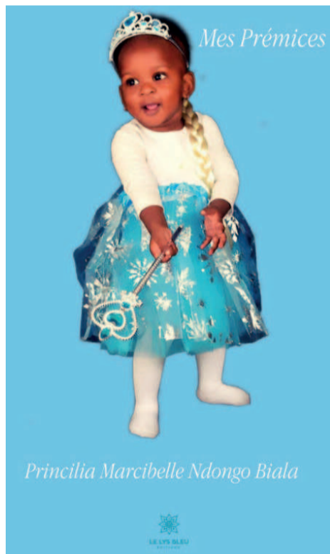
Couverture de l'ouvrage

Dans ce lot des êtres dignes de vénération se trouvent les géniteurs (la parenté proche), dans le contexte du matriarcat, la figure maternelle est une porte d'entrée à l'existence. L'auteure immortalise aussi son défunt grand-père éponyme, une leçon de reconnaissance pour encourager le sens de la famille qui s'étiole de plus en plus au milieu d'une génération qu'on dirait, par ironie, « en voie d'apparition ». Pour ouvrir ou élargir son cercle d'inspiration, l'auteure exalte avec nostalgie certains virtuoses aux suaves sonorités, Jacques Loubelo, Roga-Roga d'Extra-musica, Rochereau Tabu Ley. On peut donc se livrer à une kyrielle de comparaisons pour montrer le génie pluriel ou protéiforme de cette plume émergente dont la clameur fait écho au rêve altruiste et fé-