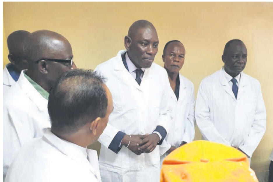
Le directeur régional du Fnuap en visite à l'hôpital de Talangai