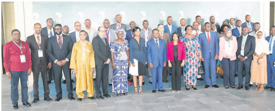
Les ministres et chefs de délégations posant en famille à l'issue de la cérémonie d'ouverture

Le ministre de l'Environnement et du développement durable de la Côte-d'Ivoire, Joseph Seka Seka, président sortant de la Convention de Bamako, a rappelé que les préoccupations aux sujets des mouvements transfrontières des déchets dangereux et la mise en oeuvre des contrôles internationaux, ont déjà abouti à la signature de deux accords historiques qui sont : la Convention de Bâle visant à contrôler les mouvements transfrontières et l'élimination des déchets dangereux (y compris des déchets radioactifs), sur le contrôle des mouvements transfrontières et sur