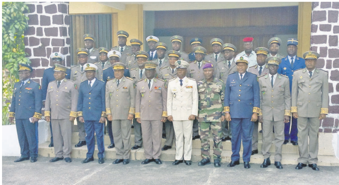
Photo de famille des participants à la conférence de planification

« A la lumière des missions à nous confier, il importe pour nous et pour tous de travailler avec abnégation afin de tenir les délais dans l'esprit des repères fixés, à savoir le repère un, de janvier à février, nous interpelle pour que les travaux de planification et de programmation à tous les niveaux des échelons de