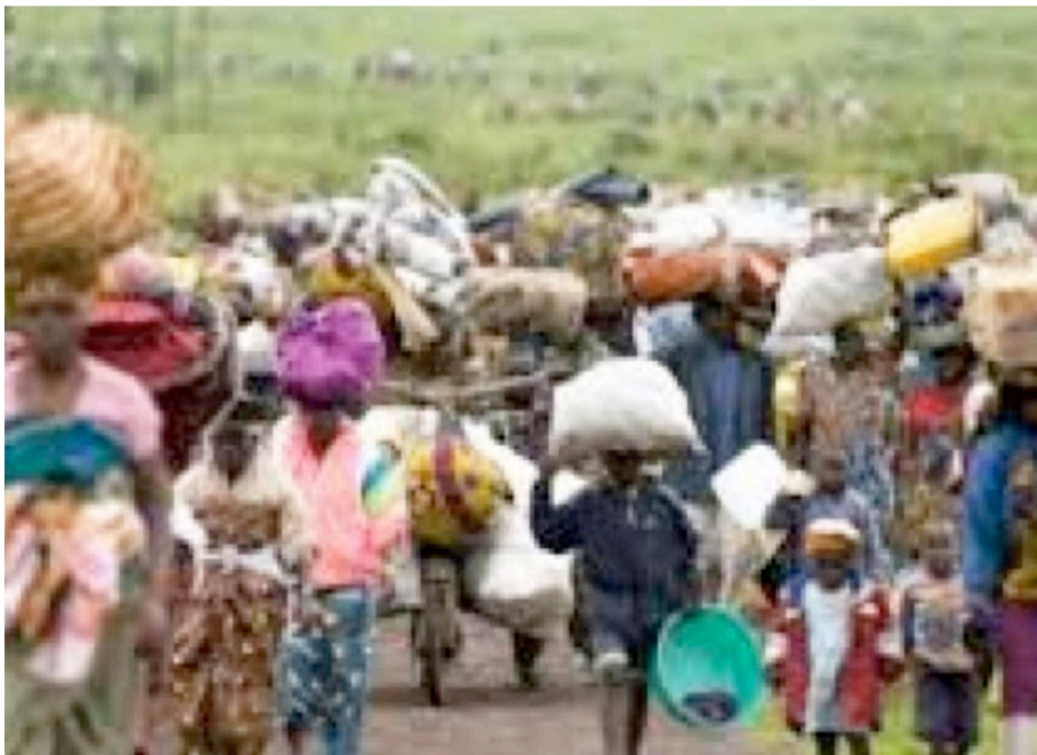
Mouvement des populations dans l'est de la RDC/DR

Dans un message du 12 février, les jeunes nande de Kinshasa réunis au sein de la Cojeunak demandent à la population de s'organiser avec tous les nécessaires pour affronter les présumés ADF qui sèment mort et désolation dans les territoires de l'est de la RDC. Ces jeunes, qui dénoncent « l'insouciance qui frise la complicité des autorités congolaises et de la communauté internationale » face aux tueries et drames qui se déroulent dans l'est du pays, plus précisément à Beni Mangina, notent que la population de ces coins de la RDC erre désormais sans issue, fuyant les égorgements des présumés ADF, alors que les Forces armées de la RDC