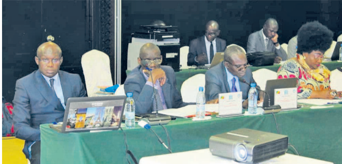
Les membres du comité du Prisp

Pour cela, la gestion technique du programme est confiée à la direction du système d'information du ministère des Finances. À terme, l'e-tax va également per-