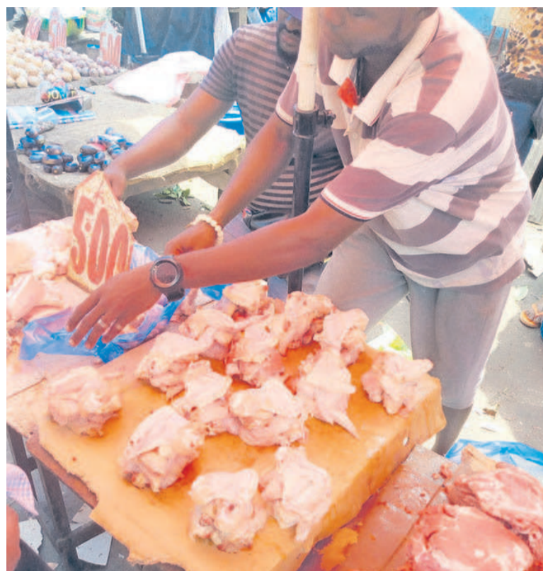
Les ailes de poulet à gauches sur une table à Total