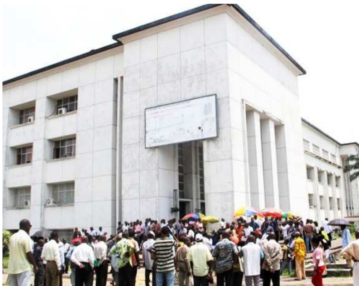
Des agents de l'Etat devant le bâtiment de la fonction publique à Kinshasa