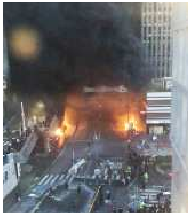
des débordements de la gare de Lyon

«Heurts à propos du concert d'un chanteur congolais, incendie de la Gare de Lyon, racailles empêchant les pompiers de travailler : quelle image notre pays donne au monde?», a tweeté Marine Le Pen, la patronne du Rassemblement national