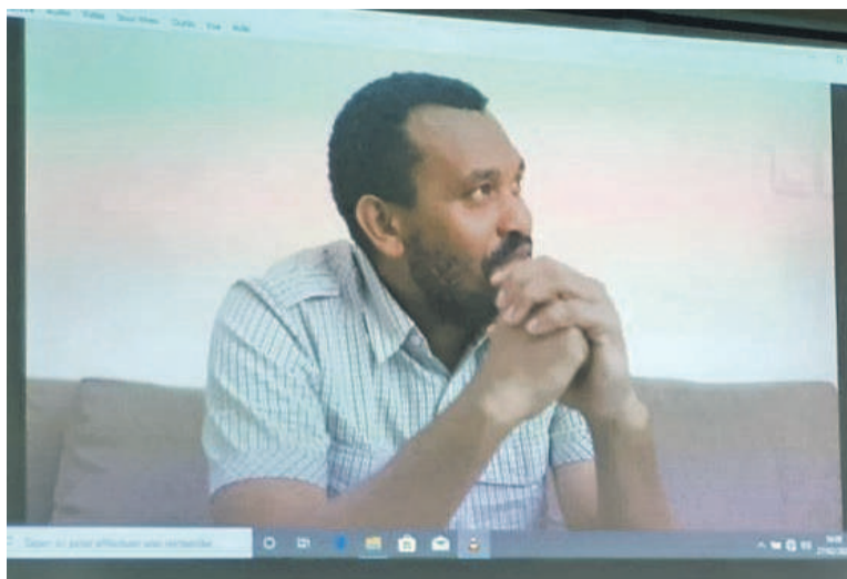
Le cliché de l'un des scénarii diffusés pour la circonstance

Pour cette organisation, cette séance cinématographique est un exercice d'autoévaluation permettant au public de distinguer les valeurs des antivaleurs prohibés par les lois. A cet effet, tout citoyen a été invité à s'approprier un mode de vie sain régissant la bonne marche du pays