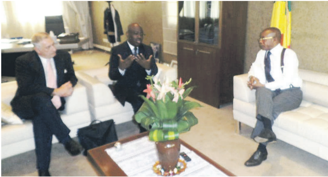
Echanges sur la prochaine accréditation du Cript en laboratoire de contrôle

En ce mois de mars le Cript et l'Agence congolaise de normalisation et de qualité vont signer un protocole car l'agence a la responsabilité de l'évaluation de la