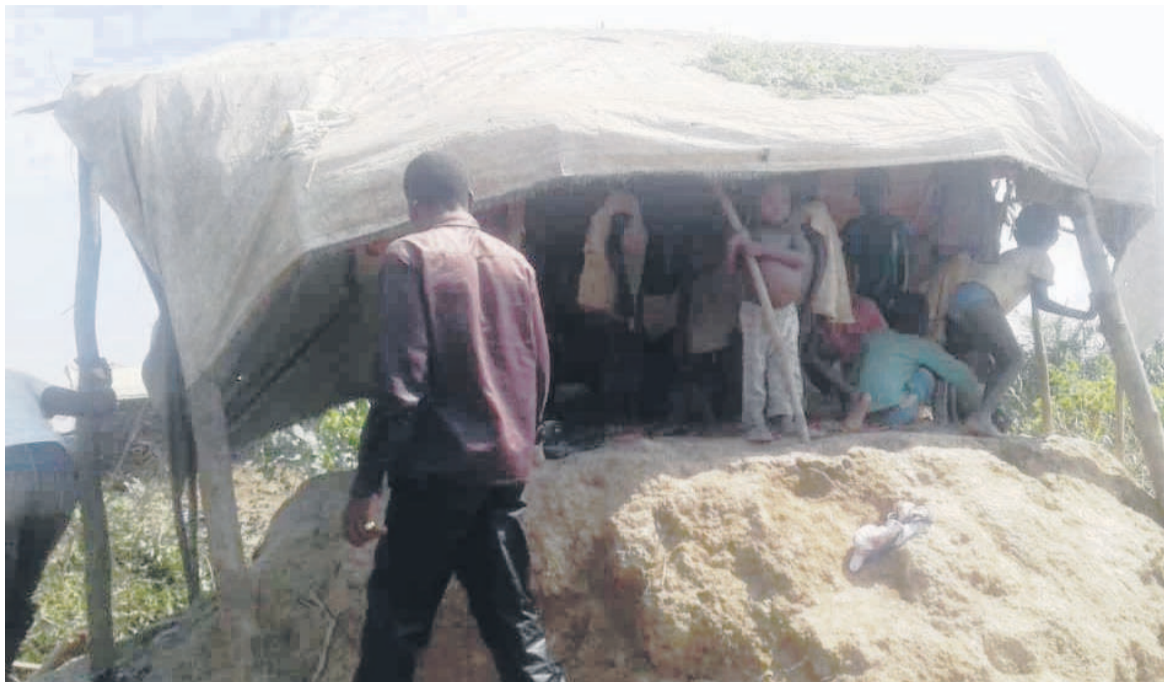
Une vue des populations sinistrées lors des inondations à Bétou

dans la prise en charge des sinistrés en dehors des localités déjà ciblées de la zone septentrionale devraient s'ajouter Brazzaville, Pointe-Noire, quelques localités du Niari... Sur la mobilisation des fonds, le coordonnateur humanitaire du système des Nations unies, Cyr Modeste Kouame, a indiqué que dès la déclaration de l'état d'urgence humanitaire par le gouvernement, le 19 novembre 2019, les partenaires techniques et financiers ont pu mobiliser 26% des besoins estimés pour appuyer la réponse déjà fournie par les autorités locales.