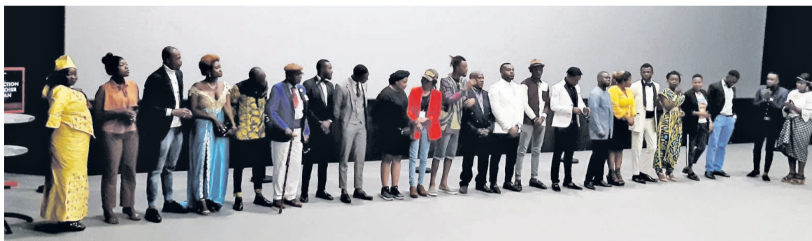
Photo de famille des acteurs et de la réalisatrice du film Adiac