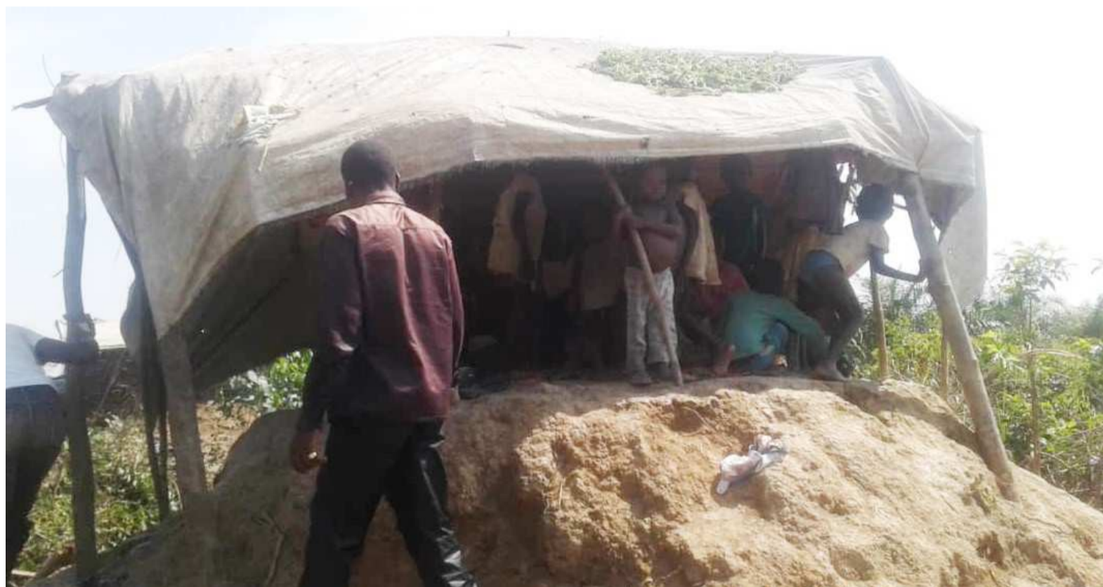
Une vue des populations sinistrées lors des inondations à Bétou