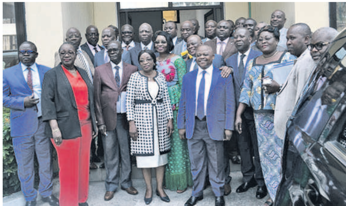
Les membres du conseil d'administration/Adiac

« Comme nous sommes dans un corps paramilitaire, nous pouvons ajouter à cette liste, la discipline et la rigueur. C'est pourquoi, nous lançons un vibrant appel au président d'honneur de la Mutrado, le directeur général des Douanes et droits indirects, d'avoir un regard perçant, rénovateur et d'accorder une attention particulière à la Mutrado qui est une arme de victoire. Rendez-vous à l'assemblée »