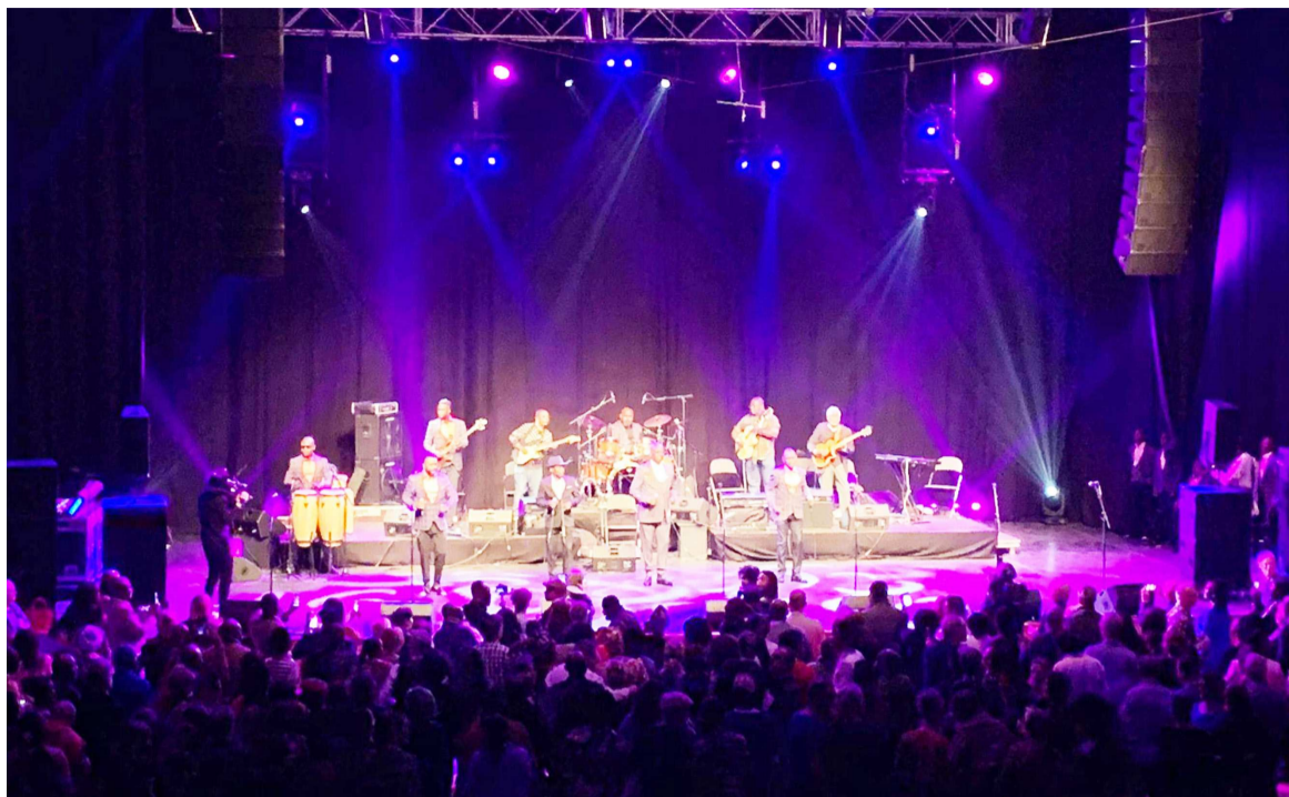
Zaïko Langa-Langa lors de sa prestation au Bozar