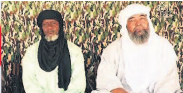
Amadou Koufa et Iyad ag Ghaly

Malgré la détermination des autorités, des voix divergentes s'élèvent sur le projet de dialogue de la présidence : l'idée est soutenue par les partisans du régime, tandis qu'elle est contestée par certains citoyens et autres formations politiques dont le parti Yelesma, qui ne croit pas en la pertinence d'une telle démarche. Quant aux chefs djihadistes, ils