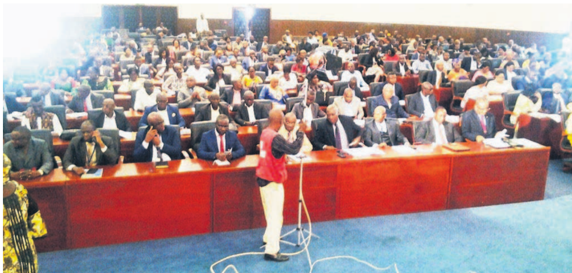
Une vue des participants à réunion de vulgarisation de la loi de finances

Pour ce dernier, la vulgarisation de la loi de finances 2020 est le moment pour l'administration de renouveler et de sceller pour l'année nouvelle