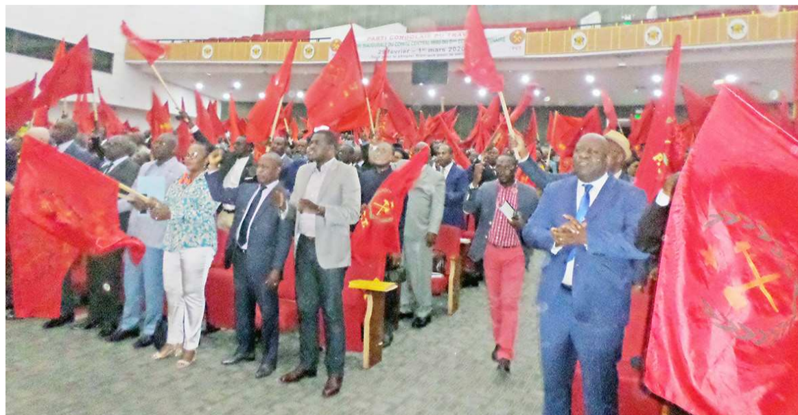
Les membres du comité central

Le Palais des congrès a accueilli les 29 février et 1 er mars derniers, la session inaugurale du comité central du Parti congolais du travail (PCT) qui a débouché sur l'adoption du budget et du programme d'activités 2020.