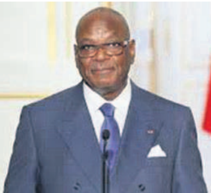
Le président malien Ibrahim Boubacar Keïta

Assurant que la démarche enclenchée n'est pas une « lubie » de sa part puisqu'une conférence d'entente nationale avait demandé un tel dialogue, le chef de l'Etat malien assure que des pourparlers seront irréversibles pour ramener la paix dans le pays, même si des partisans du pouvoir et d'autres citoyens s'en sont opposés. Ce qui préside à la tenue de ces discussions, étant selon lui, le fait que ces derniers mois, la région du Sahel vit « une sorte d'aguerrissement des forces adverses », avec des attaques lancées régulièrement par des éléments venus du Proche-Orient,