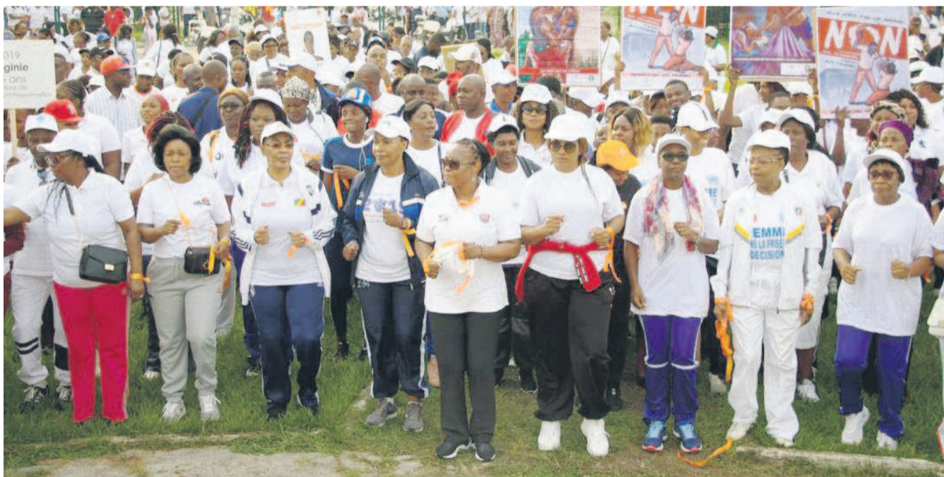
Les femmes congolaises lors de la marche

Après une marche organisée le 1er mars à Brazzaville, les femmes ont remis au Premier ministre, Clément Mouamba, une pétition appelant à l'adoption de l'avant-projet de loi portant lutte contre les violences sexo-spécifiques. Cette pétition comporte quelque 8860 signatures.