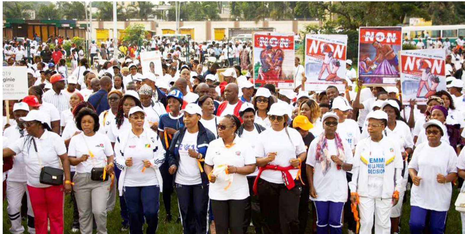
Les femmes lors de la marche