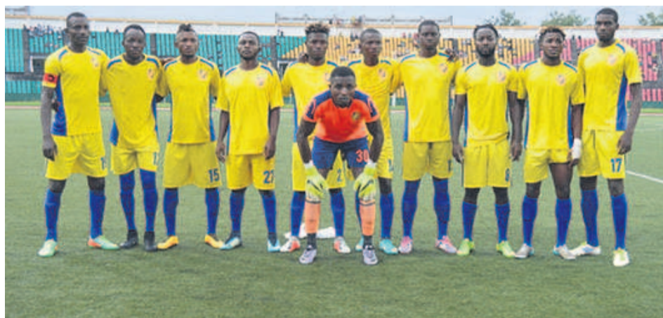
La JST s'accroche à la deuxième place Adiac

Derrière, il n'a pas d'enjeux puisque la deuxième place n'est pas qualificative à une compétition africaine. Et pourtant la JST s'y accroche et se donne les moyens pour la conserver. Le 1er mars au stade Alphonse-Massamba-Débat, elle a dominé le Cara, les Aiglons, avant d'améliorer son compte à trente-huit points soit sept de plus que l'adversaire. Le Cara (trente-un points) a d'ailleurs chuté à