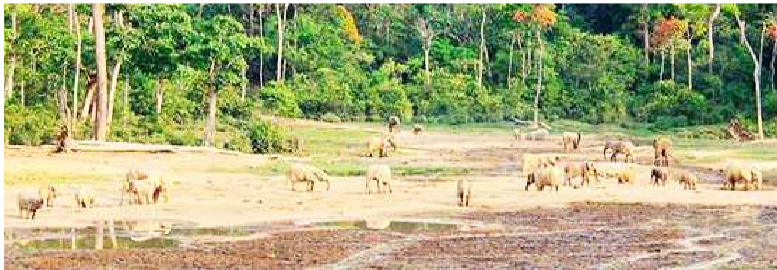
Une vue du parc Nouabalé-Ndoki au Congo/DR