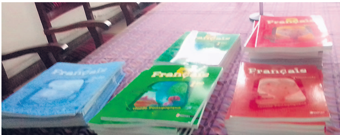
Un échantillon des livres

La collection « futur simple » des manuels de français des classes de seconde et de terminale édités par Nathan ont pour but de former les élèves aptes à intégrer la globalisation sous le prisme de la francophonie.