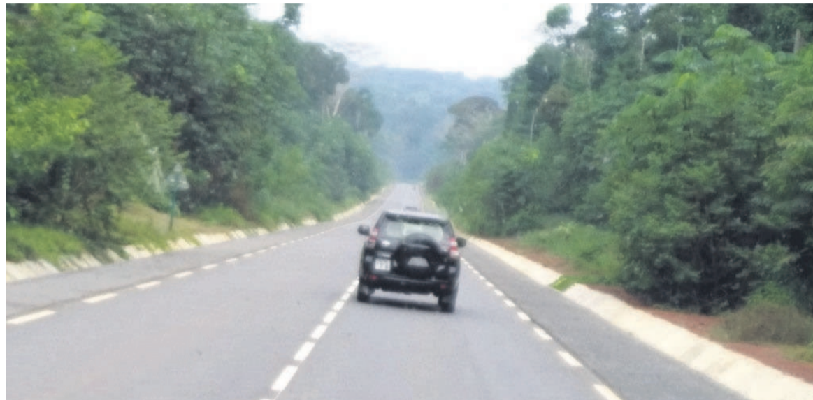
La route d'intégration sous-régionale sur le tronçon Souanké-Ntam, frontière du Cameroun/Adiac

A la suite de l'inauguration, le 6 mars, de la route d'intégration régionale Ketta –Ntam, à la frontière du Cameroun, le président de la République, Denis Sassou N'Guesso, a indiqué à la presse que les dirigeants d'Afrique centrale œuvrent ensemble pour relever le défi d'interconnecter leurs pays à travers un réseau routier viable.