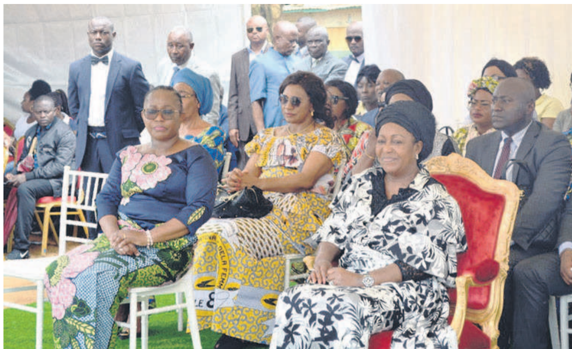
La première dame et les autres officiels à la relance de la PTME à l'hôpital de Nkayi