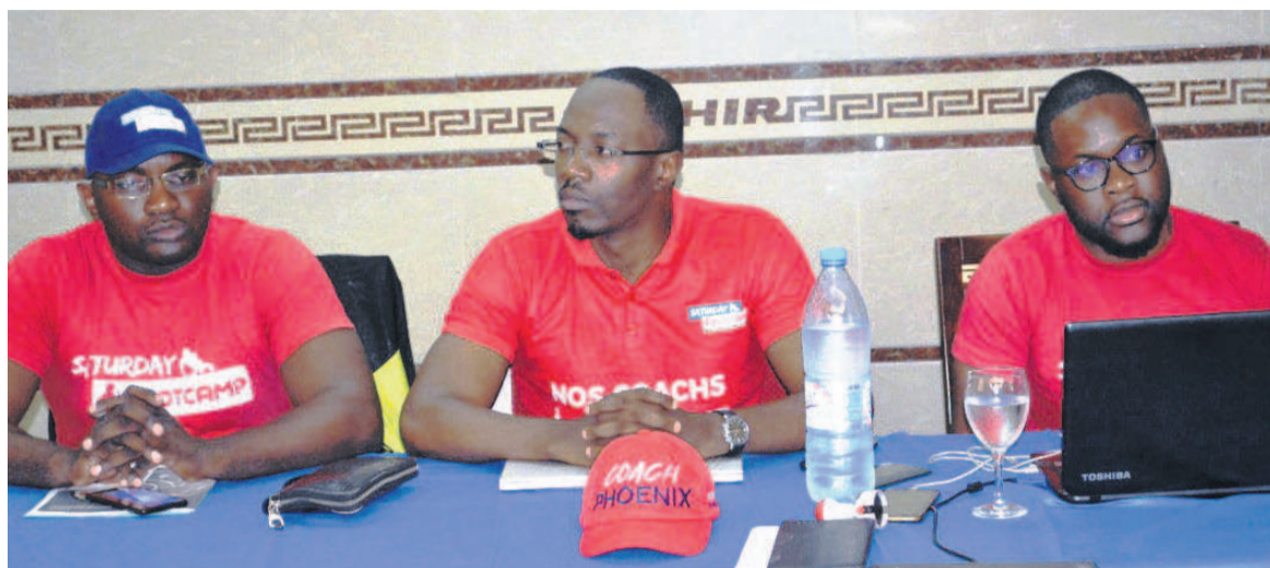
Les membres du bureau exécutif de l'association sportive Saturday Bootcamp/Adiac

Au cours d'une assemblée générale, le 7 mars à Brazzaville, les membres de l'association Saturday Bootcamp ont émis le souhait d'ériger dans les prochains mois un espace omnisport de distraction à travers le sport.