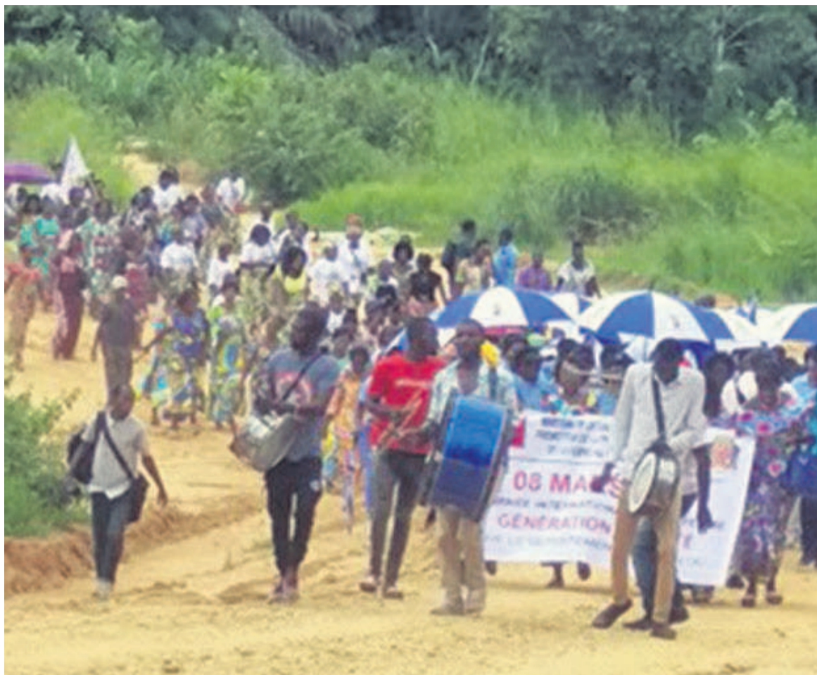
Les femmes lors de la marche.