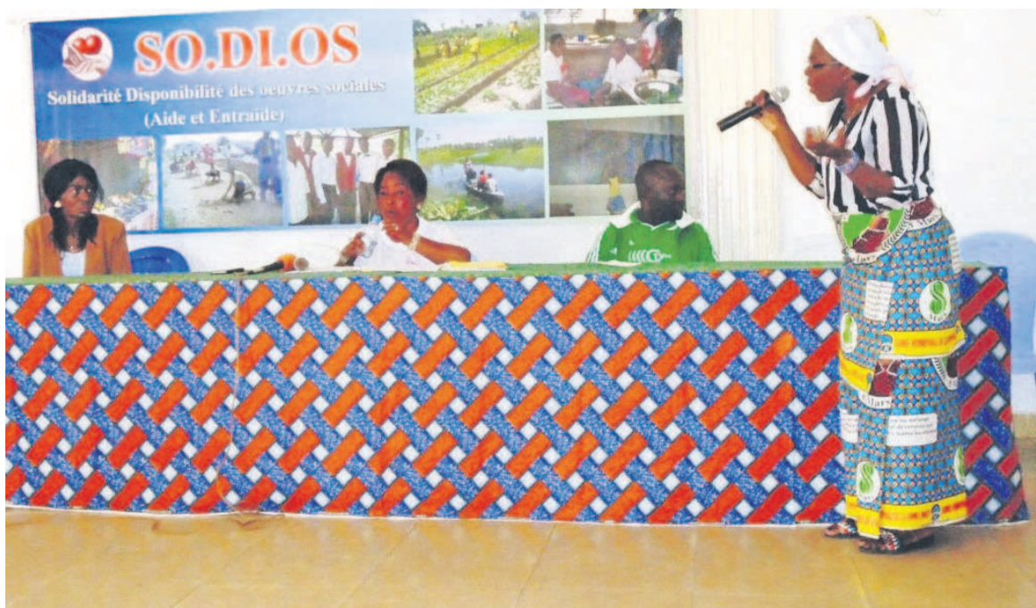
La tribune lors de la conférence-débat

La femme a des devoirs en couple mais, dans la société, elle a la première éducatrice des enfants. De son côté, la présidente du foyer féminin à la paroisse Saint-Pierre-Apôtre a exhorté les femmes à ne pas se laisser morfondre dans les situations de veuvage. Au contraire, la femme veuve doit faire prévaloir ses