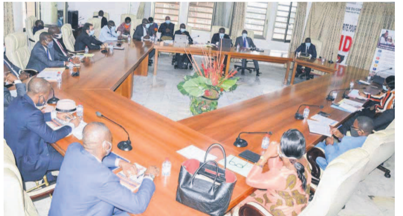
Des participants au cours de la séance de travail

Les représentants des établissements de crédit et de microfinance ont pris part, le 11 juin, à Brazzaville à une séance de travail dédiée à la présentation du processus d'intégration de la plateforme de paiement en ligne des droits et taxes nommée E-Pay Congo.