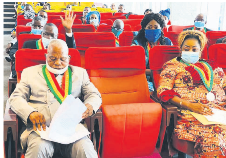
Une vue des conseillers lors de la session

Le Conseil départemental et municipal de Brazzaville a clôturé, le 11 juin, sa cinquième session ordinaire administrative, au cours de laquelle il a adopté son budget exercice 2020 évalué à la somme de vingt-trois milliards deux cent seize millions de francs CFA.