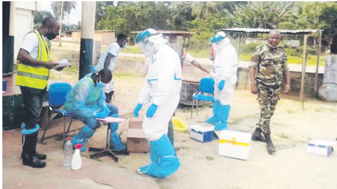
Une opération de dépistage dans l'arrière-pays

La situation est identique au niveau de la Likouala, frontalière à la Sangha et à la Cuvette qui ont déjà enregistré chacune un cas de Covid-19, même si ce sont les taux de contamination les plus faibles du pays jusque-là. « Si l'accès à la Likouala est difficile, cela signifie que l'évacuation d'un malade l'est également. Pour éviter le pire en cette période où la pandémie sévit, nous