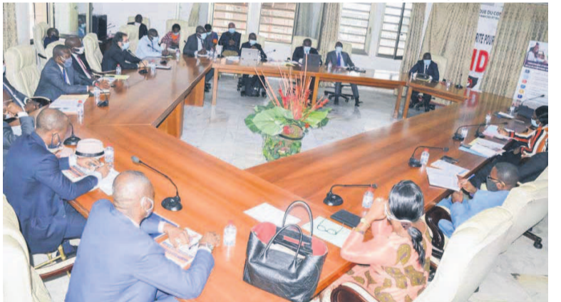
Des participants au cours de la séance de travail

Les représentants des établissements de crédit et de microfinance ont pris part, le 11 juin, à Brazzaville à une séance de travail dédiée à la présentation du processus d'intégration de la plateforme de paiement en ligne des droits et taxes nommée E-Pay Congo.