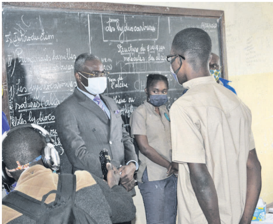
Anatole Collinet Makosso échangeant avec les élèves

En commençant par les CEG A et B de Kintélé jusqu'au lycée en passant par l'école primaire, le ministre de l'Enseignement primaire, secondaire et de l'Alphabétisation a pu noter les conditions de travail sur le plan pédagogique et sanitaire. « Si nous sommes tous malades en même temps, il n'y aura pas assez de médecins pour s'occuper de tout le monde. Voilà pourquoi vous devez respecter les mesures barrières pour éviter d'être contaminés. Le coronavirus est une maladie comme toutes les autres mais, il se transmet vite. Un élève affecté peut contaminer toute une classe », a signifié Anatole Collinet Makosso.