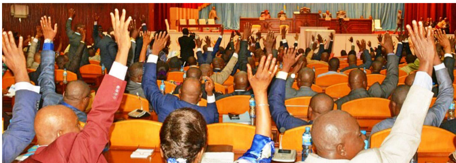
Des députés lors d'une séance plénière

L'élection du premier vice-président de la Chambre basse prévue pour le 12 juin a été reportée à une date ultérieure à la suite du dispositif policier déployé sur le site du Palais du peuple, lequel dispositif a empêché aux députés d'accéder à l'hémicycle.