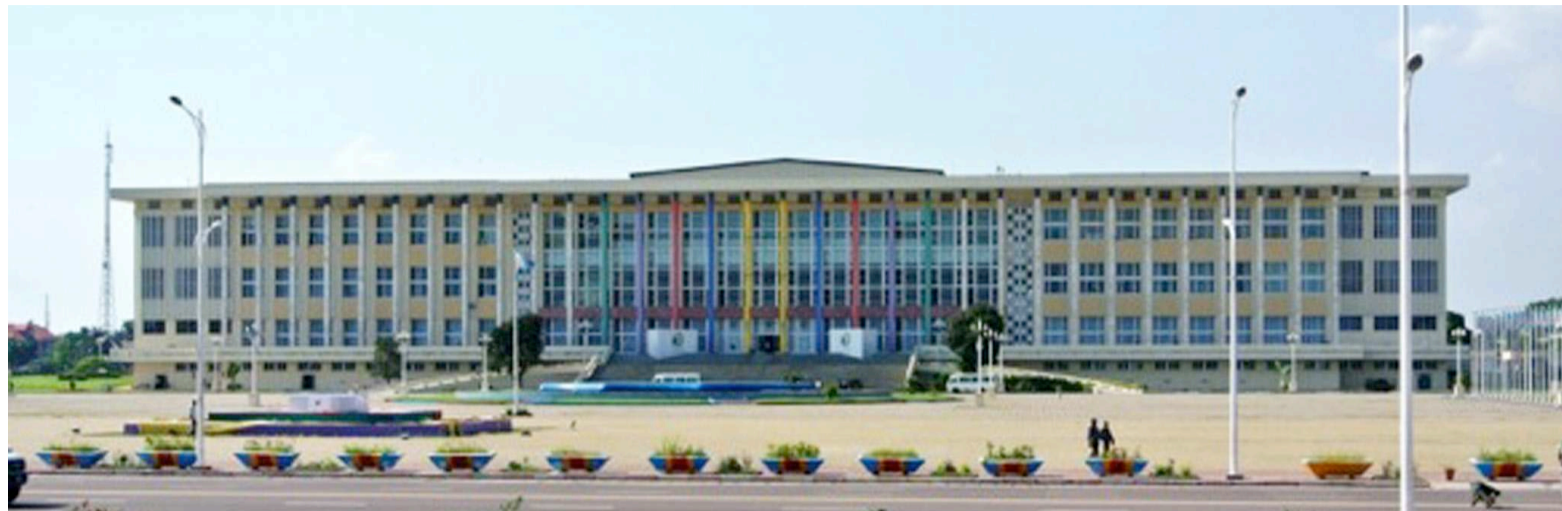
Le Palais du peuple

La situation était confuse, le 12 juin, aux abords du Palais du peuple qui devait abriter la plénière consacrée à l'élection du premier vice-président de l'Assemblée nationale. Cette élection tant attendue n'a malheureusement pas eu lieu au grand dam des députés qui n'ont pu accéder à l'hémicycle. Et pour cause ? Un dispositif militaire avait été déployé, tôt le matin, autour du site, dissuadant les élus du peuple à rebrousser chemin. Visiblement, des instructions avaient été données pour empêcher l'organisation du vote qui, selon toute vraisemblance, devait porter au perchoir l'unique candidate à la première vice-présidence, Patricia Nseyi, en remplacement de Jean Marc Kabund démis de ses fonctions le 25 mai dernier. L'ordre, à en croire des indiscretions, serait venu du procureur général près le Conseil d'Etat qui aurait sollicité le concours de la police pour faire exécuter l'ordonnance de cette haute juridiction requérant la surséance de l'élection du premier vice-président de l'Assemblée nationale en attendant la décision de la Cour constitutionnelle en rapport avec le recours introduit par Jean Marc Kabund. Passant outre la décision du Conseil d'Etat, le bureau de la Chambre basse a tenu à exécuter son calendrier estimant que la décision de cette haute Cour était, somme toute, « inique, irrégulière et inconstitutionnelle ». C'était sans compter avec l'obstination du Conseil d'Etat à faire appliquer coûte que coûte sa décision portant annulation