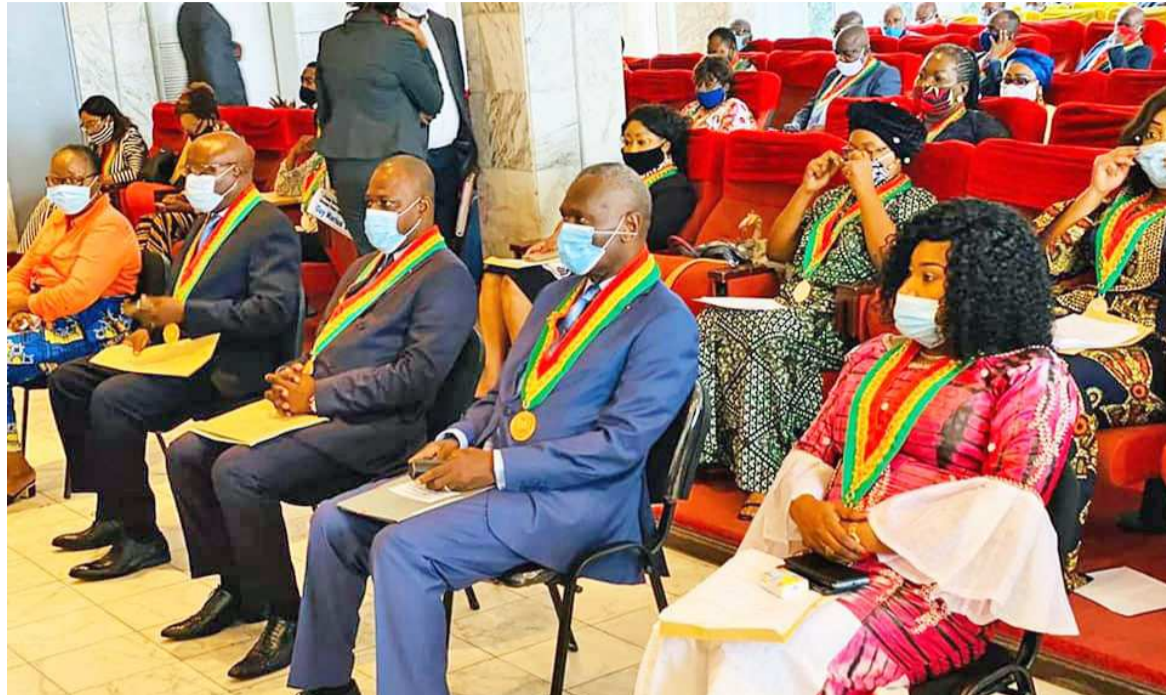
Les membres du collectifs des sénateurs élus à Brazzaville

Le collectif des sénateurs élus à Brazzaville a échangé, le 11 juin, avec les conseillers municipaux, dans le cadre d'une descente parlementaire. Les débats les plus brûlants entre les sénateurs et leurs mandants se sont focalisés sur la gestion du coronavirus et la poursuite des négociations avec le FMI.