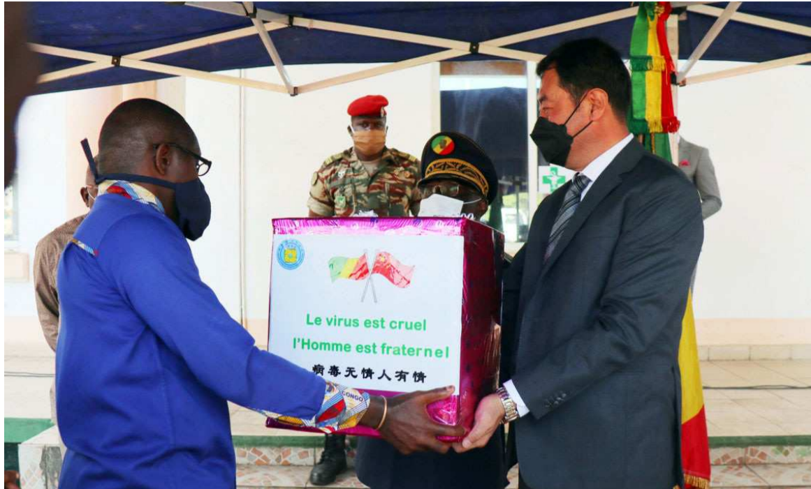
Le préfet de Pointe-Noire réceptionnant un échantillon de don des mains du 1er vice-président de l'ACC

Le premier vice président de l'ACC a rappelé dans son mot de circonstance que, depuis le début de l'année, la pandémie du Covid-19 a frappé toute la planète et a causé de graves pertes à la population mondiale. Le Congo et la Chine sont également confrontés aux énormes