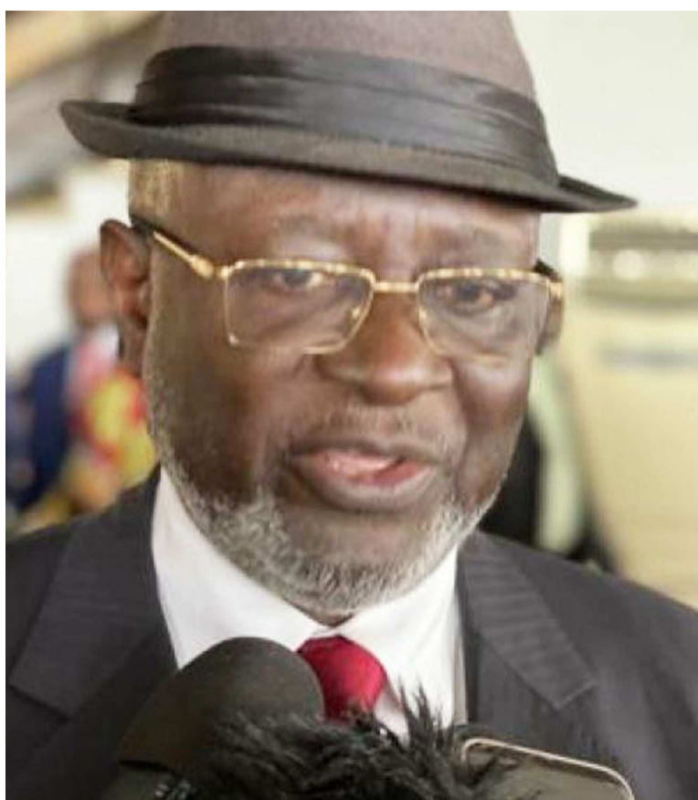
Célestin Tunda ya Kasende

La situation du vice-Premier ministre et ministre de la Justice, Célestin Tunda Ya Kasende, auteur d'un avis engageant le gouvernement transmis à l'Assemblée nationale au sujet des trois propositions de loi querellées relatives à la réforme judiciaire, ne fait que s'empirer. Lors du Conseil des ministres hebdomadaire, le vendredi 3 juillet, tenu en mode télétravail, il nous revient que le ministre fautif aurait été prié de se déconnecter sur instruction du chef de l'Etat. Il lui est interdit de participer aux Conseils des ministres jusqu'à nouvel ordre, apprend-on. En fait, le ministre de la justice est en disgrâce vis-à-vis du chef de l'Etat qu'il a tenté de défier après sa libération à l'issue de son arrestation et son audition à la Cour de cassation le samedi 26 juin dernier. Lors d'une réception par ses pairs du parti juste après sa libération, le ministre incriminé avait affirmé qu'il avait reçu l'appel de quelqu'un le qualifiant de « Yemeyi » (lui-même, ndlr) qui lui aurait demandé de ne pas avoir peur. Un détail très mal digéré par