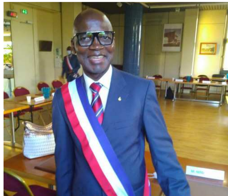
Gaston Nitou Samba, élu à Limay commune des Yvelines et de la région Île-de-France