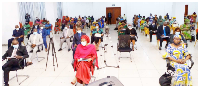
Les femmes lors de la journée internationale des veuves

à l'université Marien-Ngouabi, le Dr Christophe Lia Mondjock. Selon l'orateur, les rites imposés aux veuves sont perçus comme une étape de séparation entre le