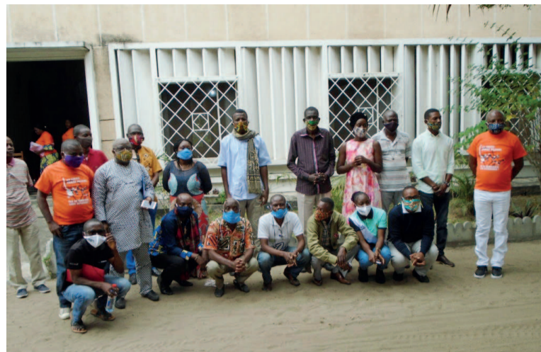
Les participants à l'atelier sur le constitutionnalisme au Congo

Au terme de leur analyse, TLP et NDI ont principalement constaté les changements récurrents des Constitutions. Hormis les lois