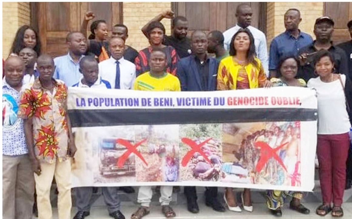
Les membres du Miss

Le Miss exhorte, en effet, Félix-Antoine Tshisekedi à ne pas se limiter à condamner alors que la République démocratique du Congo (RDC), son pays, « est occupé par six pays voisins qui multiplient des incursions sur son territoire ». Pour ce mouvement, le président de la République doit « écouter son peuple pour mieux comprendre la situation et agir fermement ». A Beni, note le Miss, des nombreux rapports confirment près de six cent soixante-seize civils tués et