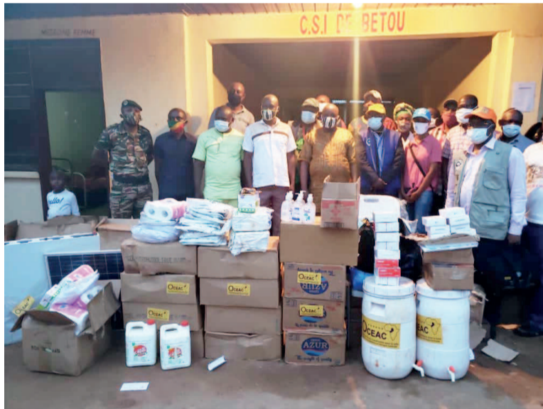
Les représentants de l'OCEAC et les autorités locales lors de la remise des kits

de la région à savoir le Cameroun, le Congo, le Gabon, la RCA, la Guinée équatoriale et le Tchad. L'on observe des mouvements réguliers des populations dans les frontières de ces pays en raison de leur perméabilité. D'où la nécessité d'engager des actions de prévention afin d'éviter la propagation transfrontalière de la pandémie.