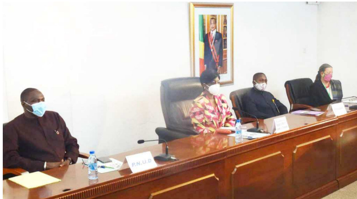
Les officiels au lancement de la formation

La ville de Brazzaville est considérée comme un grand centre de consommation du bois et du bois énergie par les ménages. Son extension se fait au détriment des forêts périphériques. C'est ainsi qu'en lançant la ses-