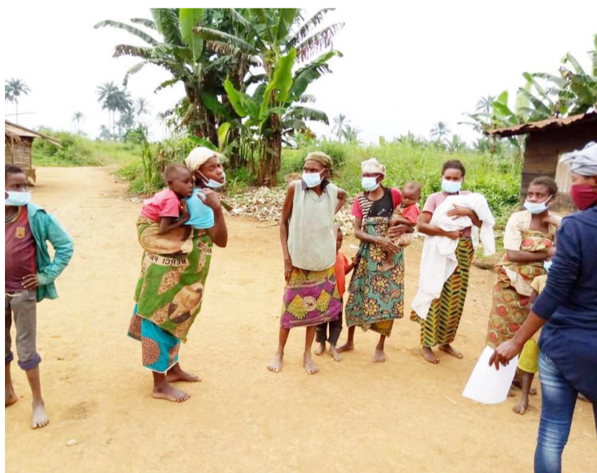
Sensibilisation des autochtones à la Covid-19

La direction générale de la population a amorcé, avec l'appui du Fonds des Nations unies pour la population, une campagne de sensibilisation aux mesures barrières à l'endroit des peuples autochtones de la Lékoumou, deuxième département du pays qui regorge le plus grand nombre de cette minorité sociale. Pour cette campagne, les équipes ont procédé à la remise des masques à usage unique aux autochtones, ce qui tranche avec leur mode de vie nécessitant en réalité l'utilisation des masques alternatifs en tissu.