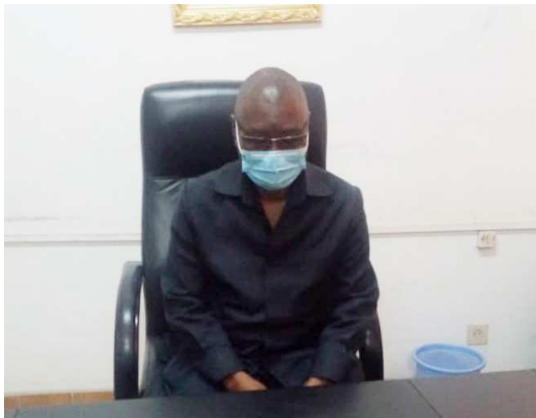
Le nouveau directeur général de l'Irsen installé dans ses fonctions

Les missions urgentes de l'Irsen pour l'année 2020 sont axées sur les projets d'appui à la surveillance du milieu marin, côtier et continental, de l'orientation de l'énergie nucléaire à des fins pacifiques pour la sécurité alimentaire et la santé, en réorganisant les directions des zones de recherche. Au sens large, l'Irsen a pour mission d'organiser des recherches fondamentales et appliquées