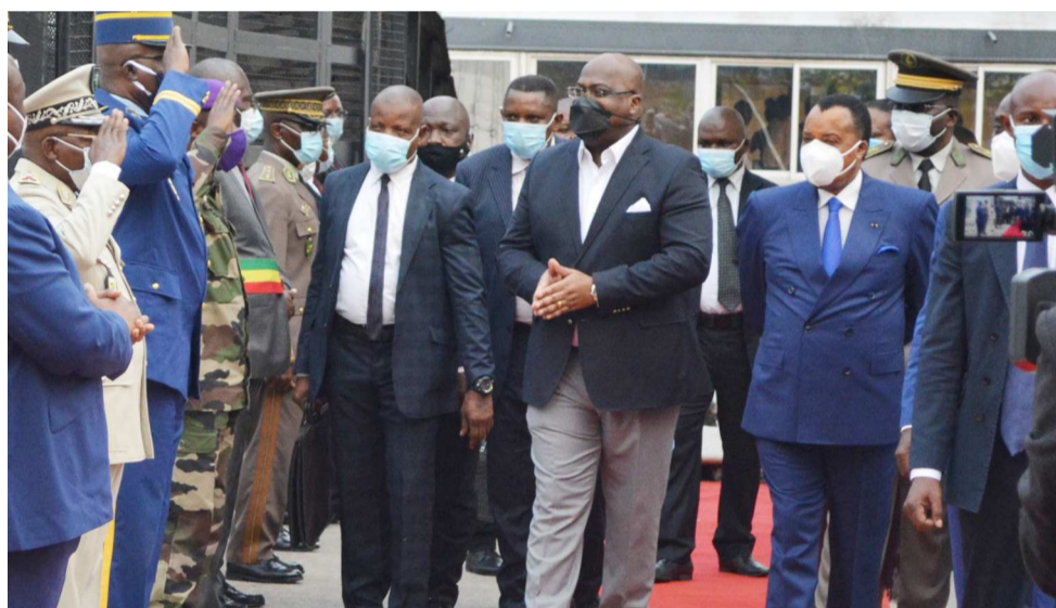
Félix Antoine Tshisekedi accueilli par Denis Sassou N'Gusso, au beach de Brazzaville

Le président de la République démocratique du Congo, Félix Antoine Tshisekedi est arrivé hier en fin d'après-midi à Brazzaville par le beach où il a été accueilli par son homologue Denis Sassou N'Gusso.