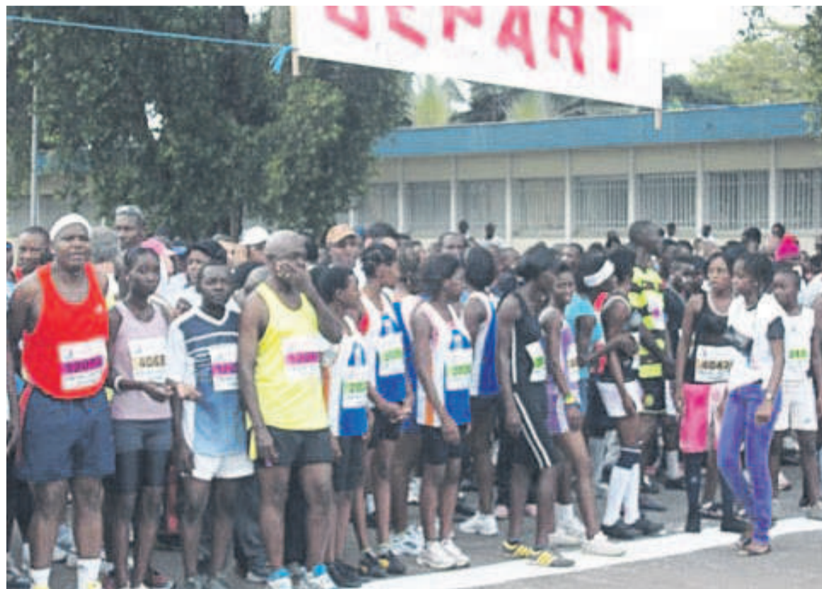
Départ du Cross populaire

Attendue avec la plus grande ferveur, la quatorzième édition des 15 km devait avoir lieu en août prochain, mais la situation sanitaire marquée par la covid-19 a empêché son déroulement. Pour préserver la santé de la population, le président du bureau exécutif du Conseil dé-