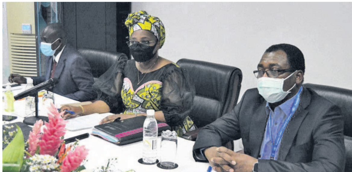
Le présidium des travaux de l'atelier de révision du plan de riposte/Adiac

Les différentes commissions du Comité technique de riposte et les partenaires sont en atelier à Brazzaville pour réadapter les stratégies de réplique contre la Covid-19 dont les cas de contamination se multiplient chaque jour qui passe.