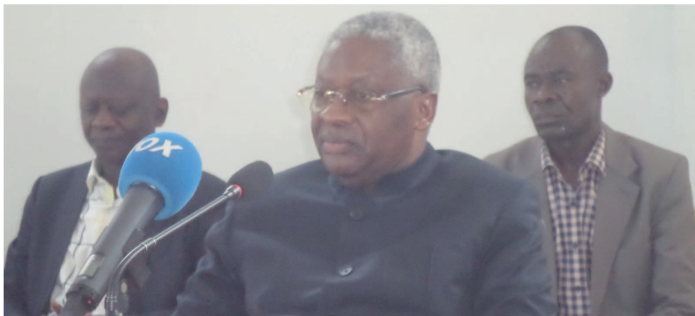
Le chef de file de l'opposition congolaise, Pascal Tsaty-Mabila