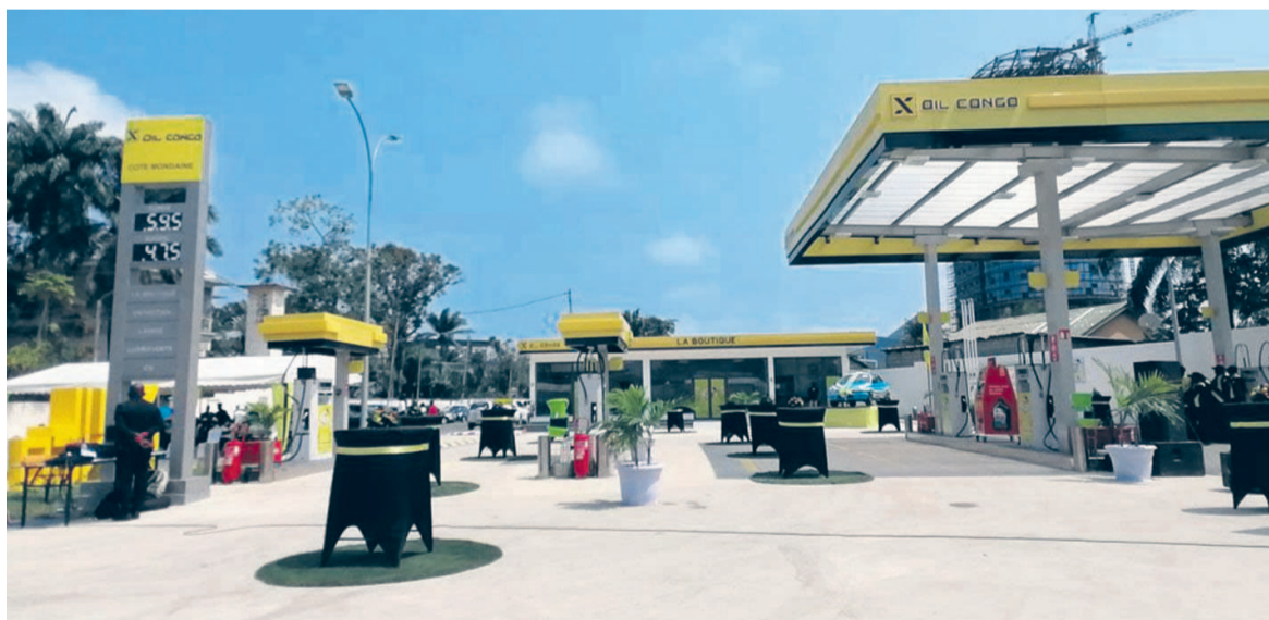
La station-service Côte-Mondaine de Pointe-Noire

la Mairie, c'est une infrastructure neuve annexée à des services extras indispensables aux stations de dernière génération.