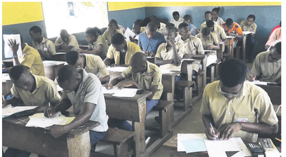
Une vue des élèves de troisième, candidats au BEPC