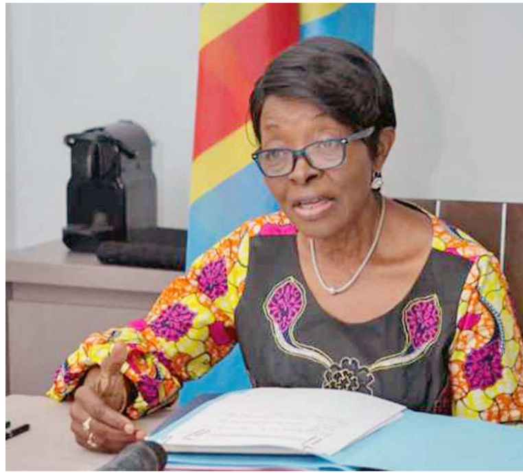
La ministre Marie Tumba Nzeza

Donc, a-t-il conclu ce chapitre, nous allons certainement continuer et améliorer nos relations économiques. Pour la ministre, cette option n'empêche, cependant, pas la RDC d'être vigilante par rapport