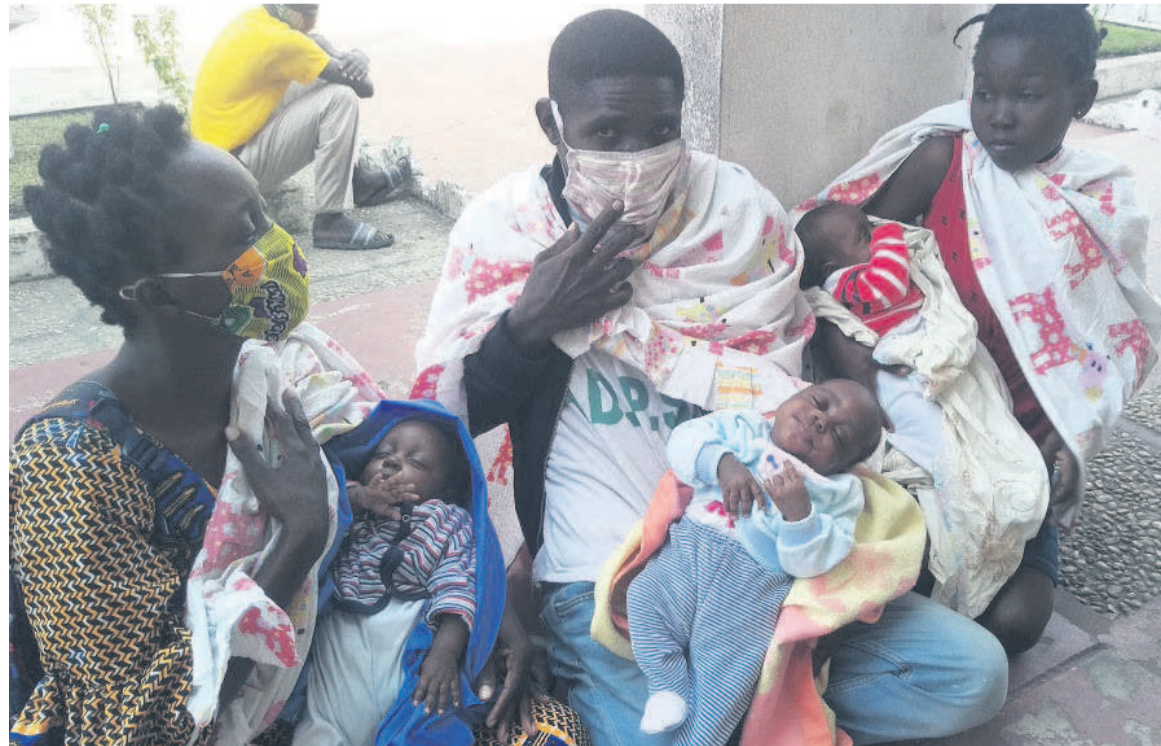
La famille Milandou