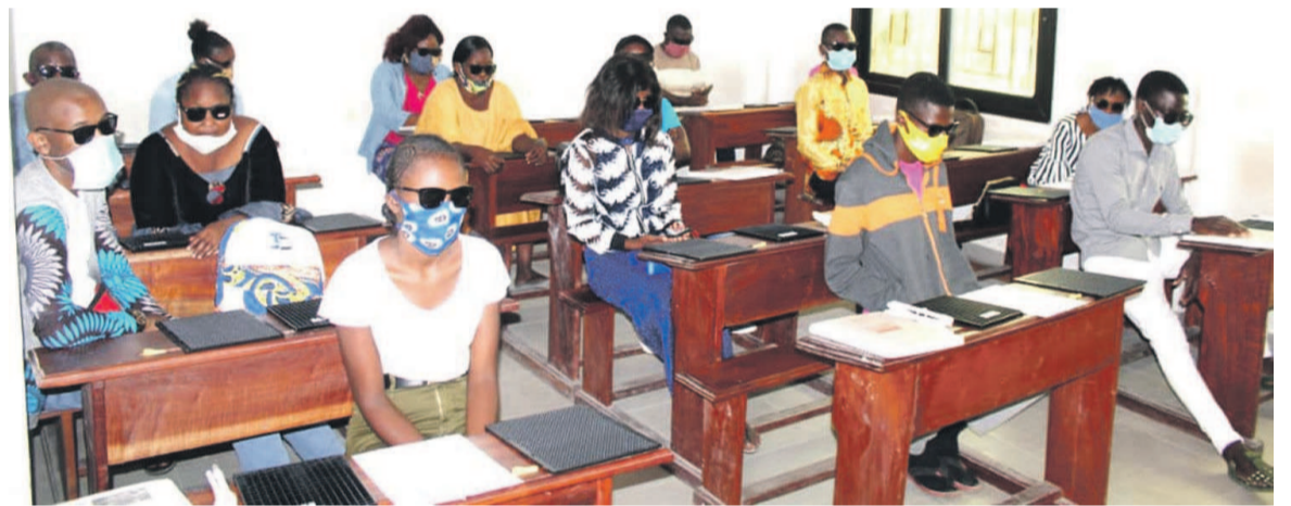
Les déficients visuels en formation (DR)

La deuxième session de formation en braille a été lancée le 1er août, au Complexe inclusif Emmaüs, situé à Kintélé au nord de Brazzaville, afin de permettre aux déficients visuels de développer leurs compétences en écriture braille.