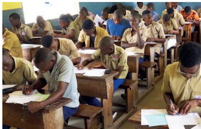
Une vue des candidats au BEPC/DR

Le Brevet d'études du premier cycle (BEPC), dernier examen d'Etat de la session 2020 démarre ce matin sur l'ensemble du territoire. Au total 100.246 candidats répartis dans 380 centres y prennent part, hormis les