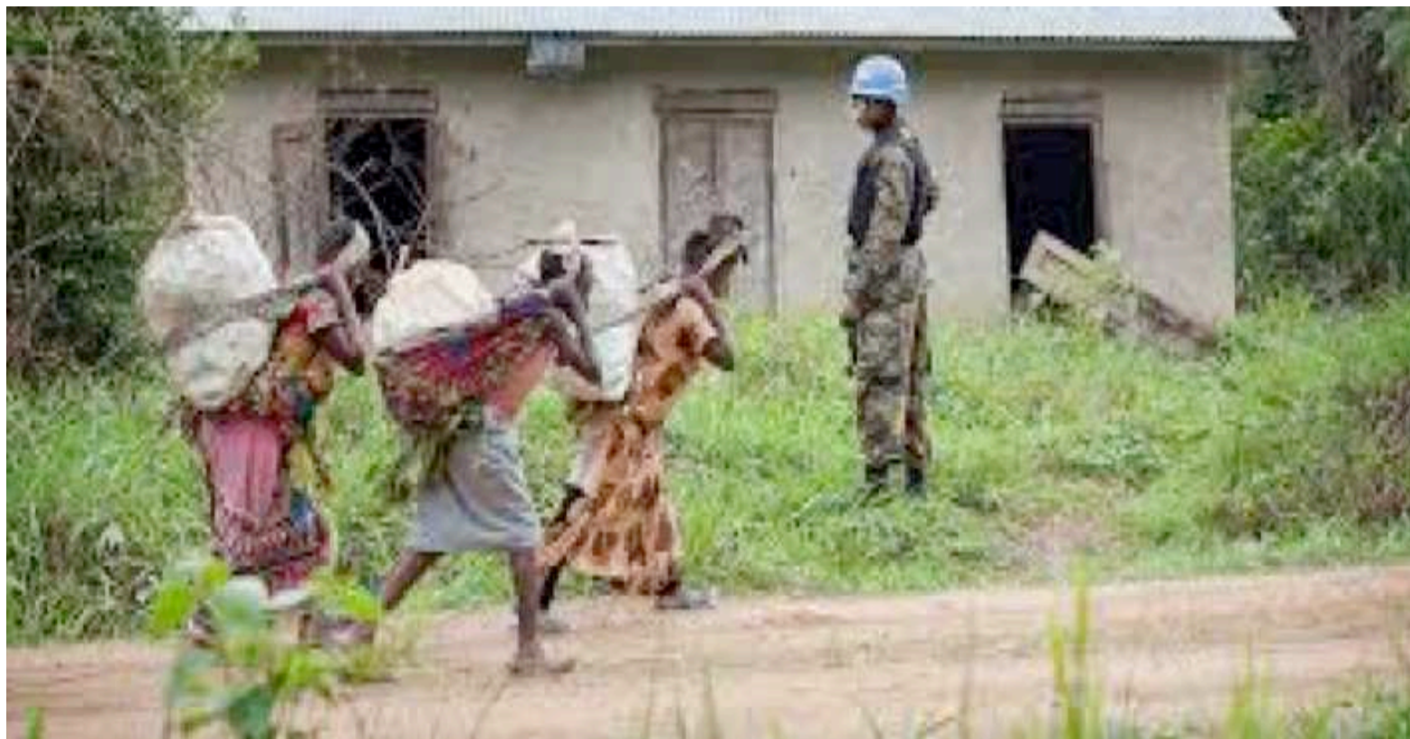
Des déplacées à la suite de l'insécurité à l'est du pays

Au regard de ce rapport, on note une hausse de 35% par rapport au nombre des cas enregistrés par la RDC au premier semestre de l'année 2019. Les cas de violations des droits de l'Homme ont plus été commis dans l'est du pays. Les provinces les plus touchées sont l'Ituri, le Maniema, l'ex-grand Katanga et les trois Kasai. Le rapport du BCNUDH recense, par ailleurs, plus de mille trois cents exécutions sommaires au cours du semestre en cours. Ces exécutions sont, pour la plupart, attribués à l'activisme des groupes armés. Pour le BCNUDH, les auteurs de ces barbaries sont principalement les assaillants armés de Dju-