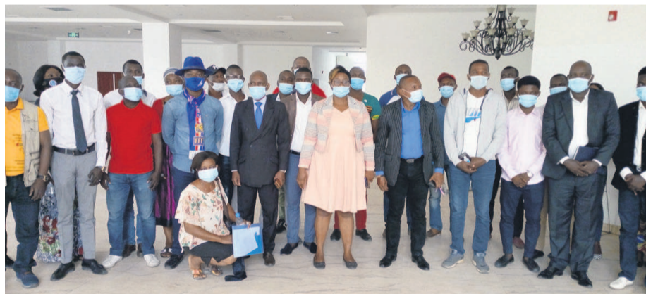
Les participants à la rencontre.

Les jeunes congolais et réfugiés ont pris part le 6 août dernier à une rencontre sur la culture entrepreneuriale organisée par le ministère en charge de l'Education civique et le Haut-commissariat pour les réfugiés (HCR).