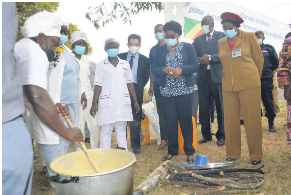
Les autorités assistent à la préparation de la bouillie nutritive Adiac

A en croire une récente étude réalisée par le PAM et le ministère des Affaires sociales, 52% des enfants ne mangent pas à leur faim à Brazzaville. D'où la nécessité de ce genre de programme de près de trois millions de dollars US (1,7 milliard FCFA) qui cible les populations congolaises vulnérables du Pool, de la Likouala et des Pla-