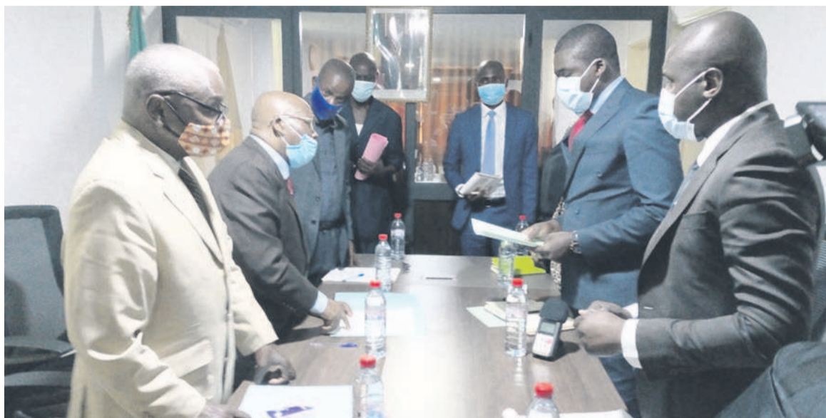
Une vue des membres des deux conseils

Pour l'orateur, il faut travailler ensemble notamment avec la société civile, et tous ceux qui ont été appelés et à qui le président ou le pays a fait confiance en leur donnant des missions, mais pas isolément. Il faut revisiter les canaux même de la tradition et de la culture. « Notre devoir