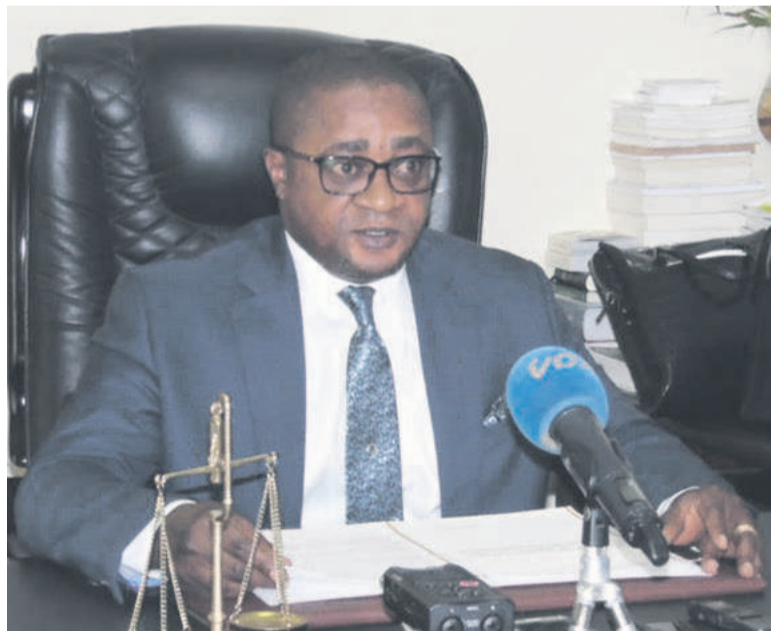
Le ministre Ange Aimé Wilfrid Bininga (DR)

Le gouvernement congolais a annoncé, le 7 août, l'existence d'un plan de communication destiné à sensibiliser les peuples autochtones à la maladie du coronavirus qui sévit dans le monde.