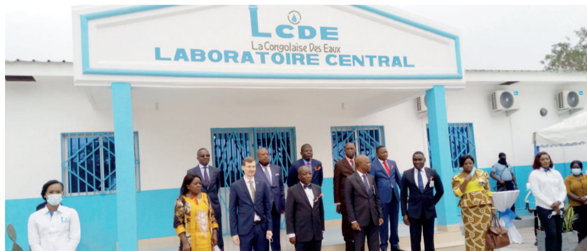
Le local du laboratoire central d'analyses

En vue de se conformer aux exigences de certificat à la norme ISO 17025 en matière de fourniture d'eau, La Congolaise des eaux (LCDE)