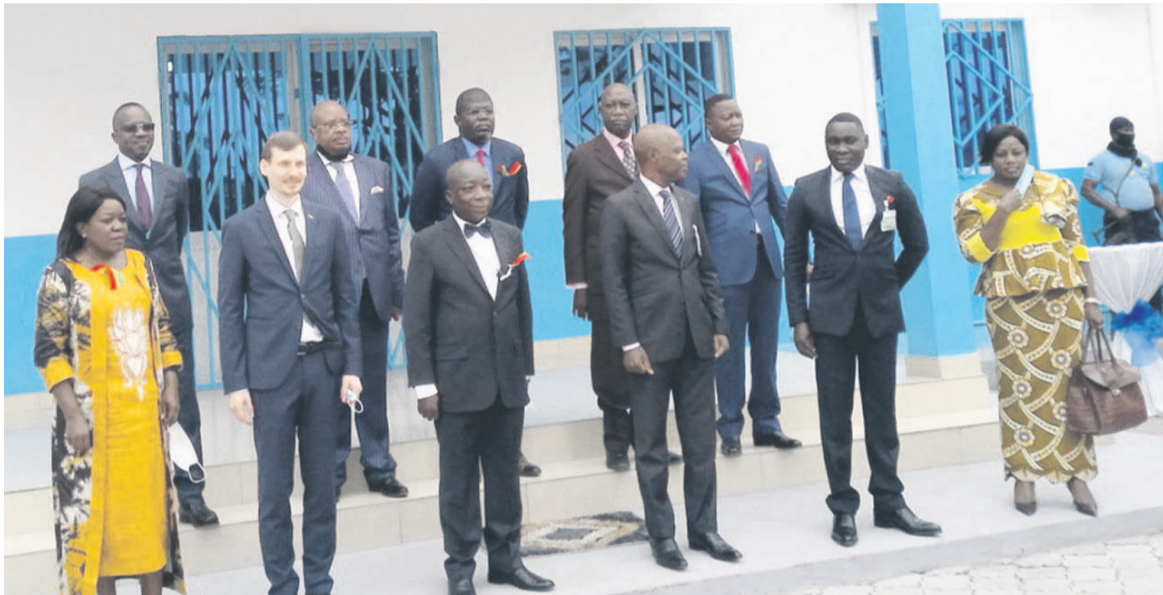
Les responsables posant devant le laboratoire central d'analyse Adiac