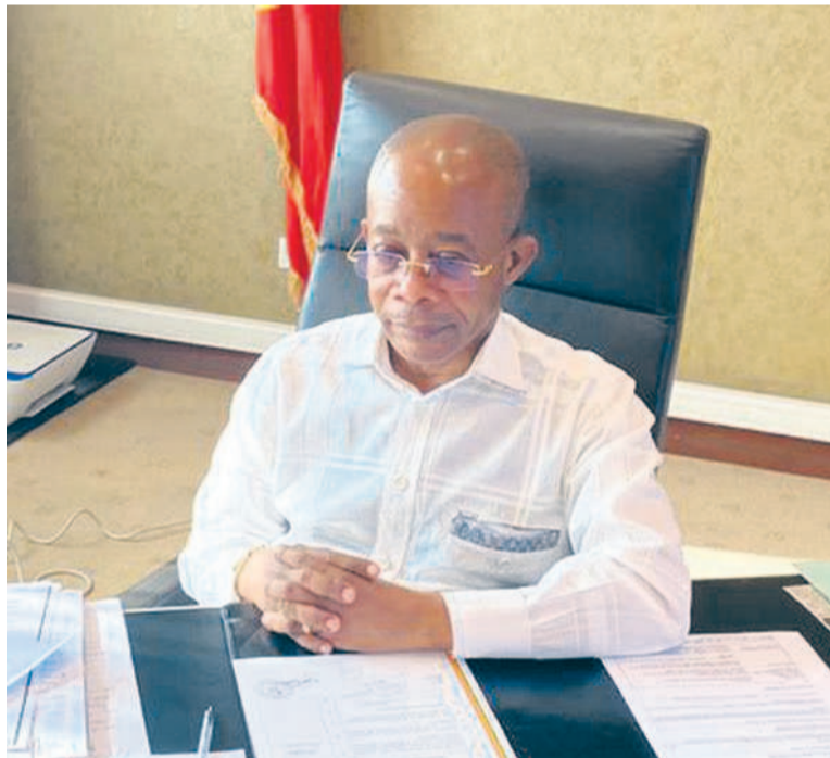
Le ministre Martin Parfait Aimé Coussoud-Mavoungou, lors de la visioconférence

La coopération technique, quant à elle, s'élargit sur l'élaboration d'un programme complet de lutte contre le cancer et la médecine nucléaire, le renforcement des activités d'infrastructures réglementaires dans tous les domaines et l'amélioration de la productivité