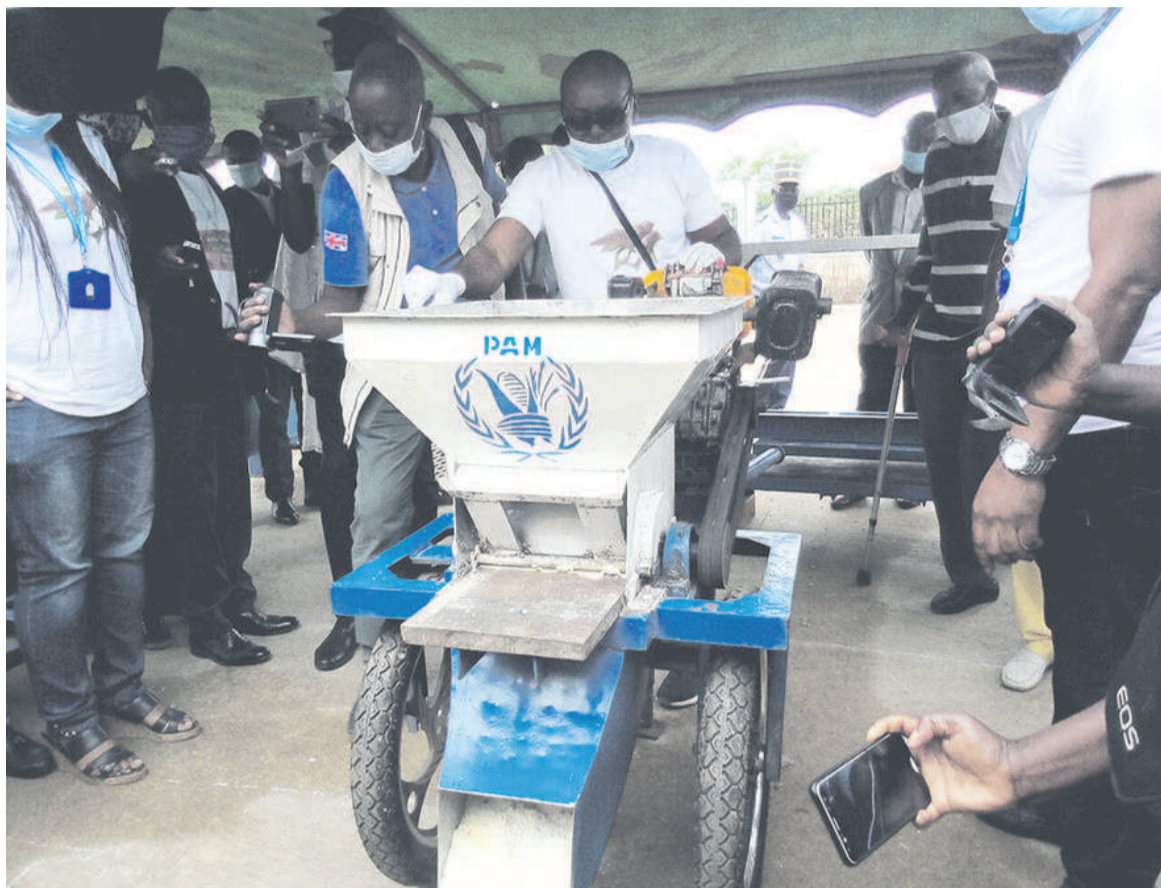
L'échange d'expériences entre les équipementiers et les transformateurs pendant une journée.

Cette foire est organisée dans le cadre du projet ProManioc qui est un programme de renforcement de la chaîne de valeur artisanale du manioc au Congo, financé par l'UE à hauteur de 1,5 million d'euros, soit environ un milliard FCFA sur le 11e FED (Fonds européen de développement).