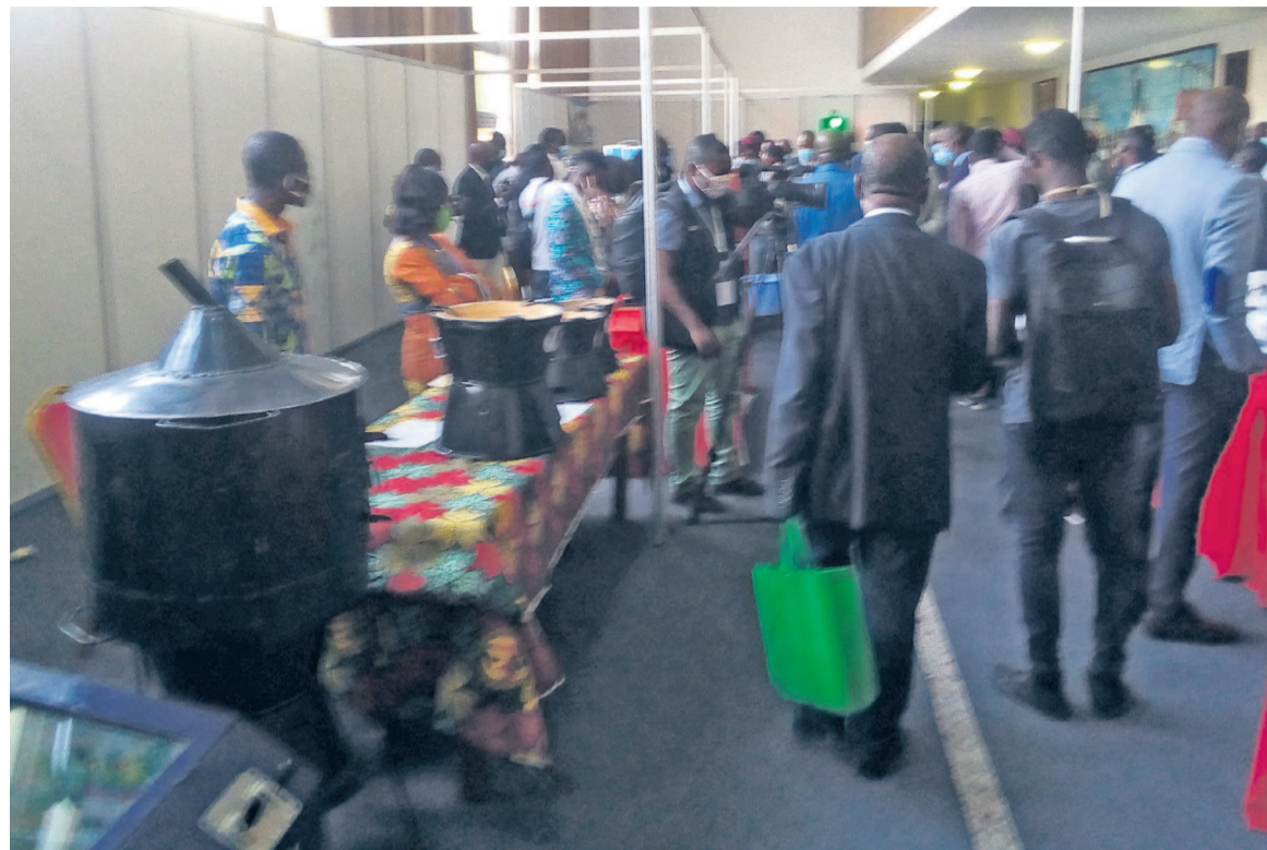
L'ambiance devant les stands Adiac

Organisée par l'OAPI, en partenariat avec le gouvernement congolais, l'édition 2020 du SAIT vise à faire connaître les meilleurs résultats de recherche-inventions et innovations technologiques permettant la création des entreprises dans les pays membres de l'OAPI, y compris de promouvoir les projets innovants ou services qu'offrent les inventeurs africains. A travers ce salon, l'OAPI entend spécifiquement mettre en lumière les inventions ou les innovations à fort potentiel de valorisation, offrir une opportunité pour la reconnaissance des mérites des inventeurs, stimuler la créativité et participer à la va-