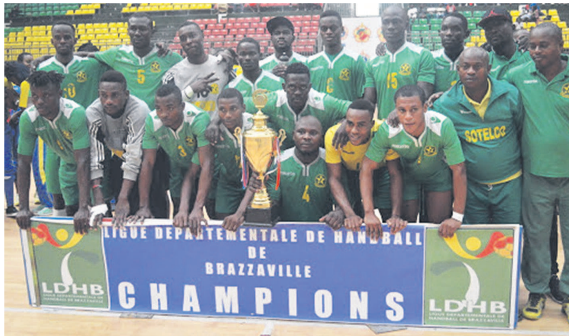
Etoile du Congo champion de Brazzaville 2019 Adiac

Les clubs congolais, qui étaient d'office qualifiés dans cette compétition suite à leur exploit au niveau local, sont jusqu'alors