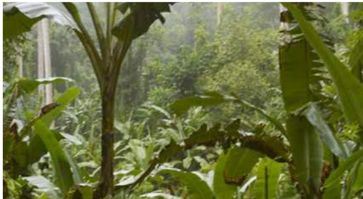
La réserve à biosphère de Luki en RDC

Dans un article écrit par le coordonnateur mondial, New deal for nature & people, au sein du Fonds mondial pour la nature (WWF International), Gavin Edwards, celui-ci a révélé que septembre a été un mois critique pour la nature à plus d'un titre. Cet activiste a, en effet, rappelé que les semaines précédant l'AGNU ont vu la publication de deux rapports-clés fournissant des preuves irréfutables de l'ampleur de la crise de la nature. Gavin Edwards a tout d'abord fait allusion au Rapport Planète vivante du WWF (Living Planet Report, LPR), lancé le 10 septembre, qui a révélé que les populations d'animaux sauvages avaient diminué en moyenne de 68 % en moins de 50 ans, ce qui est alarmant, en grande partie à cause de la même destruc-