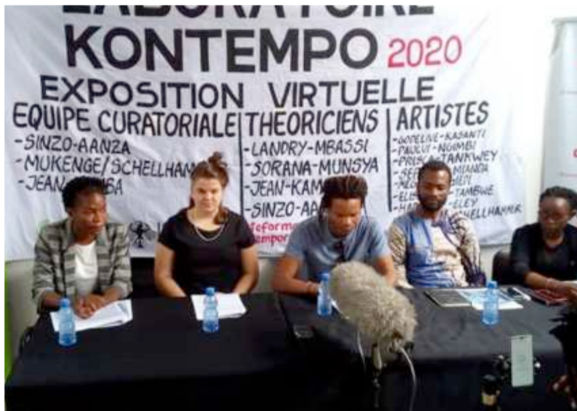
Présentation du projet Laboratoire Kontempo à la Plateforme contemporaine (Adiac)

Expérimentale, l'exposition porte essentiellement sur le travail fouillé de onze artistes visuels et plasticiens congolais, y compris les porteurs du projet sur les traces de l'époque coloniale dans le quotidien kinois. Pour cela, il a été précédé d'une résidence d'un mois. Réalisée dans l'esprit de création de synergies artistiques, l'exposition Laboratoire Kontempo a permis de mettre à contribution l'expertise de chercheurs et intellectuels locaux mais aussi internationaux dans une approche transdisciplinaire visant à explorer des possibilités artistiques qui s'offrent aujourd'hui. Il y est fait un lien entre la conception kinoise de l'art contemporain, assimilé depuis un moment au terme Kontempo et la perception que s'en fait le monde extérieur, notamment occidental. Inspirée par l'univers interculturel des artistes Christ Mukenge et Lydia Schellhammer, congolais et allemand, Laboratoire Kontempo aborde la question du post-colonialisme. Il se base