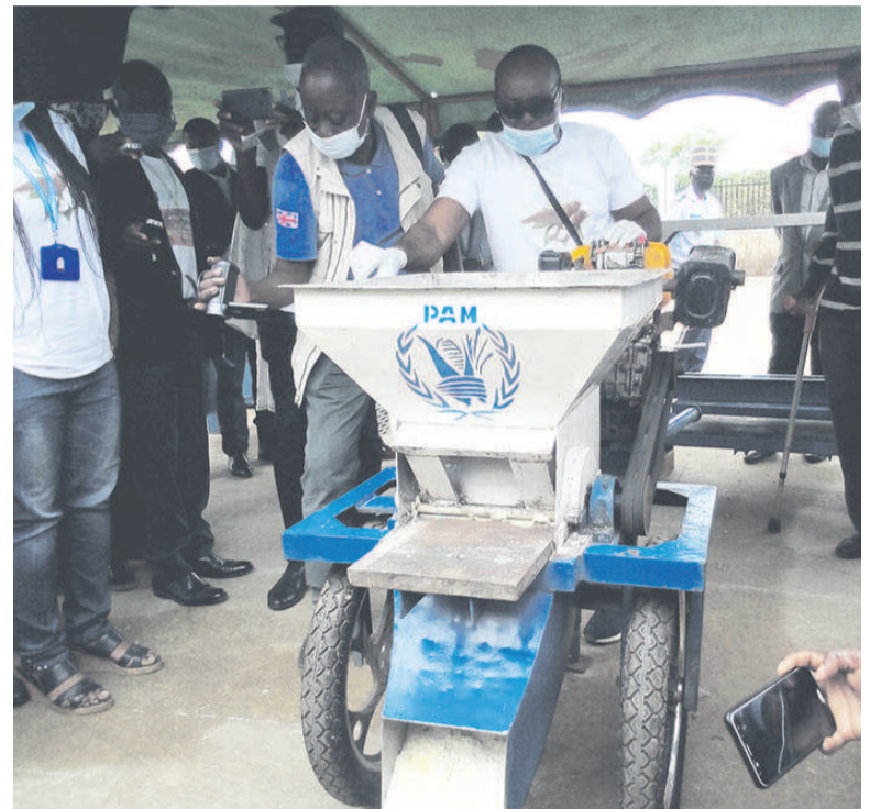
L'échange d'expériences entre les équipementiers et les transformateurs pendant une journée.