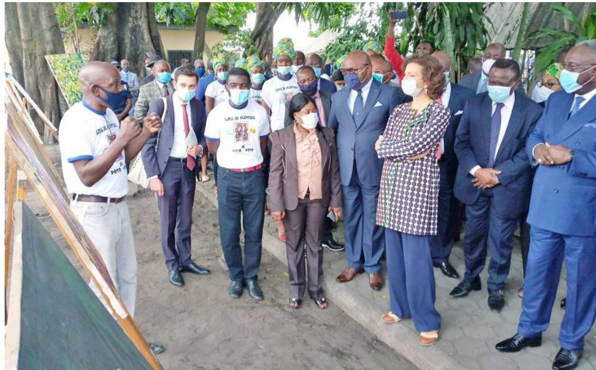
Le président des peintres de Poto-Poto donnant l'explication des toiles à la DG de l'Unesco lors de la visite guidée

Dans son mot de circonstance, la directrice générale de l'Unesco, Audrey Azoulay, a tenu d'abord à rendre un hommage mérité à tous