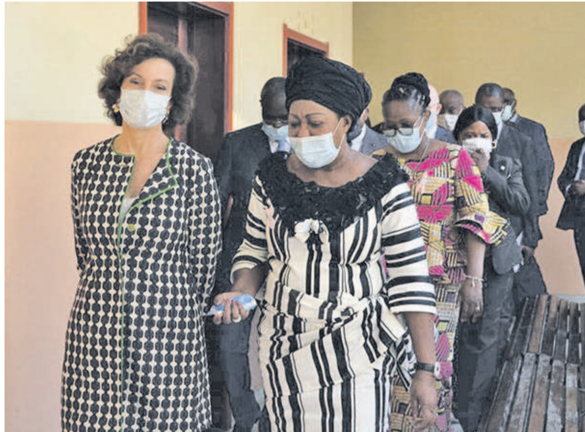
Antoinette Sassou N'Guesso et Audrey Azoulay visitent le CRND/Adiac

Hormis la visite du centre, l'épouse du chef de l'Etat et Audrey Azoulay ont participé à une conférence dans le cadre de la journée scientifique sur les thèmes suivants : « La drépanocytose, l'espoir est permis » ; « Femmes et sciences en Afrique,