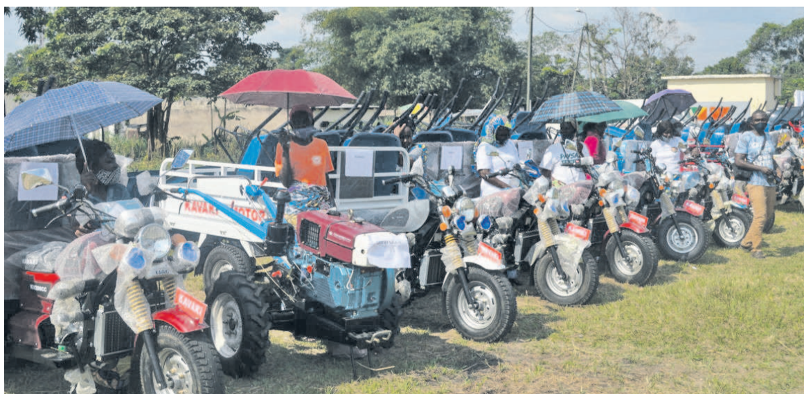
Une vue du matériel agricole doté aux femmes rurales de Goma Tsé-Tsé

« Ce matériel va permettre aux femmes rurales de Goma Tsé-Tsé de relancer leurs activités en réduisant la pénibilité des travaux de production », a indiqué la ministre Jacqueline Lydia Mikolo lors de la remise des équipements. La femme rurale contribue à 64% de la production agricole du pays, à 80 % de la production vivrière, 60% dans les activités de fumage de poisson, de séchage s'agissant de la pêche, a souligné la ministre. Selon elle, le thème de célébration de cette journée : « La femme congolaise engagée dans la production locale » résume tout dans le sens de ce qu'elles font et de ce qu'elles doivent continuer à faire.