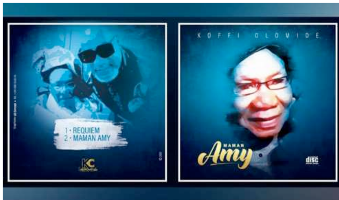
Requiem et Mama Amy, les hommages posthumes de Koffi à sa mère