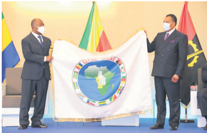
Les présidents Ali Bongo Ondimba et Denis Sassou N'Guesso

Sur cet axe de la coopération politique et sécuritaire, le test pour l'organisation sous-régionale, cette fin d'année, sera sans doute la République centrafricaine. Ce pays doit en effet tenir l'élection présidentielle et les élections législatives, le 27 décembre, dans un climat rendu incertain par la persistance des violences et des tensions politiques. Cette situation a incité les chefs d'Etat et de gouvernement de la CEEAC présents dans la capitale gabonaise à se mobiliser pour que les acteurs centrafricains ne replongent pas leur nation dans le chaos. C'est sans doute pour mieux porter ce message d'assistance que le président Faustin Archange Touadera en personne était venu à