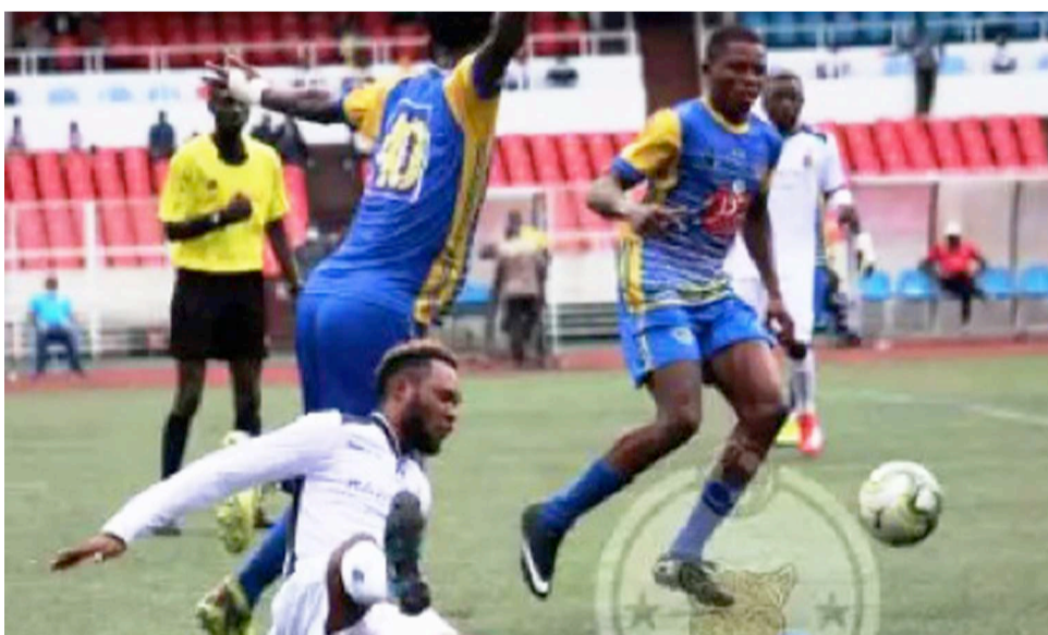
Un moment du match RCK contre Lupopo le 27 novembre