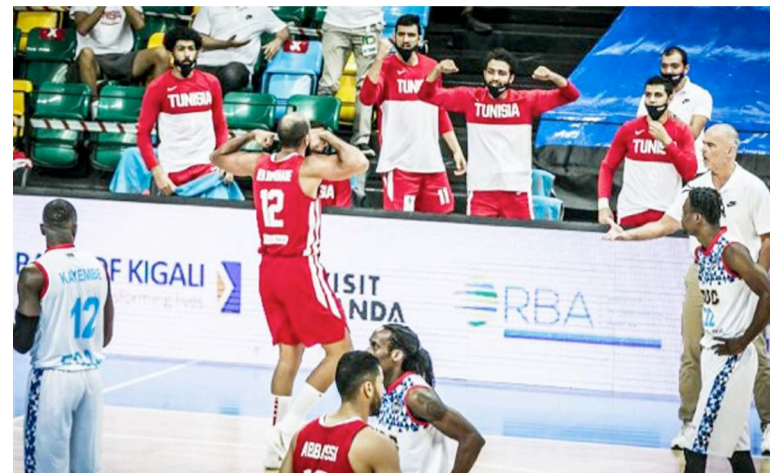
La RDC perd face à la Tunisie à Kigali aux éliminatoires de l'Afrobasket 2021

Les Léopards basket-ball masculins prennent part aux éliminatoires de l'Afrobasket 2021. Les fauves congolaises ont bien débuté ces éliminatoires à Kigali au Rwanda, le vendredi 27 novembre 2020, en battant les Fauves du Bas-Ougangi de la République Centrafricaine par 55 points à 51. Mais en deuxième sortie le samedi 28 novembre à Kigali Arena de la capitale rwandaise, ils n'ont pas été à la hauteur face aux Aigles de Carthage basket-ball de la Tunisie.