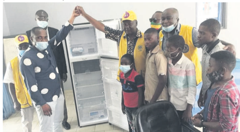
Les membres du Lions club posant avec les enfants atteints du diabète

L'ONG DiabAction a reçu le 26 novembre le don d'un réfrigérateur de la part de Lions club, destiné à la conservation de l'insuline.