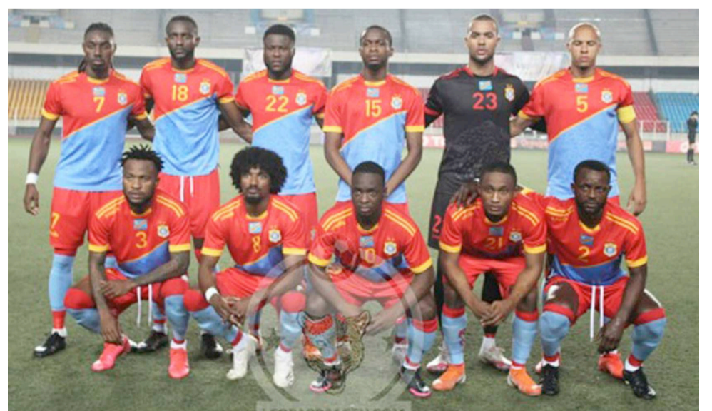
Les Léopards de la RDC