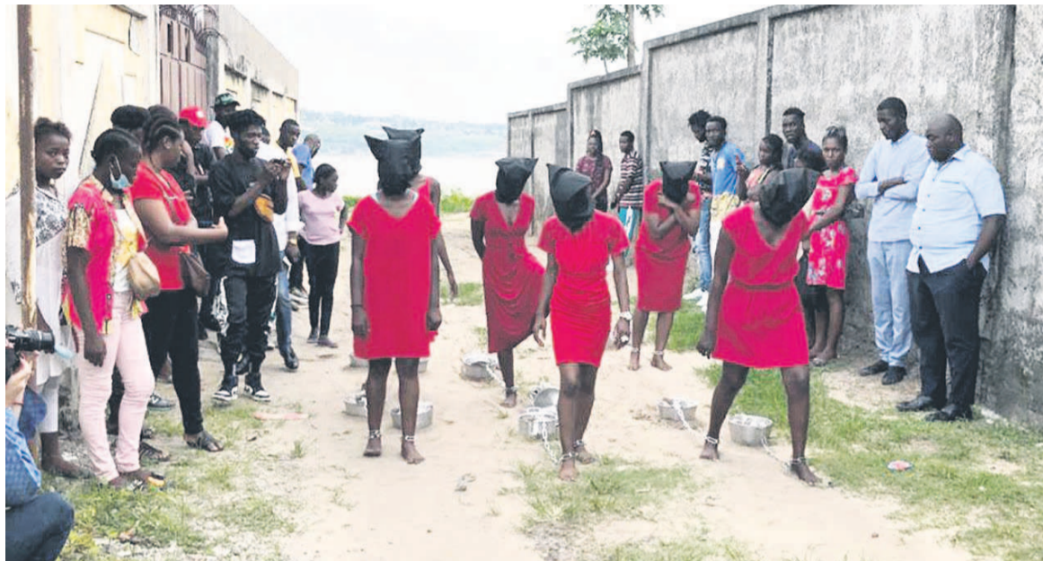
Six jeunes femmes en pleine performance artistique

Au prix de la sueur et d'un grand effort physique, ces jeunes femmes ont dû parcourir des dizaines de mètres avant d'arriver jusqu'à la scène finale du spectacle où elles ont eu droit à un rituel de sanctification. Durant le trajet, elles marchent, s'arrêtent un moment, puis reprennent la route. Elles crient, suffoquent et se tiennent la main en signe de solidarité. En bref, elles souffrent en silence ; endurent la honte, le mépris et le regard accablant de la société sans recevoir une quelconque aide majeure. Intitulée « Silence », la nouvelle