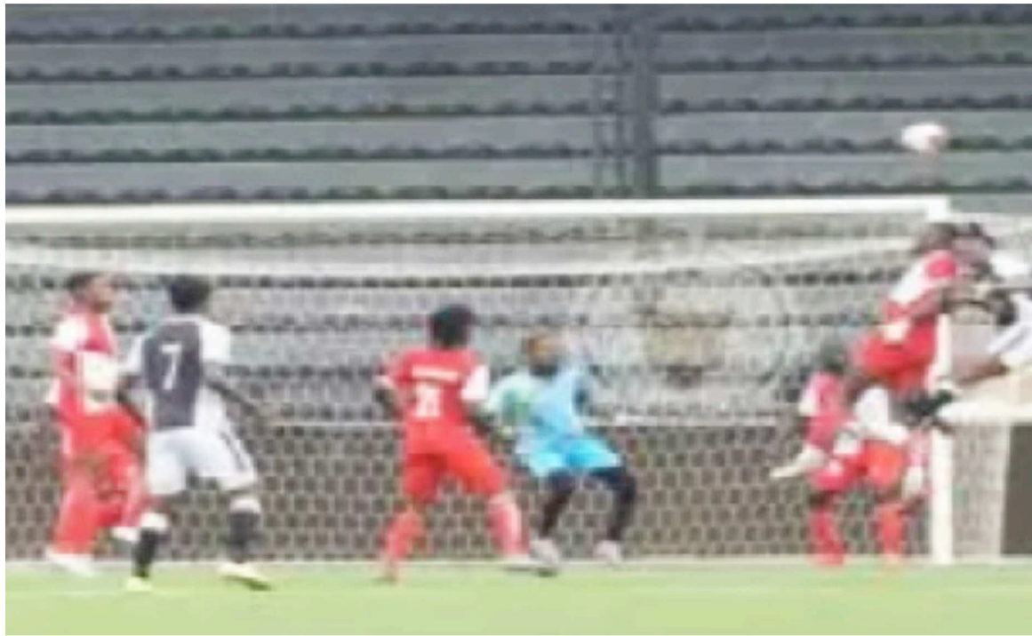
Mazembe pulvérise L'Shi Sport le 26 novembre