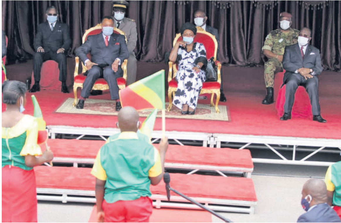
Une vue des officiels

Des perles tirées, on peut retenir : « L'eau de la source perd sa limpidité dès qu'elle devient vagabonde » ; « On n'échappe pas à la noyade en s'accrochant à la queue d'un crocodile » ; « Si le vent ne souffle pas, les feuilles ne s'agitent pas » ; « Le cœur est un étang, quand rien ne l'agite, la vague reste au fond » ; « Ne cherche pas à tenir le serpent avec la main d'autrui » ; « Dans une eau souvent troublée, les poissons et les tortues grandissent mal ». Faisant la lecture des 62 ans de la proclamation de la République, le secrétaire per-