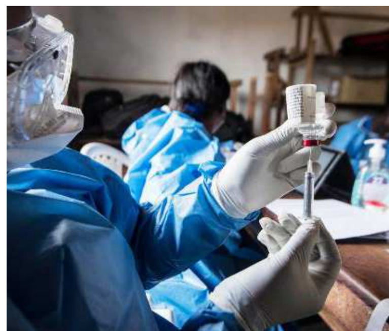
La production des vaccins anti covid-19 très attendue

Les efforts se multiplient à travers la planète pour vacciner la population à grande échelle. Ainsi le Fonds souverain russe (RDIF) a conclu un accord avec Hetero, fabricant indien de médicaments génériques, pour produire plus de 100 millions de doses du vaccin russe.