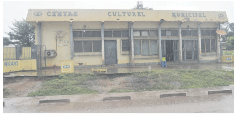
La façade principale du Centre culturel municipal de Nkayi

Le bâtiment abritant le Centre culturel de Nkayi, communauté urbaine du département de la Bouenza, se délabre. Les livres au programme manquent à la bibliothèque, les appels adressés aux partenaires pour redorer le blason de la structure ne se font pas entendre.