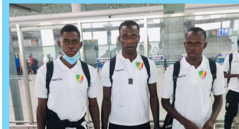
Les trois joueurs à l'aéroport

La présence des trois joueurs de l'AS Vegas dans l'ossature des Diables rouges des moins de 20 ans, qui participeront au tournoi de l'Union des fédérations de football d'Afrique centrale (Uniffac) qualificatif à la phase finale de la Coupe d'Afrique des nations, a renforcé la volonté de Doless Oviebo à oeuvrer dans la préparation de l'élite sportive congolaise de demain.