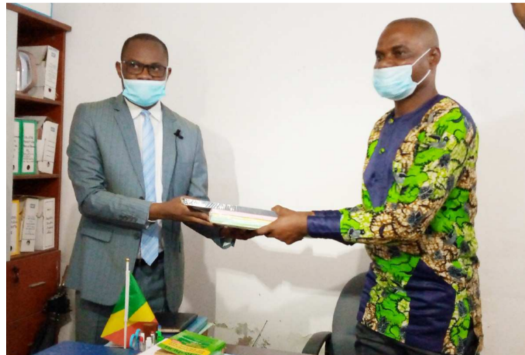
Le président de la synergie remetant le document au secrétaire général de la mairie a-t-il déclaré.

Selon lui, l'association ne pouvait pas réaliser les opérations de salubrité, la sensibilisation aux thèmes bien précis ainsi que des formations en faveur de la couche juvénile sans se faire connaître auprès des autorités. « L'acte que nous venons d'accomplir permettra d'accomplir les activités dans les neuf quartiers de Djiri. La feuille de route de la synergie a prévu plusieurs activités qui seront réalisées en fonction des moyens financiers disponibles de l'association »,