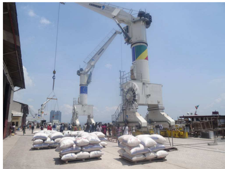
Les activités portuaires à Brazzaville-Adiac

Il faut ajouter des atouts liés à la position géographique du pays qui lui fait partager ses frontières avec cinq pays de la région, lui ouvrant de ce fait des portes commerciales sur un grand marché régional, dont celui de la République démocratique du Congo qui compte près de 80 millions d'habitants et autant de consommateurs, et sur le mar-