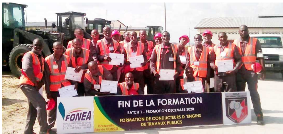
Une vue des apprenants

Le Fonds national d'appui à l'employabilité et à l'apprentissage (Fonea) a organisé, du 3 novembre au 11 décembre, une session de formation de conducteurs des engins poids lourds. Vingt jeunes issus de tous les départements du Congo ont pris part à cette formation à l'Ecole Génie travaux (EGT).