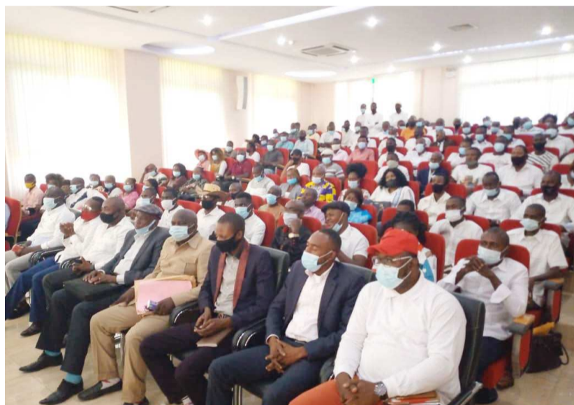
Une vue des membres de la plate-forme "DSN ou Rien" lors de l'assemblée générale Adiac

Le groupement d'associations politiques de soutien au chef de l'Etat s'appellera désormais "DSN ou Rien". Sa sortie officielle est prévue pour le 27 décembre prochain au Palais des congrès de Brazzaville.