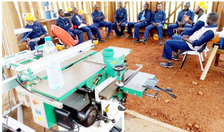
Les jeunes désœuvrés en formation

Une trentaine de jeunes filles et garçons de la communauté urbaine de Sembe, dans le département de la Sangha, suivent gratuitement une formation professionnelle sur des métiers visant à faciliter leur insertion sociale.