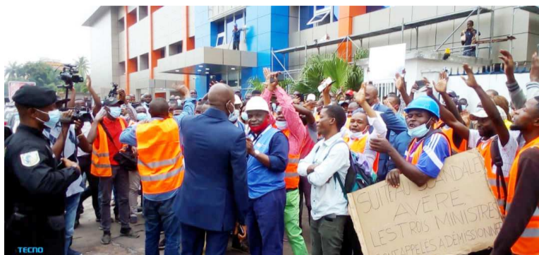
Les syndicats refusant l'accès au ministre de tutelle et à d'autres responsables

« Nous attirons l'attention des institutions de la République que le contrat de concession octroyé par le ministère des Postes, des Télécommunications et de l'Économie numérique en complicité avec le ministère de l'Économie, à une société privée, dénommée Yao Corp, pour exploiter la fibre optique en lieu et place de Congo Télécom, est un