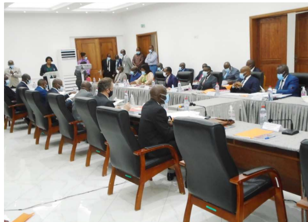
Une vue des administrateurs lors de la session budgétaire 2021

En dépit des indicateurs économiques inquiétants constatés, le Conseil a noté avec satisfaction les réalisations du PAPN au 30 septembre 2020, qui s'inscrivent dans la poursuite de la politique