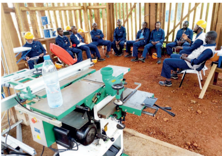
Les jeunes désœuvrés en formation

Une trentaine de jeunes filles et garçons de la communauté urbaine de Sembé, dans le département de la Sangha, suivent gra-