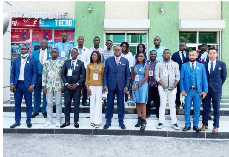
Le ministre Léon Juste Ibombo posant avec les postulants et la société partenaire

Le prix de l'innovation numérique engage les créateurs, les jeunes innovants à donner le meilleur d'eux-mêmes pour inventer le futur, pour