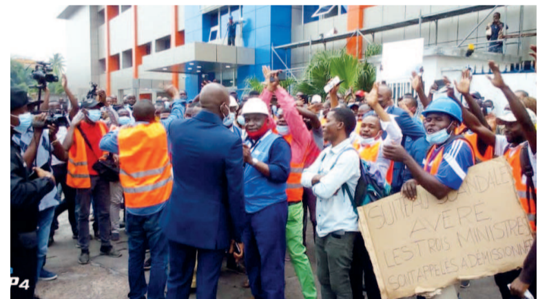
Manifestation des travailleurs devant le siège de CONGO-TELECOM

Dans une déclaration rendue publique le 14 décembre à Brazzaville, le ministre des Postes, des Télécommunications et de l'Économie numérique, Léon Juste Ibombo, a invité les travailleurs de l'opérateur public de télécommunications à ne pas céder à l'intox ni à la désinformation au sujet de l'exploitation de la fibre optique. Les travailleurs de Congo Télécom exigent le retrait d'un contrat de concession de la fibre optique concédé par la tutelle à une société