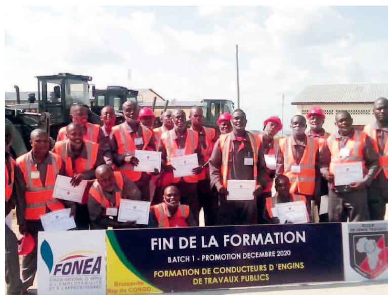
Une vue des apprenants