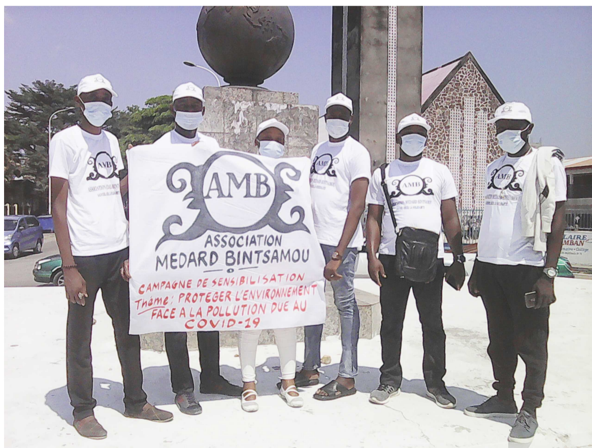
Des membres de l'association lors de la campagne de sensibilisation

PNUE sur la gestion des déchets Covid-19 présentent les conseils pour atténuer les effets négatifs de la pandémie sur l'environnement mondial : de la manière de