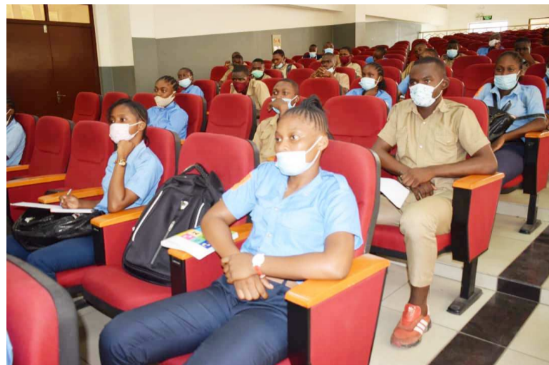
Des élèves suivant la communication sur les violences

Par ailleurs, les femmes ont été informées des dispositions prises par le Congo en matière de lutte contre les violences à l'égard du genre, du numéro vert 1444 du ministère de la Promotion de la Femme et de l'Intégration de la femme au développement en cas d'agression. Ce numéro est disponible à tout moment pour permettre