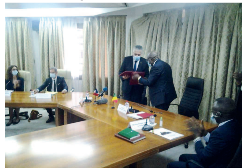
Echange de parapheurs entre le ministre des Finances et l'ambassadeur de France au Congo

En raison de la crise née de la pandémie de coronavirus (Covid-19), les pays créanciers membres du Club de Paris ont concrétisé, le 15 décembre à Brazzaville, la suspension du service de la dette de la République du Congo pour la période allant du 1er mai au 31 décembre 2020.