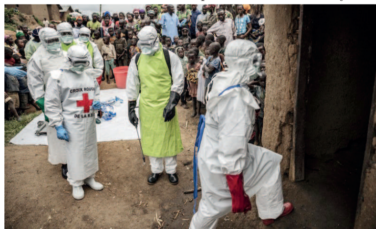
Province Nord Kivu, février 2020

La Fondation Carmignac a ainsi eu l'honneur de présenter « Congo in conversation » par Finbarr O'Reilly, un repor-