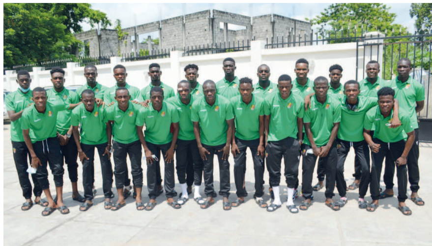
Les Diables rouges juniors avant le départ pour la Guinée Equatoriale

Les Diables rouges du Congo jouent leur premier match du tournoi 2020 de l'Union des fédérations de football d'Afrique centrale (Uniffac) des joueurs de moins de vingt ans, le 17 décembre au stade de Rebola face aux Lionceaux du Cameroun.