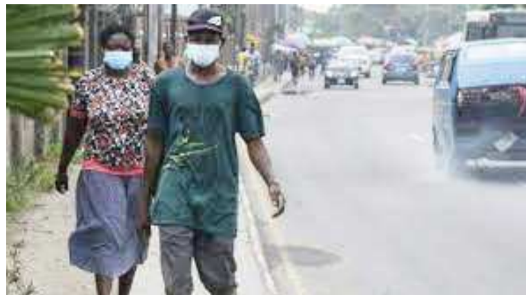
Le port du masque est obligatoire

Il a été aussi décidé l'interdiction des marches publiques, des productions artistiques et des kermesses, ainsi que des cérémonies festives et des réunions de plus de dix personnes. A cela, il faut ajouter la poursuite des compétitions sportives à huis-clos, le transport des dépouilles mortelles directement au lieu d'inhumation, sans aucune autre cérémonie. Quant aux églises et dé-