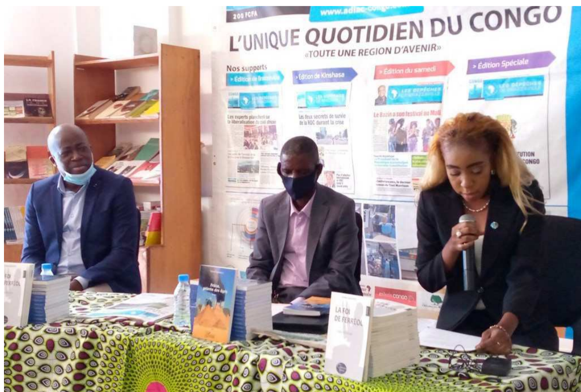
La représentante des éditions Renaissance africaine présentant « La foi de Ferréol »