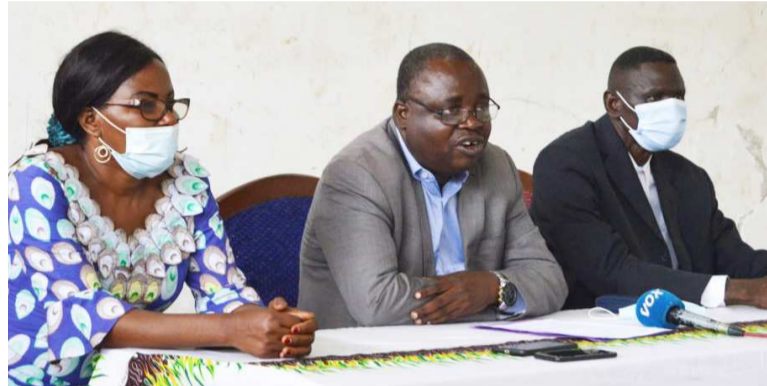
Les acteurs en formation sur la gestion du stress lié à la covid-19

des capacités des membres de l'équipe trauma counseling et des directeurs des écoles spécialisées le 16 décembre dans la capitale.