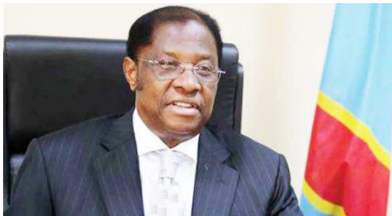
Alexis Thambwe Mwamba

Une pétition lancée contre le président de la chambre haute, Alexis Thambwe Mwamba, poursuit son cours normal. Au stade actuel, à en croire des indiscretions, elle aurait déjà recueilli plus de soixante-dix signatures sur les cent neuf sénateurs. Alexis Thambwe Mwamba qui ne paraît pas être ébranlé par cette pétition qu'il savait inévitable après le coup réussi à l'Assemblée nationale, s'est dit disposé à quitter le perchoir de la