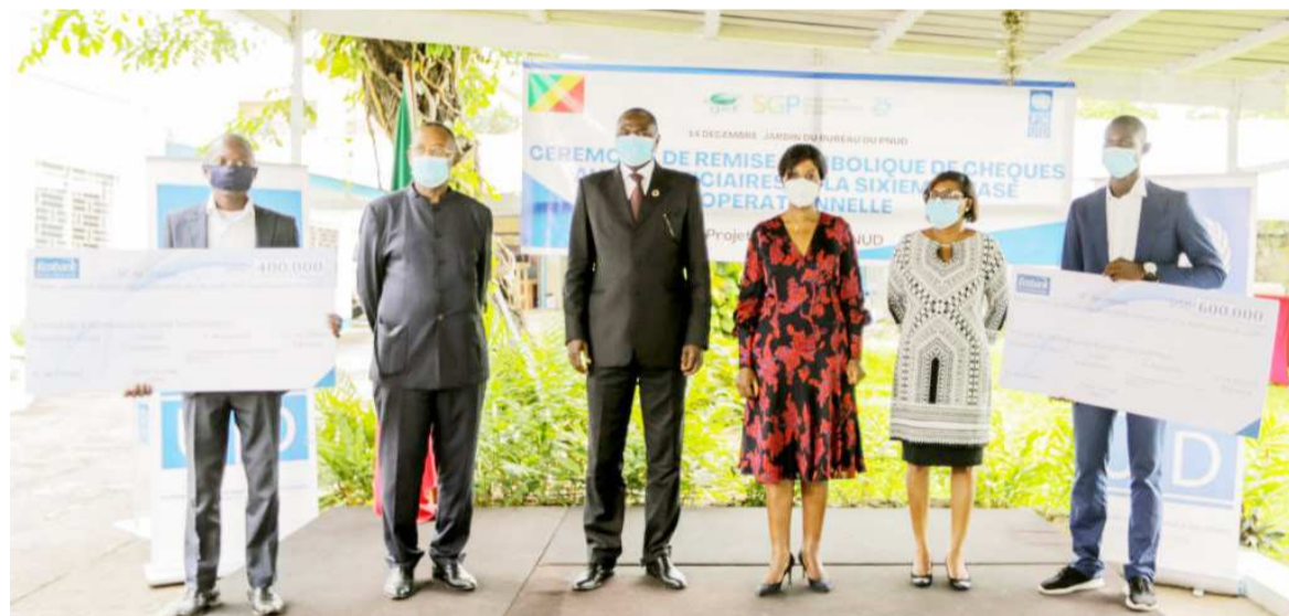
Les bénéficiaires posant avec la ministre et le représentant résident du PNUD au Congo/DR

Ces tourbières, poursuit-elle, séquestrent environ trente milliards de tonnes de carbone, l'équivalent de quinze ans d'émissions de CO 2 de la planète. « Nous devons cependant admettre qu'aucune forme de conservation n'est possible sans une forte implication et un accompagnement consistant des acteurs de terrain, c'est-à-dire les citoyens et les populations riveraines des aires protégées que vous représentez. C'est vous qui