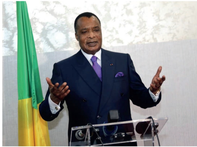
Le président Denis Sassou N'Gusso lors de sa déclaration en Guinée-Bissau.

« ... Nous avons lutté ensemble au front de l'Angola,