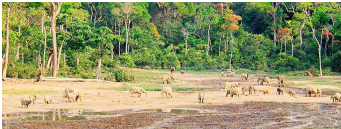
Le parc Nouabalé-Ndoki, au nord Congo/DR

« Les ministres ont pris des résolutions suivantes: veiller à ce que le plan d'affectation des terres du TNS, adopté en 2010, soit intégré dans le plan directeur national d'affectation des terres en cours d'élaboration dans chacun des pays; veiller à ce que l'octroi des permis miniers dans les zones de conservation soit