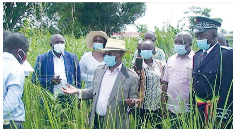
Le ministre en charge de la Recherche visitant la station d'Odziba

Dans l'optique de redonner à la station de recherche agronomique d'Odziba, dans le Pool, sa vocation de production du manioc, le ministre de la Recherche scientifique a invité les chercheurs à s'investir davantage pour la relance de cette culture, aliment