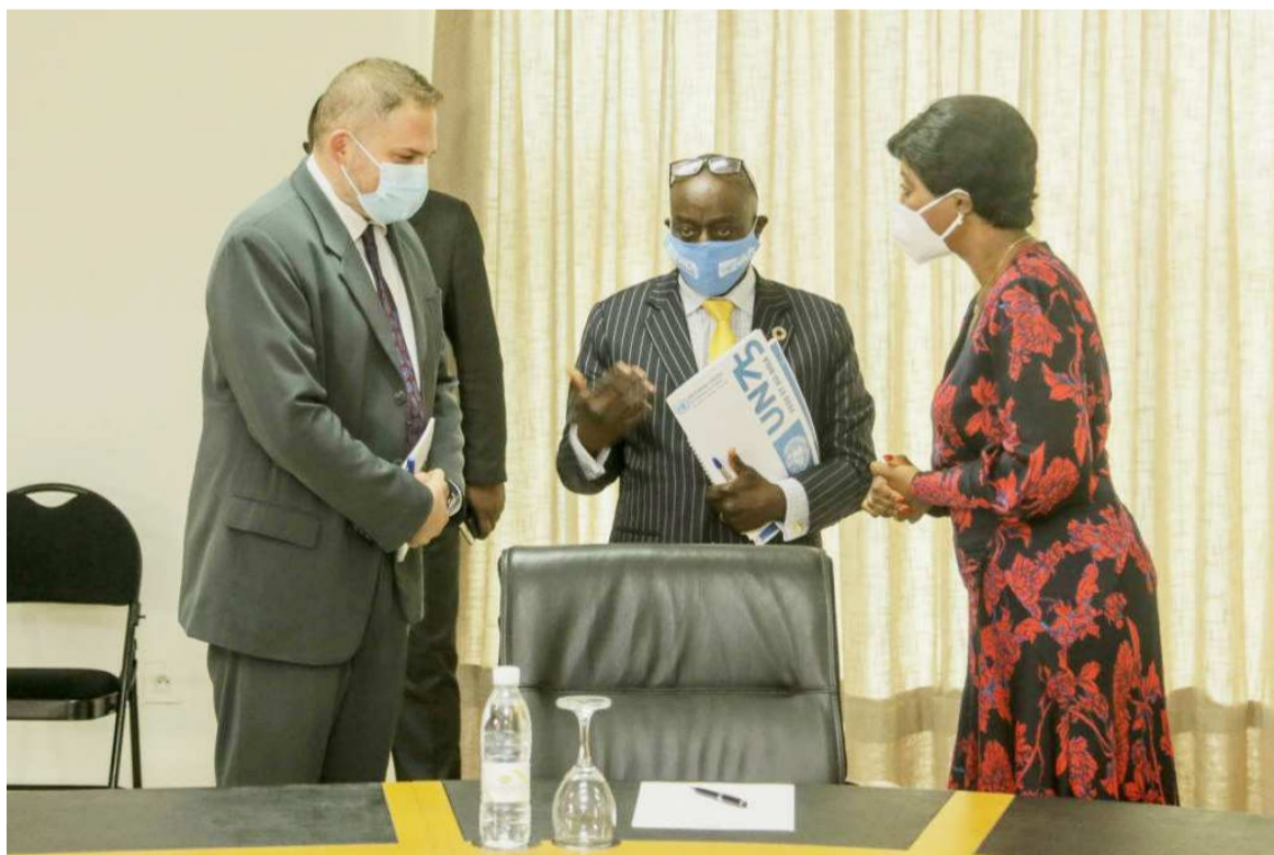
La ministre du Tourisme et de l'Environnement recevant le coordonnateur du système des Nations unies au Congo/MTE

De son côté, la ministre du Tourisme et de l'Environnement a aussi exprimé sa joie à l'issue de ces échanges. « Cette rencontre entre nous est arrivée à point nommé pour nous permettre de faire le point des différentes agences d'exécution des Nations unies sur la coordination de l'ambassadeur, du secrétaire général des Nations unies en République du Congo... Faire le