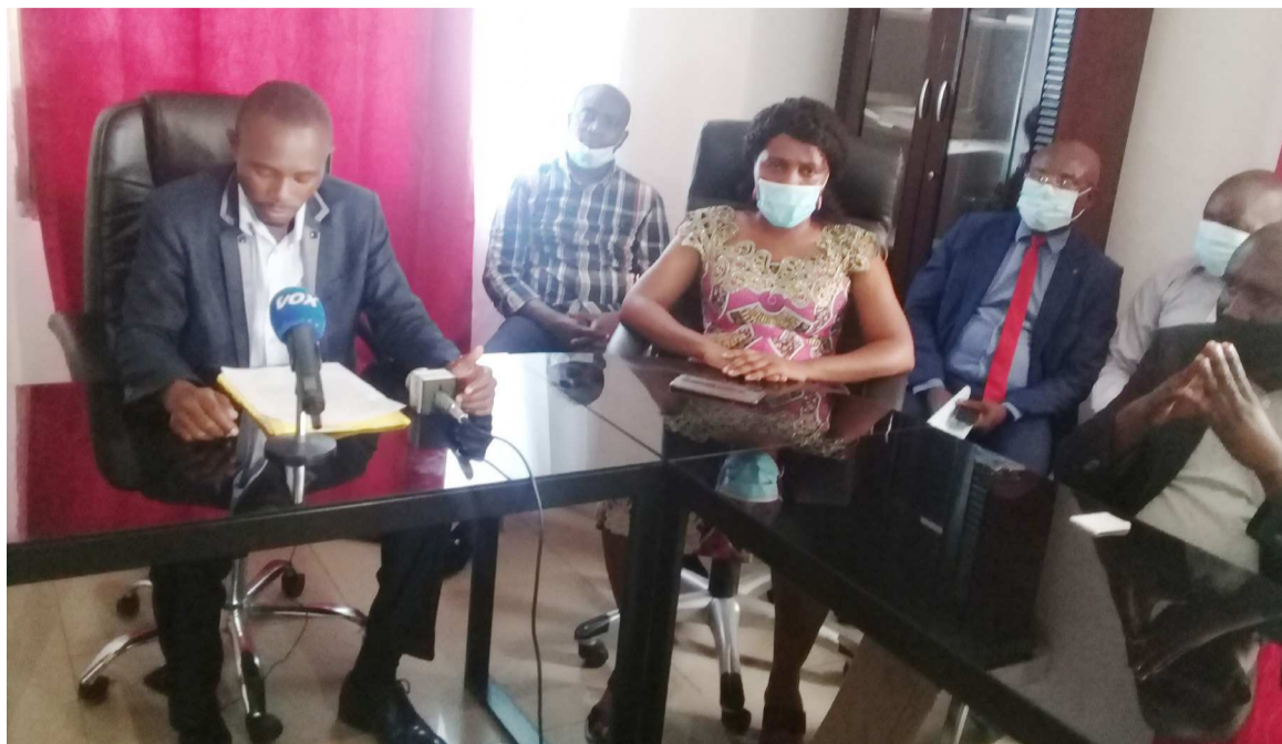
Une vue des membres du COSUC