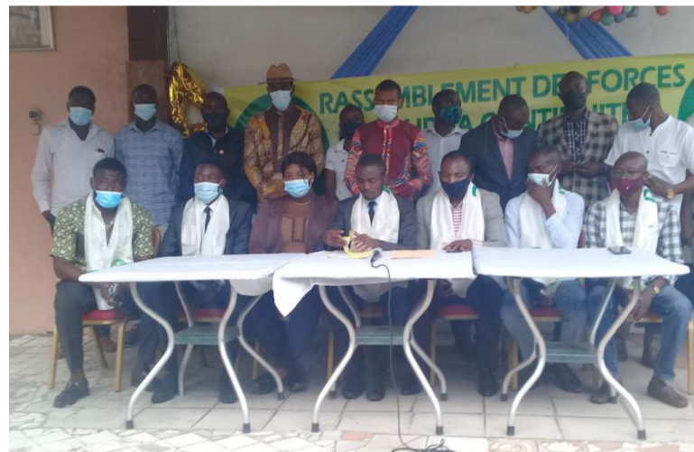
Les membres du RFC lors de la sortie officielle

Le Rassemblement des forces pour la continuité est une dy-