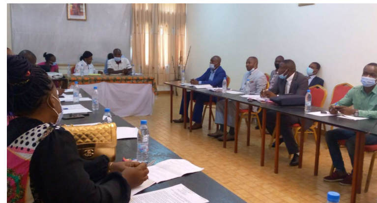
Le conseil d'établissement de l'Irssa/Adiac

L'objectif du conseil d'établissement était de faire le bilan des activités réalisées et d'en dégager les perspectives. Selon la directrice scientifique de l'Institut, les perspectives s'articulent notamment sur les propositions des directeurs des différents centres de recherches, le per-