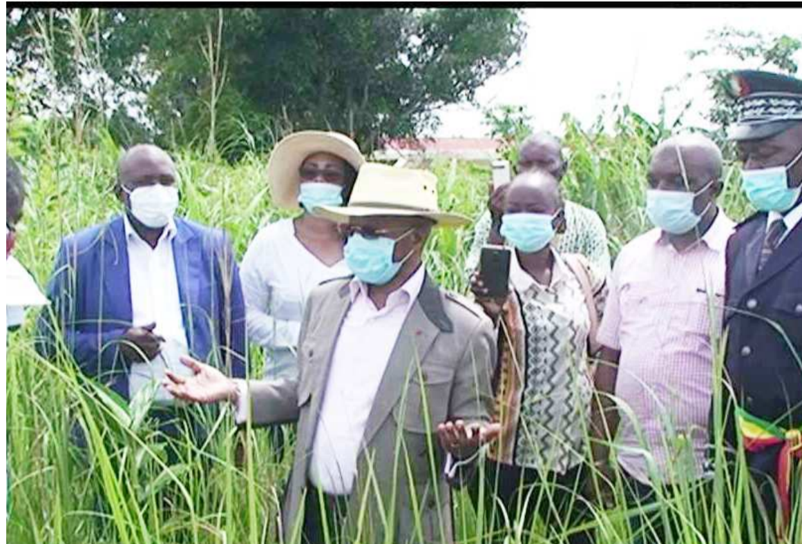
Le ministre en charge de la Recherche visitant la station d'Odziba