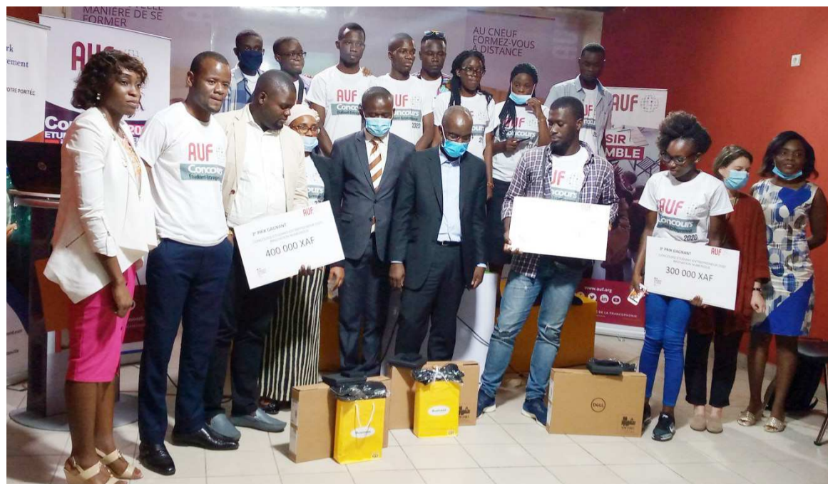
Les participants du concours posant avec les organisateurs