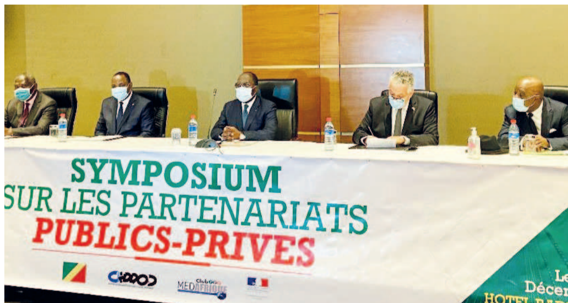
Le présidium du symposium

Le symposium sur le partenariat public-privé, qui se tient à Brazzaville du 21 au 22 décembre, vise à organiser des échanges entre les experts et sensibiliser des acteurs publics à l'utilisation, aux intérêts et aux différents