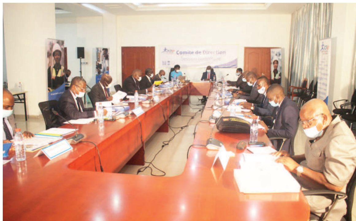
Le comité de direction de l'ACPE en session budgétaire

Par ailleurs, le budget 2020, le plan stratégique, le programme 2020-2022, et