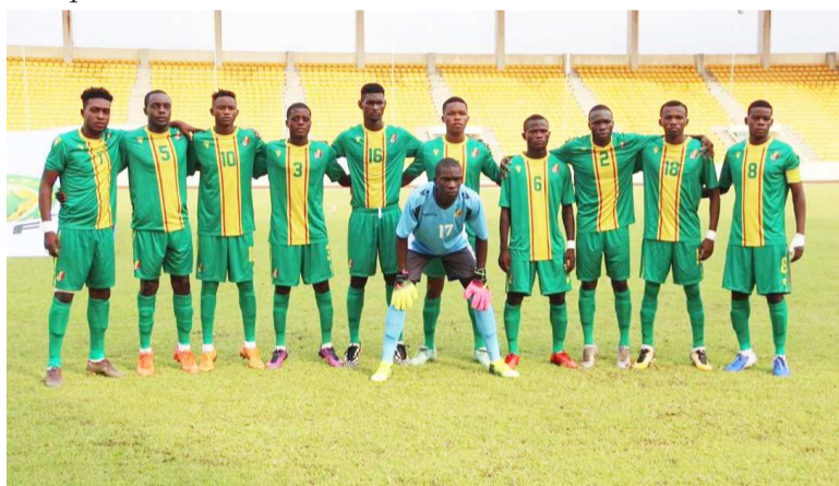
Les Diables rouges U20DR

C'est finalement la contre-performance du 17 décembre face au Cameroun, 1-3, qui a coûté l'élimination au Congo. Cette élimination l'empêche automatiquement de réaliser le rêve des jeunes joueurs congolais, celui de prendre part à la 12e édition de la CAN puisque la parti-