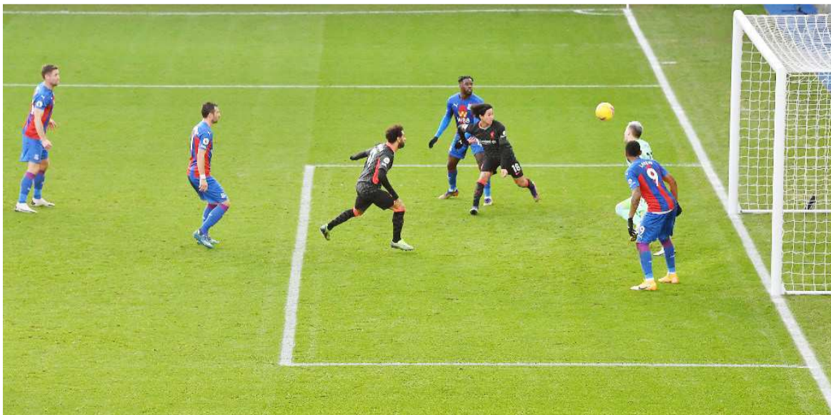
Avec un doublé et une passe décisive, l'Égyptien Mo Salah a participé au carton de Liverpool à Crystal Palace