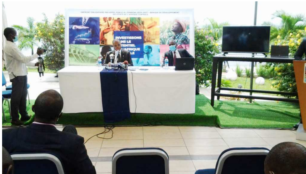
Le président de la Bdeac (à gauche) lors du lancement de l'emprunt obligataire