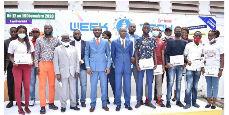
Les organisateurs de la formation et les apprenants

Durant cinq jours, quarante-neuf apprenants dont dix-neuf filles et trente garçons ont été formés en Photographie, Photoshop, Access et Powerpoint, par le Centre d'apprentissage aux métiers de l'informatique (CAMI) lors de la 5e édition de weekTech.