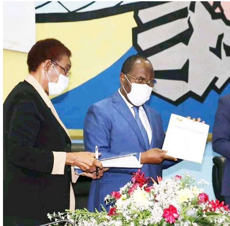
Le Premier ministre brandissant le document du mécanisme humanitaire

Le mécanisme humanitaire que le pays vient de se doter, et réceptionné par le Premier ministre, Clément Mouamba, obéit à la nécessité de combler les faiblesses relevées dans le dispositif d'organisation de secours, d'améliorer la coordination des crises aux niveaux national, départemental et communal, en raison du caractère transversal et multisectoriel de la gestion de l'humanitaire, d'établir de meilleures synergies d'actions