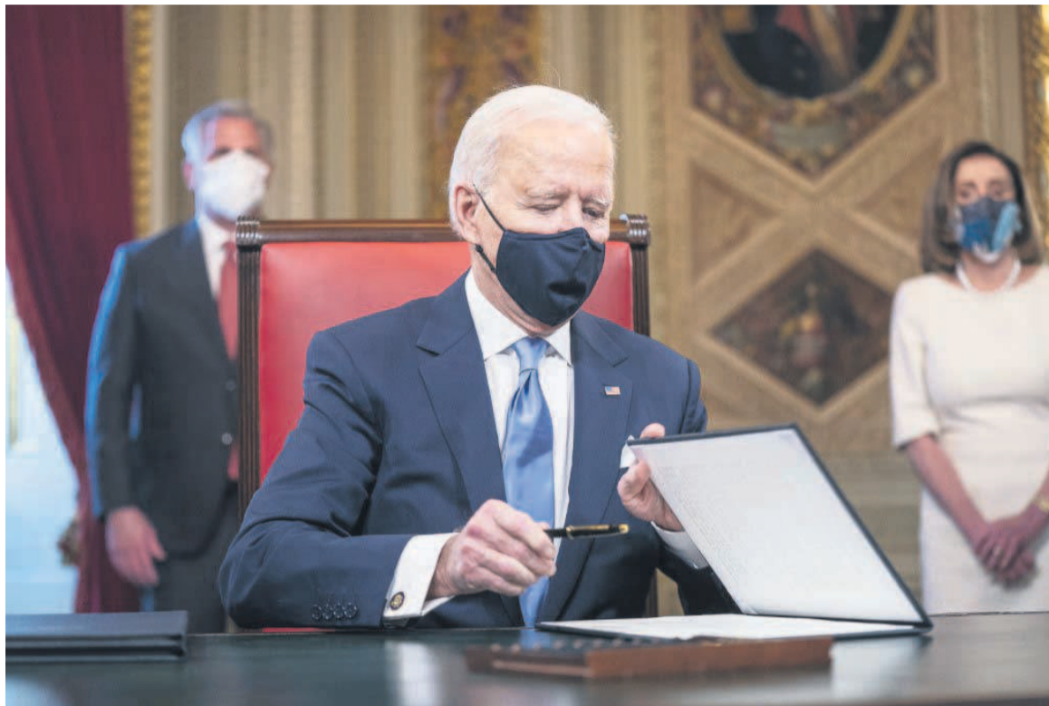
Joe Biden lors de son investiture mercredi à Washington

Joe Biden a appelé à l'« unité » et promis de « vaincre le suprématisme blanc et le terrorisme intérieur ». « Il y a beaucoup de choses à réparer, beaucoup de choses à restaurer, à guérir. L'Amé-