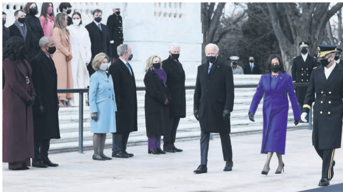
Joe Biden et sa vice-présidente Kamala Harris devant les couples Obama, Bush et Clinton

L'immunologue Anthony Fauci interviendra au nom des Etats-Unis à une réunion du conseil exécutif de l'OMS dès jeudi, a déclaré Jeff Zients, qui coordonne la réponse de la nouvelle administration à la pandémie de Covid-19. Pour limiter la propagation du virus, le président devrait signer également un décret pour