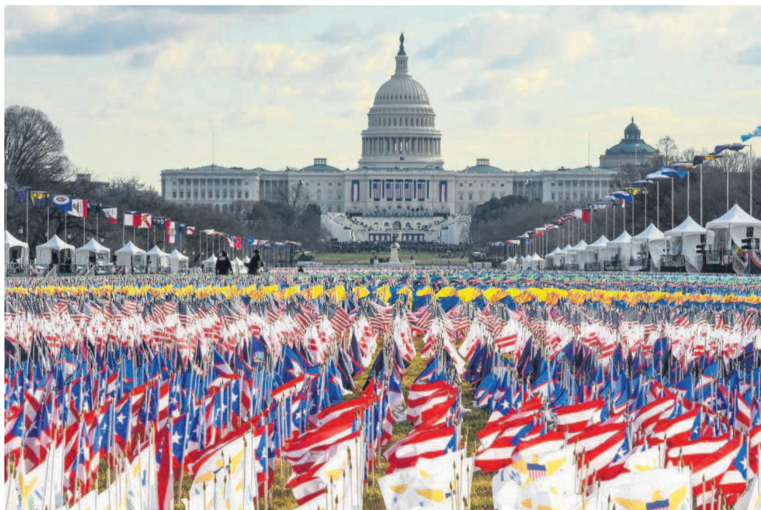
En raison des restrictions sanitaires liées au Covid-19, l'investiture a eu lieu sans public, remplacé par des milliers de drapeaux étasuniens (STEPHANIE KEITH/GETTY IMAGES NORTH