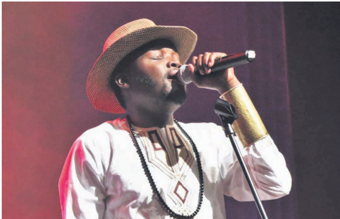
La musique, l'une des disciplines concernées par l'offre de résidence

Depuis plusieurs années, la Cité internationale des arts déploie un programme de résidence sur appel à candidatures ouvert à plusieurs disciplines. Centré sur le temps nécessaire dont chaque artiste a besoin pour réaliser son projet, il laisse la possibilité à chacun de postuler à des résidences entre deux et douze mois. Ces résidences s'adressent à des artistes et commissaires d'exposition français ou étrangers, dans le champ des arts visuels, de la musique, des écritures et du spectacle vivant, âgés de plus de 18 ans. Lieu de vie ouvert au dialogue entre les cultures et les époques, ces moments de résidence permettent aux artistes de rencontrer plusieurs publics et de nouer des contacts avec de nombreux professionnels du monde de la culture et des arts. Ils offrent, par ailleurs, un environnement favorable à la création, ouvert aux rencontres avec des professionnels du milieu