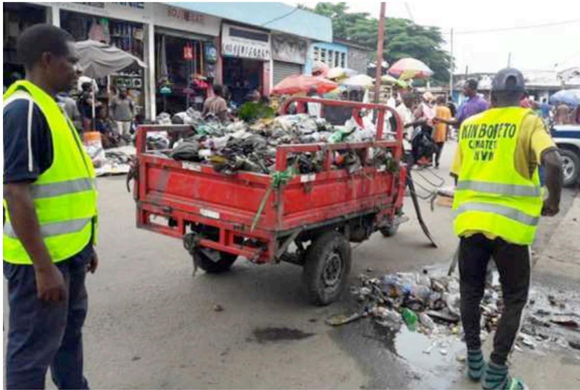
Enlèvement des immondices au marché Matete, à Kinshasa.

Arrivés sur place le matin du 21 janvier, les vendeurs, qui avaient crié victoire la journée du 20 janvier quand ils