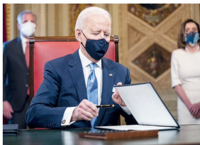
Joe Biden signant les décrets

Aussitôt après son investiture le 20 janvier, le nouveau président des Etats-Unis d'Amérique, Joe Biden, a signé des décrets portant retour de son pays à l'Organisation mondiale de la santé et à l'Accord de Paris sur le climat. C'est pour cette raison que son arrivée à la Maison Blanche a suscité des réactions positives à l'échelle internationale.