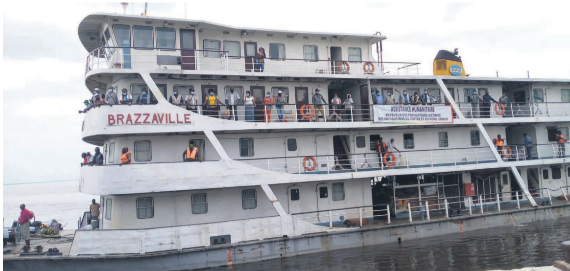
Le bateau humanitaire en provenance des localités inondées