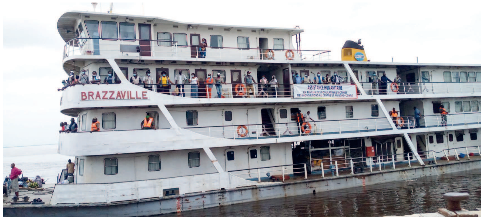
Le bateau humanitaire en provenance des localités inondées