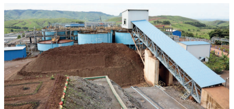
Travaux de l'usine des polymétaux de Mfouati

Mise en service en novembre 2019, l'usine de traitement des polymétaux, la Soremi a enregistré des résultats encourageants en l'espace d'une année. Située à Mfouati, dans le département de la Bouenza, cette société spécialisée dans la production du cuivre, du zinc et du plomb a contribué, selon le conseil des ministres, à l'amélioration des conditions de vie des populations riveraines. « La Soremi a commencé à verser une somme de 30 millions FCFA par an à chacun des deux districts pour