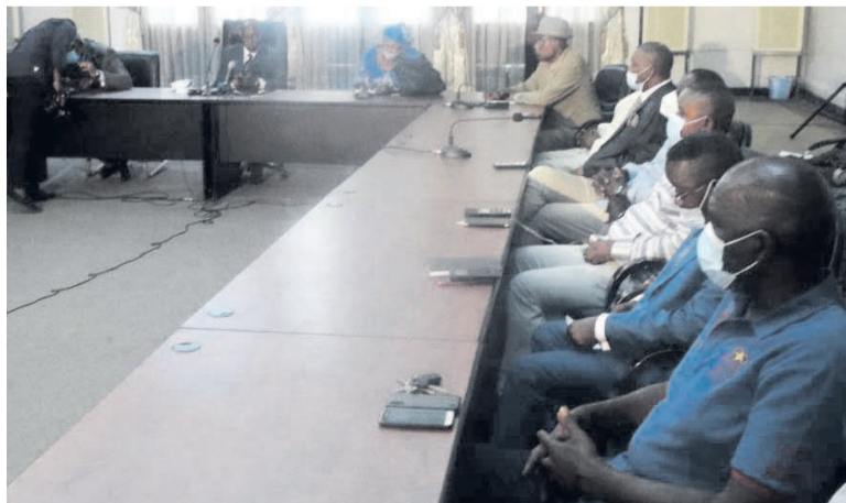
Les membres du Copéco lors de leur rencontre