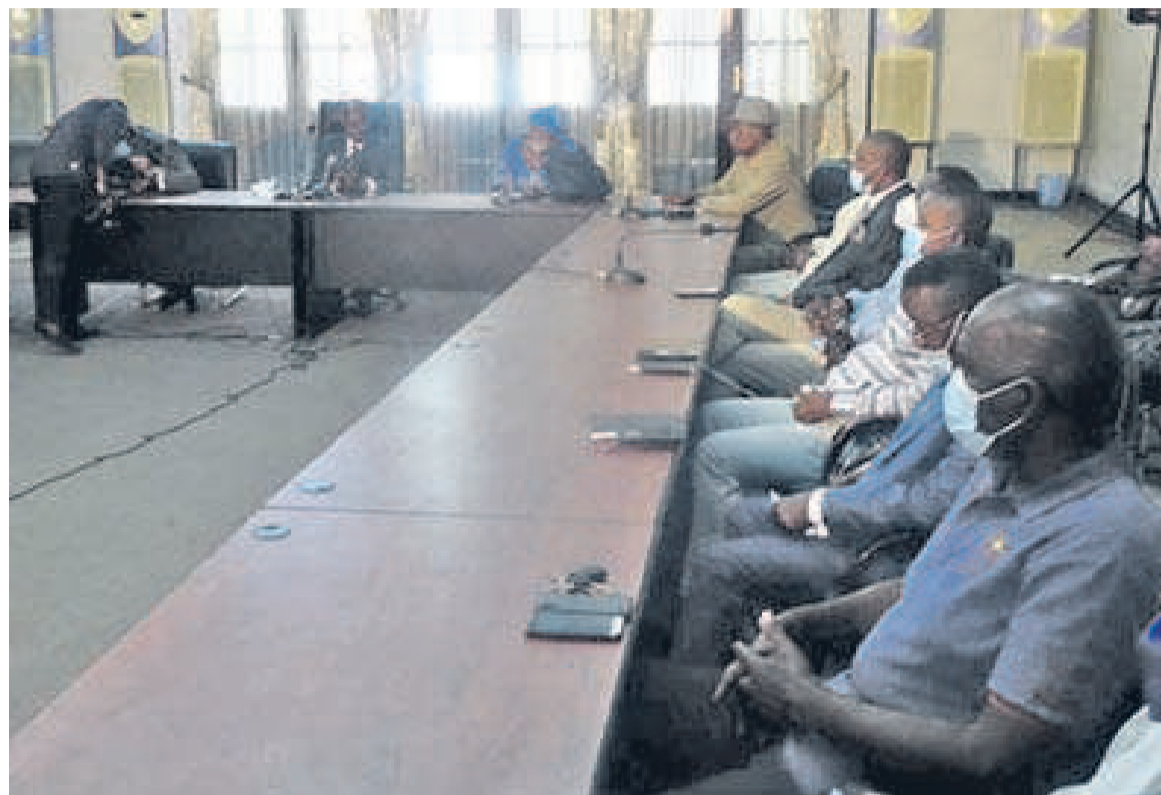
Les membres du Copéco lors de leur rencontre Adiac

Il faut rappeler que le gouvernement a négocié et obtenu d'un groupe de banques la mobilisation de 300 milliards FCFA destinés à l'apurement d'une partie de la dette intérieure commerciale. Le Club de Brazzaville, composé des banques BSCA, LCB, BGFI et Écobank, est chargé du règlement des créances selon un mécanisme qui favorise la relance de l'économie nationale.