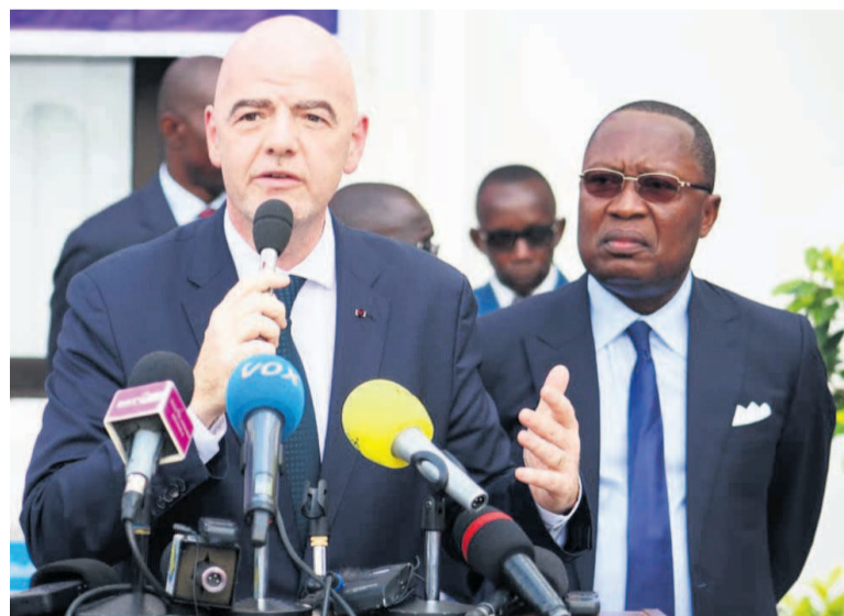
Gianni Infantino lors de son passage à Brazzaville en 2019

Giovanni Vincenzo Infantino dit Gianni Infantino, né le 23 mars 1970 à Brigue, en Valais (Suisse), est un juriste italo-suisse, secrétaire général de l'UEFA