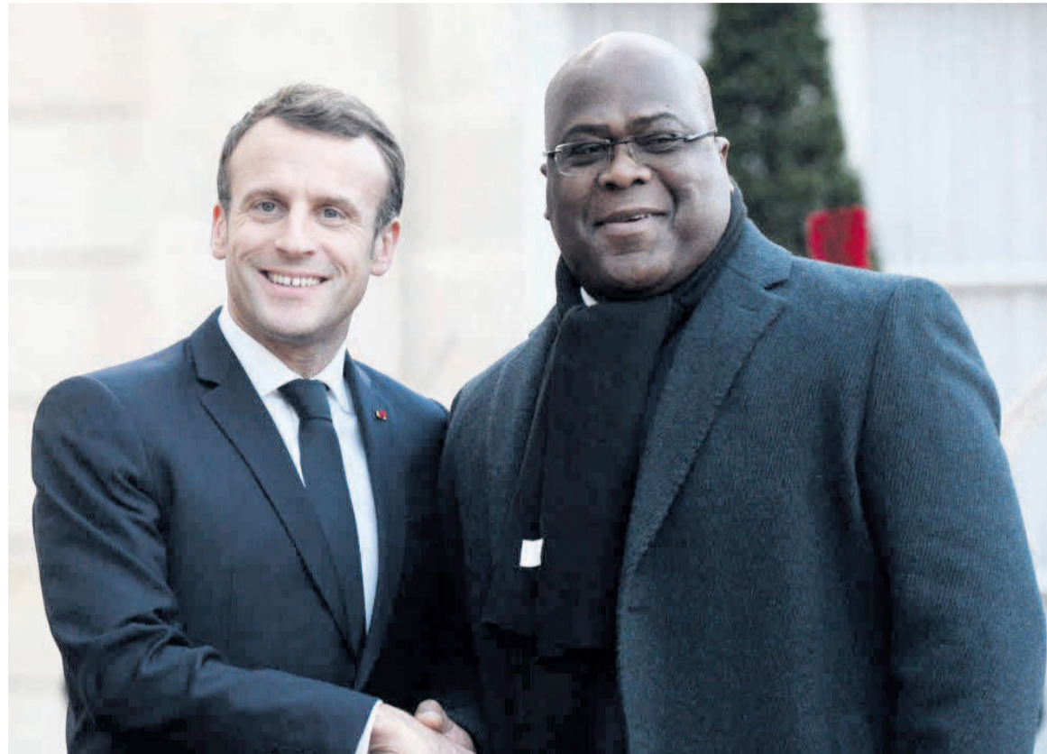
Félix Tshisekedi et Emmanuel Macron

La problématique d'accès équitable aux vaccins contre la Covid-19 ainsi que le soutien de la France aux systèmes de santé africains étaient au menu des discussions. Cette réunion, in-