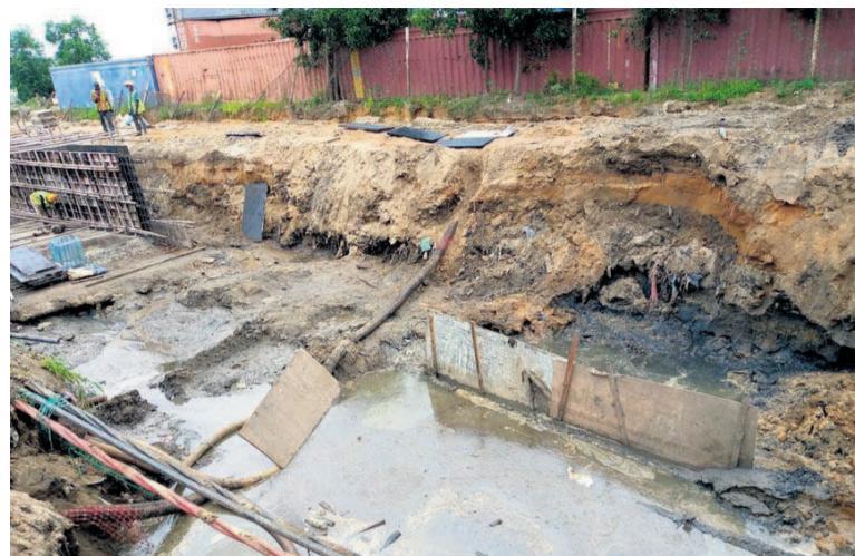
L'entrepôt des déchets hydrocarbonés dangereux du Port autonome de Pointe-Noire

Au regard de l'ampleur des dégâts, la ministre du Tourisme et de l'environnement a indiqué que les parties prenantes devaient agir dans l'urgence afin de ne pas exposer les populations qui fréquentent ces lieux, mais aussi de conserver les écosystèmes marins et côtiers.