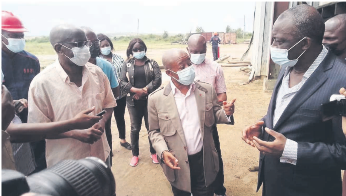
Le ministre de la Recherche scientifique lors de la visite de la SNBI