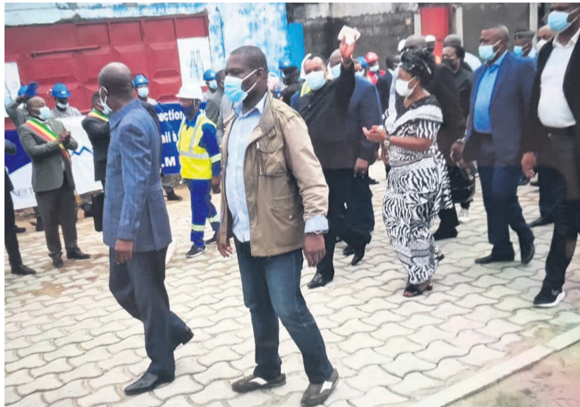
Le chef de l'Etat visitant les voiries pavées du quartier Mboukou/Adiac

« C'est un rêve qui se réalise, l'hôpital général de Patra est en cours d'opérationnalisation et sera mis à la disposition du public dans les prochains jours. Ainsi le président de la République nous a fait l'honneur de venir constater lui-même qu'effectivement le troisième hôpital de Pointe-Noire sera bientôt ouvert à la population. En plus de la formation du personnel, cet hôpital introduit des innovations technologiques qui n'existent pas encore dans notre pays, avec un modèle de gestion qui nécessite un personnel extrêmement qualifié. Des Congolais qui ont été formés à la maintenance des équipements sont déjà en train de travailler avec des équipes du constructeur en vue de prendre effectivement connaissance de tout le matériel qui sera installé et de toute la gestion technique de cet hôpital. Les équipes médicales sont en train d'être constituées, une partie est déjà à l'œuvre notamment le responsable du projet d'opérationnalisation », a-t-elle déclaré.