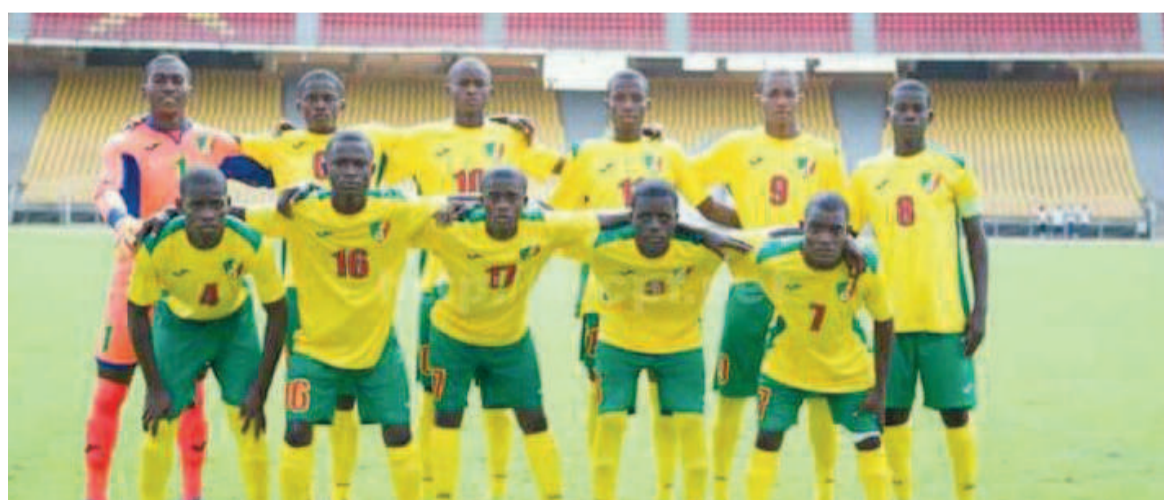
Les Diables rouges des moins de 17 ans

Huit ans après leur dernière participation, les Diables rouges des moins de dix-sept ans ont été directement qualifiés à la phase finale de la Coupe d'Afrique des nations de la catégorie prévue cette année au Maroc. « La Commission d'organisation des compétitions des jeunes de la CAF a donc décidé d'engager les deux finalistes, à savoir le Congo et le Cameroun, finalistes de la dernière édition des qualifications zonales de l'Uniffac édition 2019 », précise un document officiel transmis par la CAF à la Fécofoot.