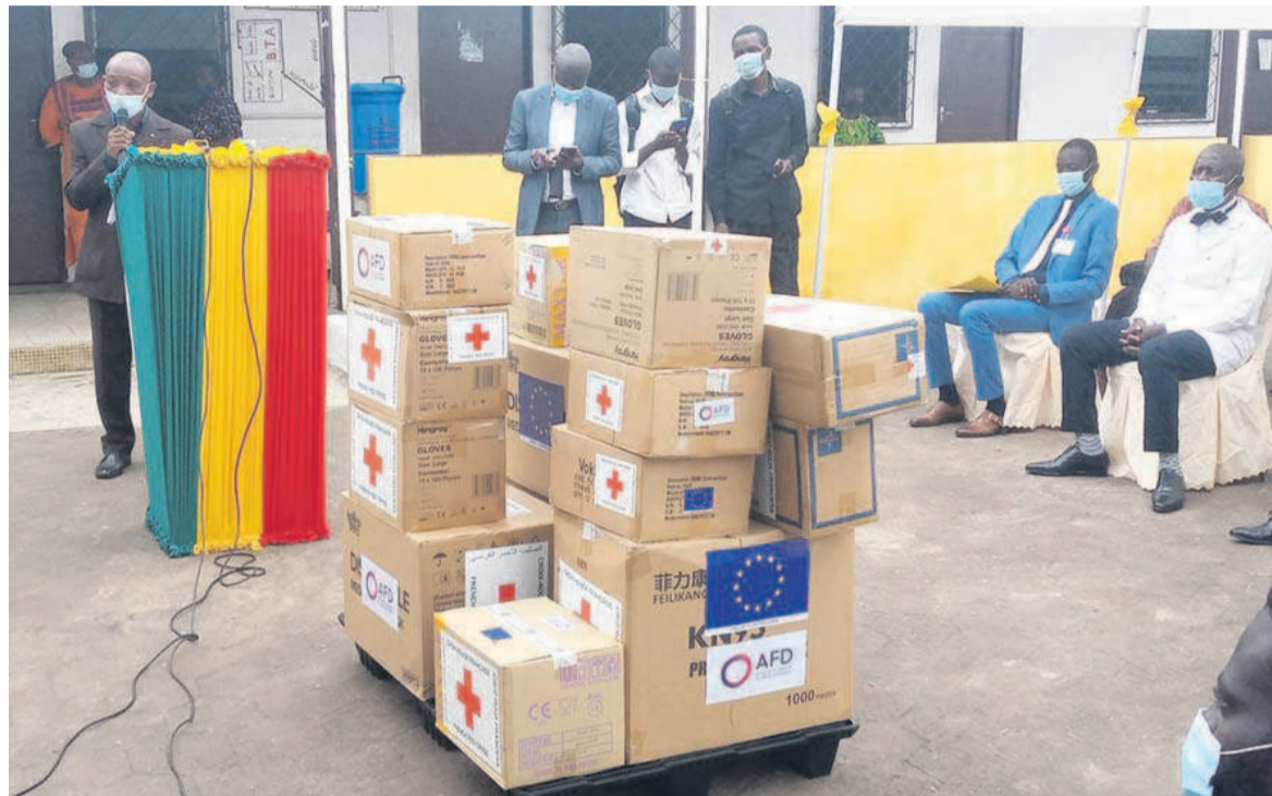
Le matériel de protection individuelle (Adiac)

La ministre des Affaires sociales, de l'Action humanitaire et de la Solidarité, Antoinette Dinga Dzondo, a lancé le 22 février la campagne nationale de dotation des formations sanitaires en équipement de protection individuelle au Centre de santé intégré de Moukondo, basé à Mougali dans le quatrième arrondissement de Brazzaville.