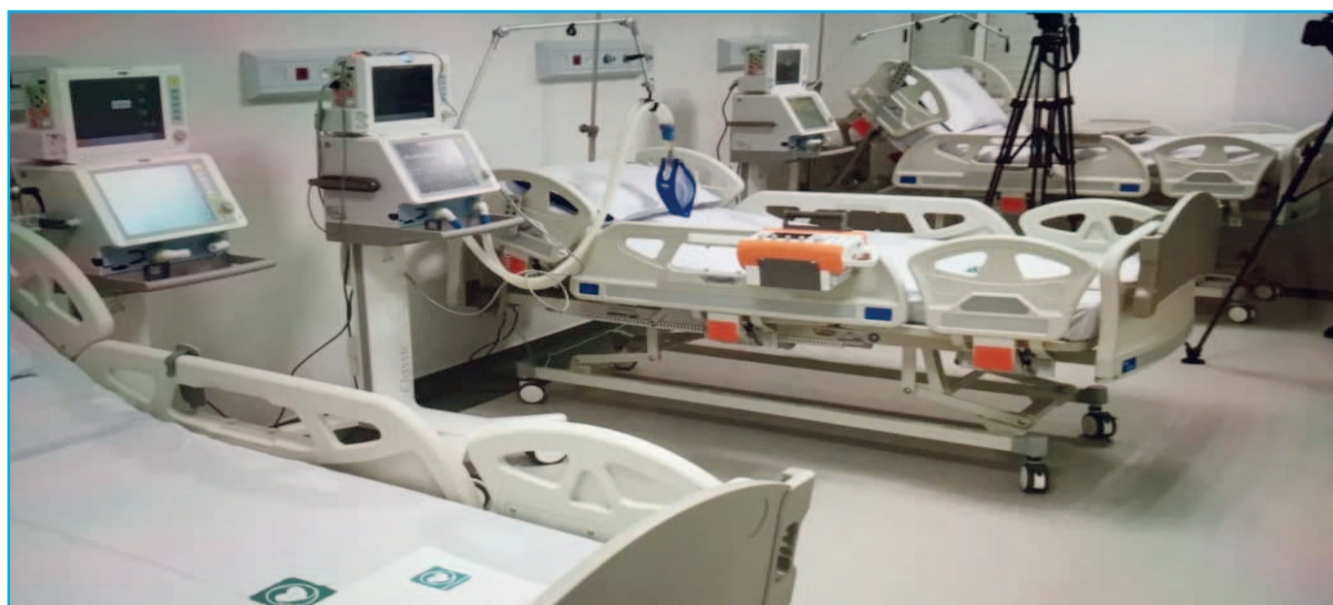
L'unité de prise en charge Covid-19 de l'hôpital général de Pointe-Noire visitée par le président Denis Sassou N'Guesso

Le président de la République, Denis Sassou N'Guesso, s'est rendu, lundi, successivement sur trois sites à Pointe-Noire où sont construits un hôpital général dans l'arrondissement 6 Ngoyo, les voiries urbaines dans l'arrondissement 3 Tié-Tié et le siège du port autonome en bordure de mer dans le 1 er arrondissement Lumumba.