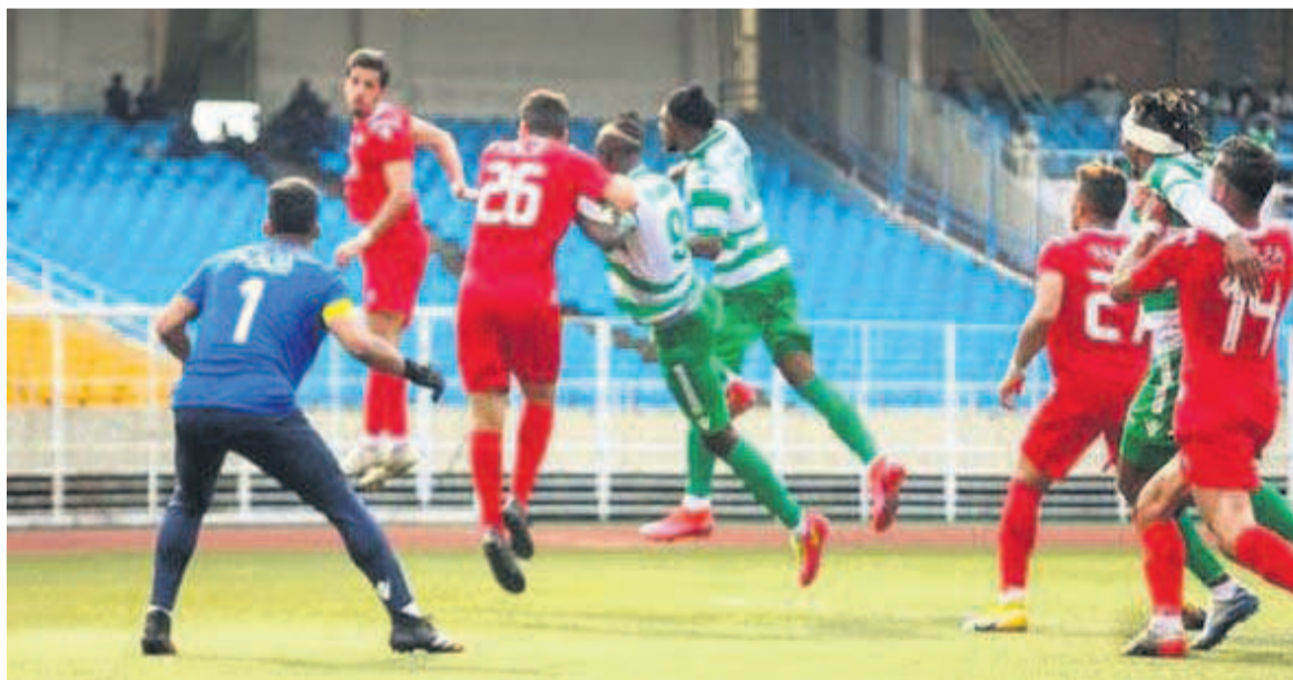
Une action offensive du DCMP dans le camp d'Al Ahly Benghazi le 21 février à Kinshasa