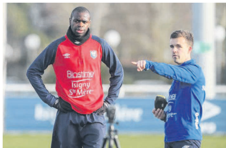
Prince Oniangue fait son retour, lundi soir, dans le groupe de Caen