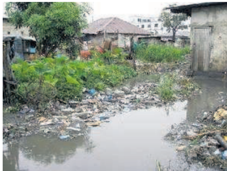
Un quartier précaire inondé

D'après les formateurs de (MOS), les objectifs de l'atelier ont été atteints durant les six jours d'échanges fruits marqués par les débats théoriques et les pratiques. En effet, les participants ont pu s'approprier les