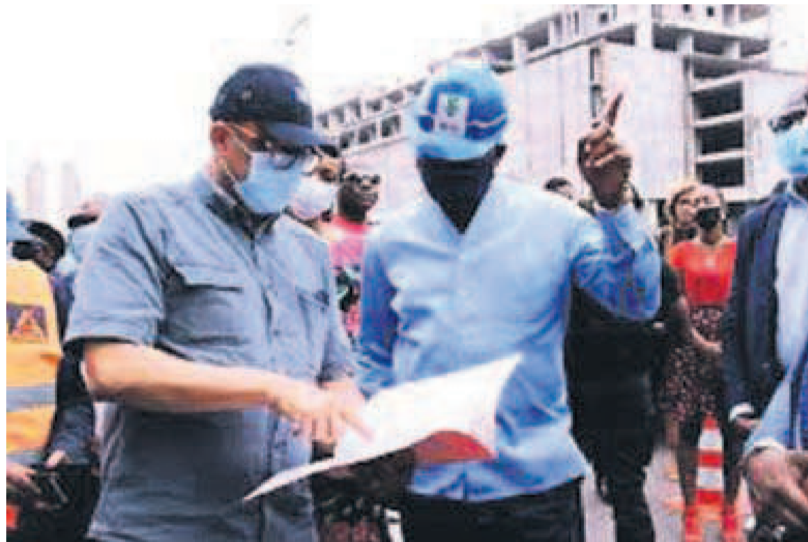
Le gouverneur Ngobila lors du lancement de cette opération

Le gouverneur Ngobila a indiqué que la Société nationale d'élec-