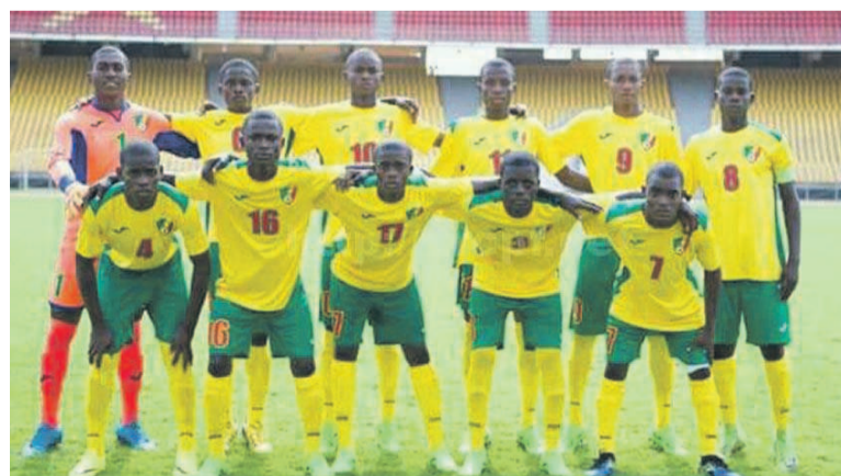
Les Diables rouges des moins de 17 ans DR

Il n'y aura pas les éliminatoires pour sélectionner les représentants de l'Union des fédérations de football d'Afrique centrale (Uniffac). Les finalistes de la dernière phase éliminatoire en 2019, notamment le Cameroun (tenant du titre) et le Congo ont reçu le feu vert de la CAF pour représenter l'Uniffac à la phase finale de la CAN prévue cette année au Maroc. « La Commission d'organisation des compétitions des jeunes de la CAF a donc décidé d'engager les deux finalistes de la dernière édition des qualifications zonales de l'Uniffac édition 2019 à la phase finale de la CAN U-17 Total 2021 à savoir le Cameroun et le Congo », peut-on lire dans la correspondance du 18 février. Cette commission a pris cette dé-