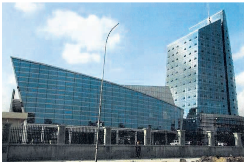
Vue du siège du port autonome de Pointe-Noire