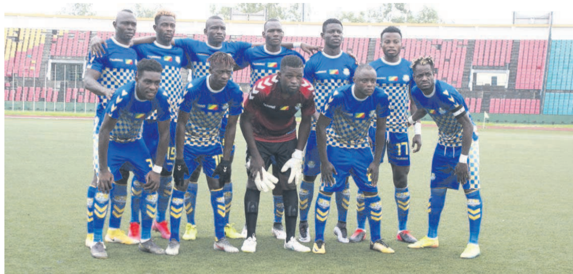
L'équipe de l'AS Otohô nouveau leader du championnat

L'AS Otohô a profité de la contre-performance des Diables noirs face au FC Kondzo pour prendre seule les commandes de la compétition au terme de la 6 e journée.