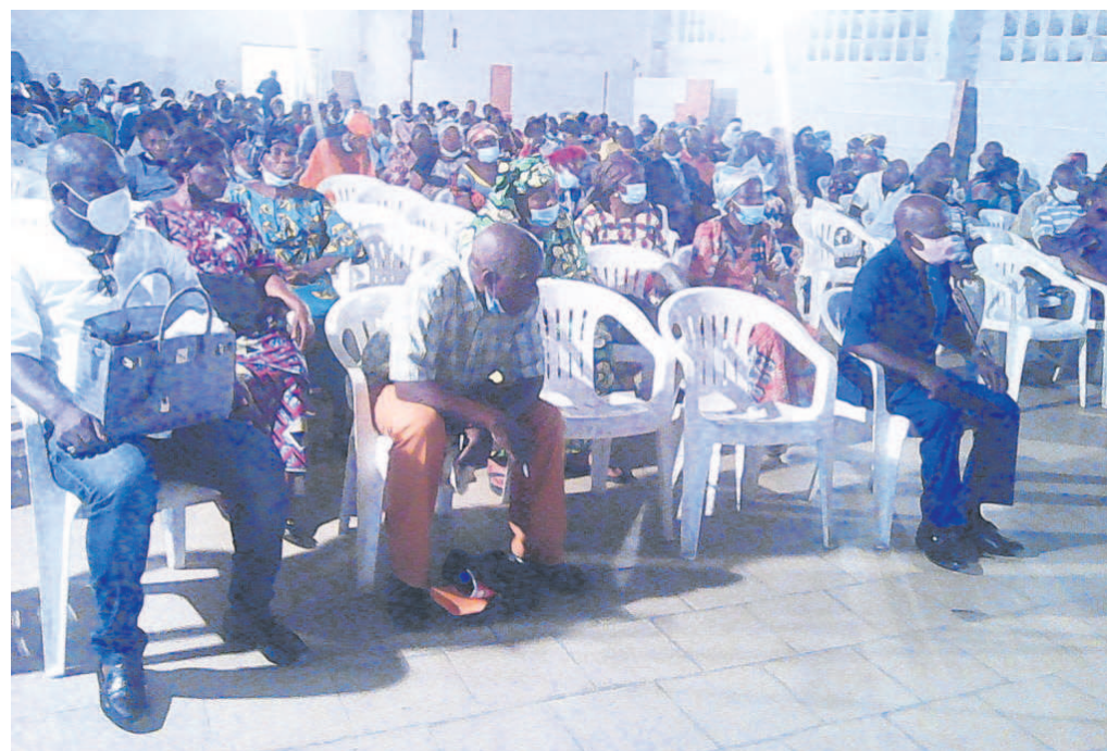
Vue des personnes du 3e âge dans la salle polyvalente de Poto-Poto Adiac