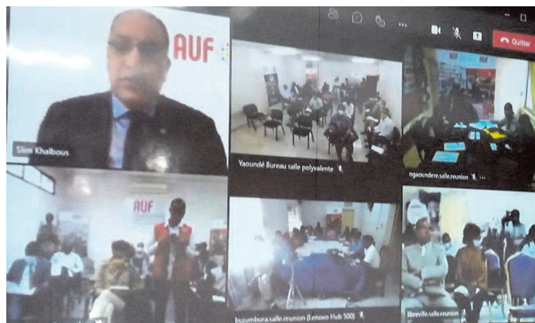
Le recteur de l'AUF en visioconférence (Adiac) et administrateurs », a-t-il déclaré.

Au cours de ces assises, explique-t-il, le livre blanc sera présenté aux participants afin d'être informés des résultats de l'enquête des consultations mondiales. Ces résultats montreront le diagnostic complet de la situation actuelle des agences. De même, ils exprimeront les décisions des besoins à venir.