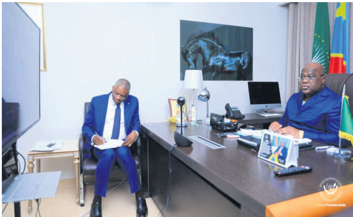
Une attitude du chef de l'Etat durant la visioconférence