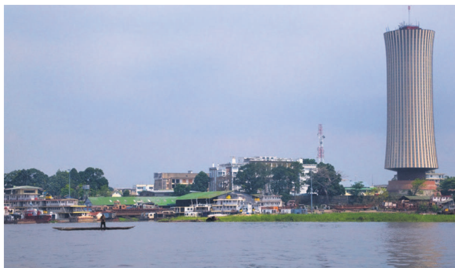
L'émission obligataire lancée par l'État congolais permettra de favoriser la croissance hors pétrole tout en œuvrant à la diversification économique du pays.

En outre, l'opération engagée d'apurement de la dette intérieure