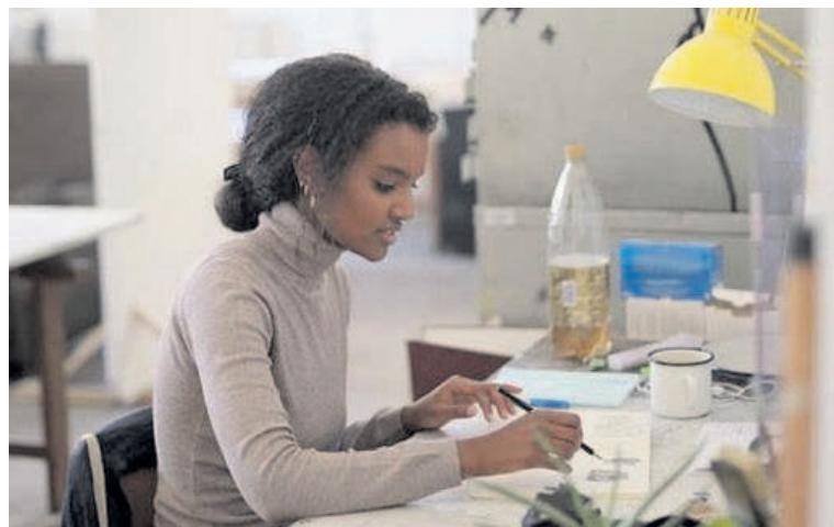
Une jeune femme en plein travail grâce à une bourse de résidence artistique

Dans le cadre de ce projet, l'association culturelle Dezentral attribuera cinq bourses de travail aux artistes, originaires d'Autriche et ceux d'ailleurs. Outre les subventions de logements, lieux de travail, équipements, chaque résident recevra une allocation supplémentaire pour mener à bien