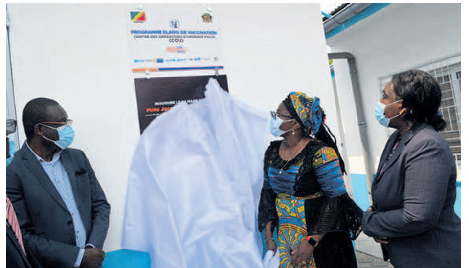
La ministre de la Santé lors de l'inauguration du centre Adiac

La ministre en charge de la Santé, Jacqueline Lydia Mikolo, a inauguré le 4 mars les nouveaux locaux du Programme élargi de vaccination (PEV) avant de le doter d'ordinateurs et d'autres équipements.