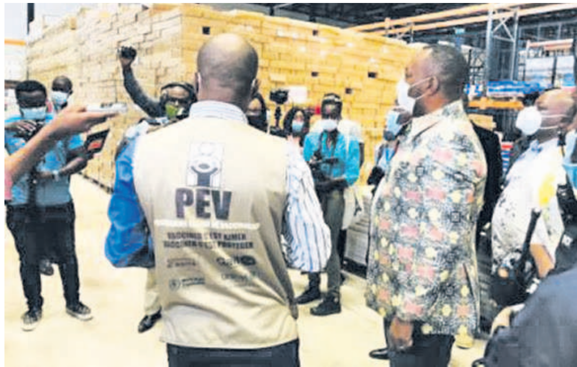
Visite de l'entrepôt de kinkole où sont stockés les vaccins anti-covid

Lors de la cérémonie de présentation d'un million sept cent doses de vaccin contre la pandémie, le 3 mars, à l'entrepôt du Programme élargi de vaccination (PEV) situé à Kinkole dans la commune de la Nsele, le ministre de la Santé, le Dr Eteni Longondo a annoncé le démarrage, la semaine prochaine, de la campagne de vaccination contre la Covid-19.