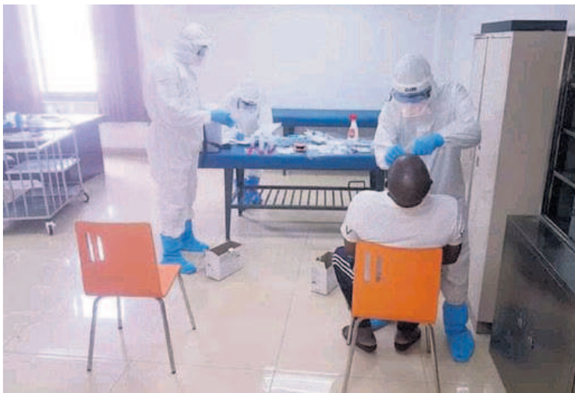
Prise en charge des cas Covid-19 à Kintélé

qui se charge des questions de la vaccination indiquent que la mise en œuvre de ces différentes offres permettrait de vacciner 1.757.274 personnes, soit 30,39% de la population totale. Il resterait à couvrir 1.711.632 autres personnes pour atteindre l'objectif d'une couverture vaccinale de 60% du total de la population congolaise. La coordination nationale a examiné les différents schémas techniques et financiers qui permettront d'atteindre cet objectif.