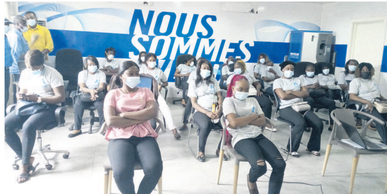
Les travailleuses d'Averda échangeant sur « l'émancipation professionnelle »

Lors d'une rencontre relative à la célébration de la Journée internationale du 8 mars, les femmes d'Averda, entreprise spécialisée dans la gestion des déchets, ont échangé sur leur apport dans le combat de l'émancipation professionnelle.