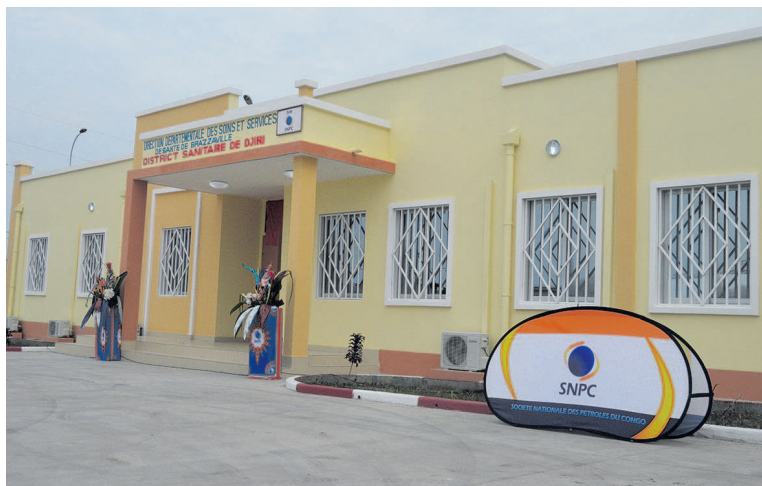
Le centre de santé intégré de Kombo Matari rénové et équipé

Le Centre de santé intégré de Kombo Matari, dans le 9e arrondissement Djiri, composé de deux modules et douze pièces, s'étend sur une superficie de 1.183,44 m 2 . « L'unité fonctionnelle de la vaccination, les salles de surveillance nutritionnelle, de consultation prénatale, le laboratoire de prélèvement et d'analyse », font partie des compartiments réhabilités et équipés, selon le secrétaire général de la Fondation SNPC, Marie-Joseph Letembet, qui a fait la présentation technique de l'ouvrage. En dehors de ces compartiments sanitaires, il y a des ouvrages d'appui comme le forage avec une réserve d'eau de plus de 9m 3 , l'incinérateur, le groupe électrogène, etc. L'administrateur-maire de