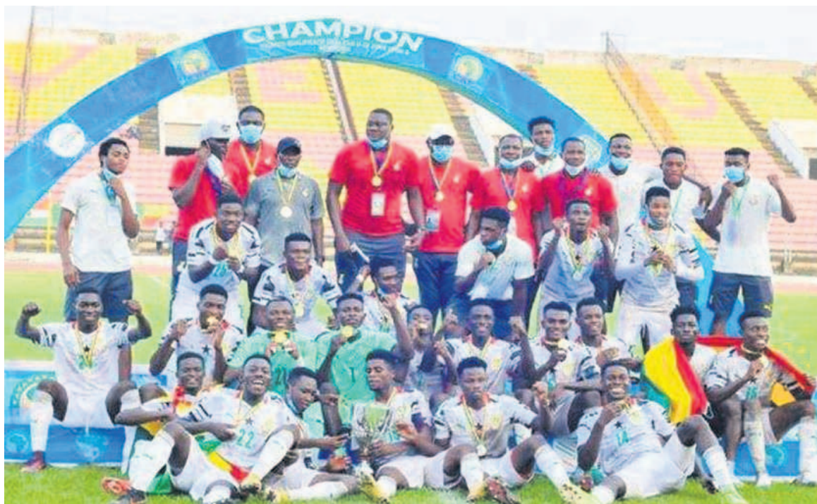
Le Ghana champion d'Afrique

na rejoint ainsi l'Egypte comme la deuxième nation la plus titrée dans la compétition derrière l'invincible Nigeria et ses 7 sacres. De son côté, l'Ouganda aura montré de belles choses pour sa première participation et