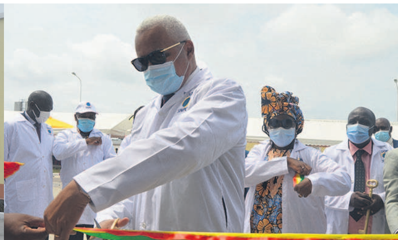
La coupure du ruban symbolique par le ministre Jean-Marc Thystère Tchicaya

Dans le sixième arrondissement, un autre Centre de santé a été rénové, équipé et remis officiellement. La particularité au niveau de Talangai est que le complexe sanitaire est composé d'un centre de santé intégré et d'un hôpital pédiatrique. Là, un bâtiment principal de 356,26 m 2 de 18 pièces a été remis aux normes y