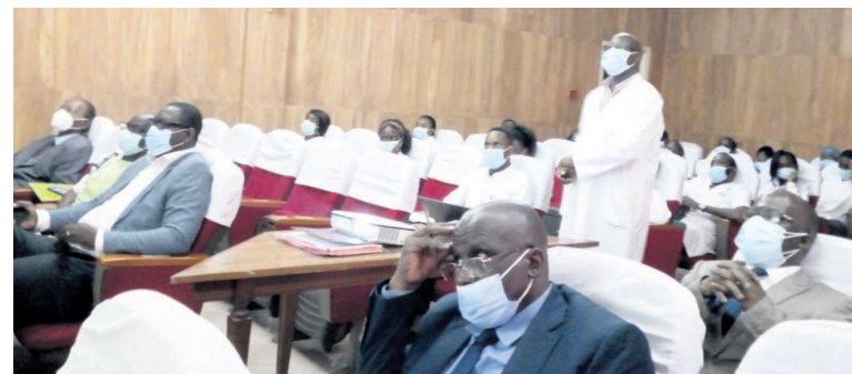
Les participants à la rencontre

Une équipe du service de neurochirurgie du CHU de Yopougon à Abidjan en Côte-d'Ivoire, conduite par le Pr Landry Drogba, en séjour en terre congolaise, a échangé le 5 mars avec ses homologues du Centre hospitalier et universitaire de Brazzaville (CHU-B) sur les avantages de la neuroendoscopie.