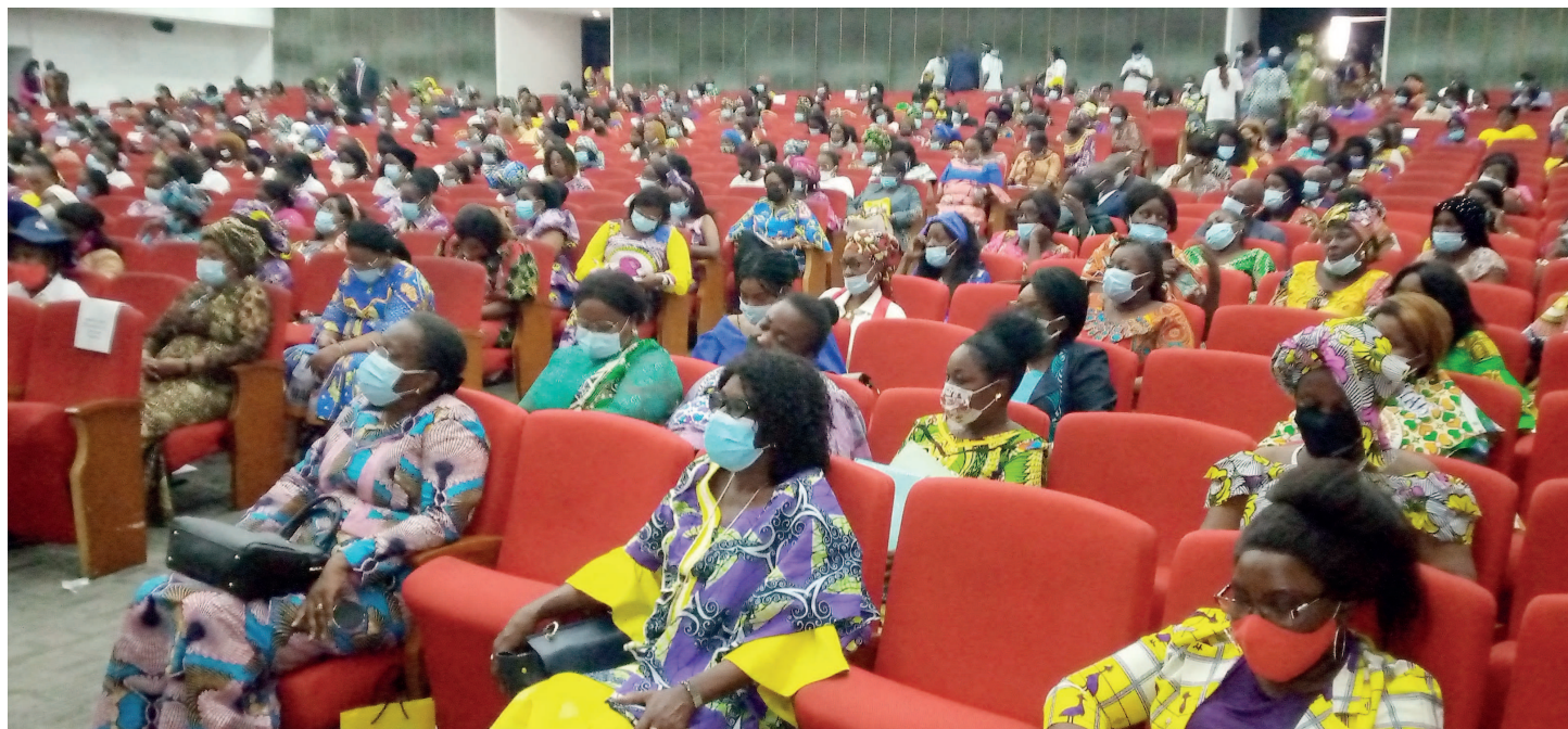
Les femmes congolaises célébrant la Journée du 8 mars à Brazzaville