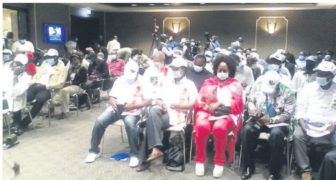
Vue de l'auditoire à la conférence de presse

S'agissant du rôle des Congolais dans le développement du pays, notamment dans la lutte contre les antivaleurs, le candidat a souligné que pour aller au développement, il faut l'homme qui