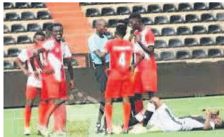
Un match du championnat de la Ligue nationale de football - Ligue 1 à Lubumbashi/DR

Le CS Don Bosco est venu à bout du Racing Club de Kinshasa (RCK), le dimanche 7 mars au stade Mazembe de la commune de Kamalondo à Lubumbashi, pour le compte de la 18e journée du championnat de la Ligue nationale de football (Linafoot)/Ligue 1.