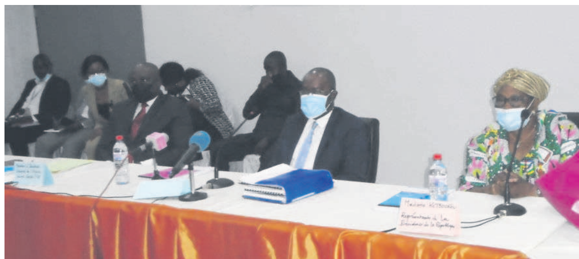
Le présidium des travaux lors de la 3 e session du comité de direction de l'hôpital général Adolphe-Sicé/Adiac

Après plusieurs heures d'échanges et de débats, les recommandations suivantes ont été prises : Faire un plaidoyer pour l'augmentation du budget alloué à l'hôpital général Adolphe-Sicé auprès des ministères chargés de la Santé et des Finances, implémenter la stratégie de la pharmacie hospitalière au niveau du pôle mère et enfant (pédiatrie, néonatalogie et maternité), renforcer la stratégie de la référence et contre-référence en collaboration avec la direction départementale des soins et services de santé de Pointe-Noire, inventorier le patrimoine, infrastructurel de l'hôpital général Adolphe-Sicé avec le concours du cabinet comptable Exco Cacoges, la direction départementale des bâtiments et logements administratifs, consolider la dette commerciale en vue de