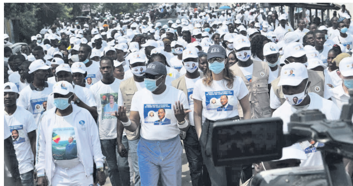
Après la marche sportive des partisans, un méga meeting au stade Saint-Denis/Adiac

La direction de campagne du candidat à l'élection présidentielle du 21 mars, Denis Sassou N'Guesso, dans la première circonscription électorale de Ouenzé a officiellement lancé sa campagne électorale, le 7 mars, par une marche sportive et un méga meeting qui a regroupé plusieurs partisans au stade Saint-Denis.