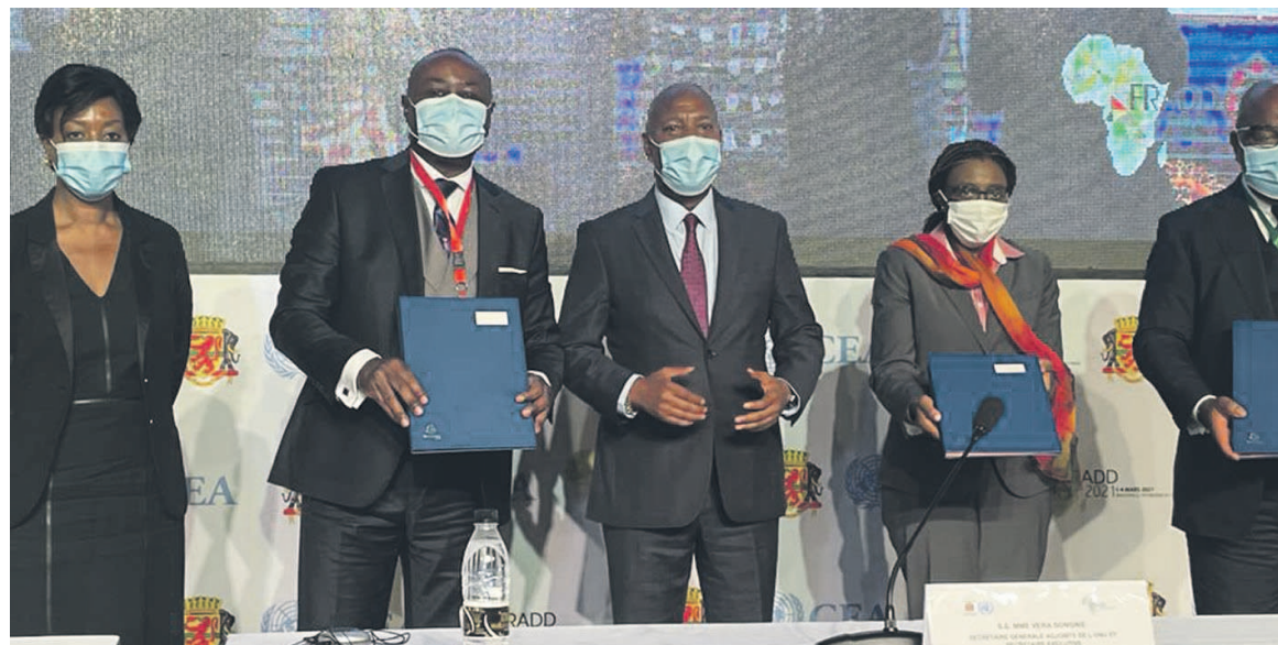
Le présidium des travaux

Le centre de recherche scientifique aura pour mission d'améliorer le paysage actuel de la recherche sur l'IA au Congo et en Afrique de façon générale ; d'explorer le potentiel de l'IA et les impacts macroéconomiques, les effets transformateurs sur les sociétés et les économies, en particulier dans les secteurs des banques, de la santé, de l'agriculture, des transports, et de l'environnement ; d'orienter l'utilisation de l'IA pour promouvoir le développement économique et social du continent.