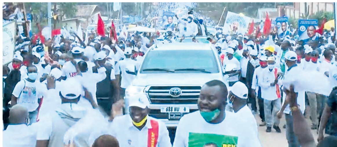
L'arrivée du candidat, Denis Sassou N'Guesso à Dolisie.

Il est vrai que Denis Sassou N'Guesso a fréquenté le collège de Mbounda à quelques pas du chef-lieu du Niari dans les années cinquante et le souvenir de ce passage semble se perpétuer entre lui et la population du Niari. « Je suis un mwana Doll »,