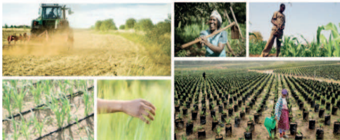
Africa Agri Forum au coeur du développement de l'agriculture

Le rendez-vous des experts du secteur agricole et agro-industriel d'Afrique centrale et du Maroc se tiendra du 5 au 6 avril prochain à Yaoundé, au Cameroun, sur le thème : « L'Afrique centrale face aux grands défis agricoles ». Il permettra aux