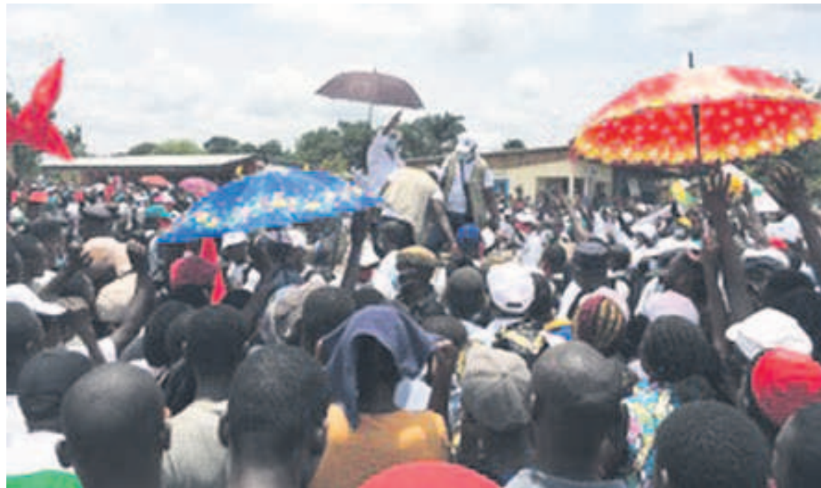
Denis Sassou N'Guesso prend le bain de foule après son meeting de campagne à Madingou le 9 mars

Les représentants des jeunes, des femmes, et des personnes vivant avec handicap ont aussi salué chacun à son tour les réformes introduites dans le pays au profit de leurs droits spécifiques. Pour toutes ces raisons ils ont déclaré choisir pour 2021 Denis Sassou