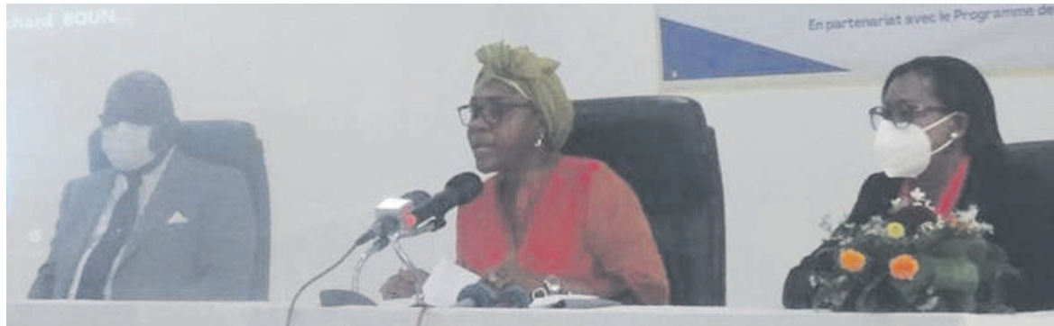
Les officiels à la présentation du RNDH-2020

Le récent Rapport national sur le développement humain (RNDH-2020) fustige l'inadéquation entre la formation et l'emploi en République du Congo. Les auteurs de l'enquête ont plaidé, à cet effet, en faveur d'une concertation entre les acteurs du monde du travail et les institutions de formation.