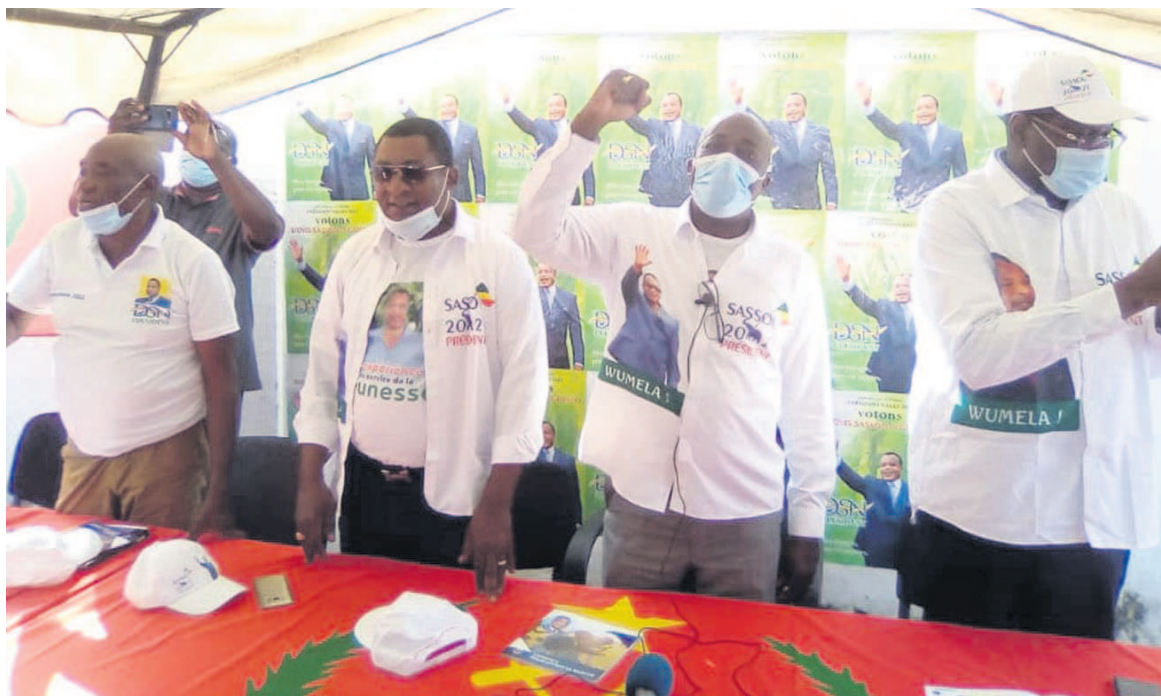
La direction locale de campagne du candidat Denis Sassou N'Guesso à Poto-Poto

Il a rappelé aux femmes qu'elles doivent exhorter les hommes à s'approprier l'évidence de la parité avant de les inviter à répondre présentes et à voter le candidat Denis Sassou N'Guesso le 21 mars prochain.