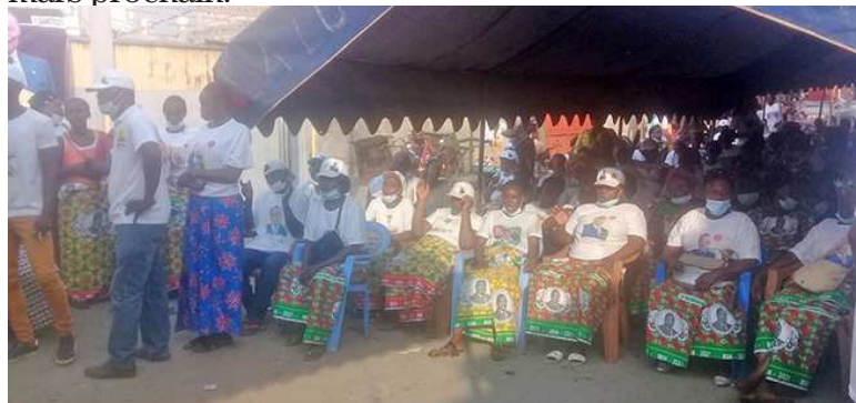
Les femmes des quartiers 603 et 606 Texaco

Lors d'une rencontre citoyenne organisée le 8 mars à l'occasion de la Journée internationale de la femme, les femmes de la 3e circonscription électorale de Talangai 3 se sont engagées à accorder leurs suffrages au candidat de la majorité présidentielle, Denis Sassou N'Guesso, le 21 mars prochain.