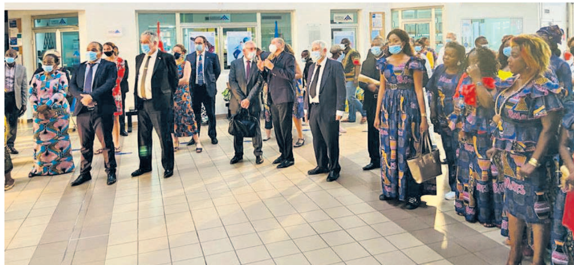
Une vue du public assistant au vernissage des expositions Adiac

Le hall de l'espace culturel, quant à lui, s'est vu meublé par trois expositions et une installation. Parmi celles-ci, on peut