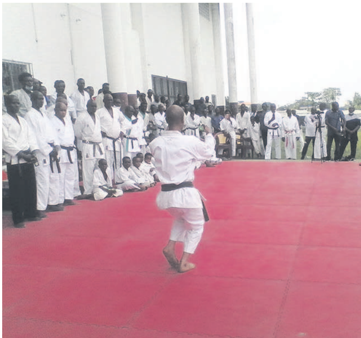
Séance de démonstration lors du lancement des activités de karaté

Un mois après l'ouverture de la saison sportive, la ligue départementale de karaté de Pointe-Noire a lancé ses activités le 7 mars au complexe sportif de la capitale économique.