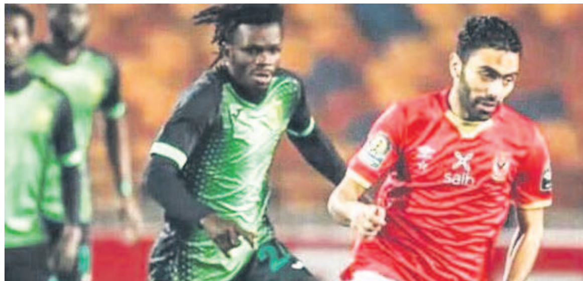
Il n'y a pas eu de vainqueur entre Al Ahly et V.Club le 6 mars 2021 au Caire