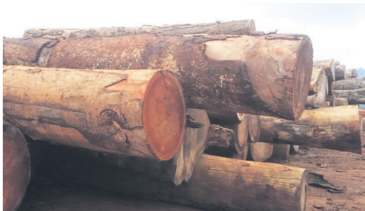
Des grumes sur un site à Souanké, Sangha

« La production des industries du papier, carton et édition, imprimerie, a chuté de 85,8% au deuxième trimestre 2020, en référence au premier trimestre 2020. Ce résultat découle principalement d'une détérioration de l'activité d'imprimerie et reproduction d'en-