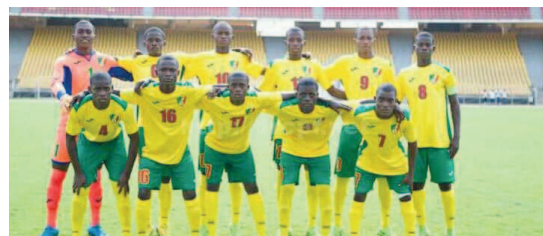
Les Diables rouges du Congo doivent attendre pour jouer à nouveau la CAN U17/Adiac