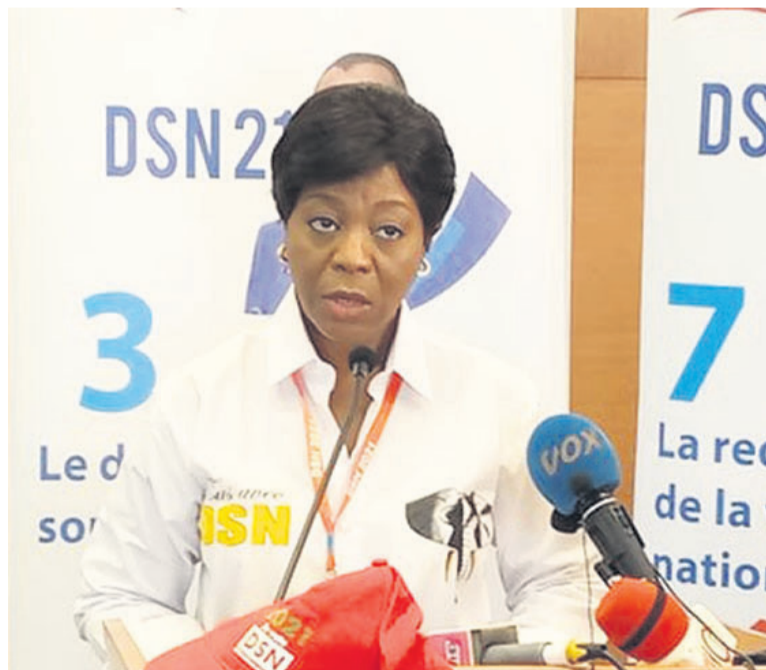
La porte-parole du candidat Denis Sassou-N'Guesso lors de la conférence de presse

S'agissant du cadre de vie qui n'est autre que l'assainissement, le reboisement, mais aussi le transport, le logement et l'accès aux soins mais aussi de sécurité,