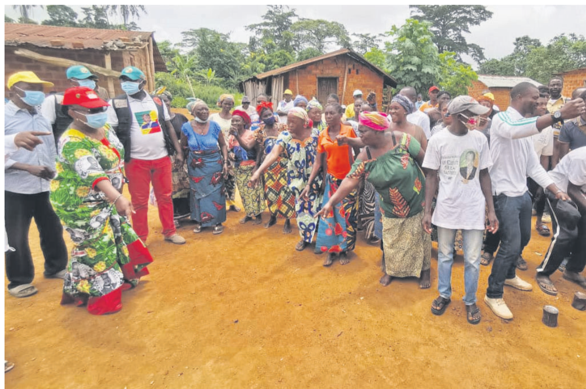
Jacqueline Lydia Mikolo et la population de Mouyondzi

« Le jour du vote n'oubliez pas l'emblème de l'éléphant du candidat à qui vous avez promis victoire dès le premier tour », a insisté la ministre Jacqueline Lydia Mikolo. Chefs de villages et population ont dit