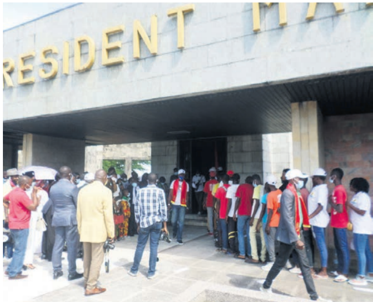
Les militants du PCT au mausolée Marien-Ngouabi

Dans la foulée de la campagne présidentielle, les membres du Parti congolais du travail (PCT) ont commémoré le 18 mars à Brazzaville le quarante quatrième anniversaire de la disparition du président Marien Ngouabi, fondateur du PCT.