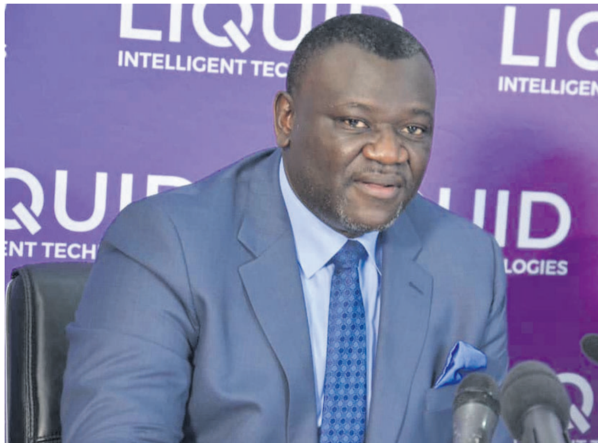
Le ministre Augustin Kibassa Maliba

Le ministre des PT-NTIC a, par ailleurs, rappelé que la RDC a une position géostratégique dominante au centre de l'Afrique. Cela fait d'elle, a-t-il précisé, un carrefour naturel des échanges entre les coins cardinaux du continent. Du fait de sa position, a-t-il poursuivi, « la RDC a pour vocation d'être l'un des plus grands transitaires des télécommunications et des données numé-