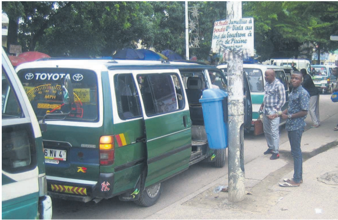
Un stationnement de bus

« Cependant, cette évolution est atténuée par la régression du chiffre d'affaires des services de transport aérien (-1,7%) au cours de la période sous revue. En variation annuelle, le chiffre d'affaires des services de transport et d'entreposage a baissé de 7,2% au quatrième trimestre 2020 », indique l'INS dans sa récente note de conjoncture nationale, ajoutant que le redressement du chiffre d'affaires dans cette activité laisse entrevoir une reprise dans les services