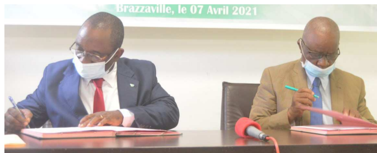
Signature de l'accord WCS Congo-Ministère de la Recherche