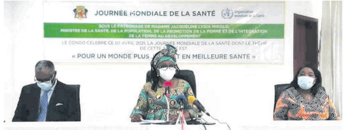
La ministre de la Santé et les partenaires

Renforcer les soins afin de les rapprocher de la population fait partie des thématiques développées lors de la deuxième édition de la Journée mondiale de la santé, célébrée le 7 avril au plan mondial sous le thème : « Pour un monde juste et en meilleure santé ».