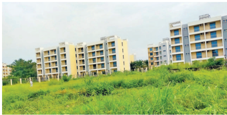
La façade de la cité

Construits sur le site détruit par les explosions de munitions le 4 mars 2012, les logements sociaux de Mpila, dans les 5 e et 6 e arrondissements de Brazzaville ( Ouenzé et Talangaï ) ne sont pas entretenus. Murs fissurés, peinture dégradée, insalubrité croissante, le site de ces logements qui ont changé le quartier de Mpila est aussi menacé par des érosions.