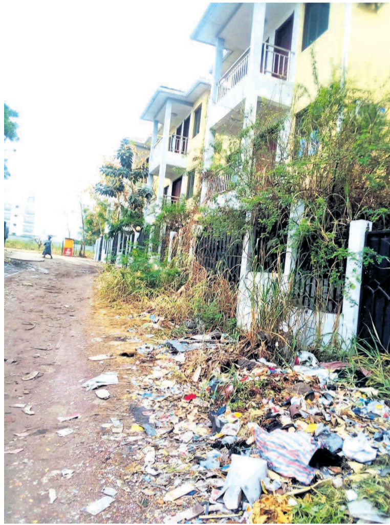
Une vue de l'arrière des bâtisses côté sud

Située entre les arrondissements 5 Ouenzé et 6 Talangaï, à Brazzaville et inscrite dans le cadre du projet de logements sociaux lancé en 2009 par le gouvernement congolais, la cité de Mpila est constituée de deux blocs qui comportent 22 bâtiments de 4 étages, chacun, offrant 200 logements de type F4, pour le premier et 48 bâtiments, dont 10 de type R+1, 26 bâtiments de type de R+2 et 12 bâtiments de type R+3, pour le deuxième, mais également des officines de commerce, des bâtiments réservés aux activités scolaires et socio-sanitaires, des installations électriques et d'adduction d'eau potable et bien