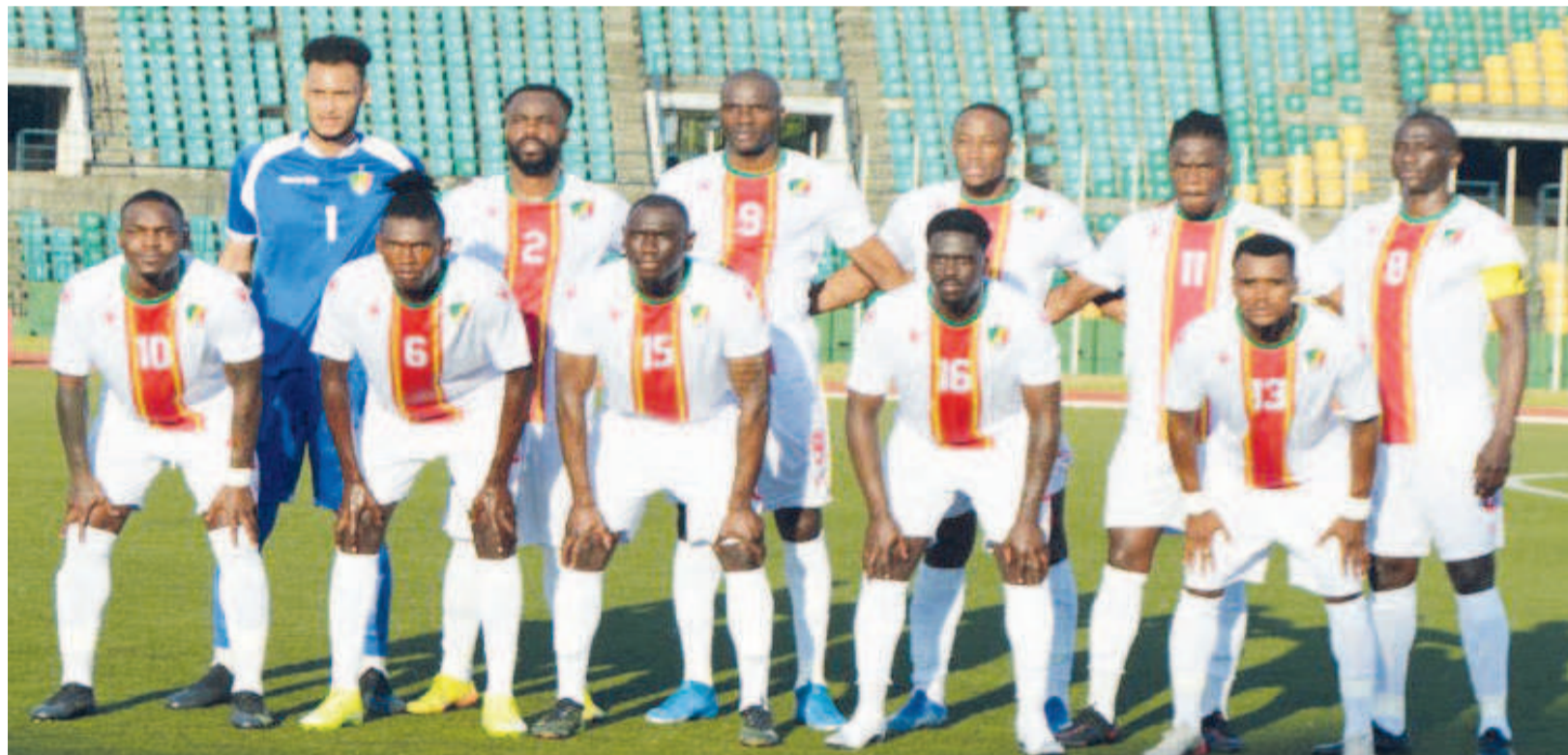
Les Diables rouges savent à quoi s'en tenir

Dans le cadre des éliminatoires de la Coupe du monde qui va se jouer au Qatar en 2022, les Diables rouges du Congo sont logés dans le groupe H avec le Sénégal, tête de série, le Togo et la Namibie, des adversaires que les Diables rouges connaissent bien. Les Congolais débute la campagne à Windhoek entre les 5 et 8 juin contre la Namibie. Les Diables rouges et les Brave Warriors se sont affrontés pour la dernière fois lors des préliminaires des éliminatoires de la CAN 2015. Le Congo s'était incliné à Windhoek 0-1 avant de prendre sa revanche à Pointe-Noire 3-0. Page 16