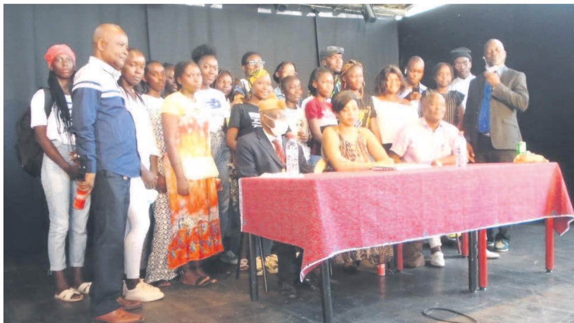
La photo de famille à l'IFC après la présentation