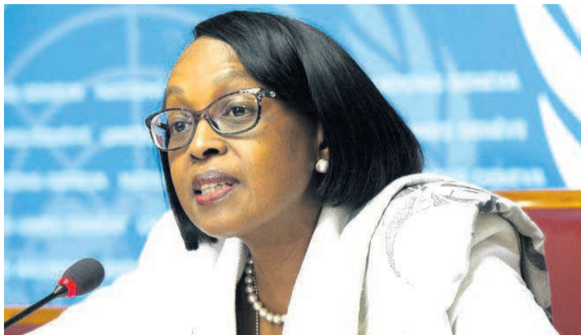
Dre Matshidiso Moeti, directrice régionale de l'OMS/Afrique

Les laboratoires invités à accroître la production en vaccin contre la covid-19 A l'occasion de la journée mondiale de la santé célébrée le 7 avril dans un contexte marqué par la pandémie de covid à travers le monde, la directrice régionale de l'OMS pour la zone Afrique, la Dre Matshidiso Moeti, invite les dirigeants à œuvrer, dans l'avenir, dans un esprit de solidarité internationale, pour mettre fin aux inégalités dans leurs propres pays comme sur l'ensemble du continent.