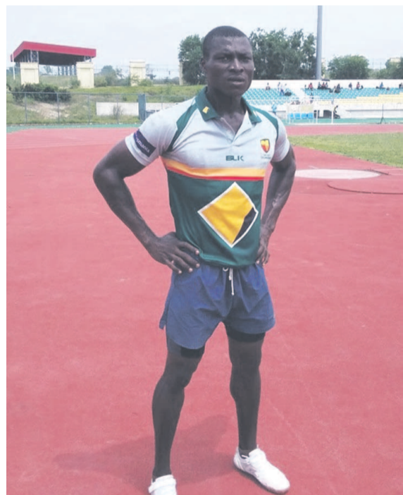
Un athlète après avoir participé au meeting Maxi

Dans le cadre du lancement, dans les prochains mois, des grandes compétitions nationales et internationales, la Fédération Congolaise d'athlétisme a organisé, au complexe sportif de Kintélé, le 3 avril dernier, le meeting Maxi perf, une compétition qui a permis aux athlètes de se mettre en jambe.