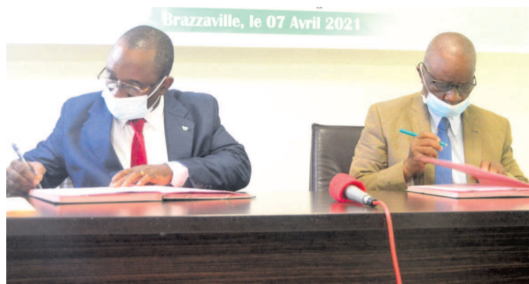
Signature de l'accord WCS Congo-Ministère de la Recherche