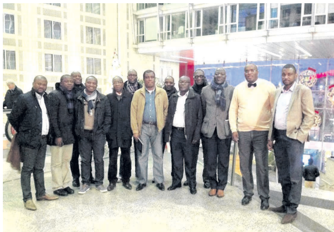
SDA à l'issue d'une séance de travail en présentiel à Paris avant la Covid-19

Les membres de Synergies et Développement de l'Afrique (SDA) saluent la réélection du chef de l'Etat sortant à l'issue du scrutin présidentiel du 21 mars dernier. Une victoire confirmée par la Cour constitutionnelle le 6 avril, avec 88,40%.