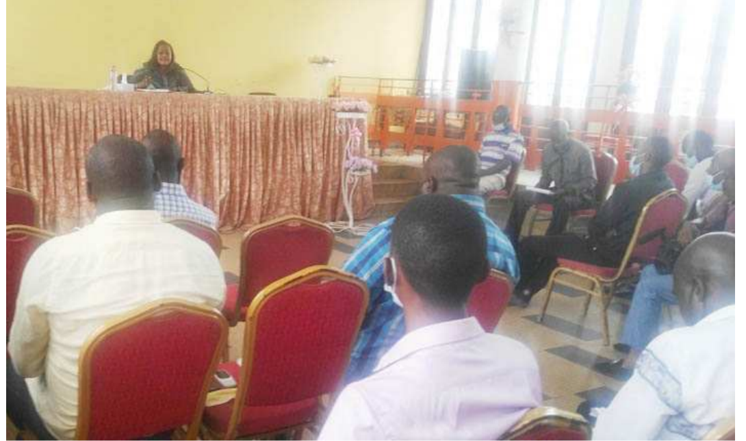
Une vue de la salle lors du point de presse

En vue de lutter contre la pandémie de co-