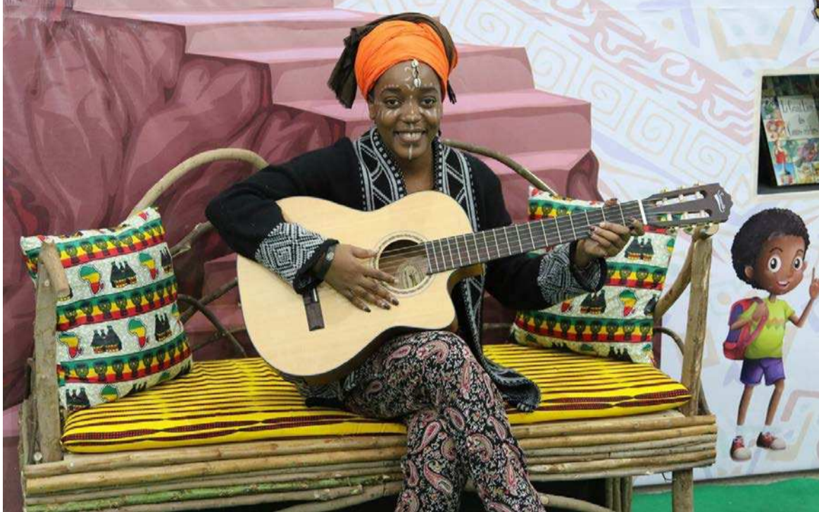
La musique, l'une des disciplines éligibles à la résidence de création à l'America museum 2021/DR

concernées par l'action humaine sur l'environnement, la biodiversité, les collections muséales.