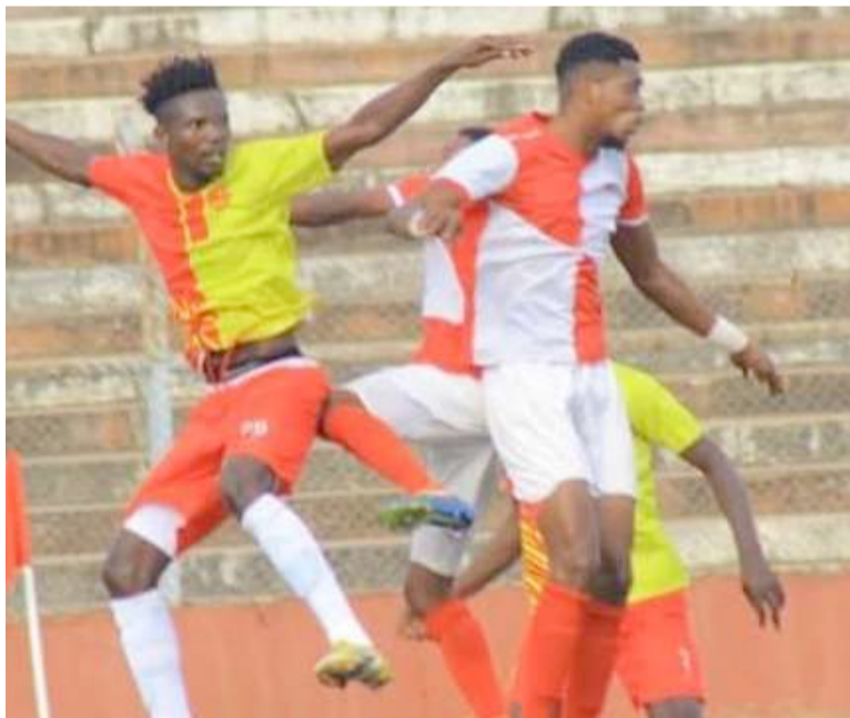
Lubumbashi Sport a surplombé Sanga Balende...