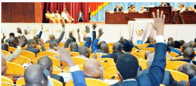
Les députés nationaux lors d'une plénière à la chambre basse

L'Association congolaise pour l'accès à la justice (Acaj) a dit constater sur la toile « une guerre