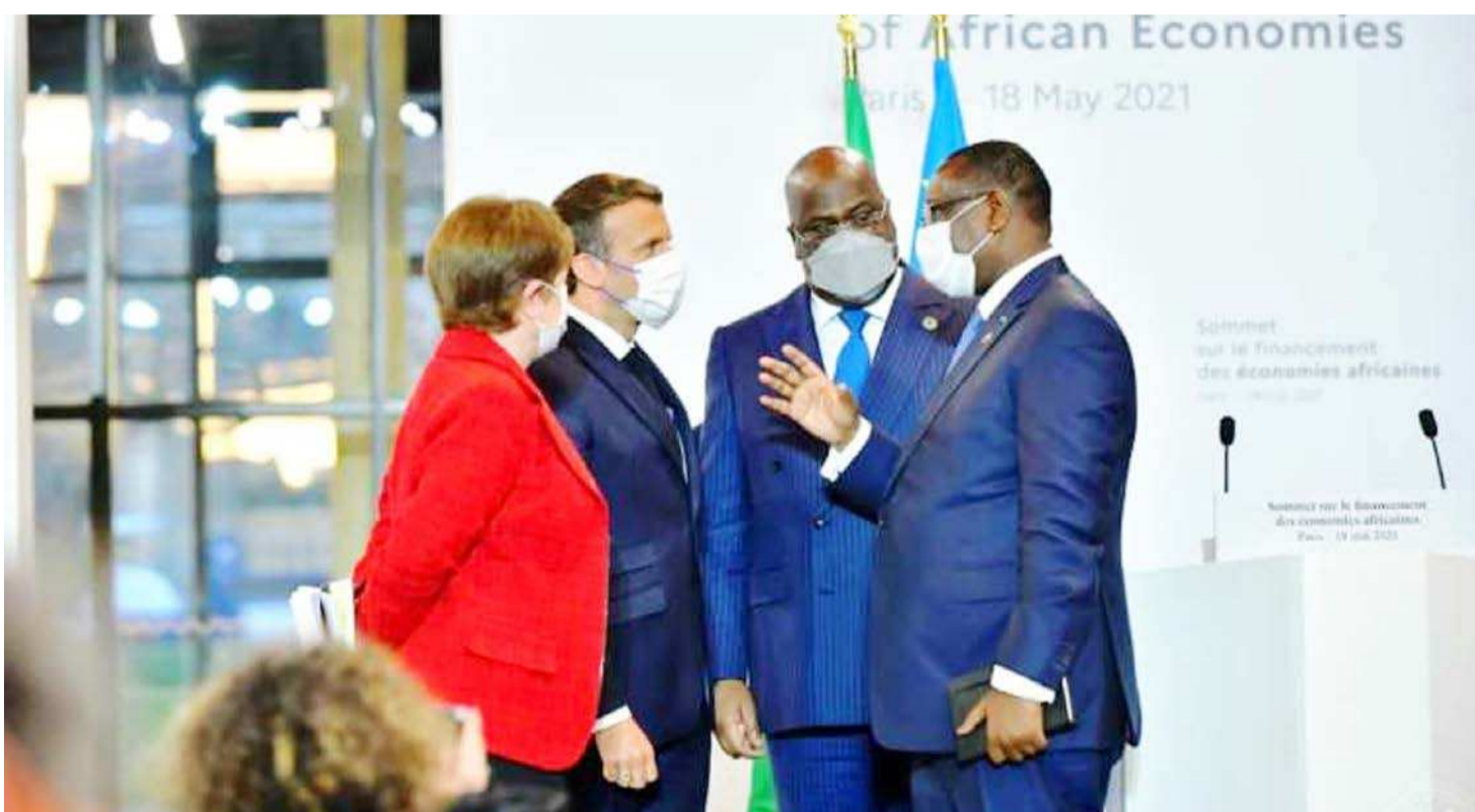
Le président Félix Tshisekedi à la session de clôture du sommet de Paris

L'annonce a été faite, le 18 mai, par le président Emmanuel Macron, initiateur de ce sommet, au cours de la conférence de presse de clôture qu'il a co-animée avec Félix-Antoine Tshisekedi et Macky Sall respectivement président en exercice et vice-président de l'Union africaine, ainsi qu'avec la directrice générale du FMI Georgeia.