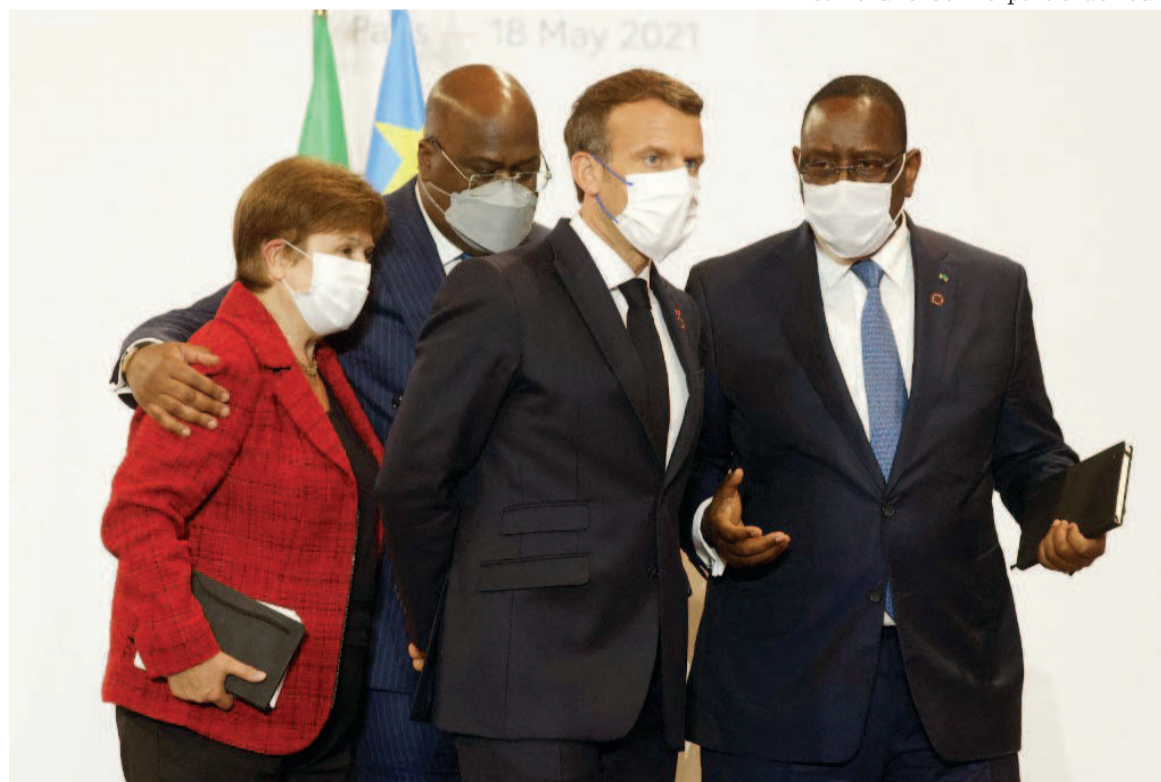
Kristalina Georgieva (FMI), Emmanuel Macron (France), Felix Tshisekedi (RDC) et Macky Sall (Sénégal)

Macky Sall, les campagnes de vaccination menées dans les pays industrialisés ne garantissent « absolument pas la sécurité sanitaire ». Le président de la RDC, Félix Tshisekedi, président en exercice de l'UA, a souligné que le grand enjeu est de convaincre les populations africaines. Il a mis en garde contre le risque de développement de variants extrêmement résistants, et l'inquiétude d'un « vaccin qui vient d'ailleurs », justifiant une production du vaccin en Afrique,