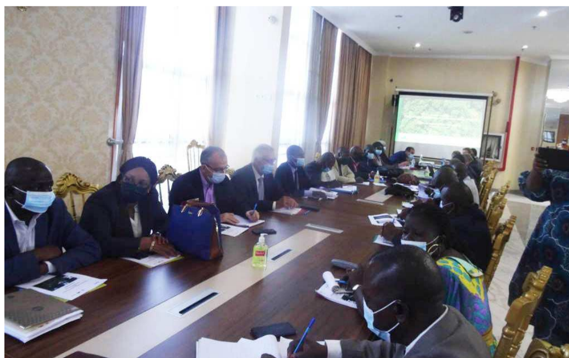
Les participants à l'atelier

Au cours de la rencontre élargie, ayant regroupé les représentants des treize ministères concernés par la question de l'aménagement du territoire, des acteurs du secteur privé, des organisations de la société civile, l'AFD et ses experts ont présenté les conclusions de leur travail de terrain, notamment