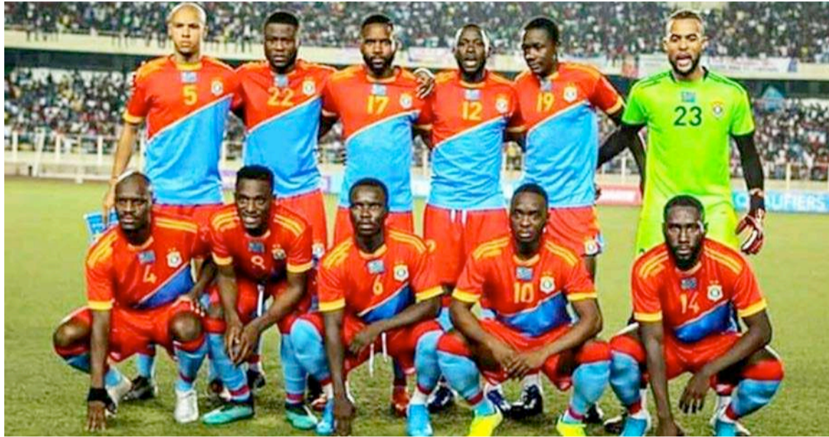
Les Léopards de la RDC

Les Léopards seront donc en stage de préparation de deux semaines dans la capitale tu-