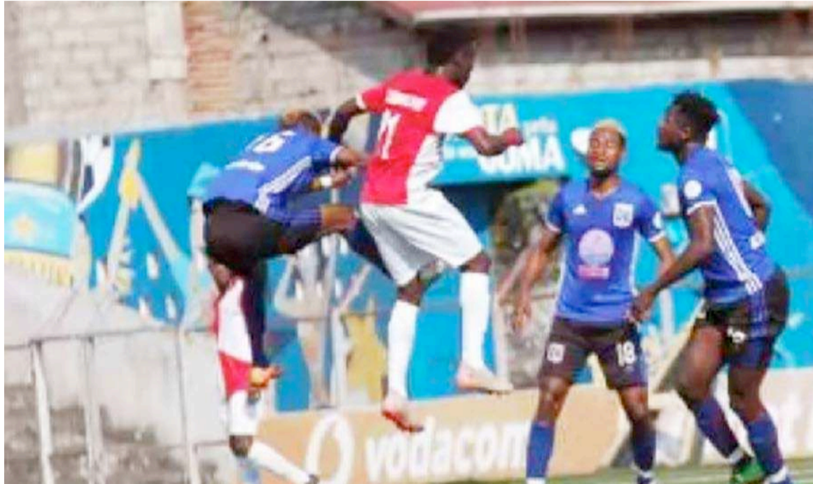
Vue du match entre Dauphin Noir et Lubumbashi Sport