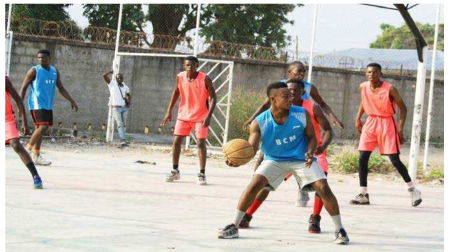
Les équipes de Brazzaville s'attendent à disputer plusieurs compétitions

Après le tournoi de relance pour préparer et mettre les athlètes en compétition, la Ligue de Brazzaville a lancé dans la foulée ses championnats départementaux. Elle a aussi prévu d'organiser la Super coupe, la Coupe de la ville et le tournoi interdépartemental. Ces compétitions s'inscrivent dans le but de qualifier les équipes pour les championnats nationaux et la Coupe du Congo puis faire les sélections départementales. La ligue n'a non plus oublié les tournois Ibaka games, Game time for women et Jamborees des minimes avec pour objectif de dé-