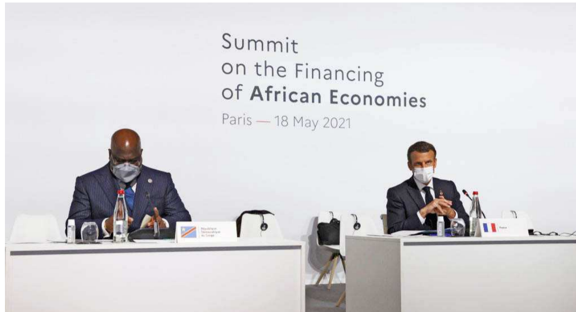
Felix Tshisekedi, président en exercice de l'UA et Emmanuel Macron lors du sommet sur le Financement des économies africaines à Paris ce 18 mai

Citant le Fonds monétaire international (FMI), Bruno Le Maire a rappelé que les pays développés avaient consacré 25% de leur richesse nationale à relancer leur économie, alors que ce chiffre est d'à peine 2% en Afrique. « Donc le risque majeur, ce-