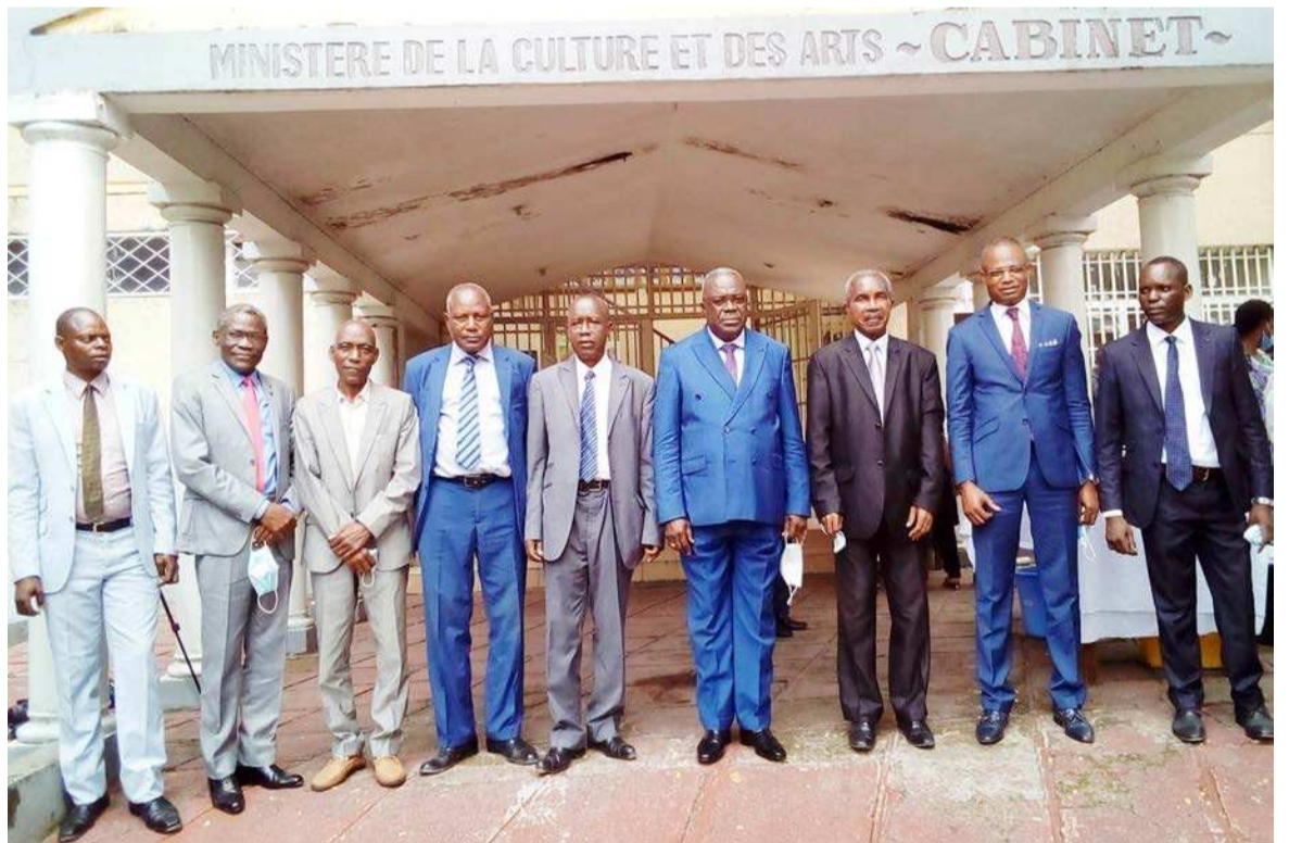
Le ministre de la Culture et des Arts posant avec les membres du Comité scientifique

le président du Comité scientifique de la rumba Congo-Brazzaville pense qu'il y a encore un certain nombre des choses à faire avant cette inscription définitive. La première des choses, dit-il, c'est la visibilité d'un certain nombre d'activités qu'ils vont mener d'ici-là. Pour ce faire, la toute première activité c'est le Colloque international qu'ils entendent organiser d'ici un mois sur la rumba congolaise. Ce colloque va se faire avec leurs collègues de la RDC. Ces derniers avaient déjà organisé l'année dernière un colloque à caractère technique qui avait pour objectif de dégager tous les éléments qui étaient nécessaires pour l'inscription de la rumba sur la liste de l'Unesco. Ceci à la différence du colloque qui sera organisé bientôt à Brazzaville et qui portera plus sur les données historiques, les fondements de la rumba, les problèmes d'extension de la rumba