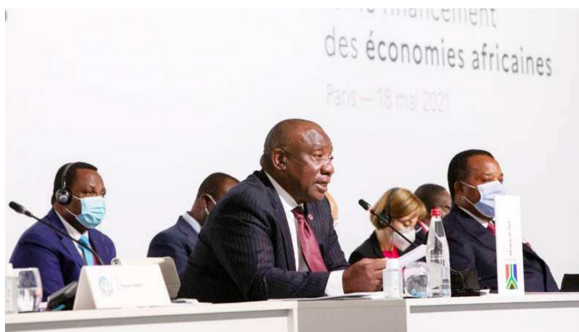
Vue partielle de la délégation congolaise conduite par le chef de l'Etat Denis Sassou N'Guesso au Sommet sur l'Afrique du 18 mai 2021 à Paris

Et de poursuivre : « On ne le dit pas assez : il ne pourra y avoir de réduction de la pauvreté sans création massive d'emplois, et cela, seul le secteur privé est en capacité de le faire. Or, il a été jusqu'à présent le grand oublié des plans de relance africains. Les entreprises ont fortement contribué à la résilience du continent. Elles doivent être appuyées et renforcées, et des dispositifs leur permettant de capter de nouveaux flux de financement doivent être imaginés. Cette question cruciale sera, bien entendu, à l'ordre du jour du Sommet de Paris.