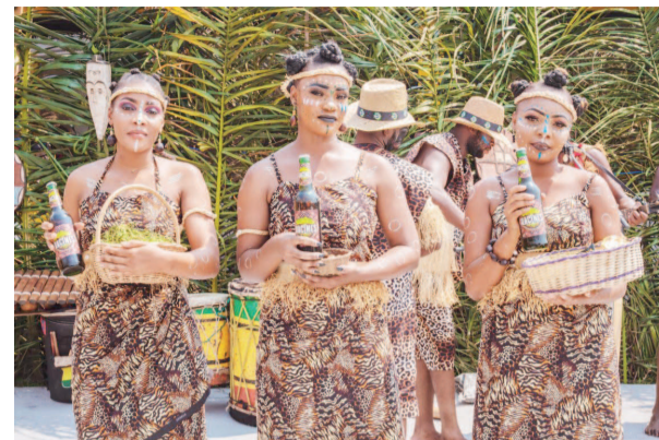
La boisson Racines présentée dans une ambiance africaine

Disponible en format 50 cl au prix de 500 FCFA la bouteille, Racines est présentée sur un design très coloré, fruit du travail et de la compétence des équipes techniques « Avec mes équipes techniques et avec les experts du Groupe Castel, un des grands développeurs des boissons gazeuses