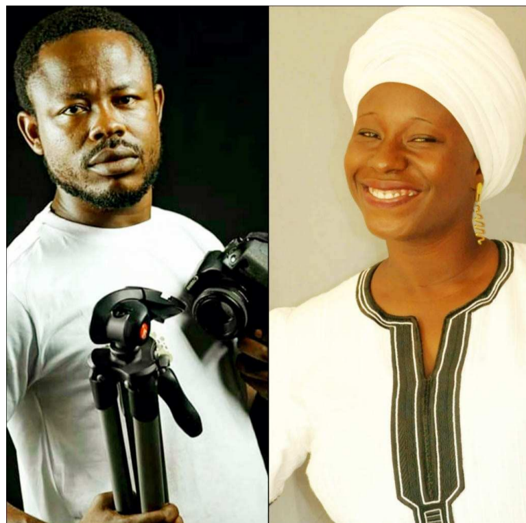
Le photographe congolais et la poétesse burkinabé retenus pour la résidence de création francophone 2021

dence, entre septembre et octobre, les organisateurs prendront en charge le maquettage et l'impression du fanzine résumant la résidence