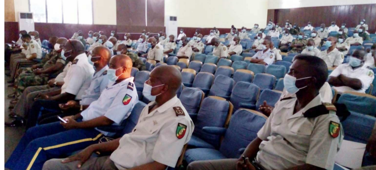
Les participants au séminaire

Les séminaristes ont par ailleurs été sensibilisés aux instructions particulières du chef d'état-major des FAC sur la mise en œuvre du plan d'ac-