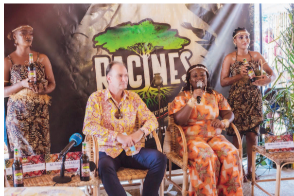
Le Dg de Bralico et la marketing manager présentant la boisson Racines

C'est dans une ambiance ancestrale bon enfant, une ambiance de fête à l'africaine qu'a été présentée la boisson Racines, nouveau produit de Bralico. Entre la musique, les envolées lyriques du griot et des danseurs parés en tenues traditionnelles, la boisson Racines a été présentée au public vêtu pour la circonstance en tenue traditionnelle et en pagne, signe annonciateur d'un événement exceptionnel dans un décor pittoresque, symbole de l'Afrique et ses multiples attraits multicolores. La boisson Racines, boisson du Congo et de l'Afrique est arrivée sous