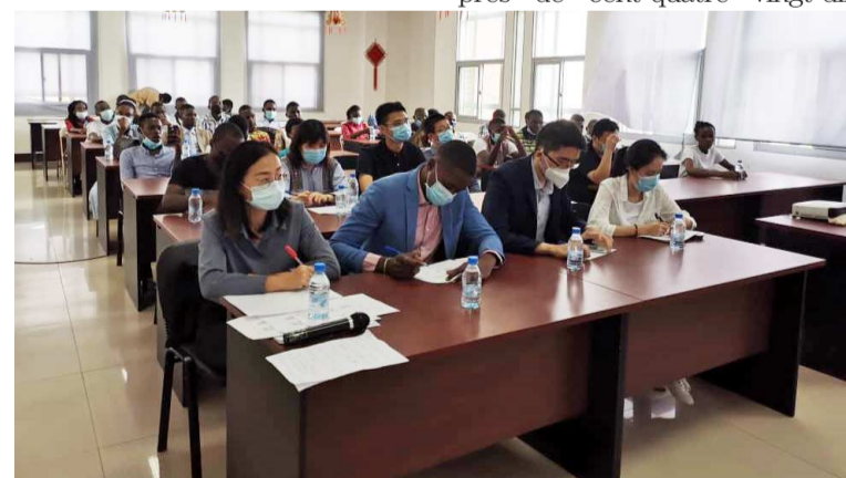
le jury et les candidats pendant la compétition