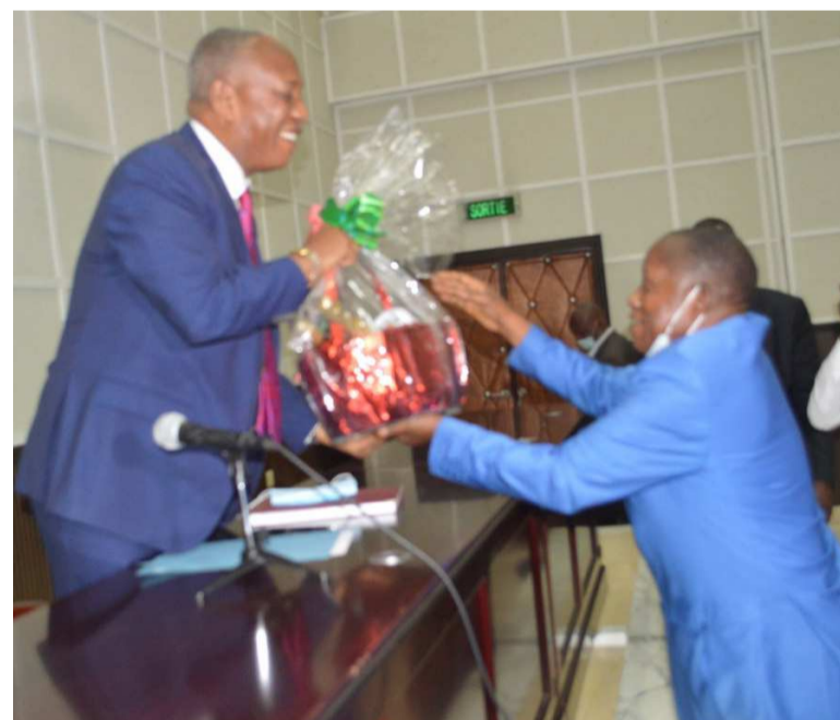
Le ministre d'Etat recevant un don en signe de soutien des syndicats

« Il y a des défis à relever. Nous devons travailler ensemble pour ouvrir les