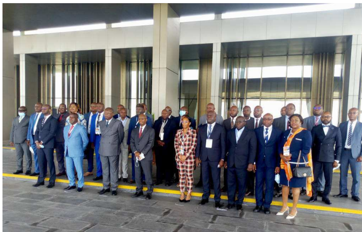
Des participants à la 9e réunion de l'Appo

En dépit de la crise mondiale, caractérisée par la pandémie de covid-19, le marché pétrolier affiche de bonnes perspectives sur les prix des bruts (65,80 dollars par baril) pour le Brent et (62, 62 dollars pour le WTI).