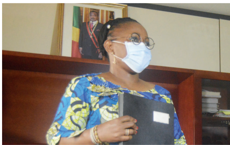
La ministre Jacqueline Lydia Mikolo

Développer les mécanismes d'appui financier aux Petites et moyennes entreprises (PME), pour un meilleur accès aux crédits, fait partie des axes de travail déclinés par la nouvelle ministre Jacqueline Lydia Mikolo.