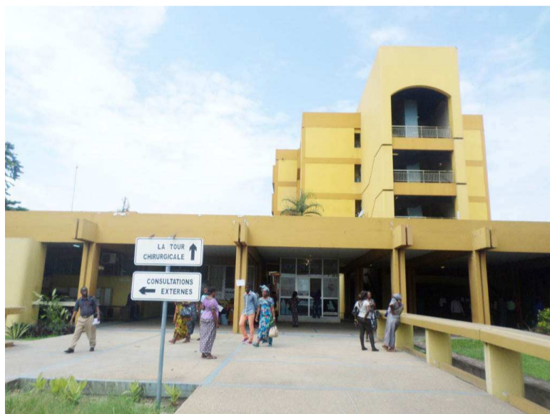
Une vue du CHU de Brazzaville

La grève qui avait été entamée le 10 mai au Centre hospitalier et universitaire de Brazzaville (CHUB) a été suspendue par l'intersyndicale, à l'issue de l'assemblée générale tenue le 27 du même mois à Brazzaville. Cette suspension va durer quinze jours en attendant l'ouverture des négociations avec le ministère de la Santé et de la Population.