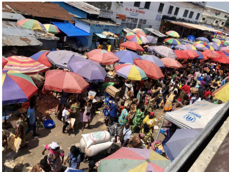
L'ambiance dans un marché Adiac

Débuté en mars 2020 avec déjà trois années d'atermoiement, le cinquième Recensement général de la population et de l'habitation (RGPH5) n'est toujours pas achevé. Cette enquête nationale est couplée avec la première opération de Recensement des entreprises du Congo (REGEC).